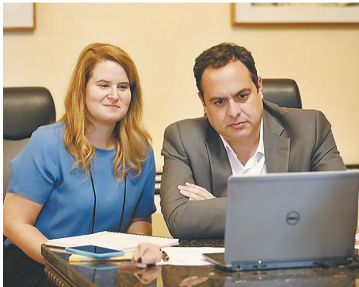
Ana Luiza e o governador Paulo Câmara participando de videoconferência no Palácio do Campo das Princesas

O Governo do Estado lança, na próxima semana, uma licitação para executar reforma da Pracinha de Boa Viagem, com nova iluminação, banheiros e piso na área das barracas de alimentação.