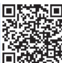
foto grife o QR code ao lado e acesse a página do site para fazer a sua assinatura do Diário

assinaturas: (81) 3320 2020 (capital) 0800 2818822 (interior)