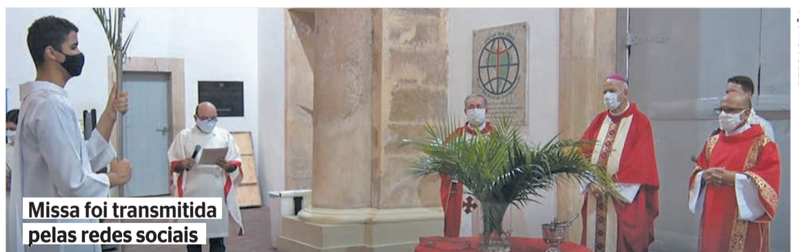
Missa foi transmitida pelas redes sociais

A Bíblia conta que, ao chegar em Jerusalém, Jesus foi saudado com ramos de palmeira e oliveira pelas pessoas que puderam apreciar a sua passagem. Por este motivo, o dia é chamado de Domingo de Ramos.