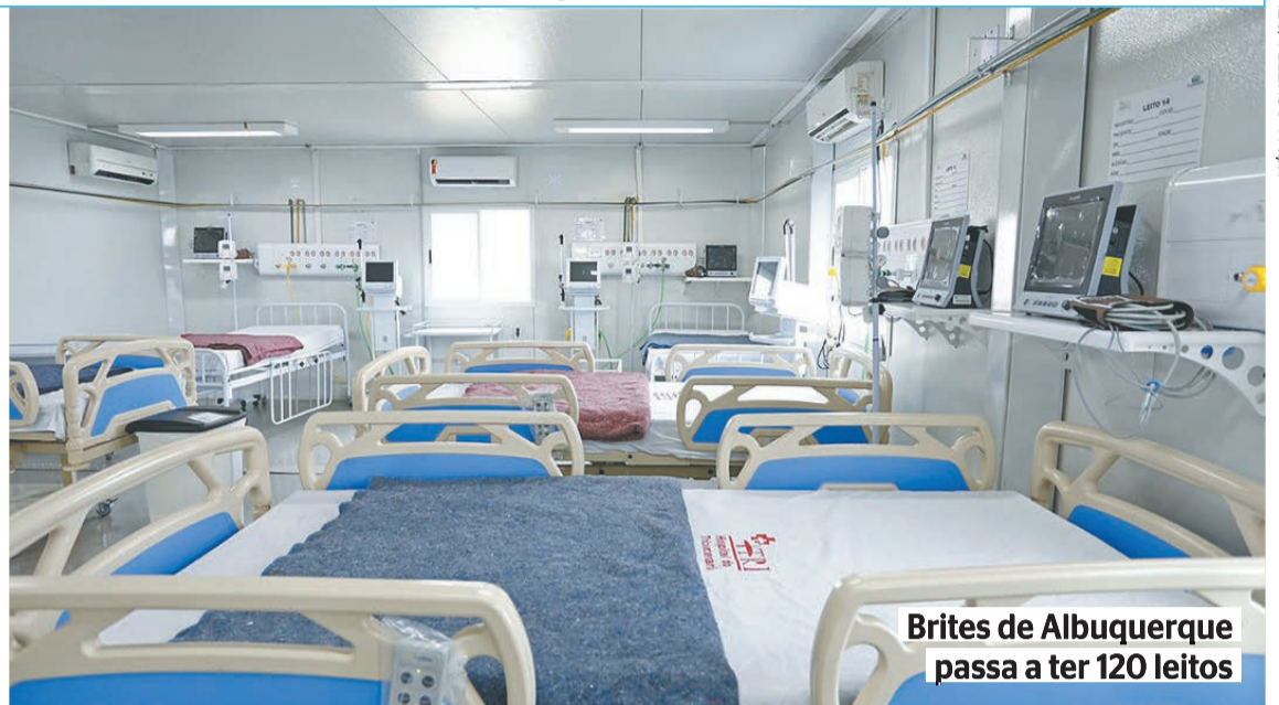
Brites de Albuquerque passa a ter 120 leitos