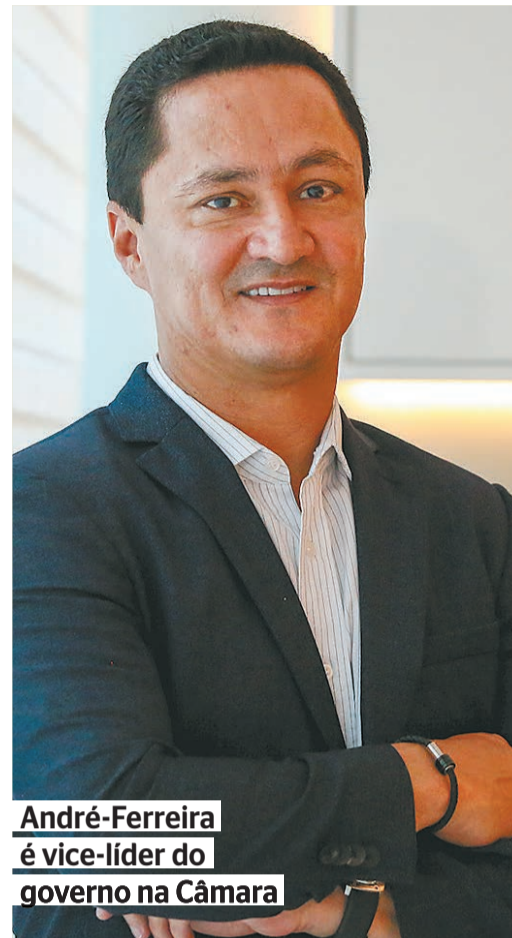
André-Ferreira é vice-líder do governo na Câmara