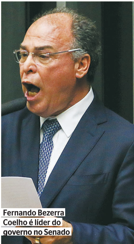
Fernando Bezerra Coelho é líder do governo no Senado