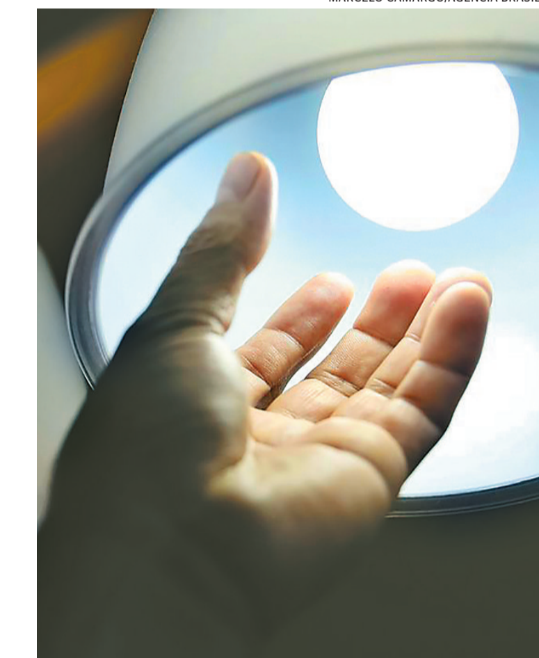
Desconto tarifário continua em vigor com a suspensão

Outra medida voltada para as famílias de baixa renda é a manutenção dos descontos tarifários, considerando a suspensão das ações de averiguação e de revisão cadastral do