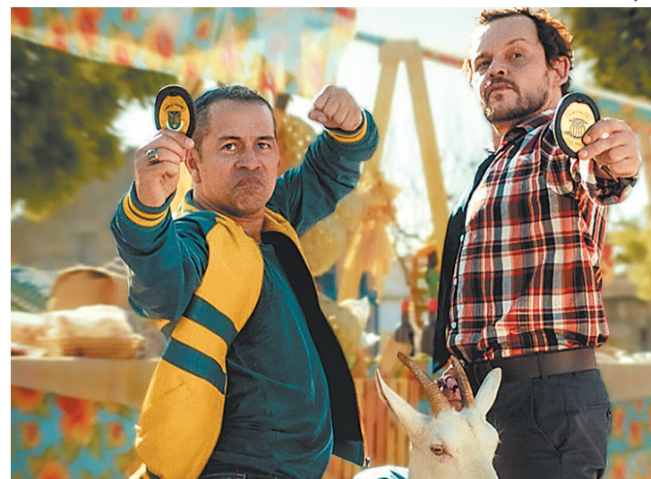
Comédia brasileira tem feito muito sucesso na Netflix

Na telinha, os dois se juntam a vários outros comediantes brasileiros, desde humoristas que fizeram sucesso nos bares cearenses até aqueles que ganharam espaço primeiramente na web, como a trupe do Porta dos Fundos e do Choque de Cultura. Cabras da peste tem no elen-