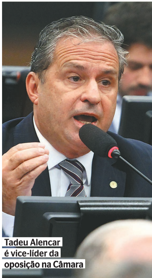
Tadeu Alencar é vice-líder da oposição na Câmara