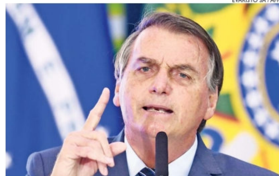
Bolsonaro alfinetou senadores de oposição e independentes

Sem citar senadores nominalmente, Bolsonaro investiu contra os opositores e independentes da CPI. "Não dá para ouvir tudo (da CPI), né? Primeiro que é uma xaropada, raramente tem um senador ali... Raramente não, têm senadores bem