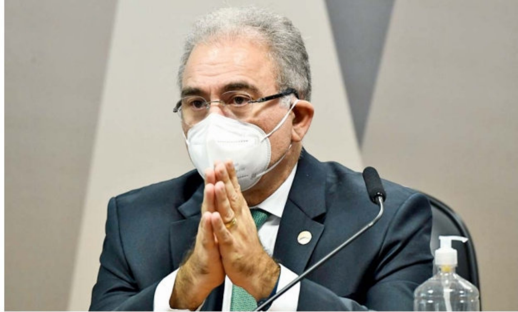
Marcelo Queiroga se recusou a avaliar postura do presidente em defesa da hidroxicloroquina