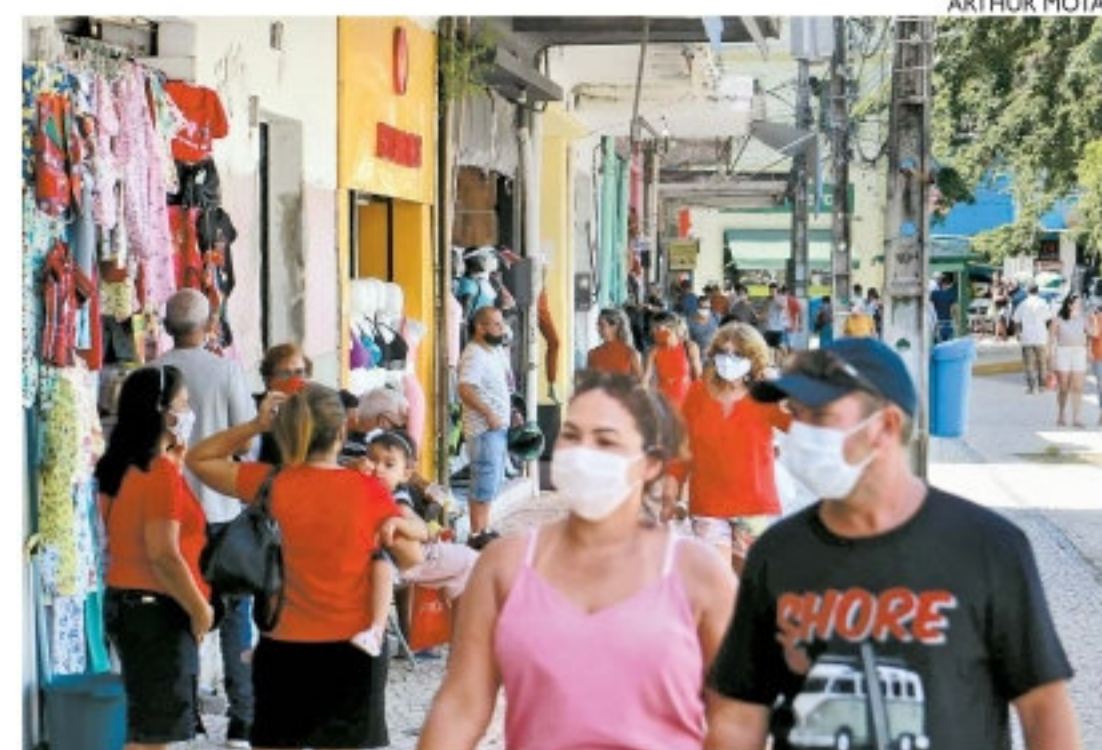
Setor varejista alega que IGP-M tem impacto muito elevado

Neste mês, o IGP-M desacelerou em relação a março e ficou em 1,51%, porém no acumulado de 12 meses continua em alta, registrando uma variação de 32%. É este índice anualizado que é usado para reajustar o valor da locação. O IPCA acumulado em 12 meses até março é bem menor e está em 6,1%, que é considerado