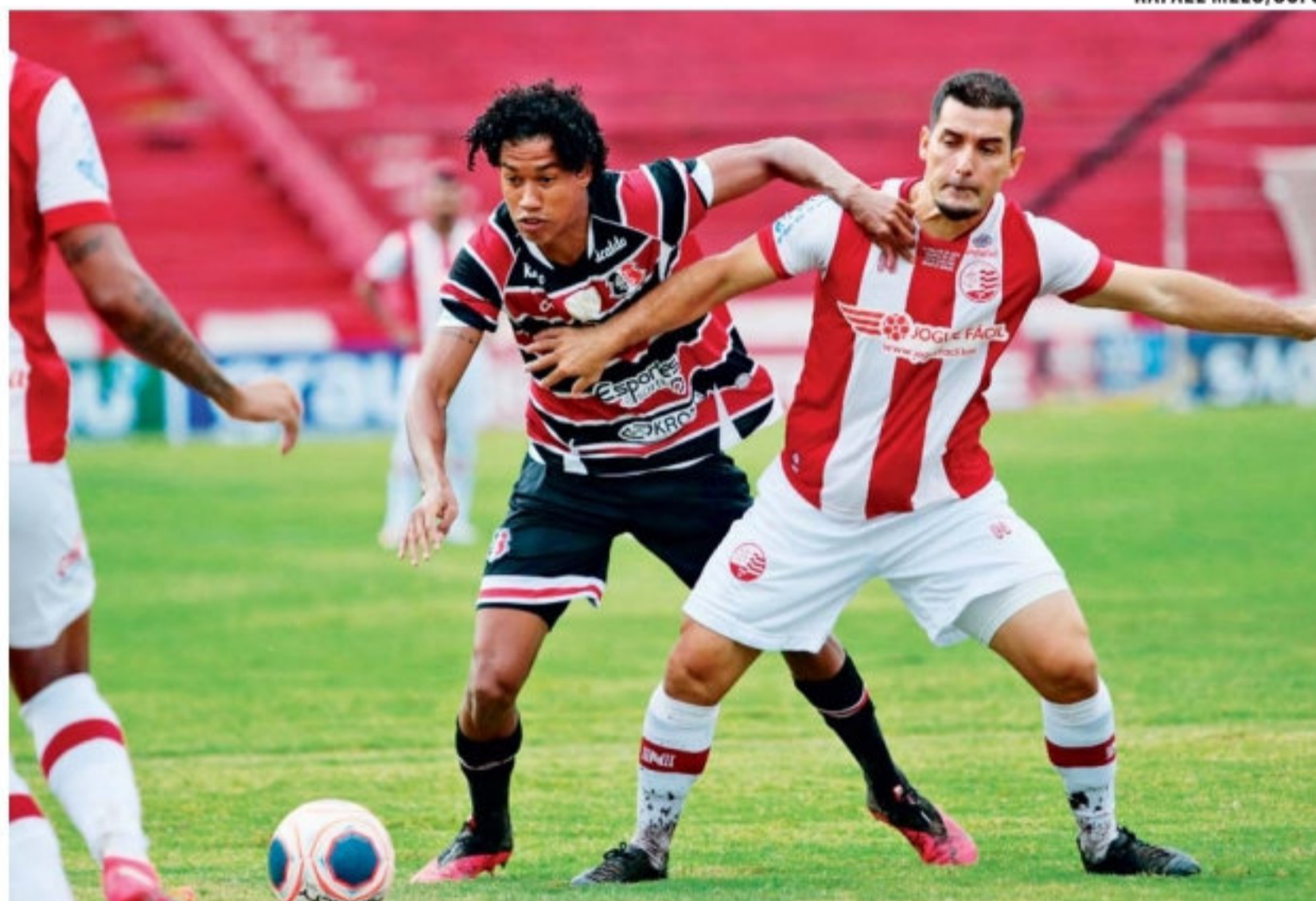
No último jogo entre as duas equipes, pela 6ª rodada do Estadual, o Timbu venceu por 2x1

Em 2017, na decisão do terceiro lugar do Estadual, os alvirrubros perderam por 2x1 na Arena e fica-