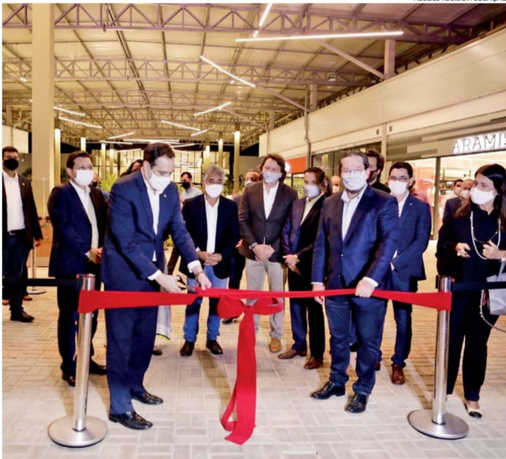
O governador Paulo Câmara inaugurou e fez as honras de cortar a fita do novo Recife Outlet, ontem, que terá, ao todo, 76 operações comerciais, instalado no município de Moreno, na BR-232