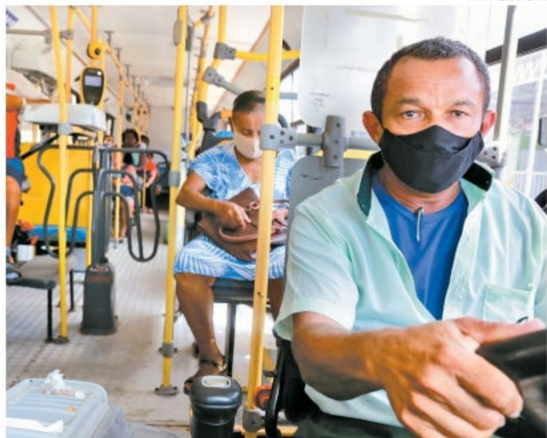
Categoria será contemplada assim que chegarem mais doses