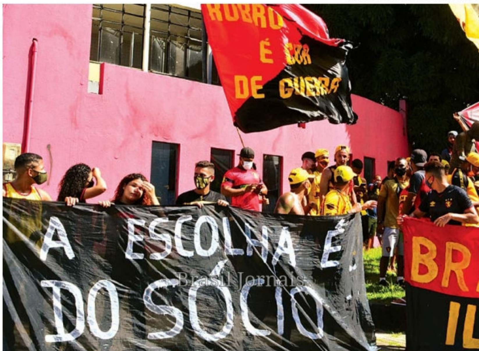
Grupo de torcedores do Sport realizou novo protesto, ontem, para reivindicar eleições diretas

Ontem, um grupo de torcedores foi até a Ilha do Retiro protestar contra a possibilidade de eleições indiretas. Rubro-negros atuantes na política do clube também divulgaram uma carta aberta ao Conselho Deliberati-