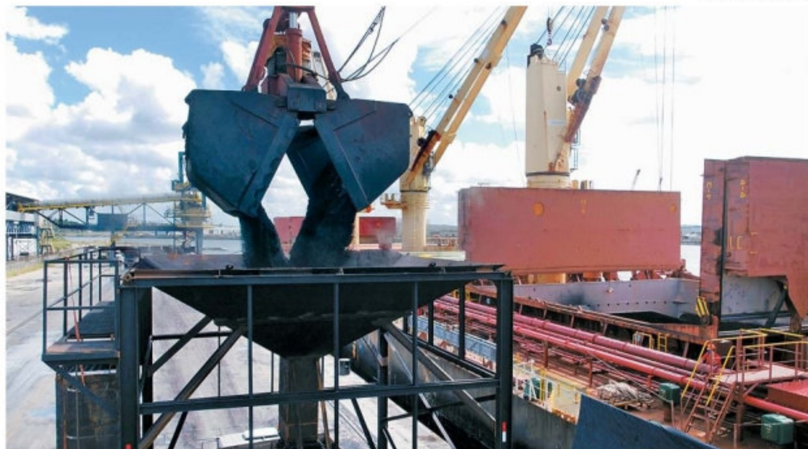
Pátio ficou mais de dois anos parado, mas foi reativado com a chegada de coque verde de petróleo

Enfim, mais do que a certeza de um fato concreto de ser todo o território Brasileiro um ambiente que descredita nos negócios, seja por uma visão anti-empresarial ou pelo mal da burocracia causada pelo vírus “burococus”, fica também a lição de que a cautela analítica é algo vital. Ou melhor, agir com equilíbrio é tudo.