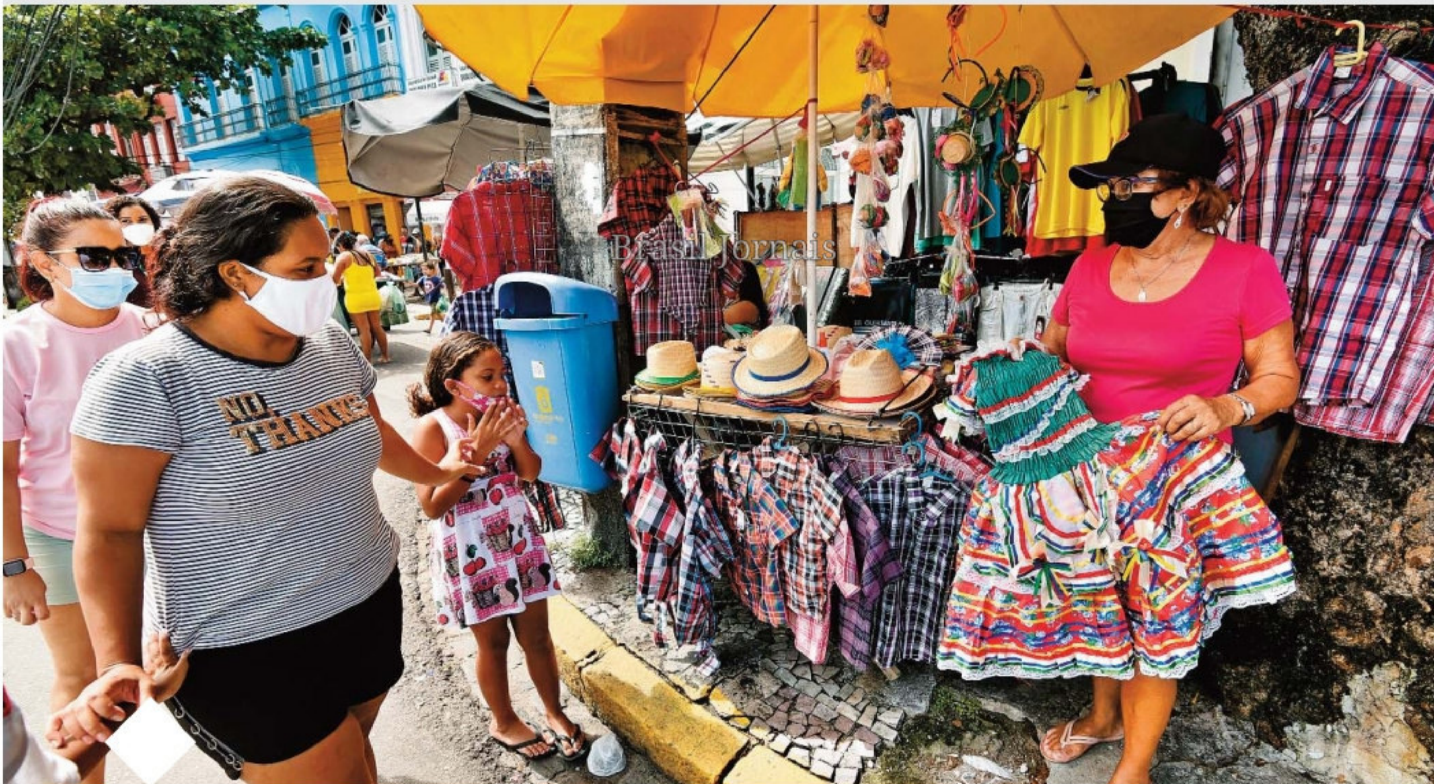
Vendas animam comerciantes no Centro do Recife. Enfeites de cabelo e roupas para crianças estão entre os itens mais procurados