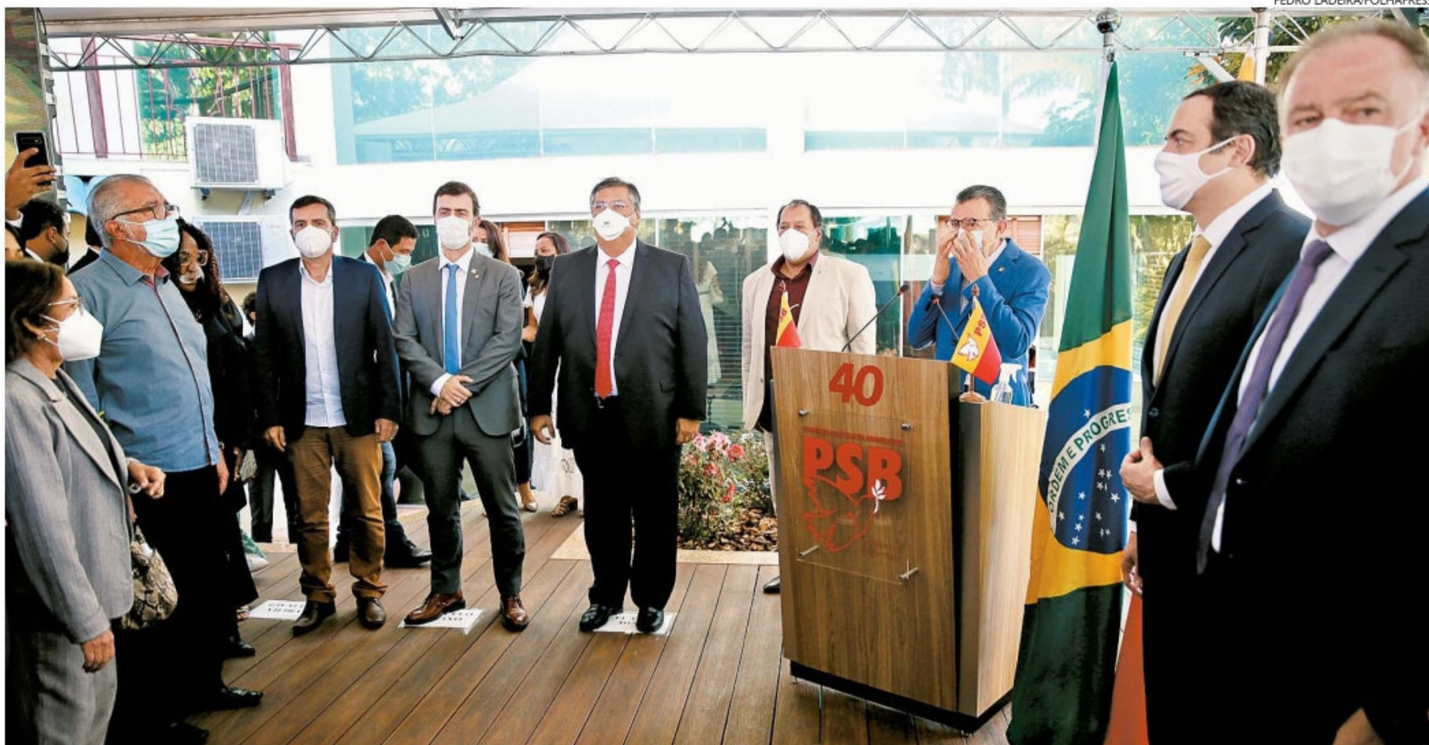
Evento de filiação de Marcelo Freixo e Flávio Dino (C) teve participação do governador Paulo Câmara (D), do prefeito do Recife, João Campos, e de socialistas de todo o País