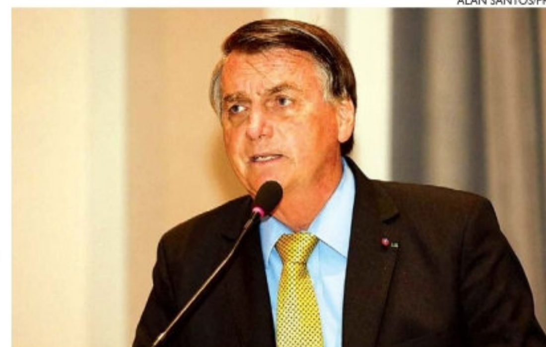
Governo Bolsonaro vai ser questionado pela negociação da vacina