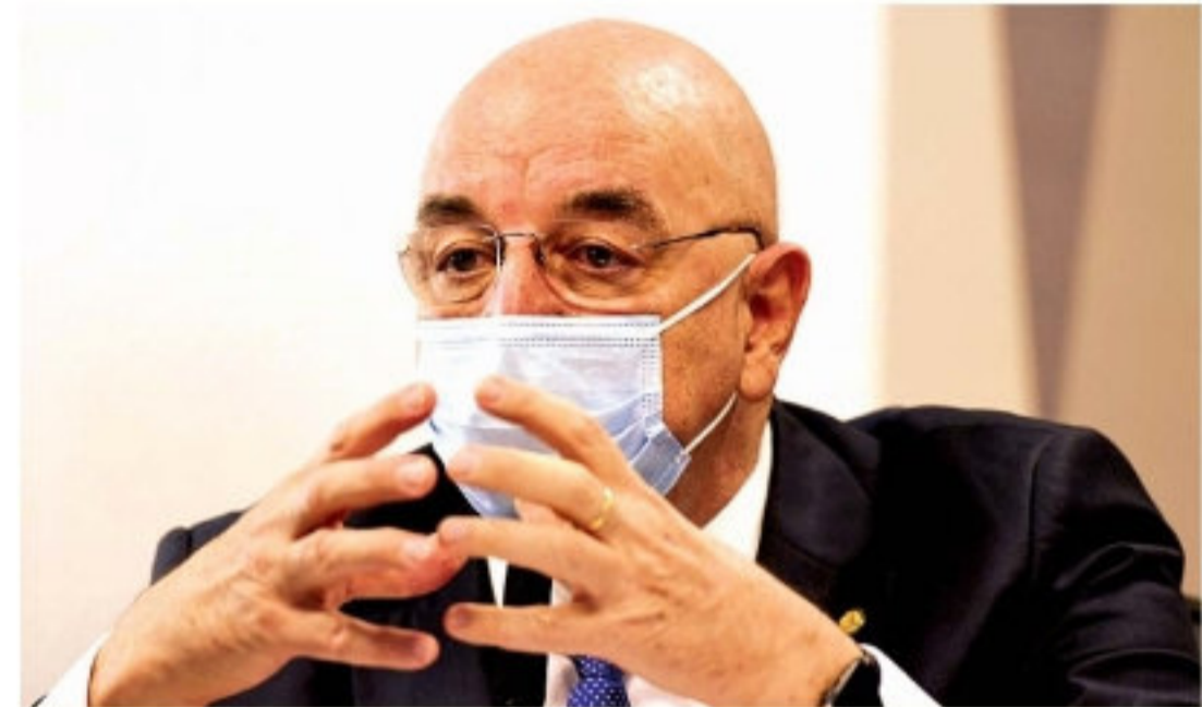
Defensor da imunidade de rebanho, Terra voltou atrás na CPI