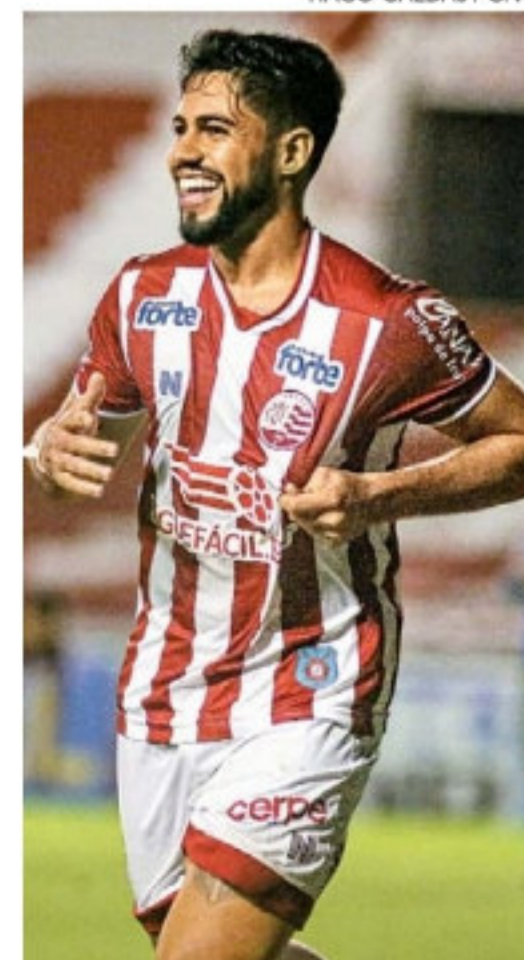
Há chance de Bryan ser deslocado para ponta esquerda