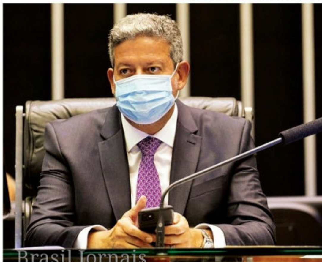
Brasil Jornais Lira disse que governo está em tratativas com o Supremo

BRASÍLIA (Folhapress) - O presidente da Câmara, Arthur Lira (PP-AL), disse ontem que o Brasil terá que passar por um "período educativo" de racionamento de energia para evitar uma "crise maior". Segundo Lira, o diagnóstico foi feito pelo ministro de Minas e Energia, Bento Albuquerque, em uma reunião na semana passada. "O ministro Bento esteve comigo fazendo uma análise do cenário, garantindo que não vamos ter nenhum tipo de apagão, mas vamos ter que ter um período educativo aí de algum racionamento para não ter nenhum tipo de crise maior", afirmou Arthur Lira.