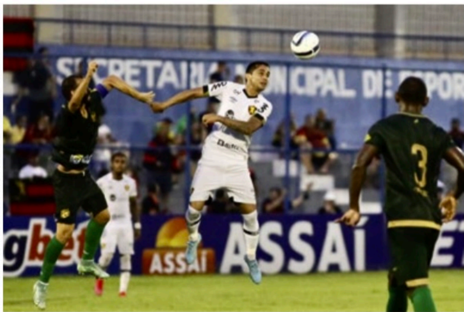
JEJUM Rubro-negros chegaram ao sexto jogo seguido sem vitória e não podem vacilar na Copa do Brasil