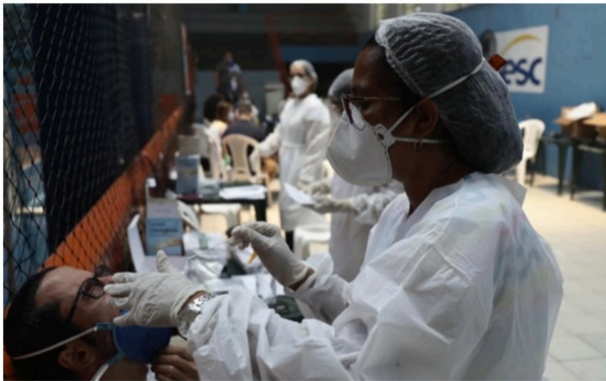
BALANÇO Pernambuco registrou 1.518 novos casos da covid-19, sendo 19 (1,2%) de casos de Síndrome Respiratória Aguda Grave (SRAG) e 1.499 (98,8%) de leves

Na penúltima semana epidemiológica, entre os dias 13 e 19 de fevereiro, o Estado notificou 593 casos de síndrome respiratória aguda grave