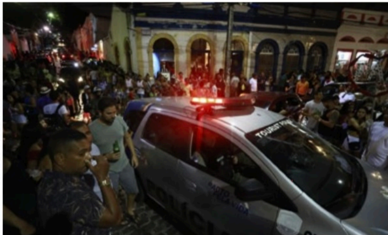
OLINDA Na Rua do Amparo, “domingo de Carnaval” juntou muita gente. Folia também ocorreu nos Quatro Cantos

De acordo com a Prefeitura, no sábado (26), o primeiro grupo abordado estava utilizando instrumentos musicais mecânicos na Avenida Joaquim Nabuco, no Varadouro. As pessoas foram abordadas pela fiscalização e os instrumentos foram apreendidos pelos agentes de Operações do Controle Urbano