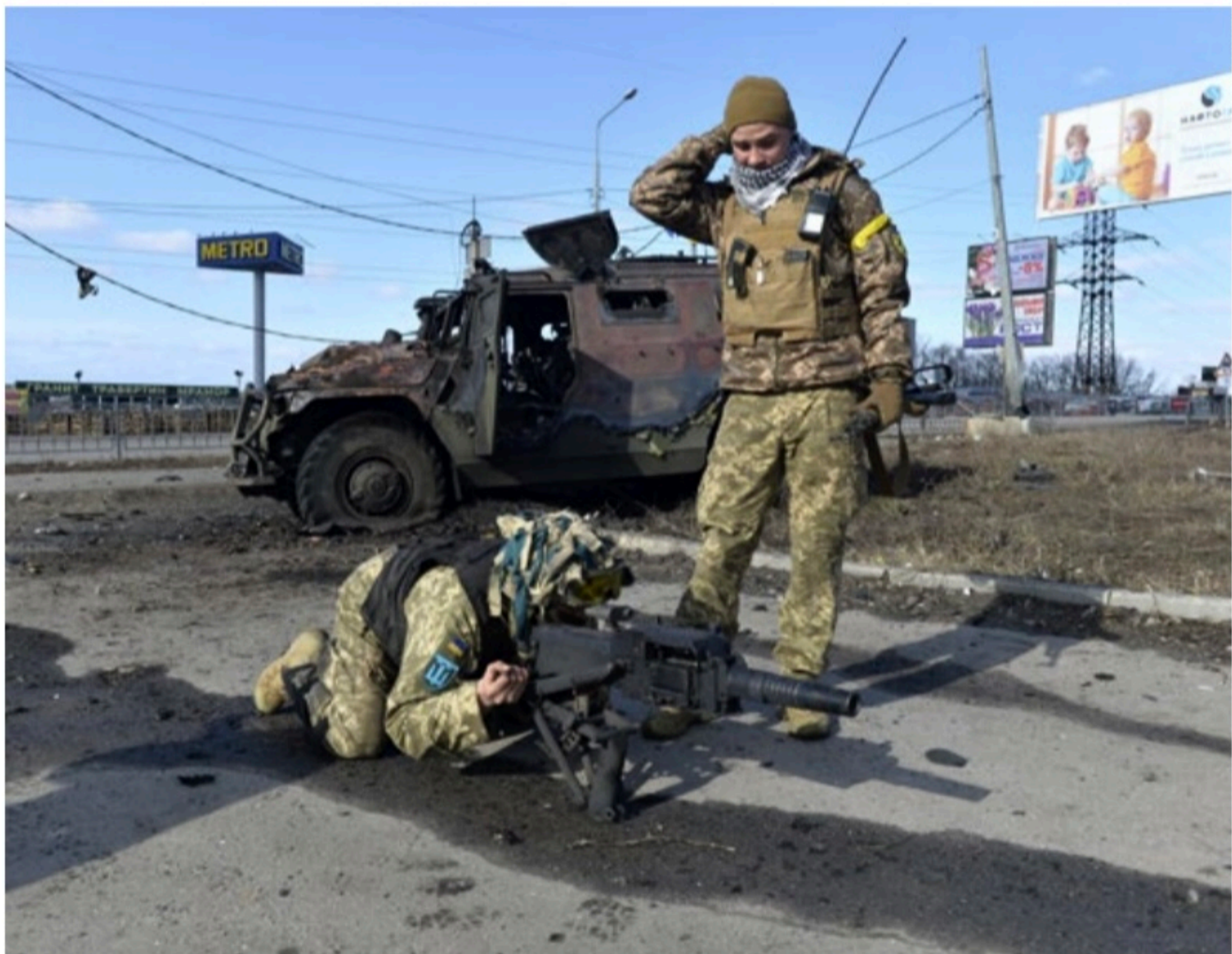
DEFESA Soldados da Ucrânia testando uma granada automática para ser usada contra a infantaria da Rússia nos arredores da capital, Kiev

A UE também anunciou que adotará sanções contra o governo bielorrusso, por ter permitido que seu país fosse usado como plataforma de lançamento da ofensiva russa contra a Ucrânia. O governo bielorrusso de Alexander Lukashenko "é cúmplice no ataque à Ucrânia", acusou Ursula.