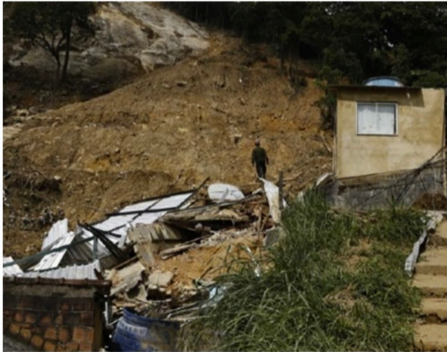
DRAMA Depois de 12 dias de buscas, o número de mortos na tragédia chega a 229, com 20 pessoas desaparecidas