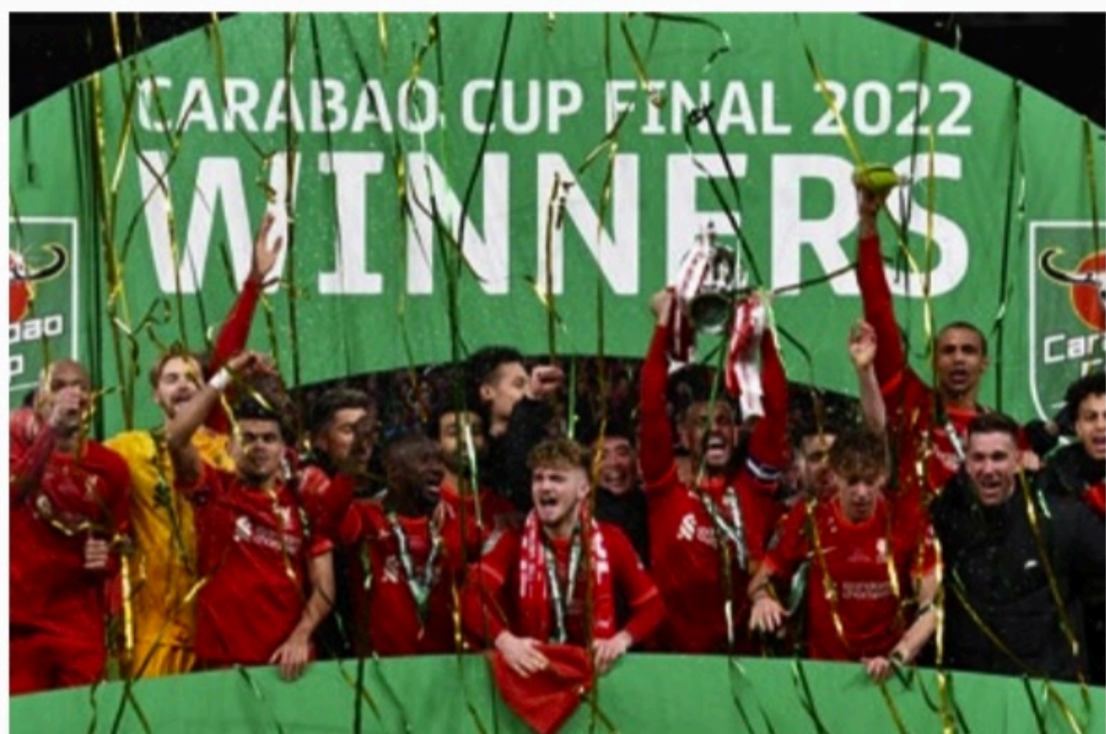
LONDRES Jogadores do Liverpool comemoram a vitória por 1x10 nos pênaltis após o empate por oxo na decisão

Após 21 cobranças sem errar, Kepa chutou forte por cima do travessão, mandando a bola para as arquibancadas, dando início à festa da torcida do Liverpool e dos jogadores de Jurgen Klopp.