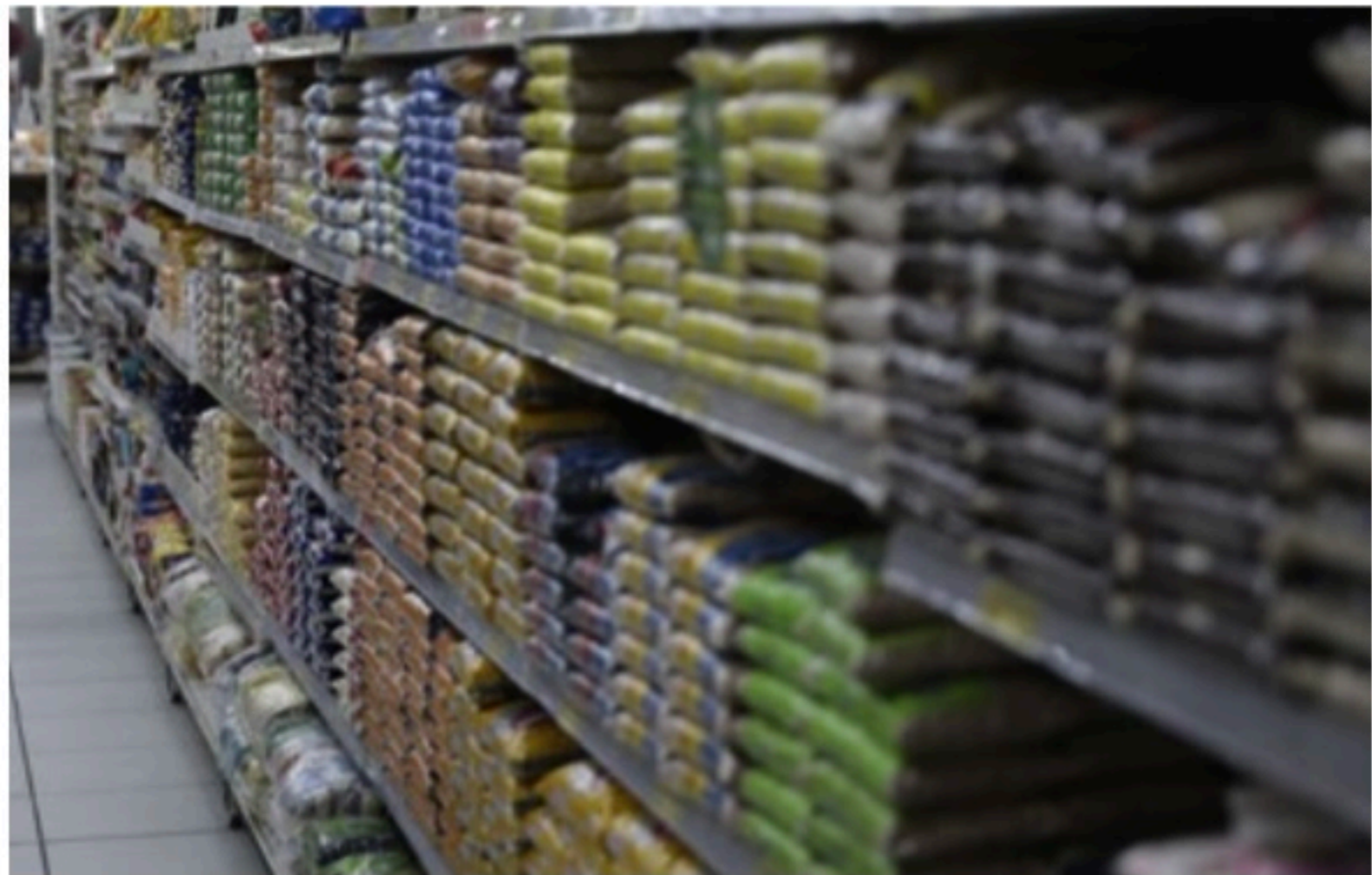
NAS ALTURAS Diminuição da produção no Paraná, manterá o feijão como um dos alimentos com valor elevado