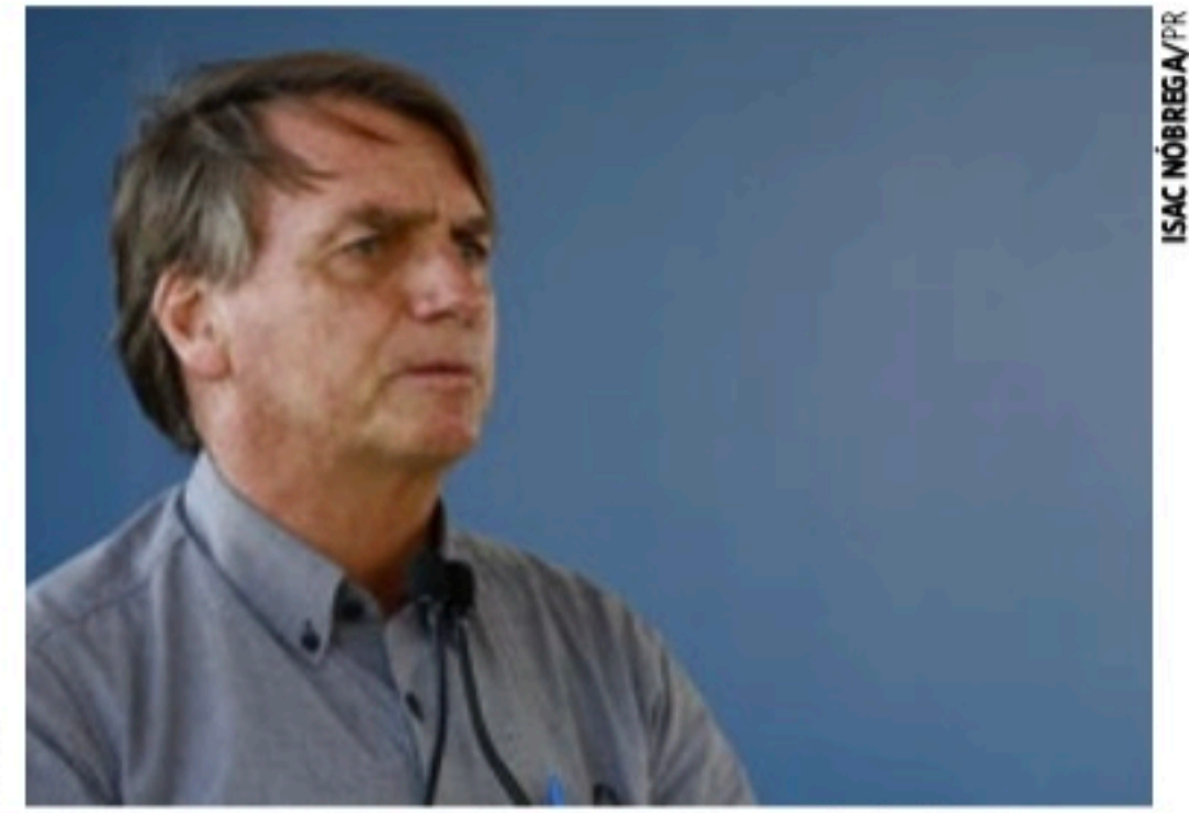
POLÊMICA Presidente defende a exploração de fertilizantes