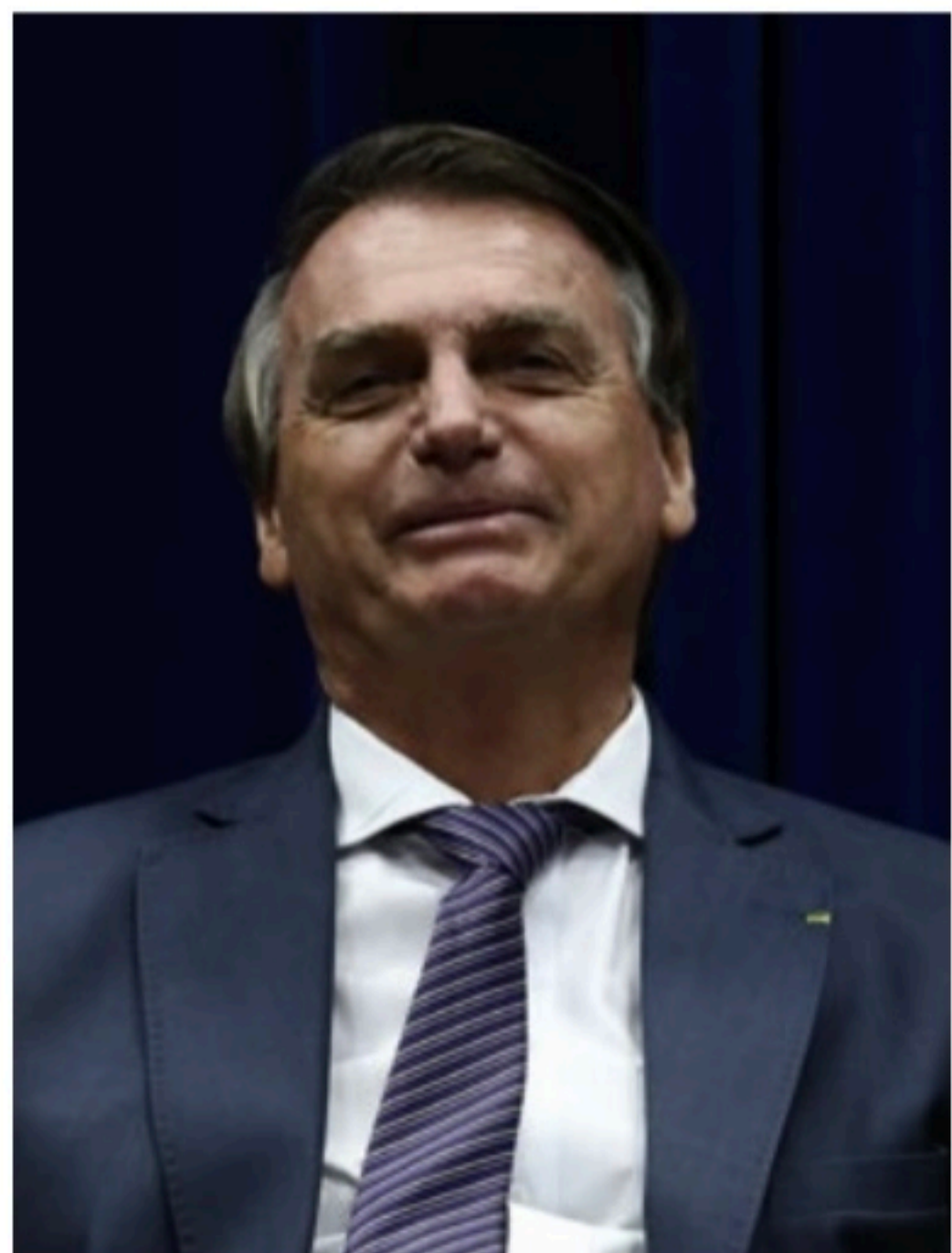
TELEFONEMA Itamaraty desmentiu ligação de 2h entre Bolsonaro e Putin