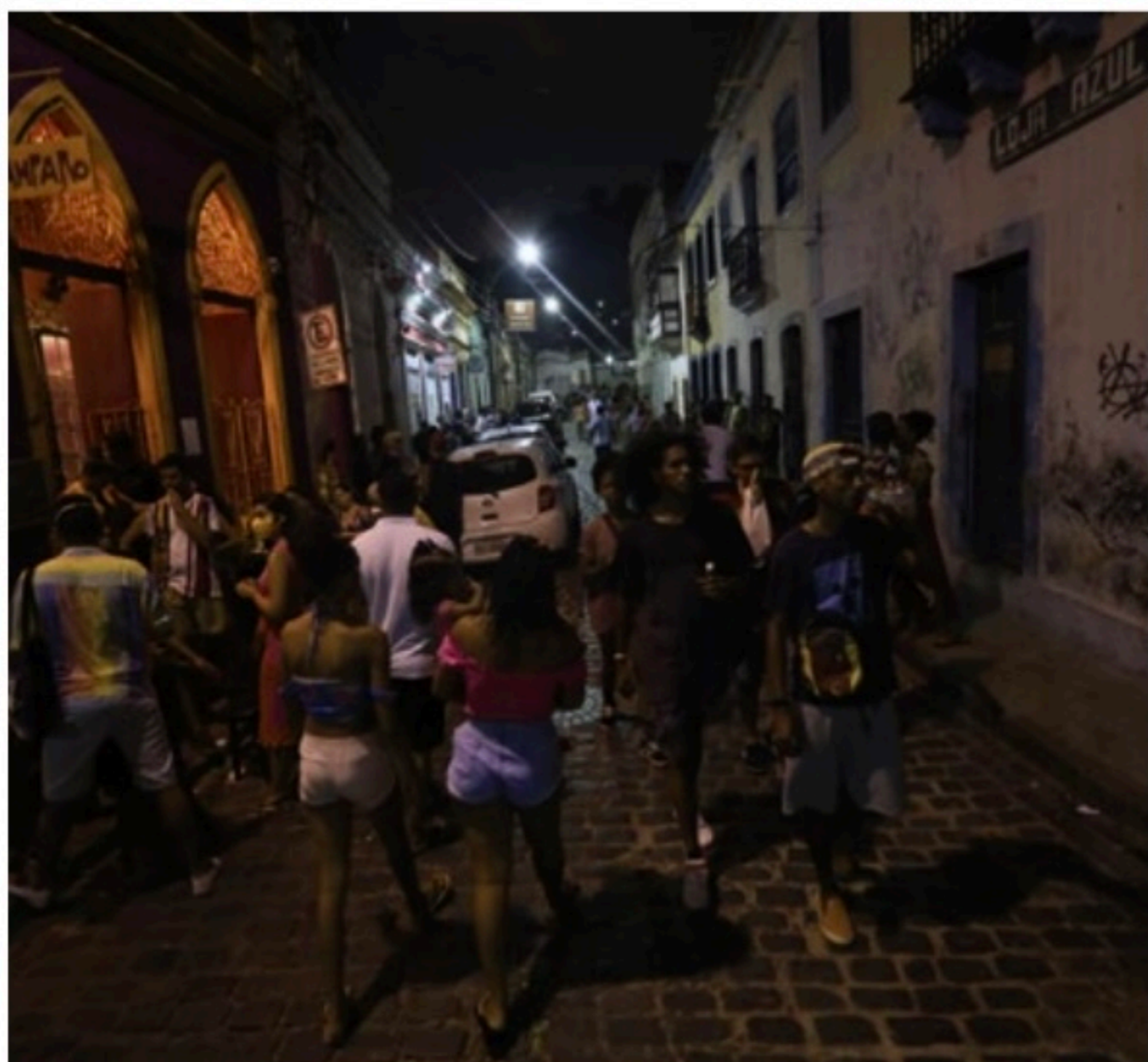
FUTURO Mesmo com otimismo em relação a regras mais brandas, população precisa colaborar

(srag). Desse total, 217 tiveram resultado confirmado para covid-19. Isso representa, respectivamente, uma redução de 39,7% e de 92,6%, em comparação com a semana anterior, de 6 a 12 de fevereiro.