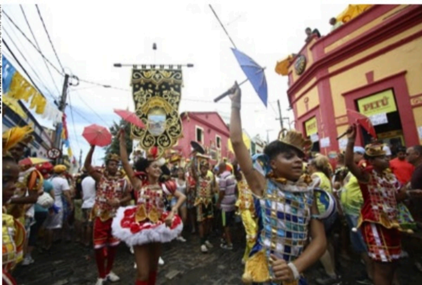
FOLIA Troça Carnavalesca Mista Pitombeira dos Quatro Cantos arrasta multidão pelas ladeiras de Olinda durante o Carnaval

ra Bloco da Saudade, um dos mais tradicionais blocos líricos da cidade, que conta com 90 mulheres, 30 homens e 20 músicos. Nesta segunda-feira (28), o desfile estaria sendo no Recife Antigo. “O sentimento é sem discriminação, é uma emoção muito grande, é toda uma expectativa. Se eu falar, vou chorar.”