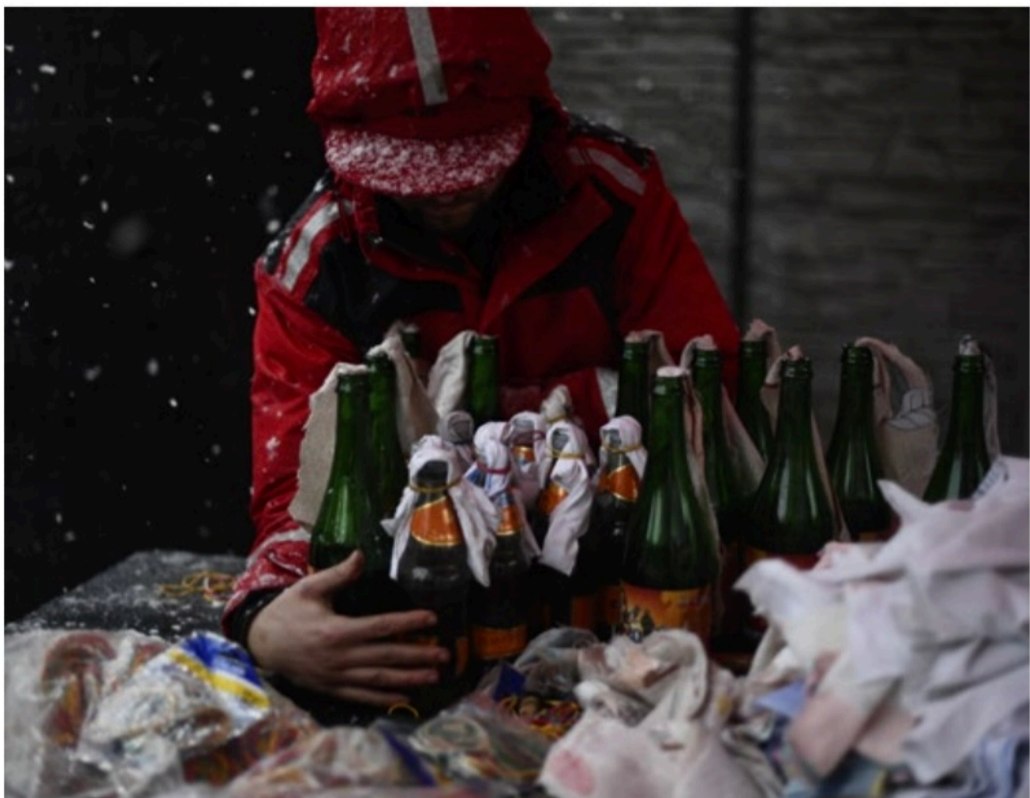
RESISTÊNCIA Civis ucranianos entraram na batalha e têm feito coquetéis molotov para enfrentar as tropas invasoras em guerra assimétrica