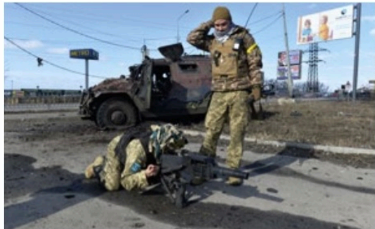
DEFESA Soldados ucranianos estão dificultando ação de russos em principais cidades

Olinda viveu "domingo de Carnaval" com muita gente na rua - alguns, inclusive, fantasiados para a folia de Momo. Estado pode anunciar flexibilizações hoje. Página 5