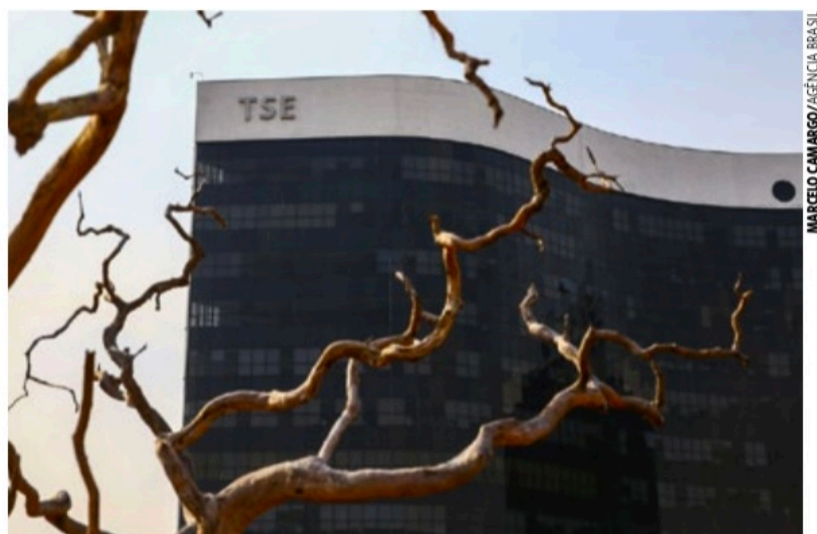
JUSTIÇA Entendimento do TSE é que publicidade antecipada não é só pedido de foto fora do prazo legal

No TSE, há pelo menos sete representações por campanha antecipada contra o presidente Jair