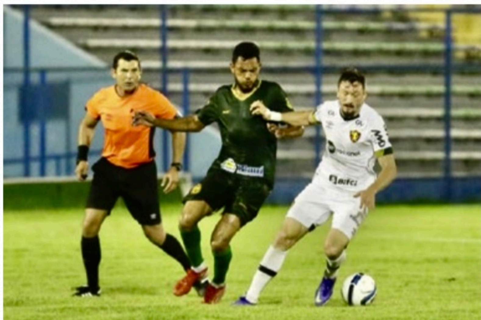
FRACO Gramado do estádio Lindolfo Monteiro foi mais um obstáculo para os jogadores do Leão

Faltam duas rodadas para o final da primeira fase. Os rubro-negros irão enfrentar o Bahia, fora de casa, no próximo sábado, às 17h45, e depois recebe o Floresta, no dia 12.