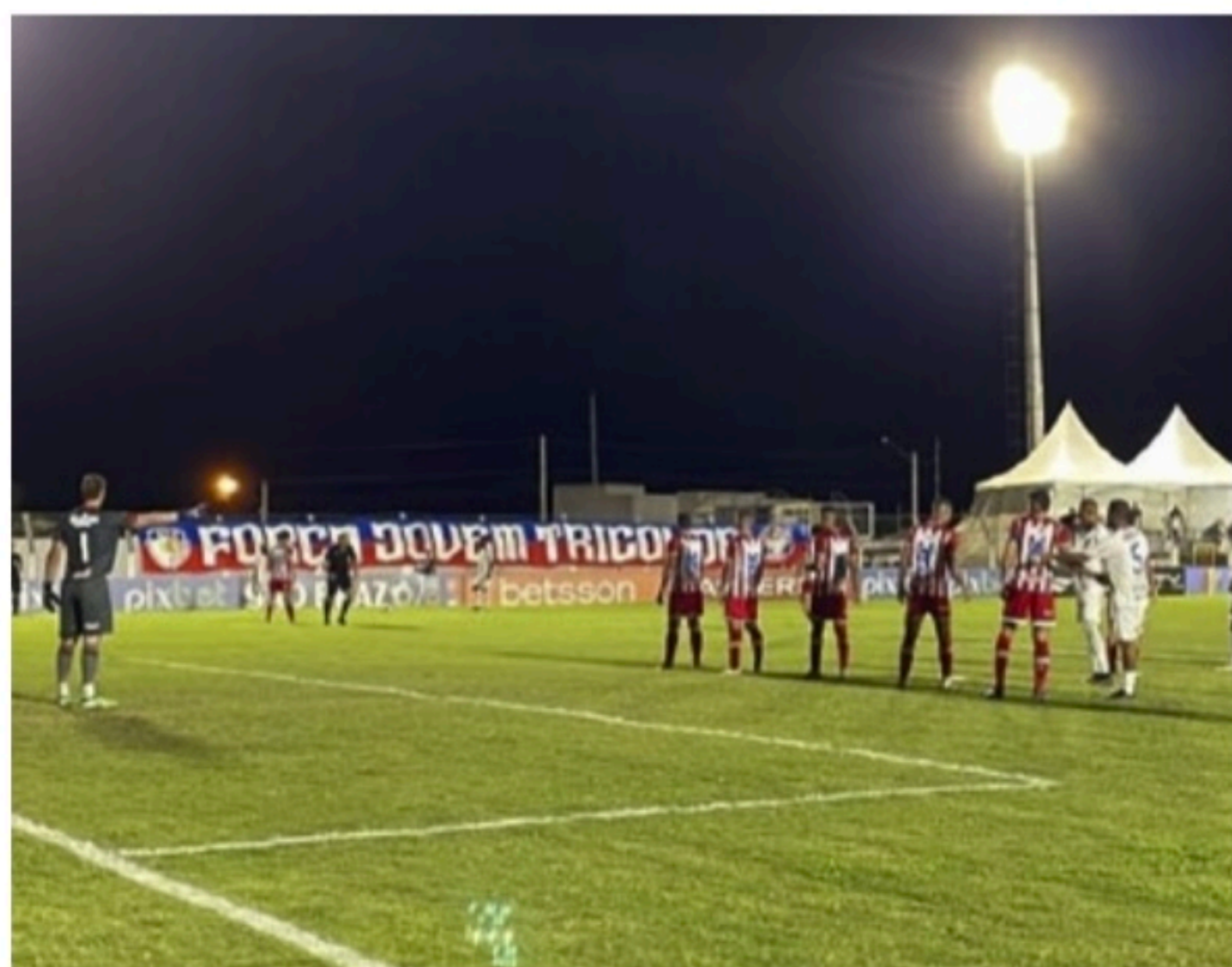
VIANÃO Em crise, alvirrubros empataram e chegaram ao terceiro jogo seguido sem vitória na temporada

O próximo jogo do Náutico acontece nesta quarta-feira (2). O Timbu enfrenta o Salgueiro, às 19h, nos Aflitos, em partida válida pela sétima rodada do Campeonato Pernambucano.