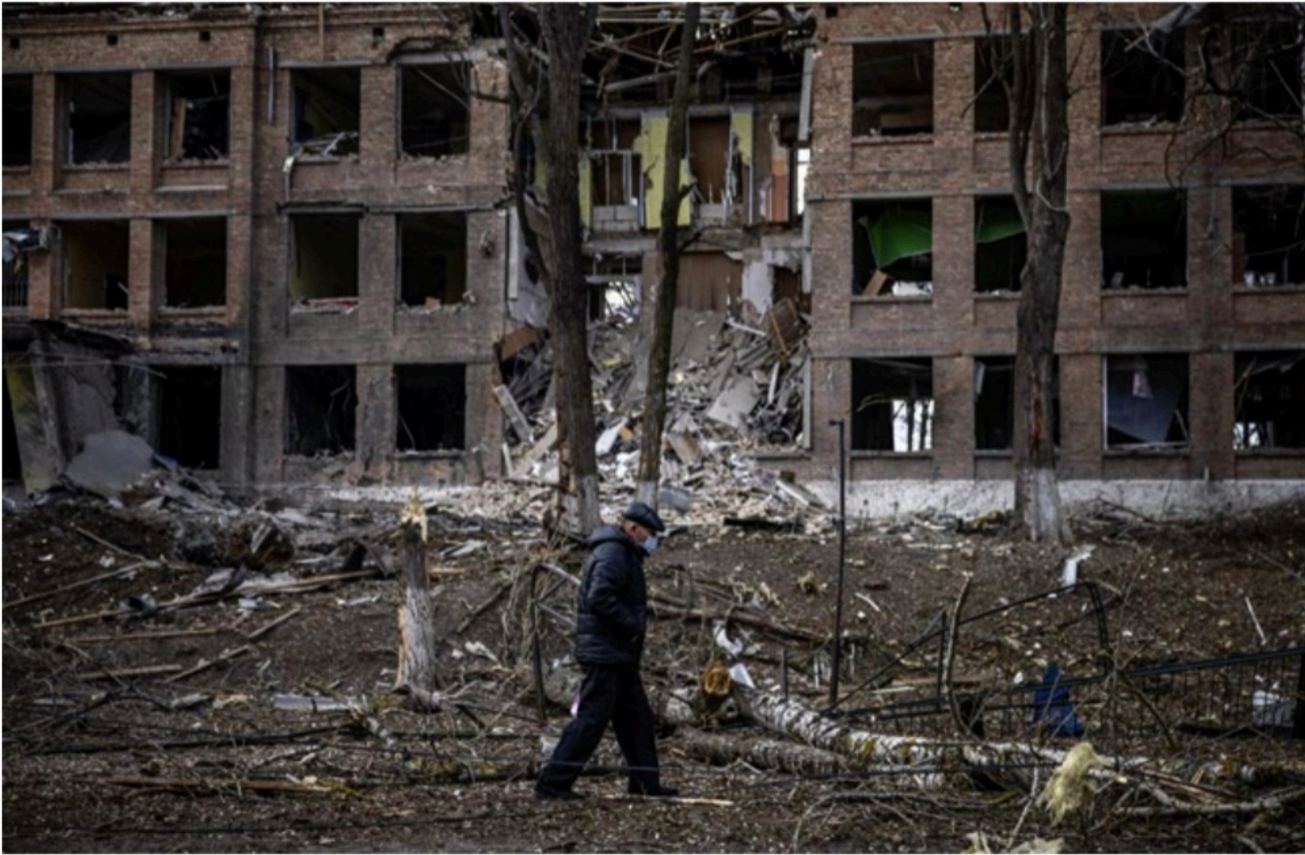
UCRÂNIA Tropas russas têm tido dificuldade de tomar cidades ucranianas, enquanto governo Putin sofre pressões internas e externas cada vez maiores em múltiplas frentes

Segundo o presidente da Ucrânia, Volodimir Zelenski, as conversas precisam ocorrer