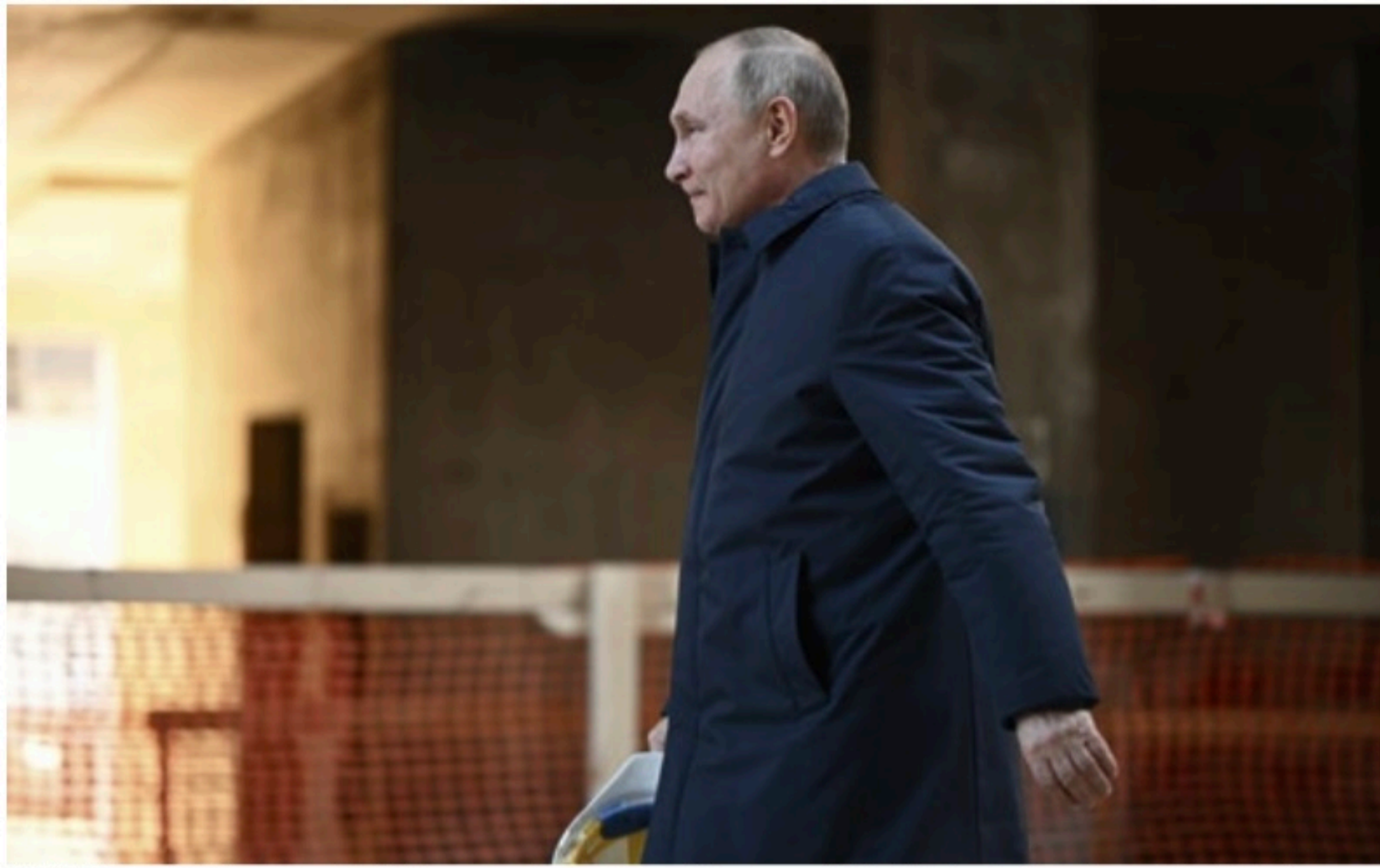
RÚSSIA Líderes do Ocidente, como Boris Johnson, acreditam que o presidente russo, Vladimir Putin, cria distração para dificuldades das tropas

No nono dia de guerra, os russos voltaram às ruas de diversas cidades para protestar contra a invasão da Ucrânia e pedir o fim do conflito. Manifestações foram registradas em lugares como Moscou, São Petersburgo e também na Sibéria, apesar das autoridades russas terem avisado que não