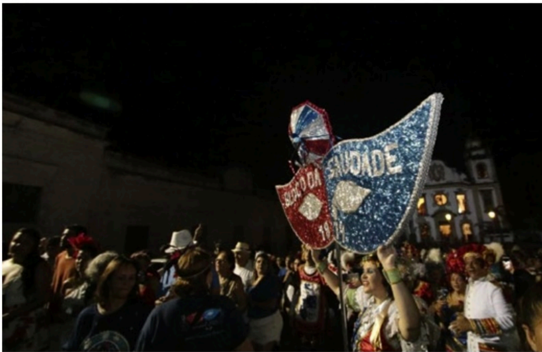
TRADIÇÃO Bloco da Saudade conta com 90 mulheres, 30 homens e 20 músicos. Hoje, o desfile lírico estaria acontecendo no Recife Antigo