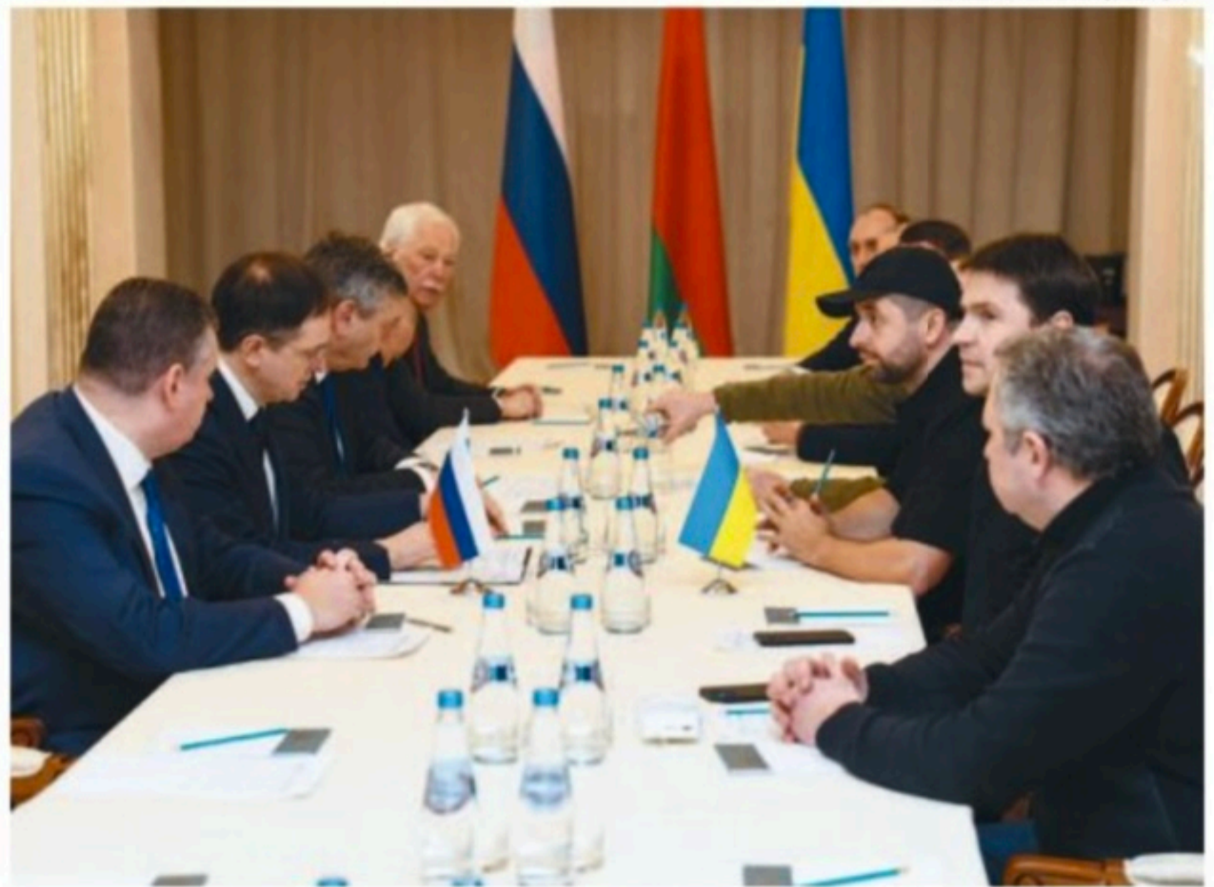
Delegações se reuniram na segunda-feira em Gomel, na fronteira com Belarus

No fim do dia, o Ministério do Interior (MI), admitiu a entrada de soldados russos na cidade de Kherson, no sul do pa-