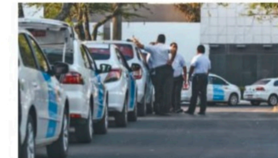
Atraso poderá acarretar em uma multa de até R$ 498

Os permissionários que não cumprirem o prazo previsto no calendário anual de recadastramento estarão submetidos a uma multa de 50 km tarifá-