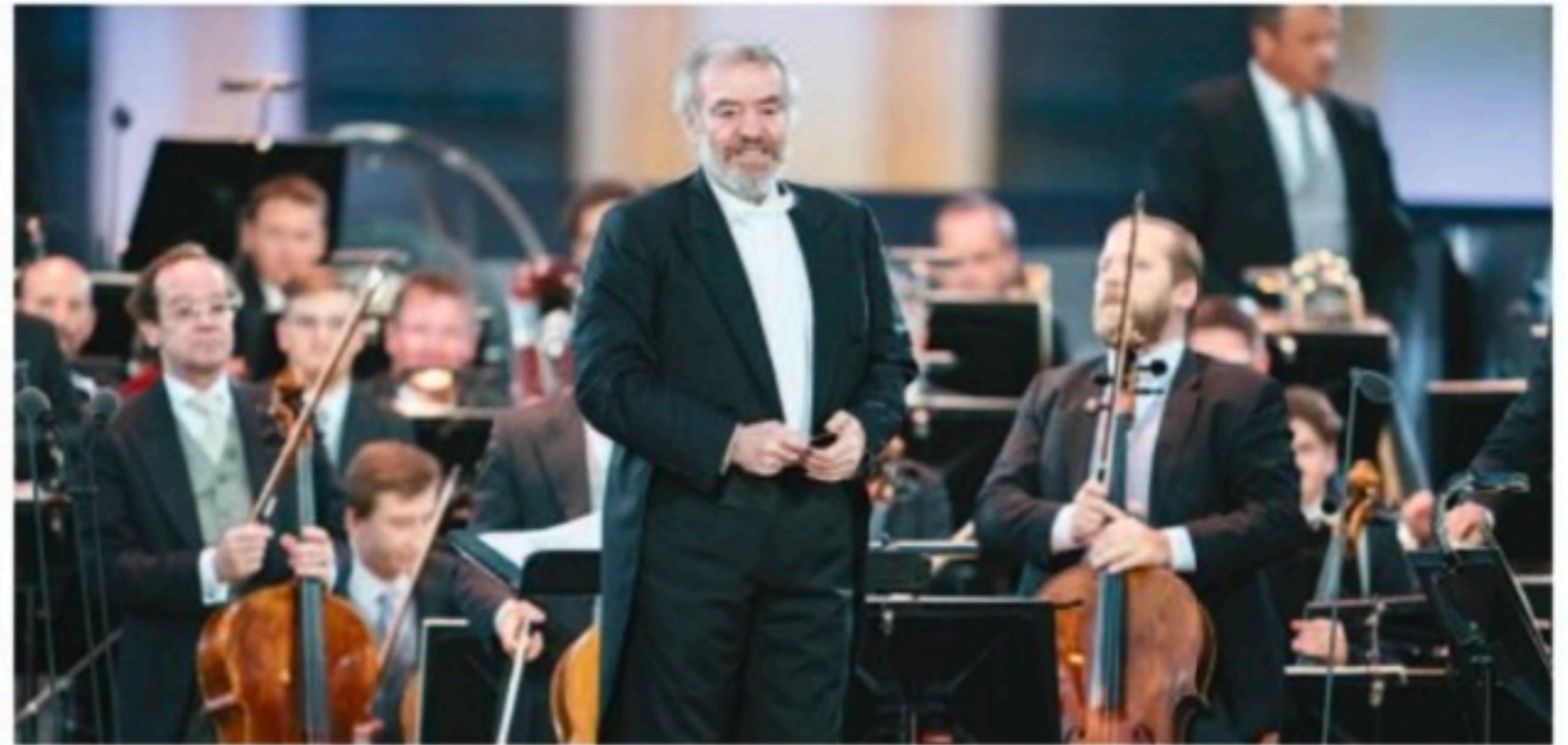
Próximo ao Kremlin, o maestro Valery Gergiev foi demitido da Filarmônica de Munique

A umenta a pressão sobre os artistas russos, após a invasão da Ucrânia, para que se distanciem do presidente Vladimir Putin, sob pena de serem declarados persona non grata nos palcos ocidentais. O mundo da música clássica foi novamente abalado ontem pela decisão da direção da Filarmônica de Munique, na Alemanha, de demitir o maestro Valery Gergiev, próximo ao Kremlin, enquanto a soprano Anna Netrebko, em posição delicada, decidiu suspender seus concertos. Na sexta-feira, o presidente da capital da Baviera, Dieter Reiter, deu a Gergiev até segunda-feira para "se distanciar de modo claro e categórico" da invasão russa à Ucrânia. Porém, o diretor de 68 anos, um dos mais requisitados do mundo, permaneceu em silêncio enquanto os ultimatos contra ele se intensificavam. Além de dirigir a Filarmônica de Munique, desde 2015 ele conciliava seu cargo, entre outros, com o de diretor-geral do prestigiado Teatro Mariinsky, em São Petersburgo, cidade natal do presidente russo. Na sexta-feira, o Carnegie Hall, de Nova York, já havia deixado o diretor russo de fora de uma