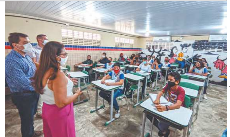
Rede reúne 1,8 mil docentes e 26 mil estudantes

zar ainda mais os nossos professores”, afirmou o gestor. Olinda tem 72 escolas, sendo 16 creches e cinco com ensino integral. A rede reúne aproximadamente 26 mil estudantes.