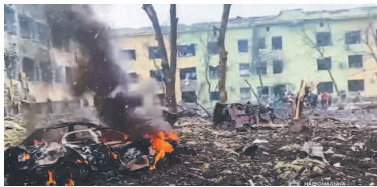
Ucrânia aponta mais de 2.000 civis mortos em Mariupol

Mais ao sul, em Mariupol, cidade portuária sitiada há 13