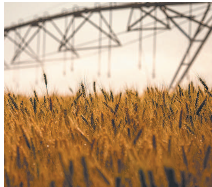
Peso dos fertilizantes é de 38% em Cascavel, no Paraná