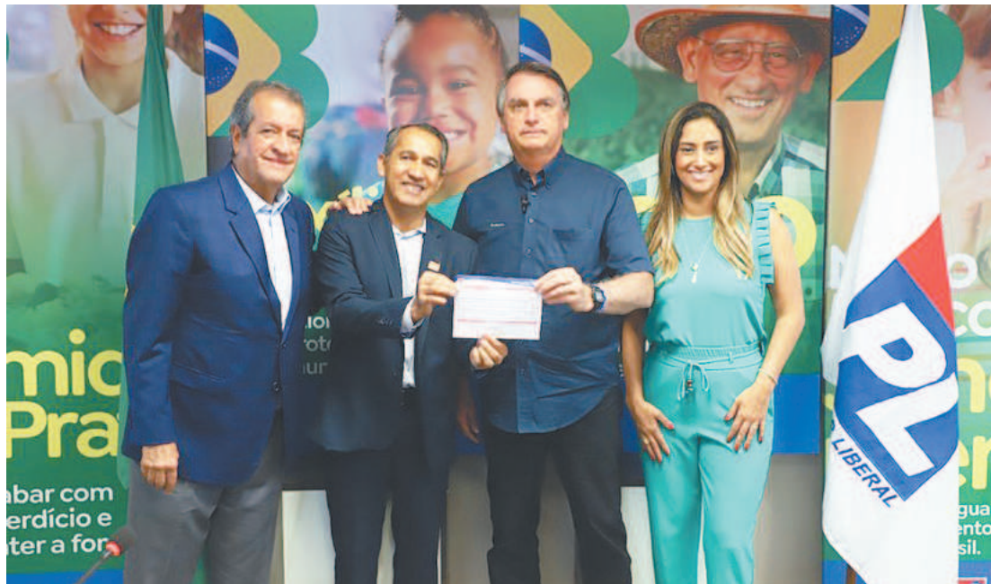
Presidente defendeu mecanismo de subsídio durante filiação de deputados ao PL

O presidente comentou ainda sobre a sanção do projeto de lei que zera a cobrança de PIS e Cofins sobre o diesel. De acordo com ele, o projeto impediu um aumento maior. “Ao invés de R$ 0,90 de reajuste no diesel, passou para R$ 0,30 centavos. É alto, sim, mas é possível você suportar porque a crise é