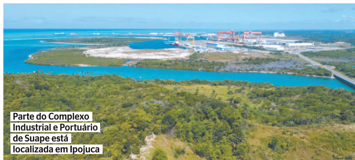
Parte do Complexo Industrial e Portuário de Suape está localizada em Ipojuca

A quantidade se refere apenas a fevereiro deste ano, segundo informações do Redesim. É o maior volume mensal de solicitações de viabilidades desde 2013