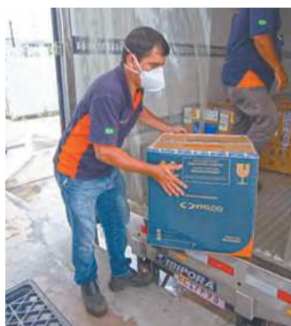
Remessa reúne 120 mil doses da marca Pfizer