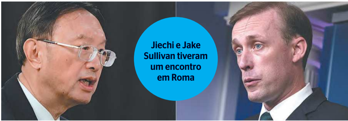
Jiechi e Jake Sullivan tiveram um encontro em Roma