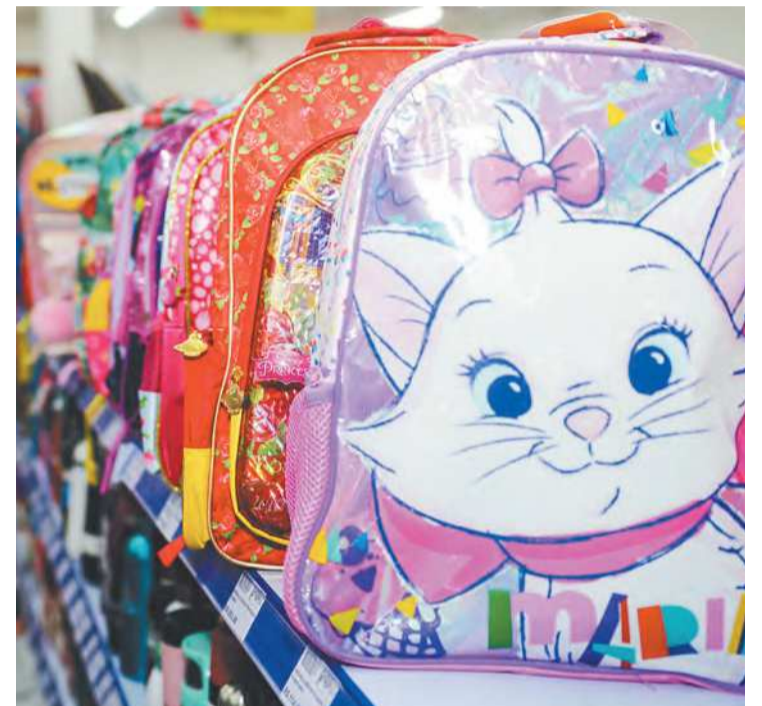
Retorno das aulas estimulou vendas de material escolar

Apenas quatro segmentos do varejo pernambucano cresceram na comparação dos dois últimos períodos de 12 meses. Veículos, motocicletas, partes e peças aumentou 77,7%; Livraria e papelaria, 30,9%, graças ao retorno das aulas; Farmácias, artigos médicos, perfumaria e cosméticos, devido à busca por medicamentos e testes, cresceu 26,8%; e Tecidos, vestuários e calçados, 15,5%.