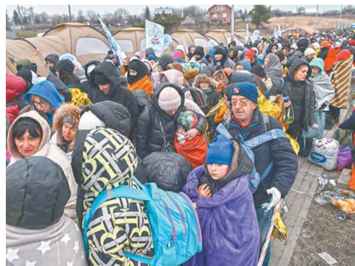
Refugiados na Polônia ficam na fila enquanto esperam para serem transferidos para uma estação de trem