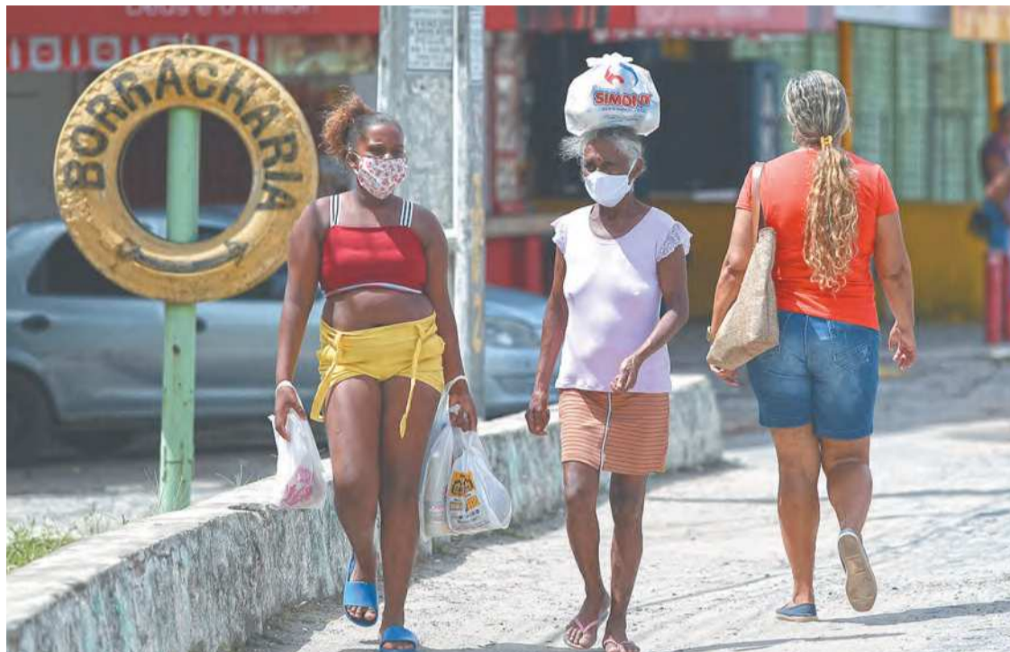
Cobertura facial ainda é obrigatória em ambientes abertos e fechados do estado

O decreto com as atuais determinações para Pernambuco vence hoje, em meio à queda da obrigatoriedade do uso de máscaras em outros locais do país. As cidades do Rio de Janeiro, Natal (RN) e Rio Branco (AC) já desobrigaram a utilização em locais abertos e fechados, enquanto Belo Horizonte (MG), Boa Vista (RR), Brasília (DF), Florianópolis (SC), Macapá (AP), Manaus (AM), Porto Velho (RO), São Luís (MA), São Paulo e Teresina (PI) permitem rostos descobertos em locais ambiente aberto.