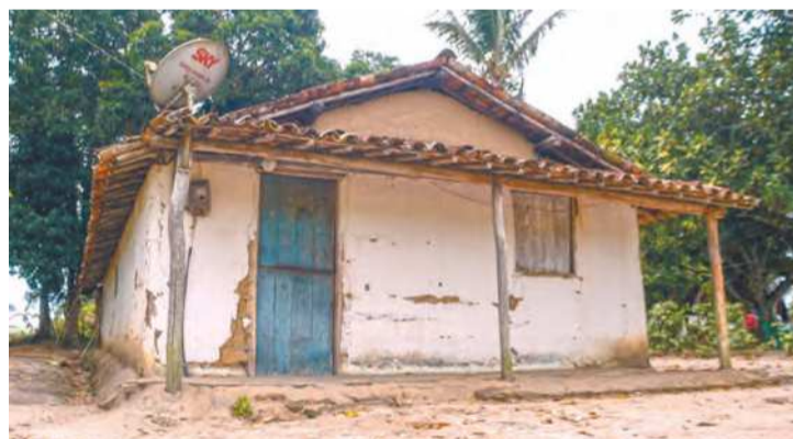
Morte de criança na Zona da Mata chocou sociedade