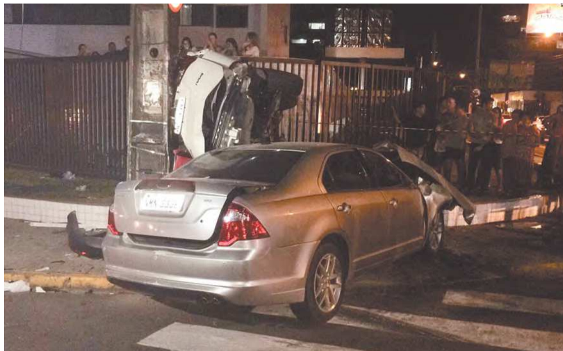
Carro do acusado se chocou no veículo das vítimas a 107km/h em novembro de 2017

O julgamento será realizado pela 1ª Vara do Tribunal do Júri da Capital, às 9h, no Fórum