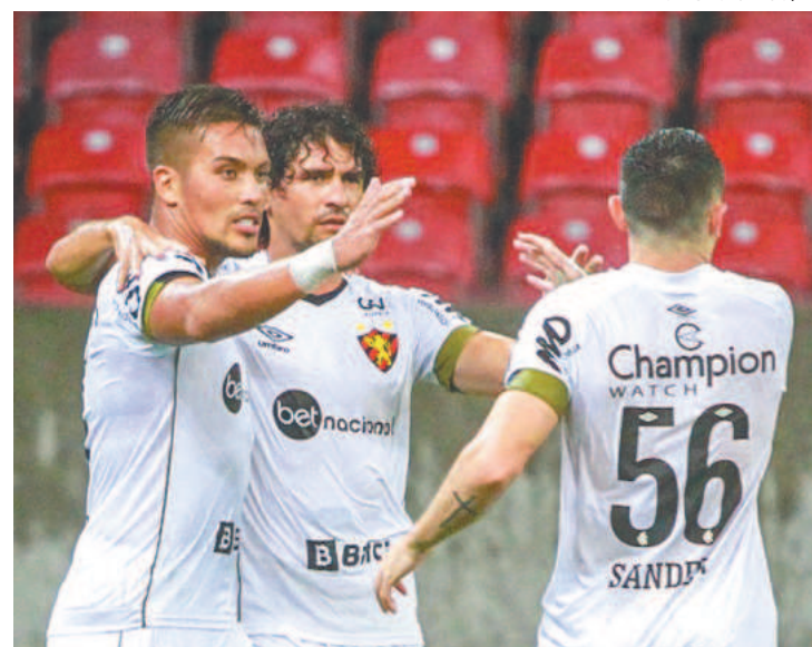
Leão disputou 6 jogos seguidos fora, com 3 vitórias

O Sport volta a campo neste sábado (19) para enfrentar o Floresta, às 17h45, na Ilha do Retiro, pela última rodada da Copa do Nordeste, partida que vai marcar o reencontro com a torcida.