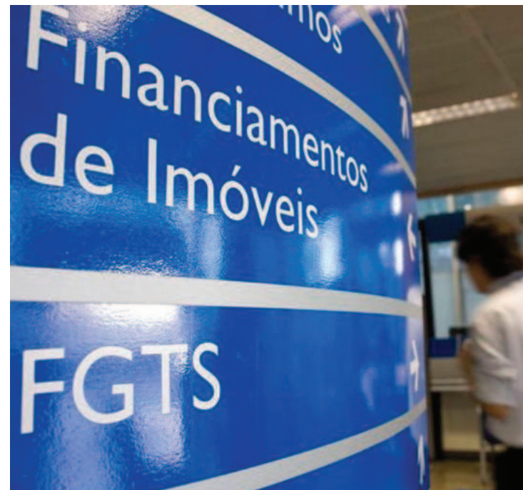
O valor do saque fica disponível até 15 de dezembro

Também ontem, Bolsonaro assinou decreto antecipando o pagamento do 13º dos aposentados e pensionistas do INSS. O governo estima que a medida injetará R$ 56,7 bilhões na economia. O pagamento da primeira parcela será de 25 de abril a 6 de maio, com as aposentadorias e pensões da competência de abril. E a segunda parcela, de 25 de maio a 7 de junho, com os benefícios relativos a maio.