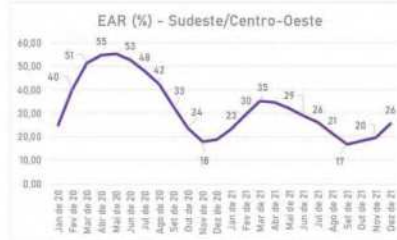
Gráfico 1-Energia Armazenada (%).

Prezados Acionistas, Submetemos para vossa apreciação o Relatório da Administração ("RAD") e as DFs da Energética Suape II S.A. ("Cia." ou "UTE Suape II"), com o relatório dos auditores independentes, referentes ao exercício social findo em 31/12/2021. A Cia. apresenta a seguir os principais fatos que ocorreram em 2021.