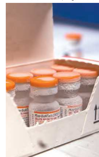
Imunizante americano é específico para crianças