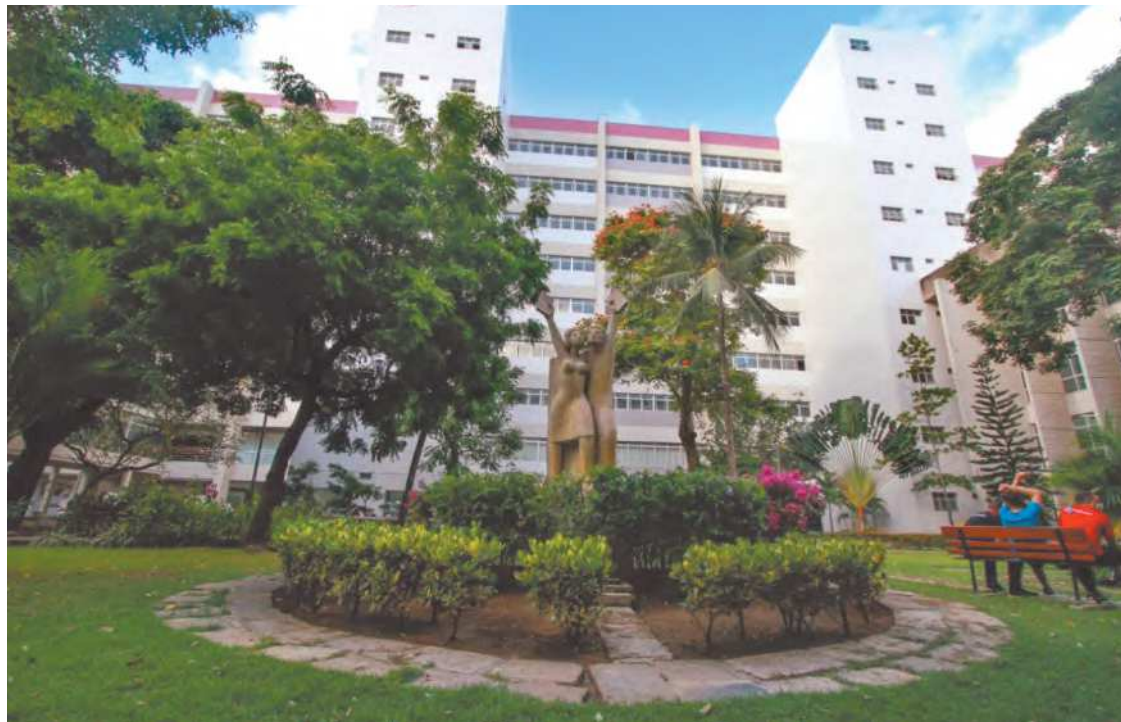
Instituição tem, hoje, 25 cursos com inscrições abertas nas áreas de Gestão e Direito