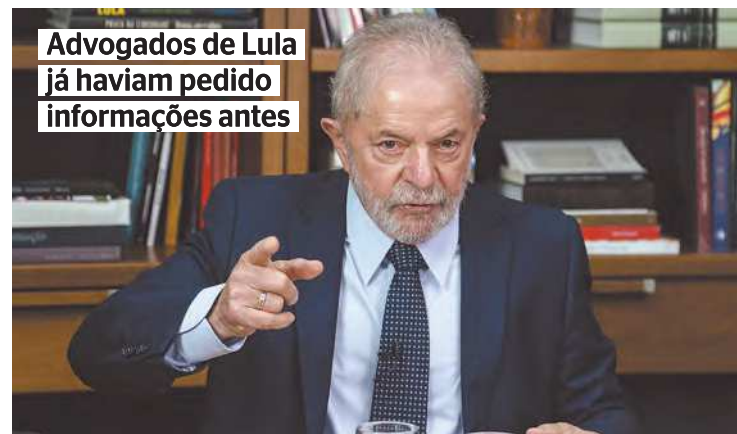
Advogados de Lula já haviam pedido informações antes

tigações teriam tido auxílio do FBI para que procuradores quebrassem a criptografia do sistema de pagamentos de propina da empreiteira Odebrecht. Para os advogados, essa troca de informações teria ocorrido sem o procedimento padrão, definido no MLAT, tratado internacional de assistência jurídica entre países. (Bernardo Lima, do Correio Braziliense)