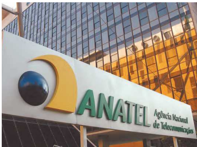
Infrator pode ter numeração bloqueada por agência

De acordo com a Anatel, as novas regras foram aprovadas após processo de consulta pública realizado nos meses de agosto e setembro de 2021.