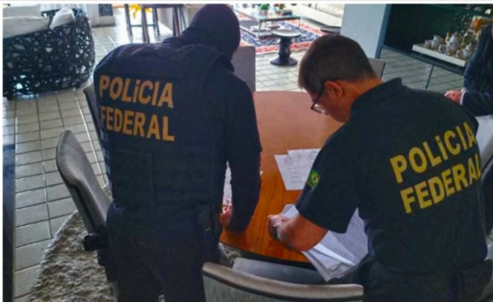
Agentes da Polícia Federal cumpriram 27 ordens judiciais em cidades de 5 estados

em Porto Alegre (RS), Chapecó (SC), Blumenau (SC), São Paulo (SP), Cajamar (SP), Tanabi (SP), Presidente Prudente (SP) e Matão (SP). Os investigados poderão responder por crimes de lavagem de bens e valores, associação criminosa, estelionato, falsidade ideológica e uso de documento falso, cujas penas, somadas, podem chegar a 22 anos de prisão.