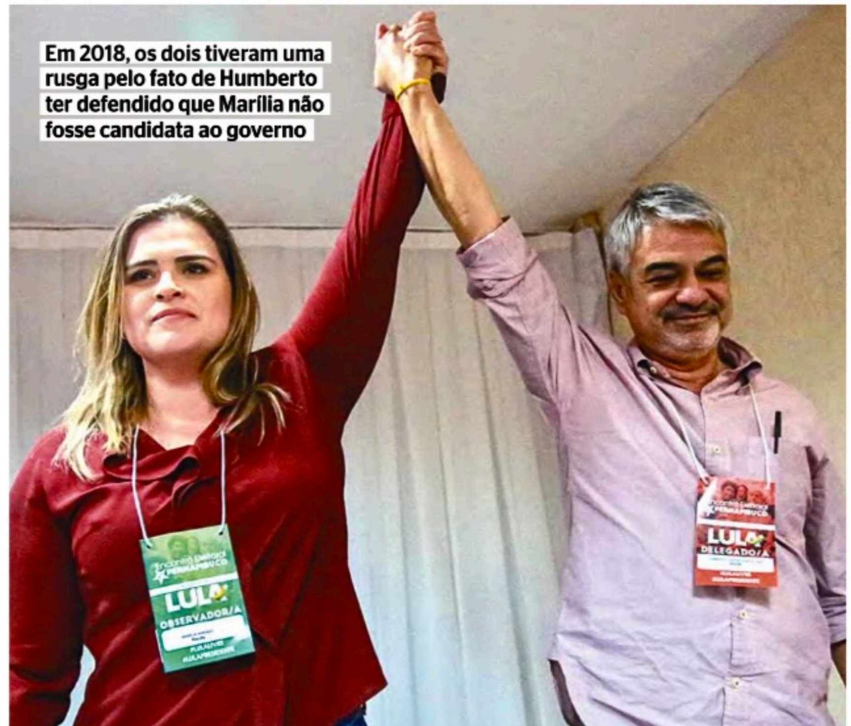
Em 2018, os dois tiveram uma rusga pelo fato de Humberto ter defendido que Marília não fosse candidata ao governo

REPUBLICANOS Aproveitando a janela partidária, o deputado federal Augusto Coutinho migrou do Solidariedade para o Republicanos, abrindo caminho para que Marília assumira a presidência da legenda. Em suas redes sociais, o republicano festejou. “Torno-me integrante da legenda, que está entre as que mais crescem no país, com a intenção de acrescentar ainda mais ao seu projeto e contribuir para que Pernambuco enfrente seus atuais desafios.”