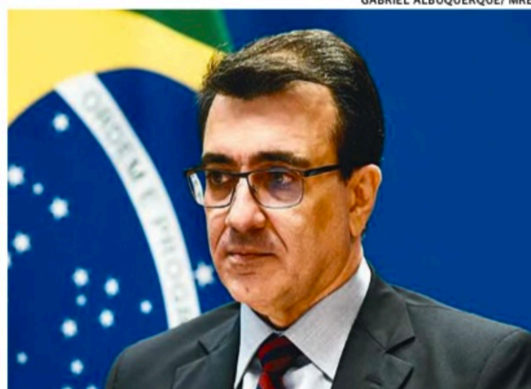
França: Brasil mantém um escritório de ajuda na Polônia

Outros nove ainda "tensionam sair da região" — dois são bebês recém-nascidos e estão na capital Kiev. França ainda ressaltou que o Brasil se mantém em uma postura equilibrada em relação ao conflito e diz que o fim da guerra depende de uma "diplomacia eficiente".