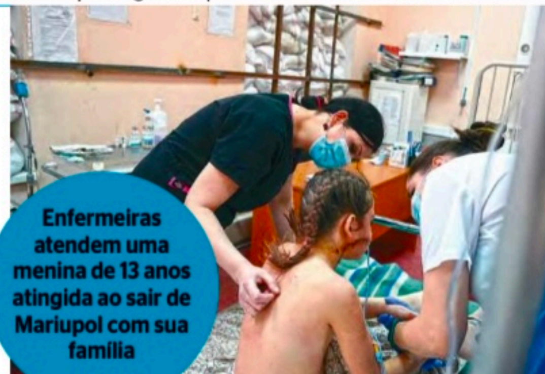
Enfermeiras atendem uma menina de 13 anos atingida ao sair de Mariupol com sua família

posso dizer é que não vimos o fornecimento de equipamento militar da China para a Rússia. Mas é claro que isso é algo que estamos acompanhando de perto", disse. ARMAS O porta-voz do Kremlin, Dmitry Peskov, afirmou que a Rússia só usará armas nucleares no contexto da guerra na Ucrânia se enfrentar uma "ameaça existencial". "Temos uma doutrina de segurança interna, e ela é pública, você pode ler nela todas as razões para o uso de ar-