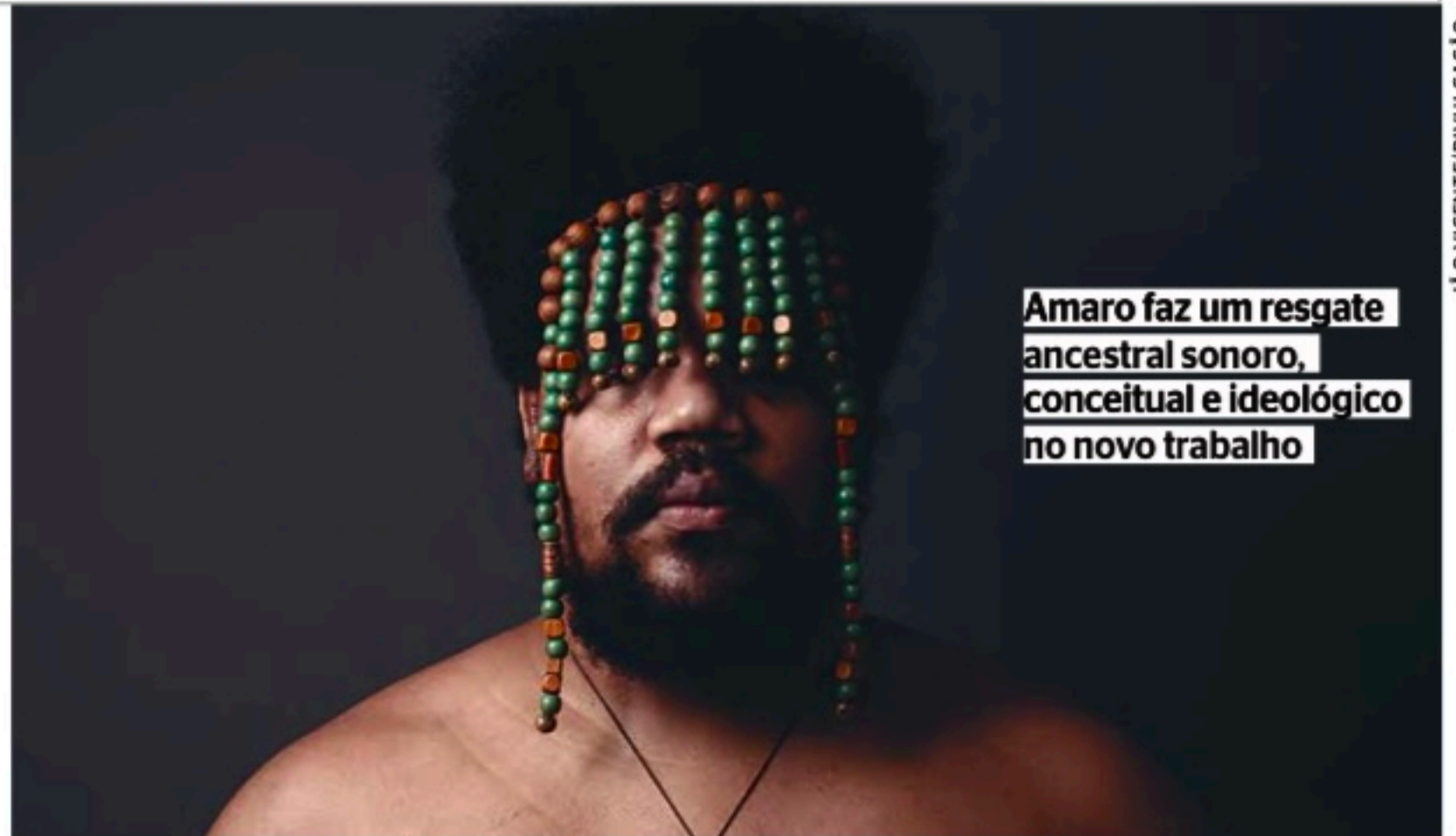
Amaro faz um resgate ancestral sonoro, conceitual e ideológico no novo trabalho

Nas palavras de Amaro, esse projeto é uma busca espiritual por histórias esquecidas, filosofias antigas e figuras inspiradoras do Brasil Negro. Ele declara que trabalhar vai muito além da teoria e prática de tocar piano. “Trabalhei para tentar entender meus ancestrais, meu lugar, minha história como homem negro. A história dos povos originários, das diversas etnias que ocuparam este território, de co-