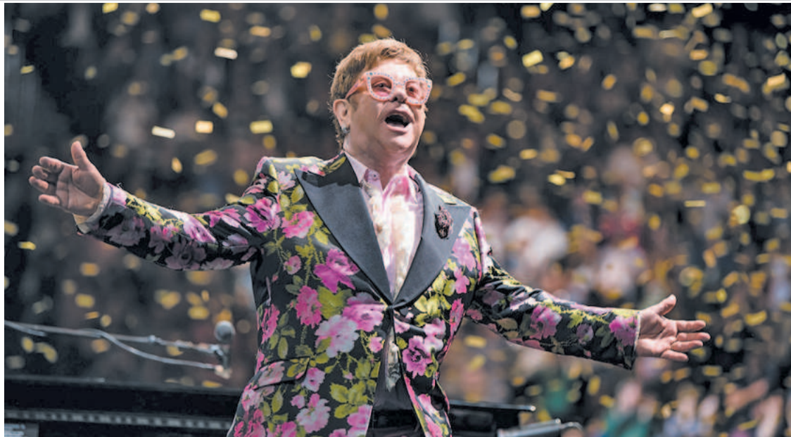
Elton lançou a turnê mundial de despedida, intitulada Farewell yellow brick road

turnê mundial de despedida chamada Farewell yellow brick road , garante que "a emoção de tocar ao vivo é tão fantástica quanto 50 anos atrás" e que tem "muito a transmitir para a próxima geração de fãs e artistas".