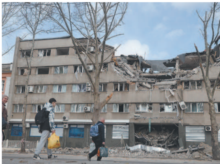
Conflito armado está reduzindo cidades a escombros

vre de armas nucleares de nosso Estado”, disse o líder em entrevista online, transmitida pelo canal de Telegram da administração presidencial ucraniana. “Estamos dispostos a aceitá-lo, mas não quero que seja mais um documento no estilo do Memorando de Budapeste”, acrescentou, referindo-se aos acordos assinados pela Rússia em 1994 que garantiam a integridade de três ex-repúblicas soviéticas, incluindo a Ucrânia, em troca de desistir das armas nucleares herdadas da URSS. (AFP)