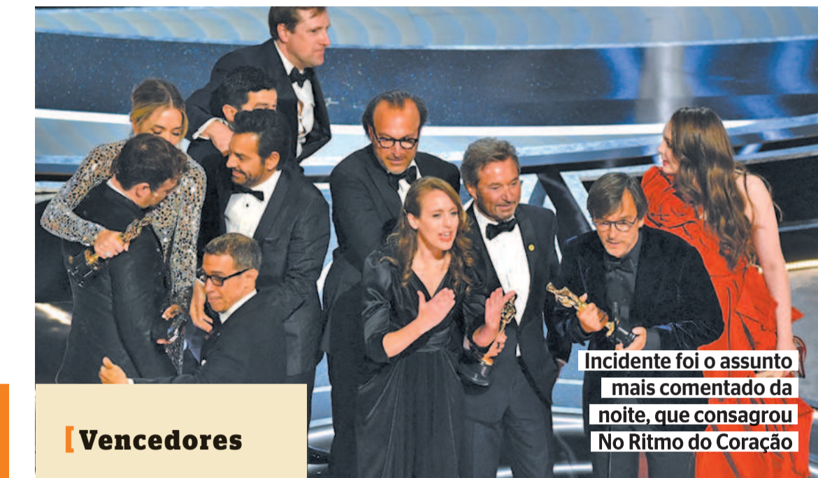
Incidente foi o assunto mais comentado da noite, que consagrou No Ritmo do Coração

A noite começou antes da cerimônia principal, com a primeira e mais controversa novidade na tentativa de dinamizar a cerimônia, com a decisão de entregar uma série de prêmios técnicos e os de curta-metragens antes da exibição ao vivo. Duna venceu a maior parte