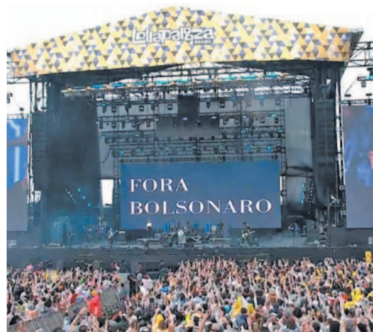
Banda Fresno exibiu um letreiro contra o presidente

Nas redes sociais, a cantora Anitta debochou do valor da multa, escrevendo “R$ 50 mil? Menos uma bolsa” (Com informações do Correio Braziliense)