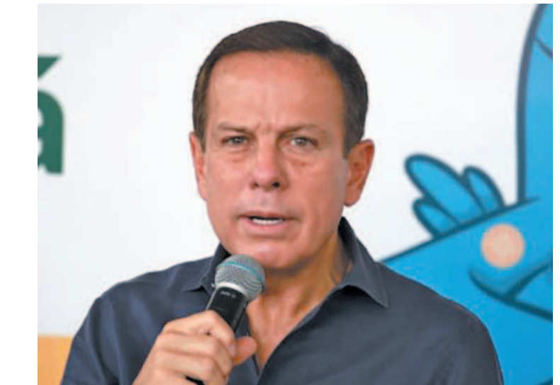
Político se pronunciou após solicitação de aliados

deral Aécio Neves (PSDB-MG), o grupo que faz oposição a Doria no PSDB acredita que pode reverter o resultado das prévias na convenção do partido, em junho. Segundo reportagem do jornal O Estado de S. Paulo, o “Dia do Fico” de Leite no PSDB seria uma estratégia que prevê a possibilidade de um acordo com o MDB e o União Brasil para o lançamento de uma candidatura única ao Planalto.