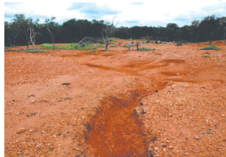
Meta do projeto é restaurar 200 hectares do semiárido