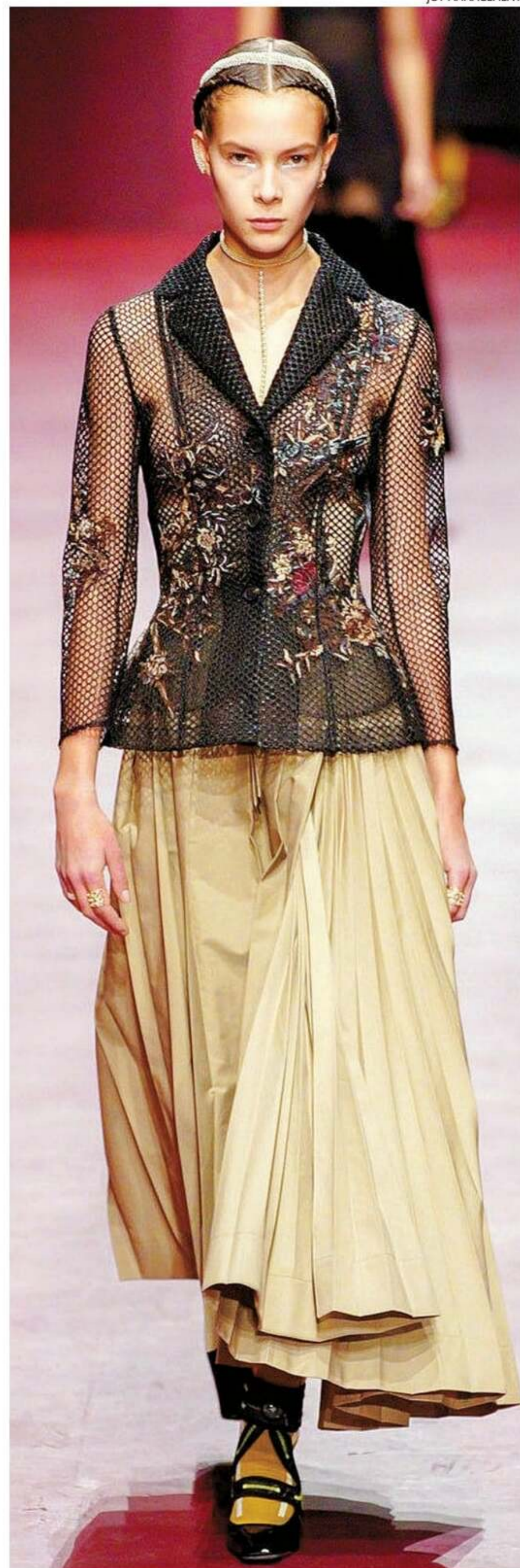
A modelo brasileira Taïssa Sperb, de 18 anos, foi eleita pela Dior para abrilhantar o desfile de inverno da grife, realizado em Paris