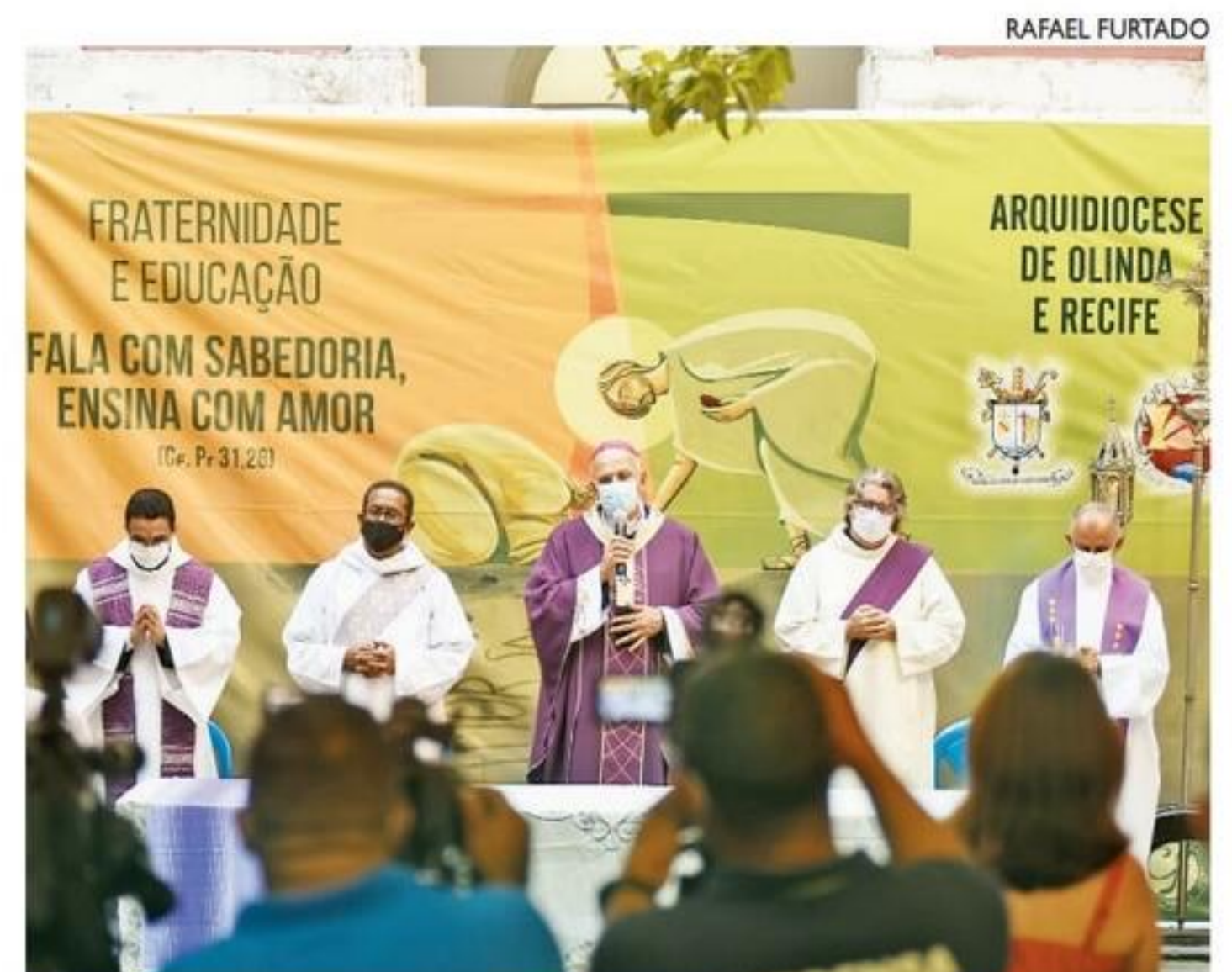
Missa de Cinzas foi conduzida por Dom Fernando Saburido

Para a Arquidiocese de Olinda e Recife, relacionar o tema da Campanha da Fraternidade ao local do lançamento tem o propósito de levar o fiel à reflexão para a conversão. Este ano, como o tema é voltado para a educação, o lançamento aconteceu na instituição de ensino Ginásio Pernambucano.