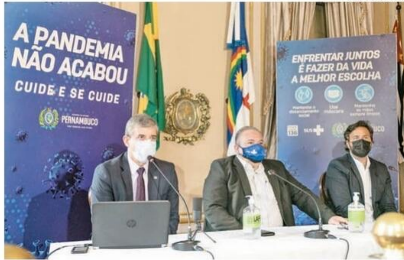
Secretários detalharam flexibilização e apresentaram dados sobre a Covid

Em 2021, Pernambuco também registrou a segunda menor taxa de mortalidade do País, com 112,9 óbitos por 100 mil habitantes. No acumulado entre 2020 e 2022, segun-