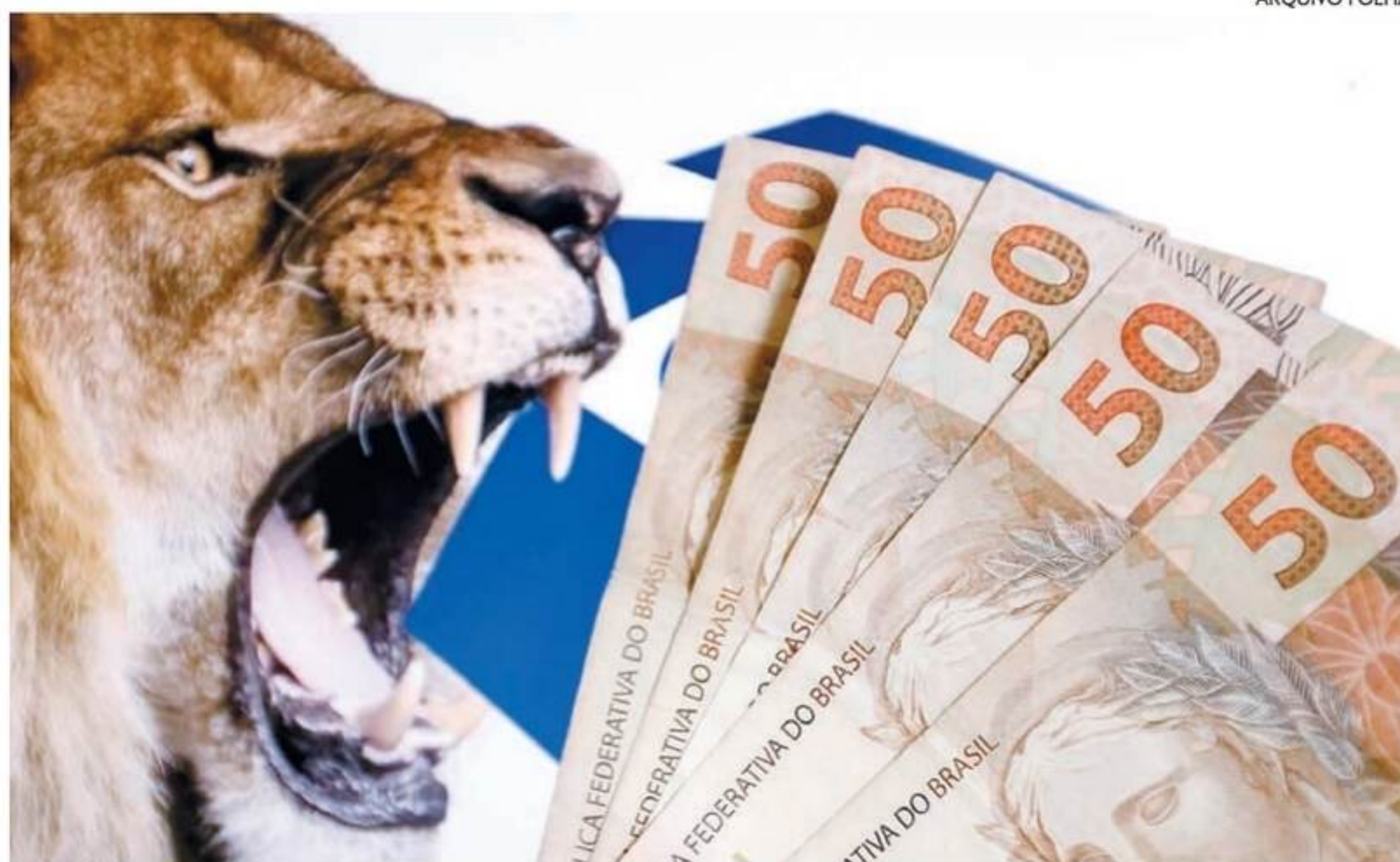
Além de receber dinheiro de volta, a prestação de contas serve como comprovante para acessar crédito

A retenção nada mais é do que uma antecipação do pagamento do tributo. Por exemplo, um funcionário que recebe R$ 10 mil de salário por mês deveria, ao fim de um ano completo, pagar uma taxa sobre o que ganhou nos últimos 12 meses.