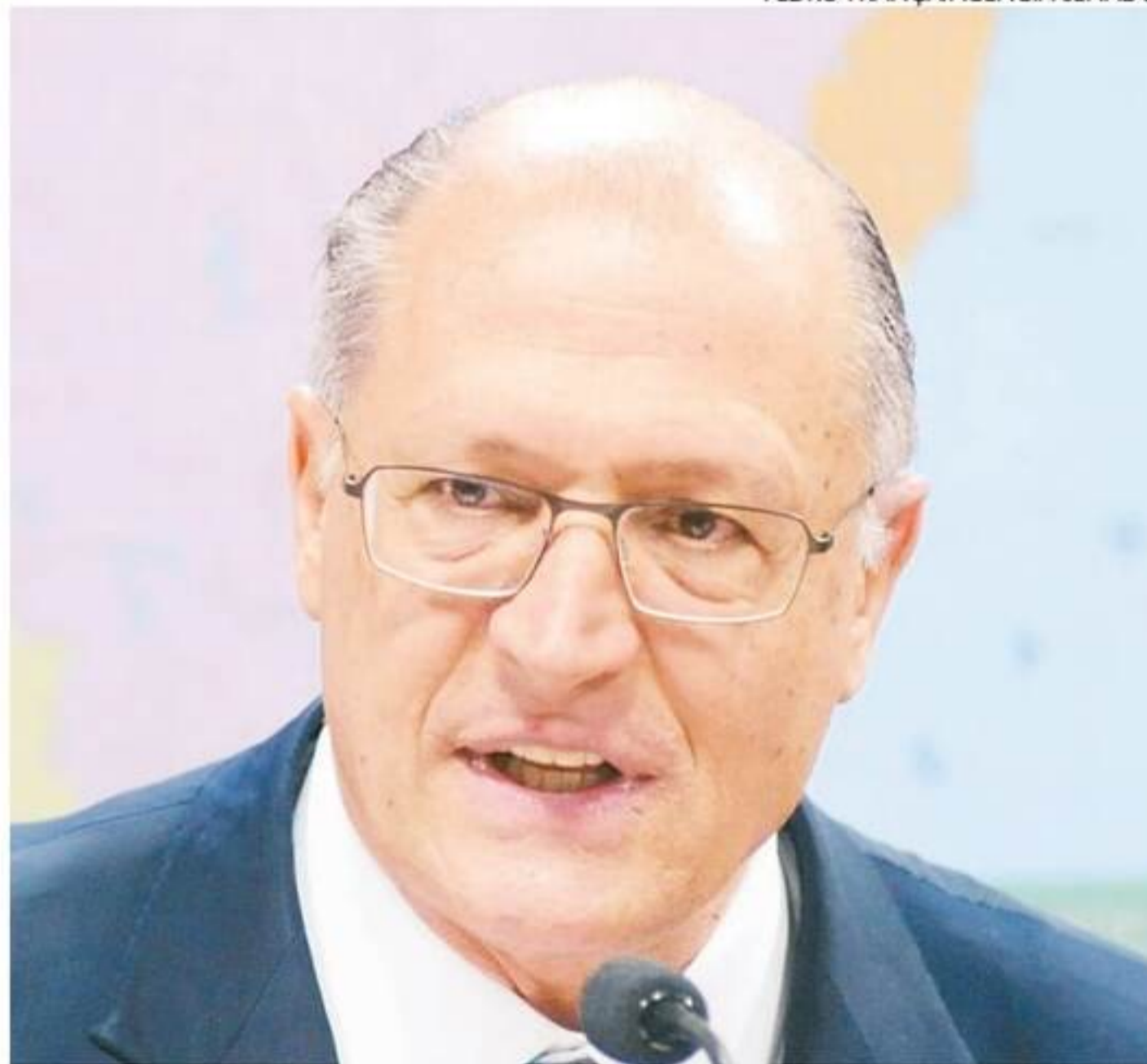
Provável vice de Lula, Alckmin ainda não definiu o seu futuro partido