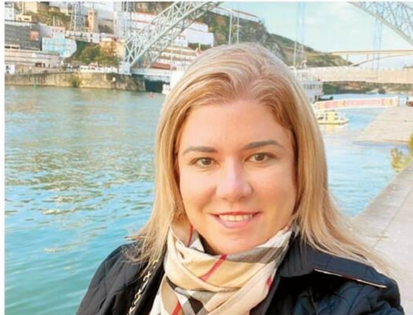
A juíza Ana Cláudia Brandão é destaque na 14ª Conferência Mundial de Bioética e Direito da Saúde da World Medical Association