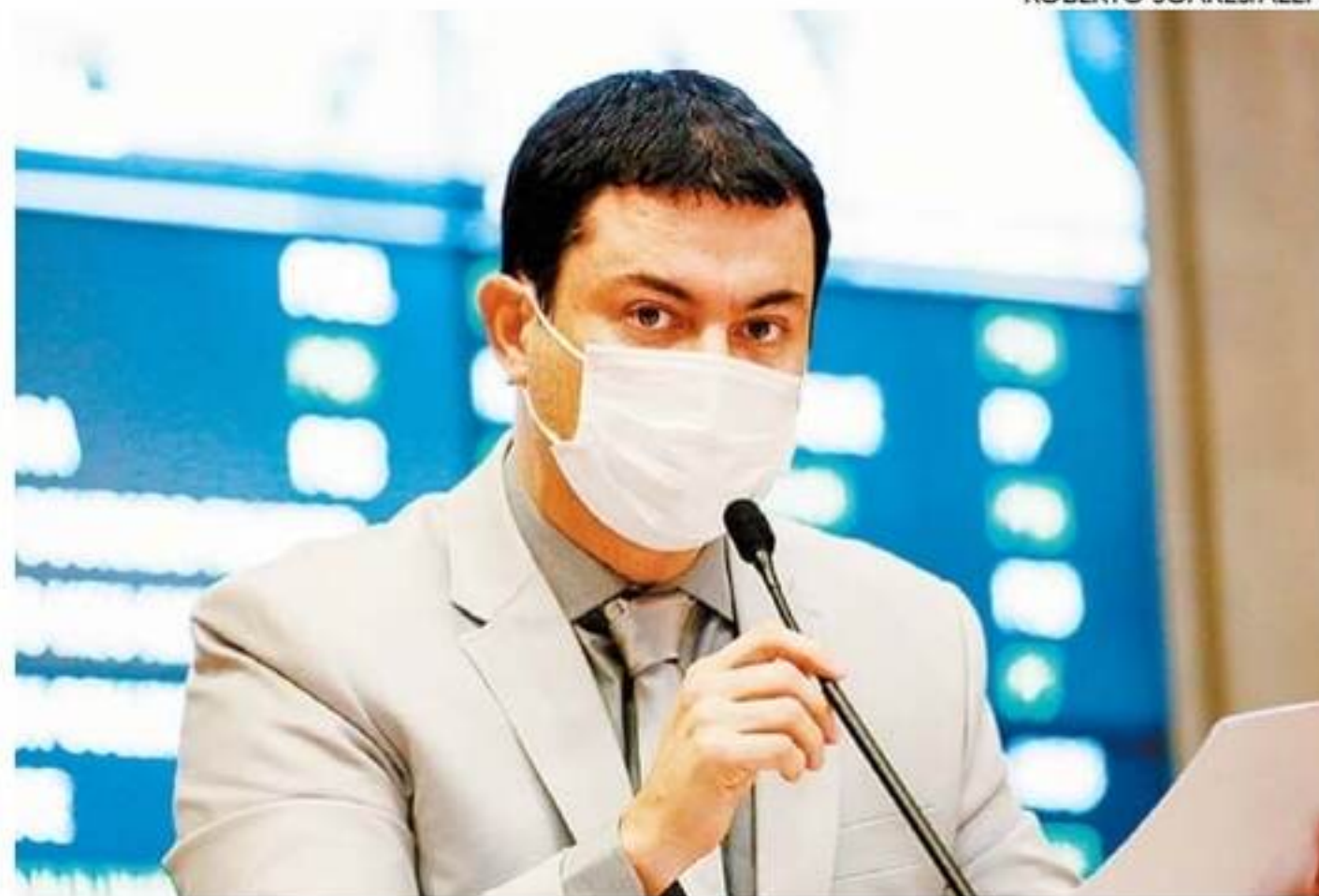
Magalhães está nas últimas tratativas com o diretório nacional do PV