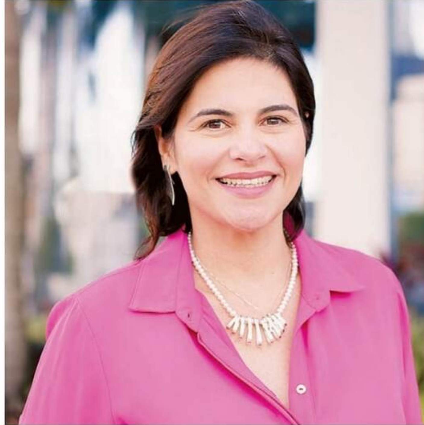
A deputada estadual Priscila Krause, referência na política por sua trajetória e por ocupar este espaço majoritariamente masculino