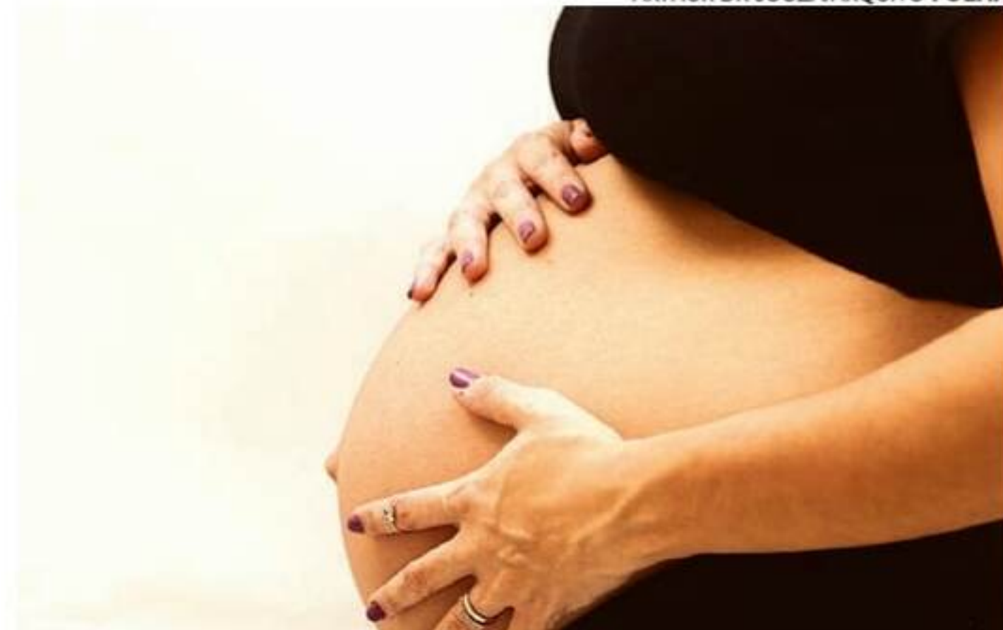
Ajuda de R$ 65 será paga a mulheres inscritas no CadÚnico