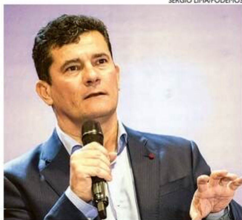
Moro admite conversas com MDB, União e PSDB

A coluna de Renata Bezerra de Melo é publicada de terça a sábado.