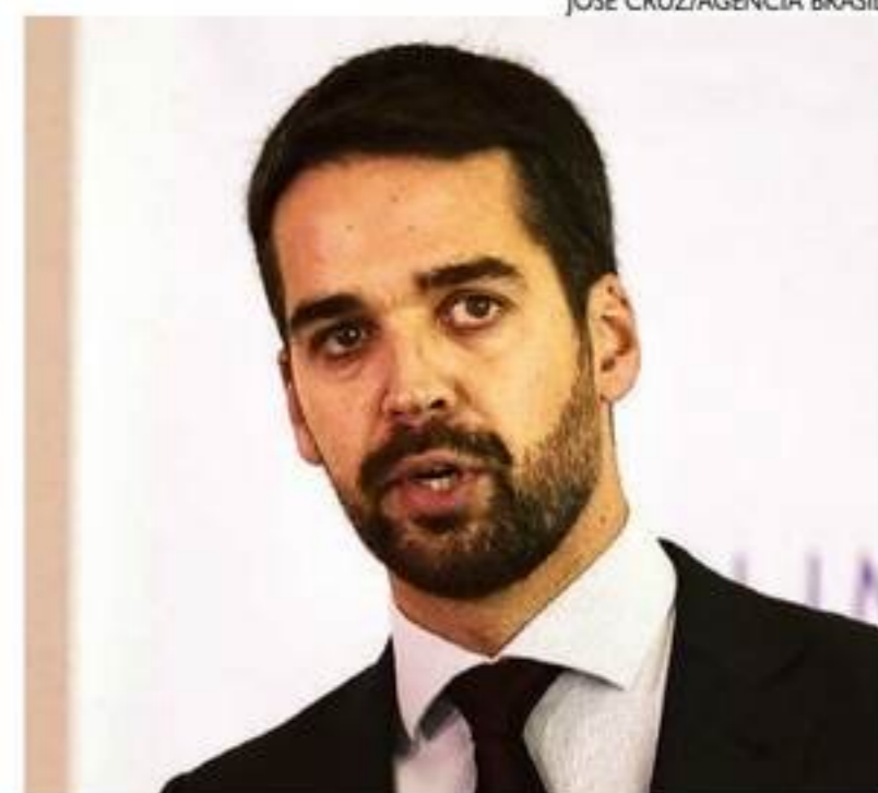
Eduardo Leite também busca atrair o União Brasil

■ Pré-candidatos buscam partidos para se fortalecer e criar uma unidade em torno de seus projetos, enquanto tese de candidatura única ganha força