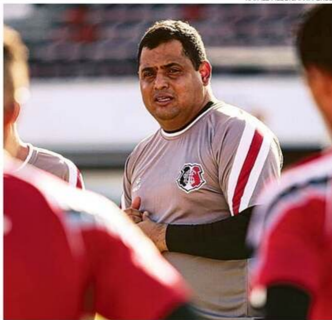
Tricolor de Leston Júnior chega à partida dependendo das próprias forças