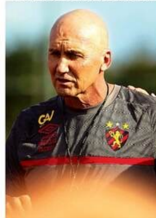
Partida marcará a estreia de Dal Pozzo no comando do Leão