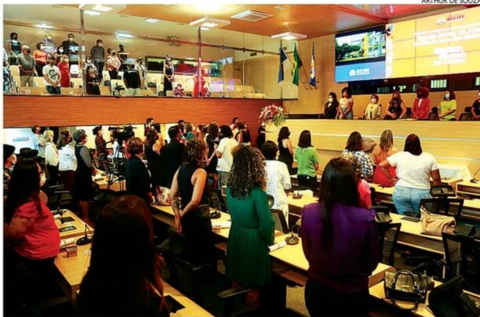
Sessão solene garantiu que o plenário da Casa e as 39 cadeiras fossem ocupadas somente por mulheres

A parlamentar ainda destacou que os "graus de subalternidade e não inclusão" são ainda maiores no caso das mulheres negras, periféricas e LGBTQIA+.