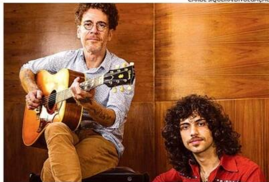
No palco, pai e filho farão releituras de músicas como "Relicário"

Ingressos adquiridos para as datas em que o show foi remarcado seguem válidos para a apresentação de logo mais. Acesso também a partir de R$ 60.