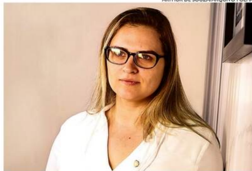
Após vários embates com grupos petistas, Marília pode mudar de sigla