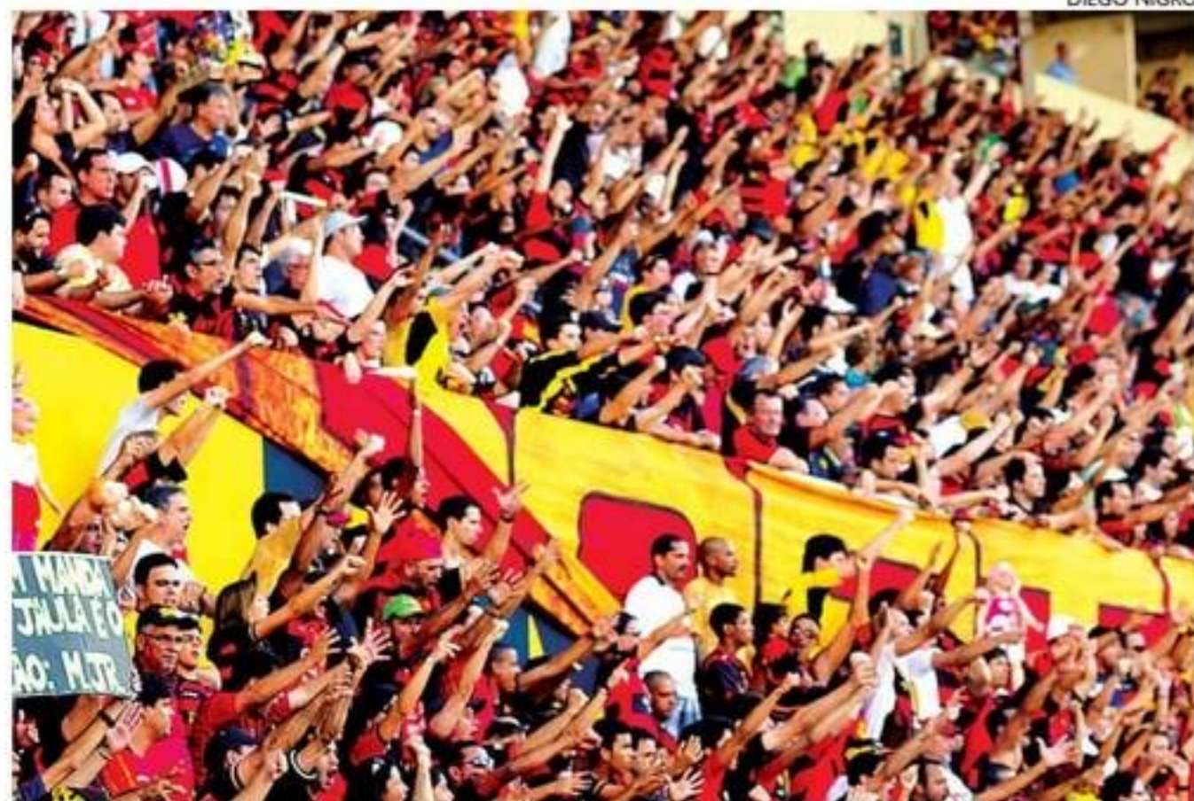
Ilha, que recebeu último jogo em 10 de fevereiro, poderá ter até 9,3 mil pessoas

LOTERIAS QUINA 5805 03 07 37 63 68 || LOTOFÁCIL 2473 01 04 06 07 08 09 10 14 16 18 19 20 21 23 25 || TIMEMANIA 1761 06 25 26 27 30 58 73 Time do Coração CRB/AL DIA DE SORTE 580 09 13 18 19 21 22 25 Mês da sorte: Maio DUPLA SENA 2347 1º sorteio: 25 33 37 41 44 50 2º sorteio: 18 25 27 36 44 48 ||