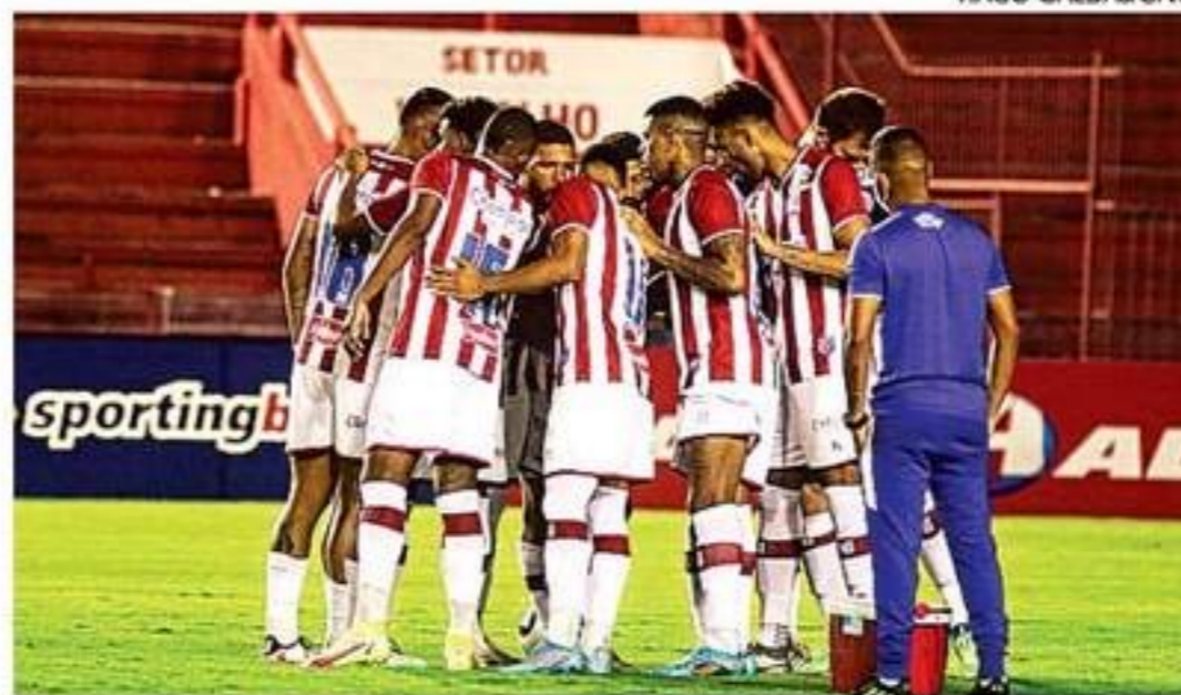
Caso perca jogo, Alvirrubro dependerá de combinação de resultados

Empatando, o Náutico só conquistará a classificação se pelo menos dois de quatro clubes tropeçarem. São eles Botafogo/PB