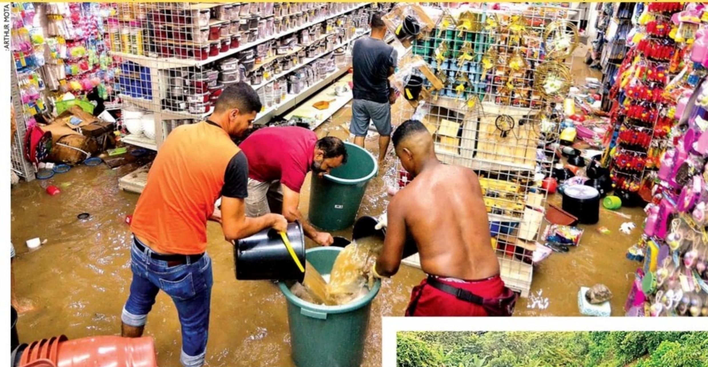
Em São Lourenço, mercadinho ficou inundado. Em Camaragibe (detalhe), barreira deslizou e deixou um morto. Próximo trimestre será de chuva acima da média