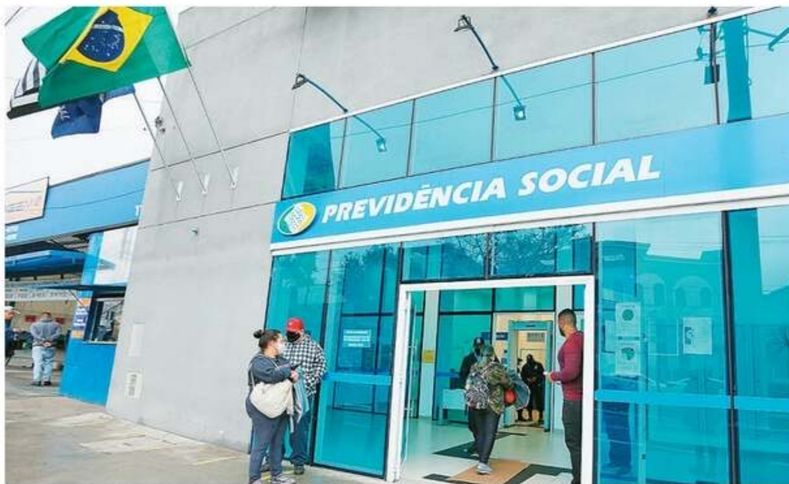
Os segurados do INSS vão poder consultar se têm valores judiciais a receber a partir do dia 11 de abril

O montante faz parte de uma liberação feita pelo Conselho da Justiça Federal (CJF), que direcionou R$ 1,3 bilhão em todo o Brasil para quitação de dívidas previdenciárias e assistenciais, como revisões de aposentadorias, auxílio-doença, pensões e outros benefícios, que somam 69.732 processos, com 89.708 beneficiários.