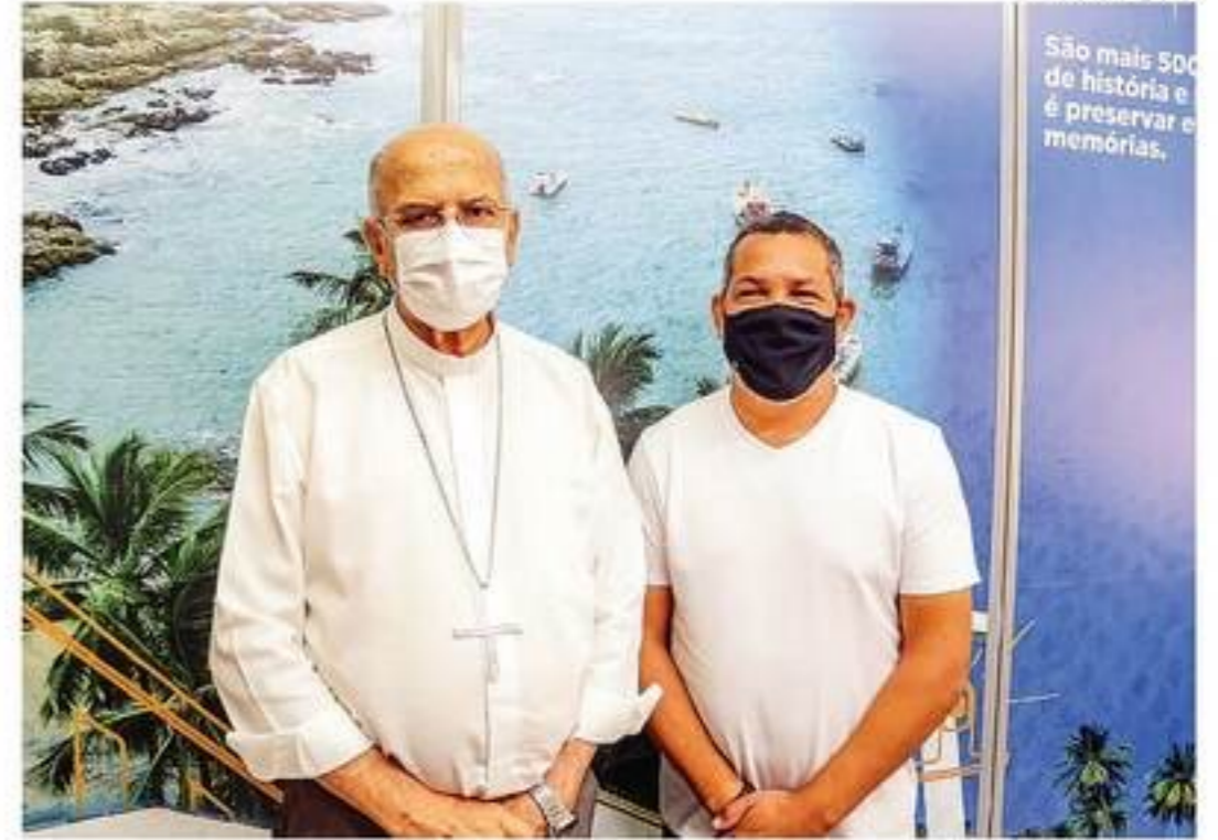
Instalação da imagem foi discutida em encontro de prefeito e arcebispo