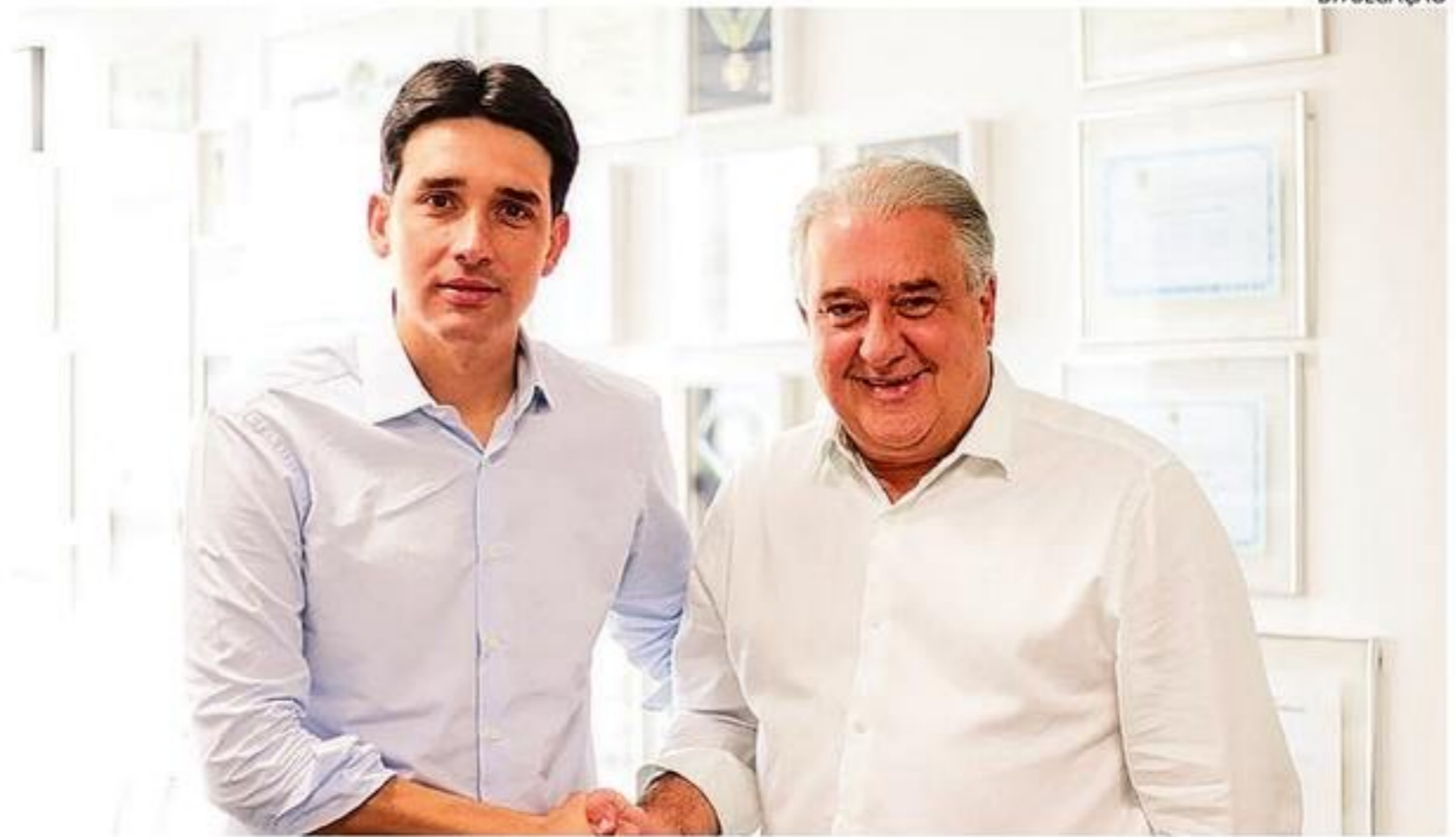
Ontem, após anos de filiação ao Solidariedade, Coutinho (D) uniu-se ao Republicanos de Silvio Costa Filho

A coluna de Edmar Lyra é publicada de segunda a sábado.