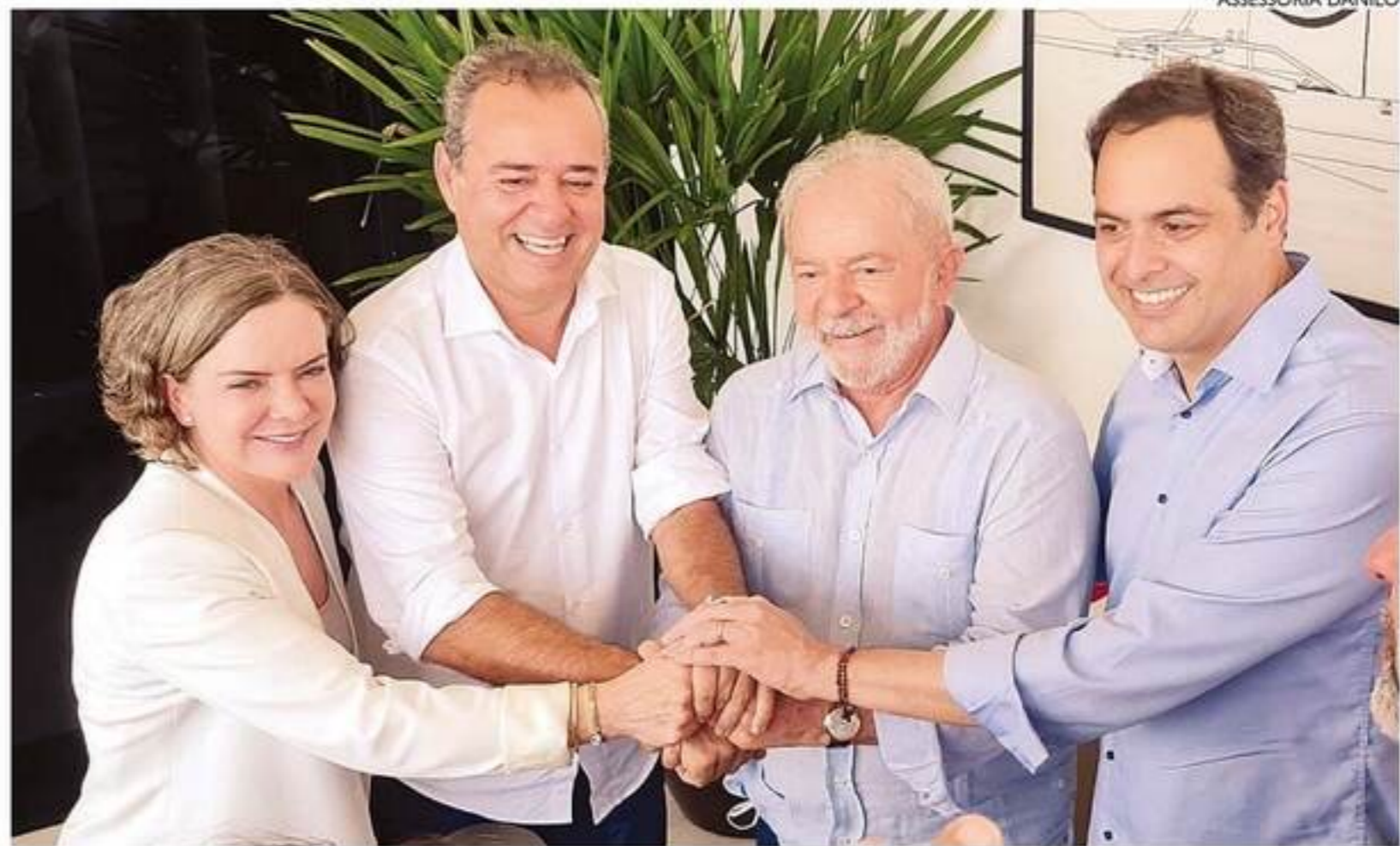
Paulo Câmara e Gleisi Hoffmann também estiveram na cerimônia com Lula e Danilo Cabral

INOCENTE QUER SABER > Sem o aval de Lula e disputando por uma legenda nanica, Marília Arraes corre o risco de desidratar durante a eleição?