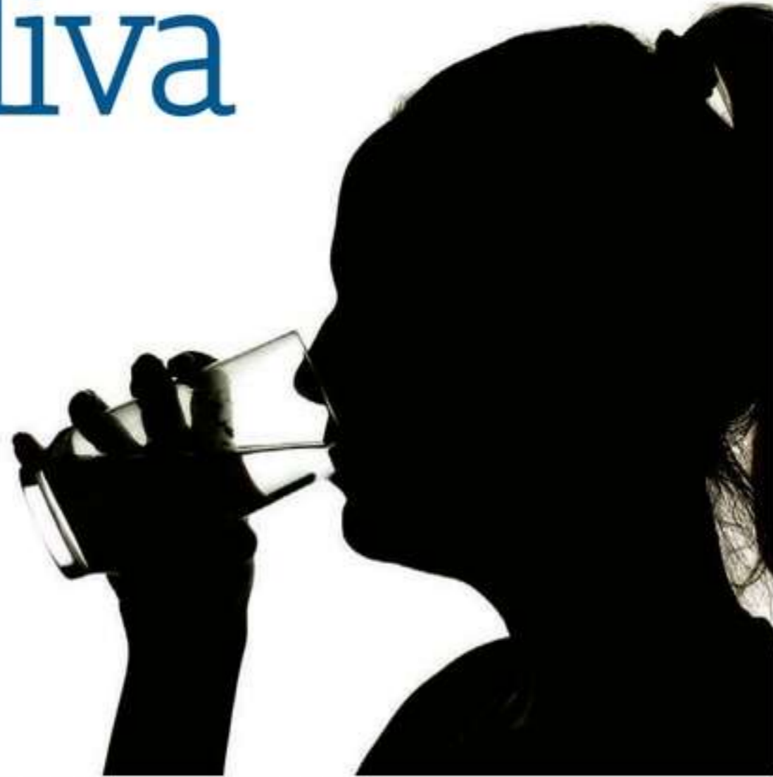
Beber água é uma das formas de lubrificar a boca

Com causas diversas, a boca seca afeta uma em cada quatro pessoas, de acordo com estudo