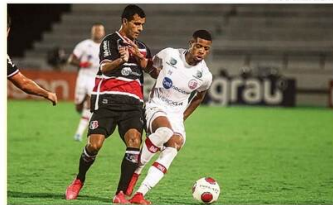
Válido pela semifinal, Náutico x Santa Cruz ocorrerá dia 2 de abril