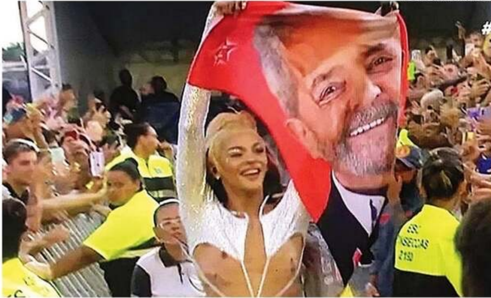
Pablo Vittar entoou "Fora Bolsonaro" e levantou uma toalha com o rosto do ex-presidente Lula

■ Após ministro do TSE proibir manifestações políticas no festival, encerrado ontem em São Paulo, artistas reagem e ignoram decisão