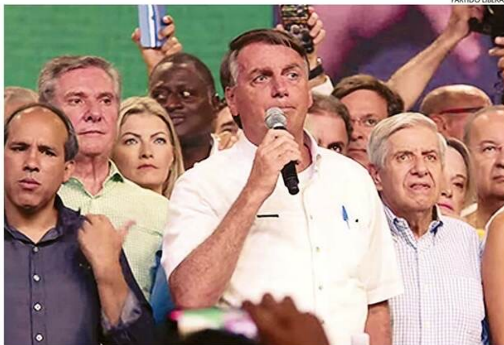
Durante a cerimônia, o presidente Bolsonaro disse que a próxima eleição será luta "do bem contra o mal"

afirmou que todos podem errar e merecem uma segunda chance.