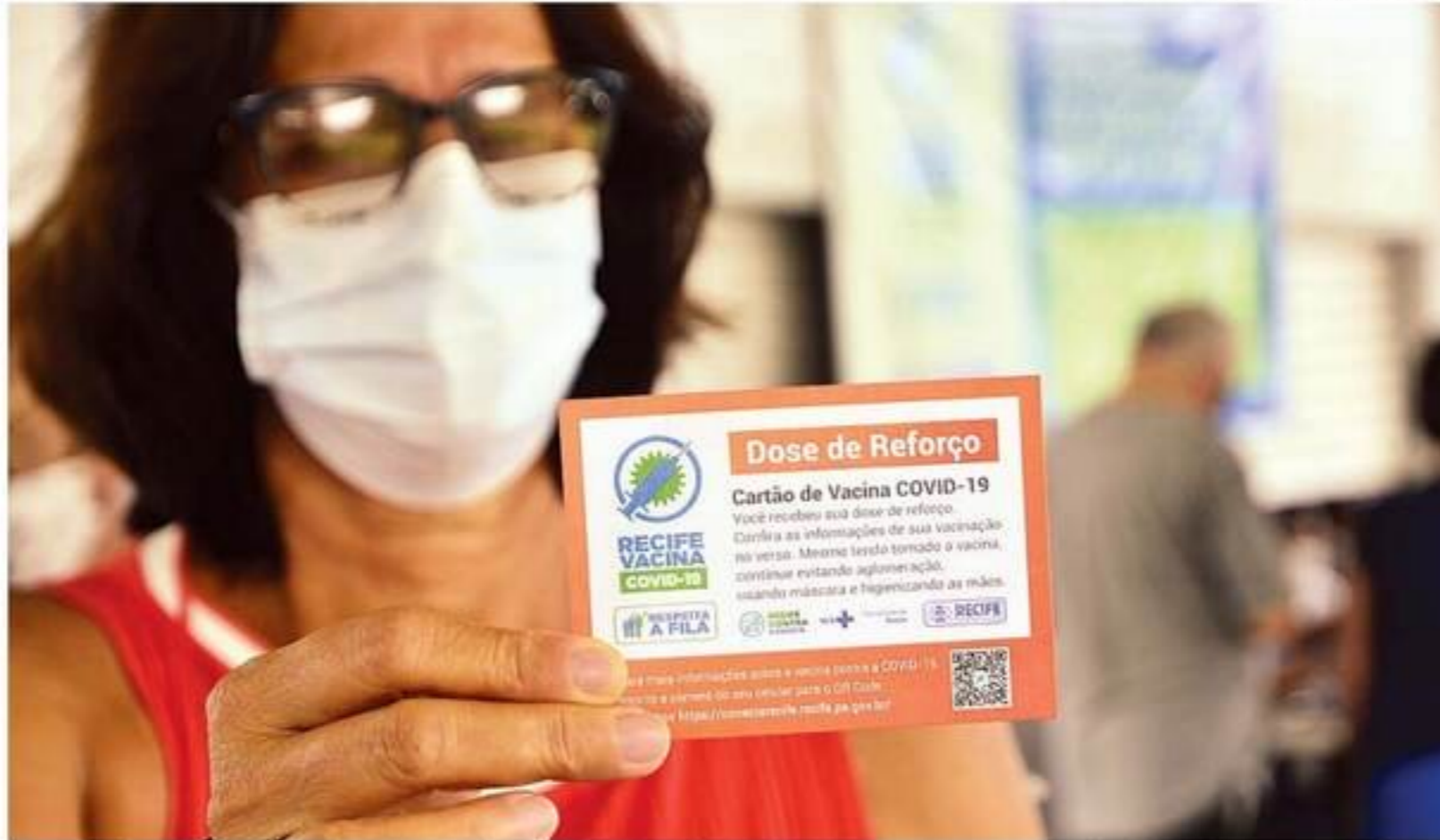
Pernambuco autorizou aplicação da 2ª dose de reforço da vacina contra a Covid-19 na última sexta-feira

A campanha de vacinação contra a Covid-19 chega a uma nova fase em diferentes municípios pernambucanos, que passam a aplicar a segunda dose de reforço (também chamada de quarta dose) em idosos a partir de 65 anos. Para ser imunizado, é preciso ter tomado a terceira dose há pelo menos quatro meses. As cidades de Camaragibe, Ipojuca e Jaboatão dos Guararapes iniciam hoje a imunização para este público. Já a capital pernambucana e o Cabo de Santo Agostinho começam amanhã a nova etapa de vacinação. A cidade de Olinda começou a nova fase no sábado.