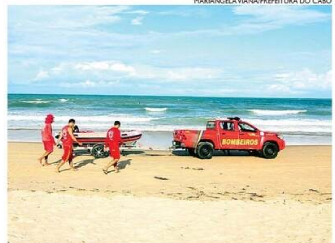
Ocorrência foi registrada na praia de Enseada dos Corais

Por meio de nota, o Corpo de Bombeiros informou que foi acionado por volta das 9h e iniciou os trabalhos no local da ocorrência. Grupo Tático Aéreo (GTA) e a Capitania dos Portos reforçam as buscas.