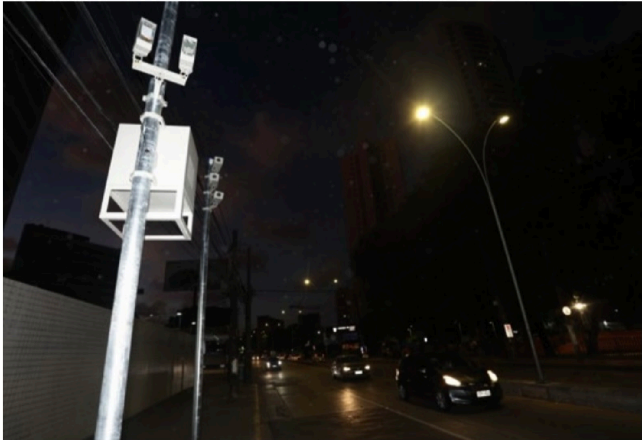
FLAGRANTE Avenidas da capital com mais vítimas fatais ganharam, na semana passada, novos equipamentos para notificar as infrações

A taxa de mortalidade por sinistros de trânsito também apresentou redução na capital pernambucana. Em 2020, foi de 6,59 mortes por 100 mil habitantes, um índice bem abaixo da média nacional, de 14,7 mortes/100 mil habitantes (segundo dados preliminares do DataSus).