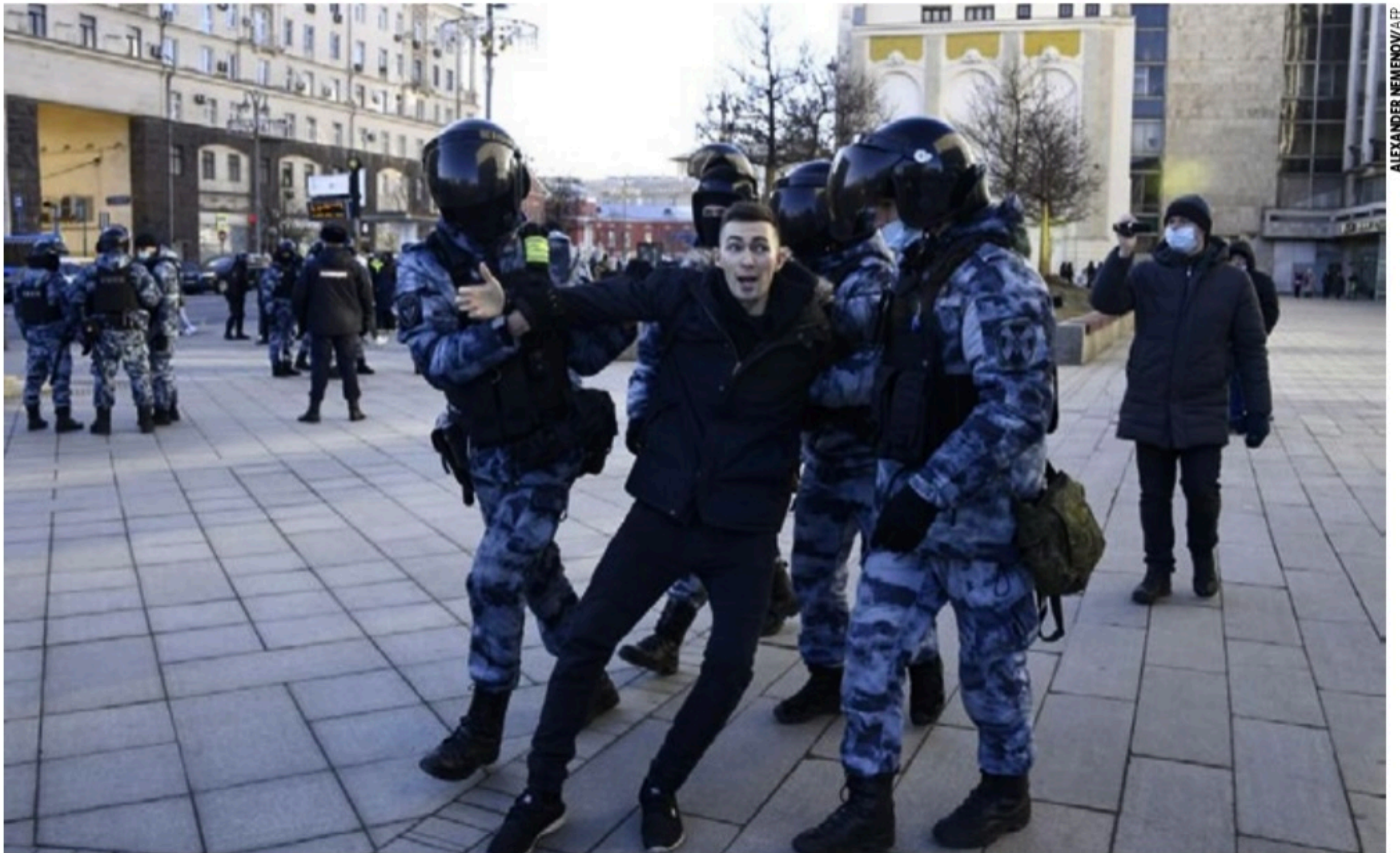
REPRESSÃO EM CASA Segundo o governo russo, cerca de 2.500 pessoas se manifestaram em Moscou, das quais 1.700 foram presas; manifestos são contra a invasão na Ucrânia

Putin também pediu o reconhecimento da soberania russa sobre a Crimeia (que Moscou anexou em 2014) e da independência dos territórios de língua russa do Donbass (leste da Ucrânia). As exigên-