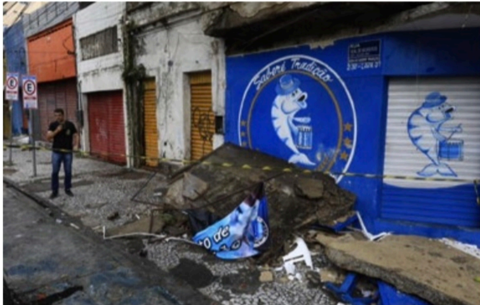
DESESPERO Diretores almoçavam na sede do bloco Saberé Tradição, bairro de São José, no momento do acidente

A equipe da TV Jornal, que esteve no local da tragédia, informou que logo cedo dois peritos do Instituto de Criminalística (IC) fizeram o registro do concreto na calçada. Há muitos tijolos, fiação solta, cinco cadeiras e duas mesas. Os peritos saíram da sede sem dar entrevista, mas de acordo com eles, o que possivelmente pode ter ocorrido é que parte