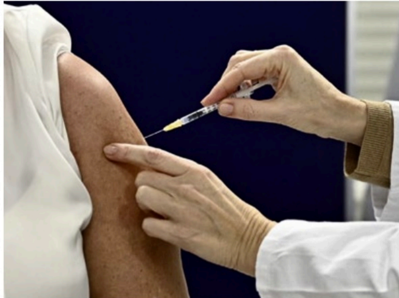
PRIORITÁRIOS Rede pública tem meta de imunizar contra gripe os grupos de risco, como idosos e crianças

Também estão sendo contabilizados sete óbitos, ocorridos entre os dias 03 de abril de 2021 e 04 de março deste ano. Com isso, o Estado totaliza 21.151 mortes pela covid-19.