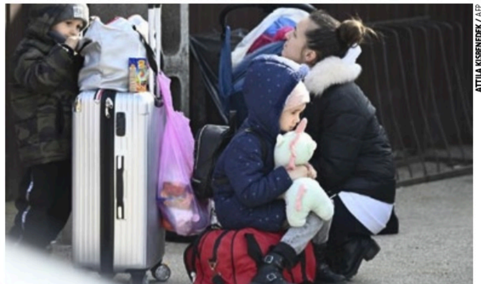
CRISE HUMANITÁRIA Maioria dos refugiados é formada por mulheres com crianças, afirma a ONU

A Polônia é o país que recebeu o maior número de refugiados, a maioria mulheres e crianças, pois os homens em idade de combater não podem abandonar o país. Segundo os guardas fronteiriços poloneses, 964 mil refugiados entraram no