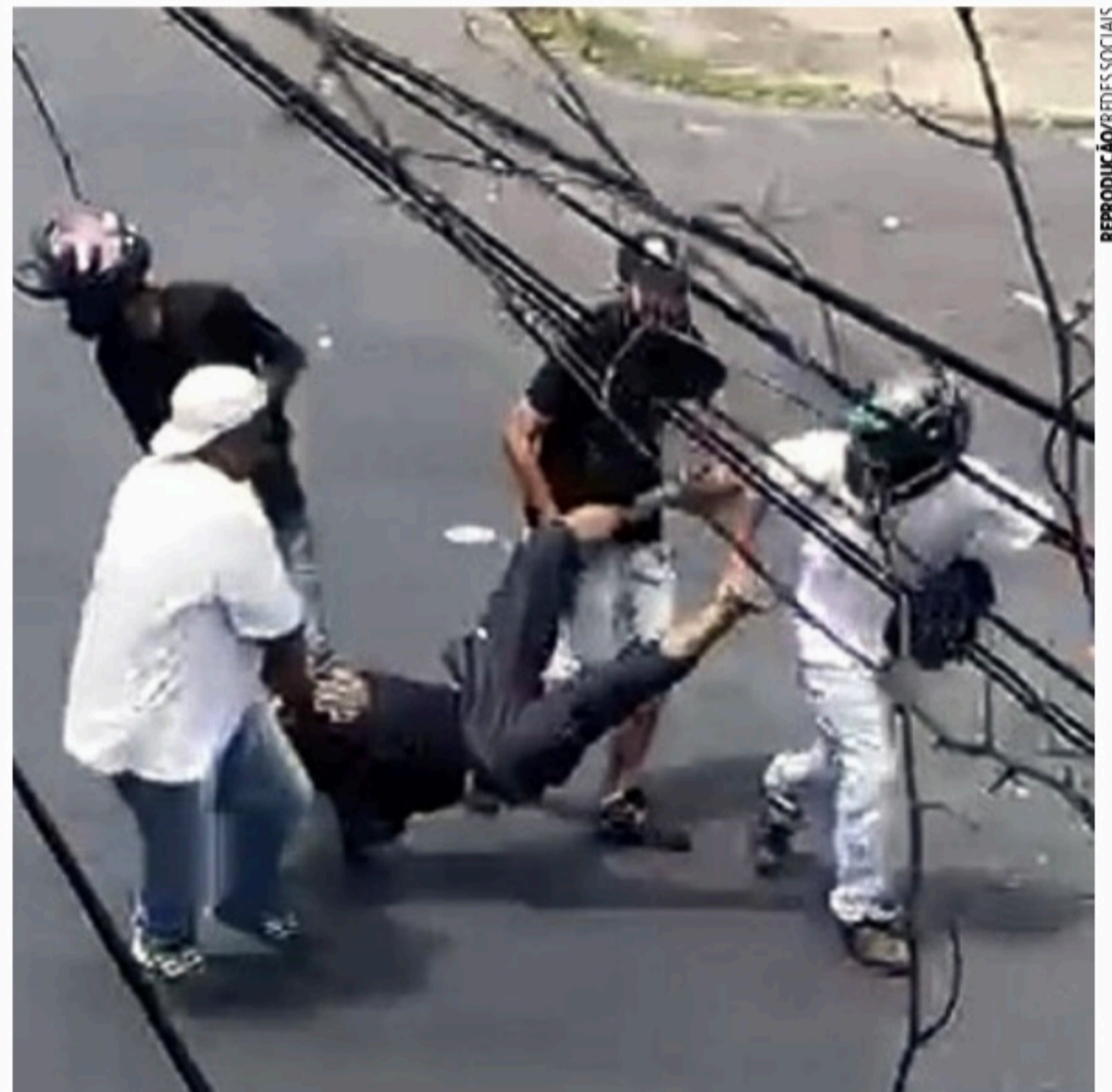
BELO HORIZONTE Brigas antes de Atlético-MG x Cruzeiro terminam com uma morte e vários feridos

O bairro Boa Vista, na Região Leste de Belo Horizonte, virou um palco de guerra entre torcedores de Atlético-MG e Cruzeiro na manhã deste domingo. O clássico ocorreu às 18h.