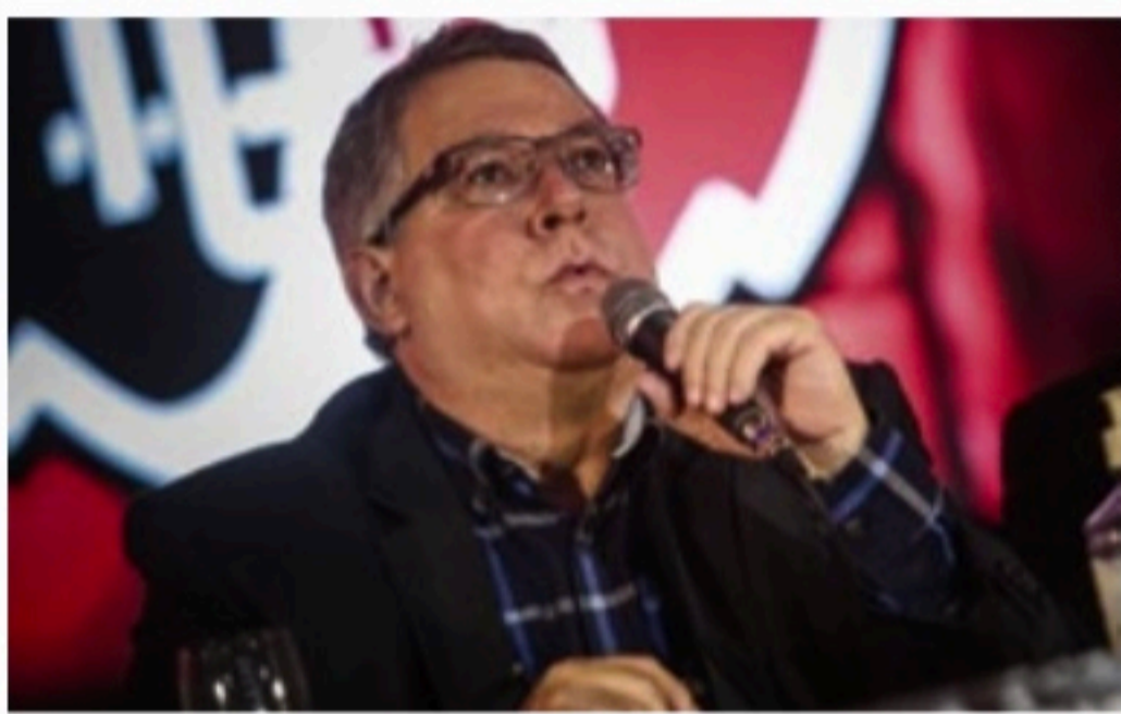
EX-PRESIDENTE Joaquim Bezerra entregou o cargo no último sábado