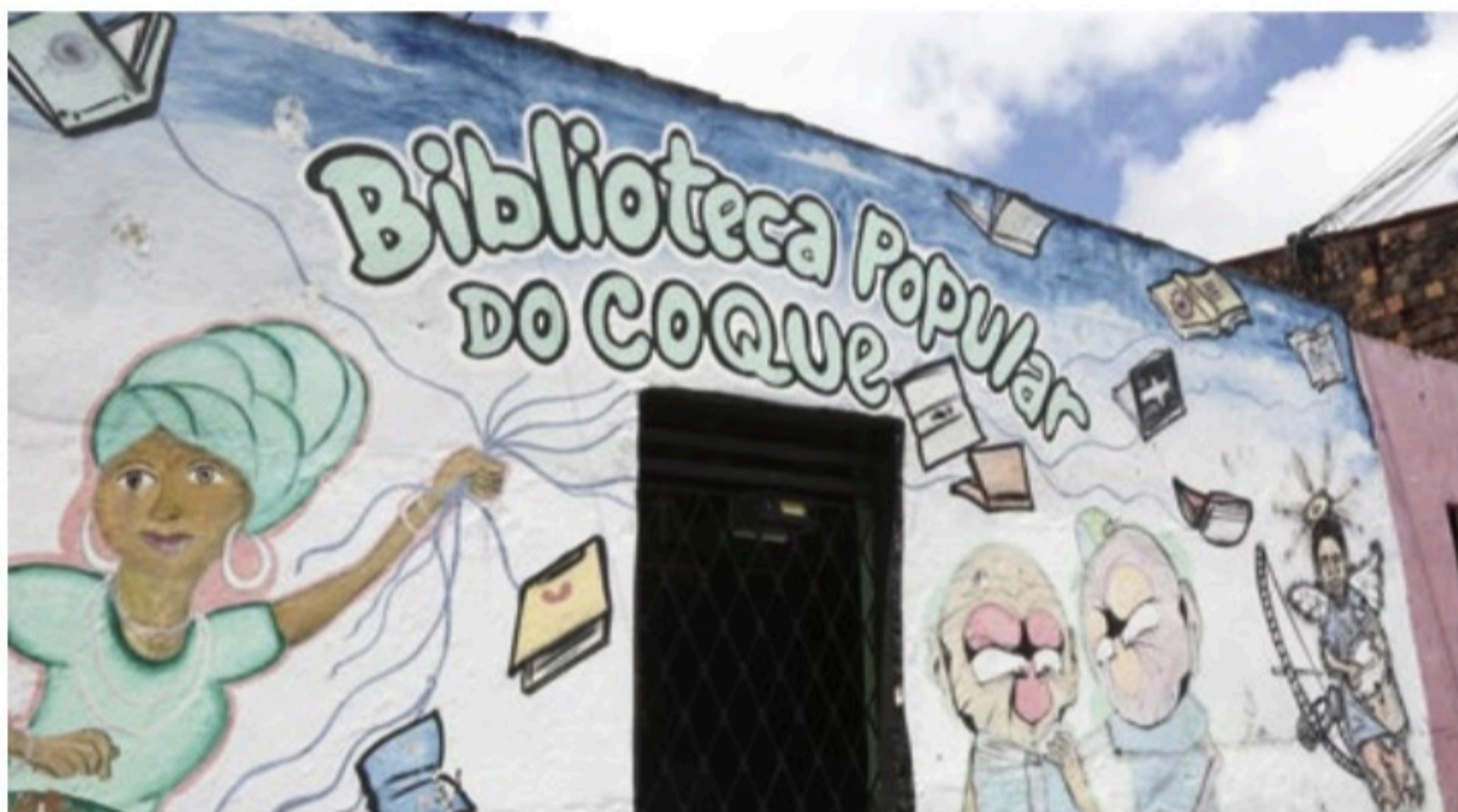
INICIATIVA Em Pernambuco, pesquisa do Itaú Cultural mapeou nove projetos de leitura; entre eles, a Biblioteca Popular do Coque, no Recife

Quando se analisa outros cenários de recursos, apenas 31,94% vêm de instituições públicas, e 24,61% recebem aporte das privadas. "A grande maioria das outras contribuições, de onde eles vão buscar esses recursos, vêm de editais de incentivo à leitura ou de renda arrecadada por