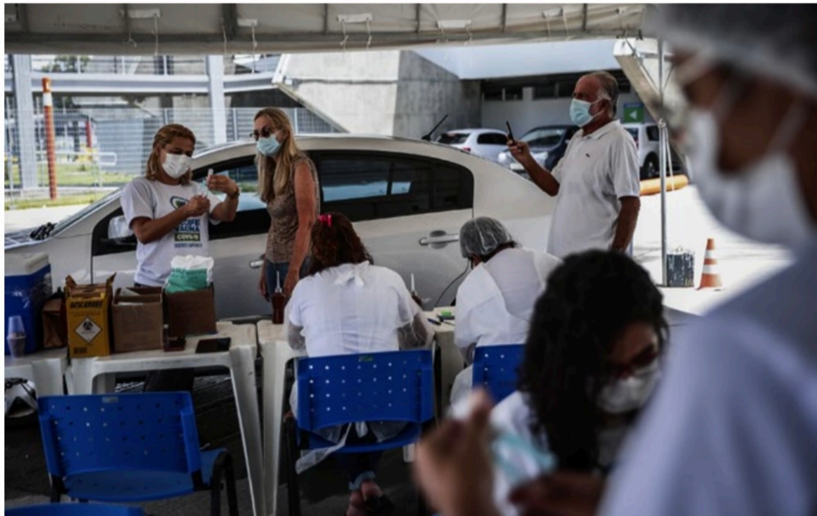
IMUNIZAÇÃO País tem 173 milhões de pessoas com a primeira dose (80,5% da população) e 155,7 milhões com a segunda dose ou o imunizante de dose única (72,5%)

Os dados sobre imunização são apresentados diariamente no boletim da Secretaria Estadual de Saúde (SES) e disponibilizados no Painel de Acompanhamento Vacinal de Pernambuco. Segundo os números, Pernambuco já aplicou 17.212.729 doses de vacinas contra a covid-19 na popula-