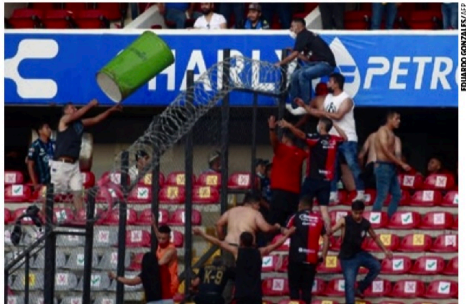
VÂNDALOS Torcedores de Querétaro e Atlas invadiram o campo, provocando brigas generalizadas

"Como instituição, condenamos a violência", afirmou o Querétaro.