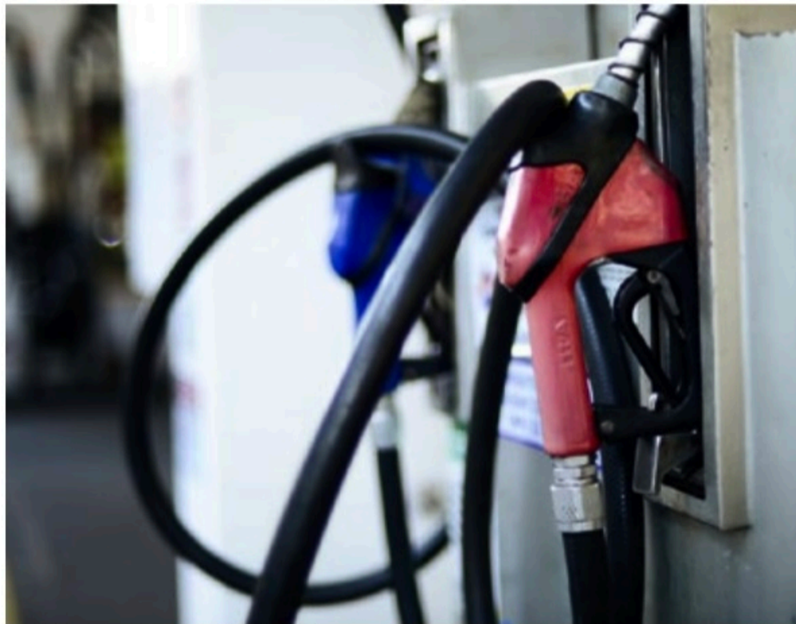
PREJUÍZOS Guerra russa na Ucrânia pressiona o preço do petróleo e reajustes devem pesar nas bombas

to tira a credibilidade da Petrobras e geraria prejuízo, e os administradores da empresa poderiam ser penalizados criminalmente. Por outro lado, o subsídio poderia fazer com o dinheiro para bancar o aporte desaparecesse rapidamente, sem grande impacto, por conta da alta do preço do petróleo no mercado internacional. Ou seja, a população não seria beneficiada, apesar do custo fis-