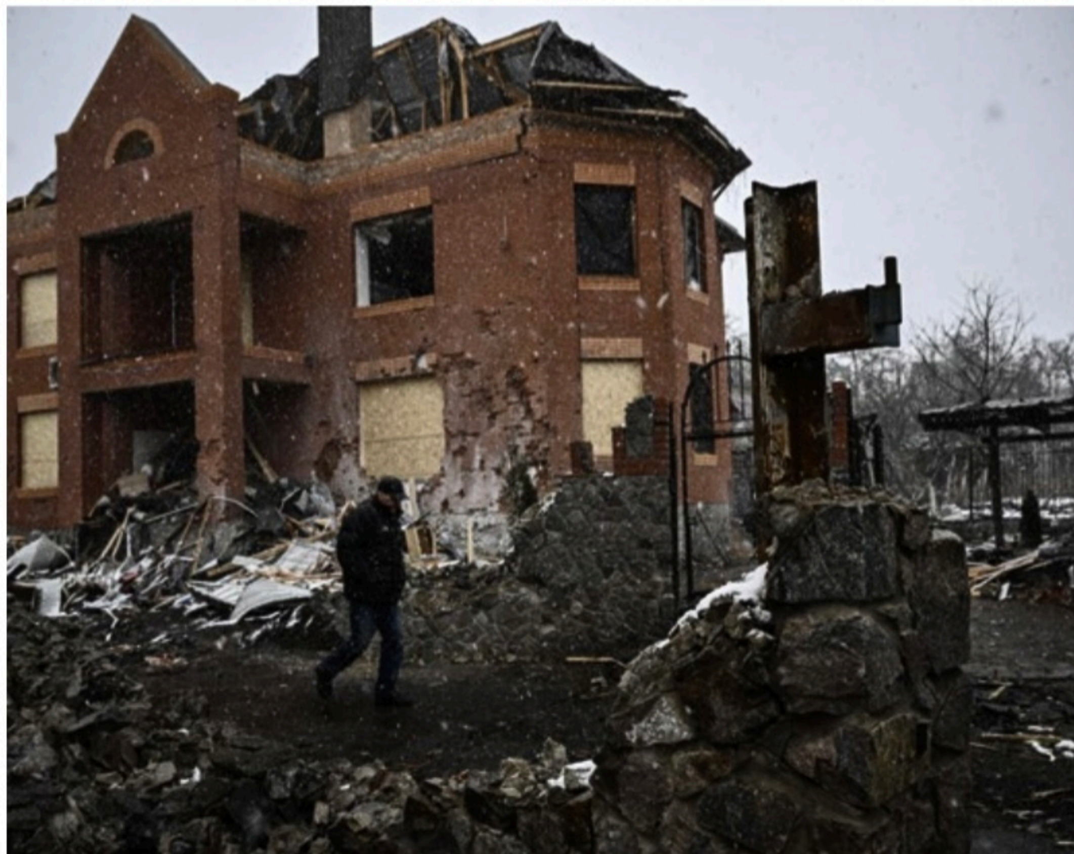
SEM BOMBAS Rússia deu um dia de trégua ontem e promete não fazer novos ataques hoje para permitir que refugiados deixem a Ucrânia

Estas informações confirmam as dificuldades de um exército russo superpotente no papel, mas que vem sendo confrontado desde o início da invasão por uma dura resistência ucraniana e que apresenta muitas dificuldades de comando, estratégia e abastecimento.