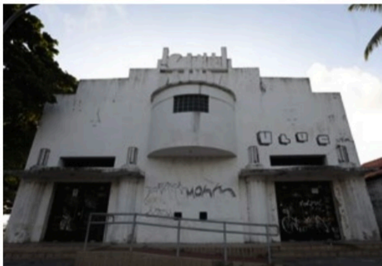
SUCATEADO Cinema em art déco fundado em 1911 está sem funcionar há cerca de 40 anos