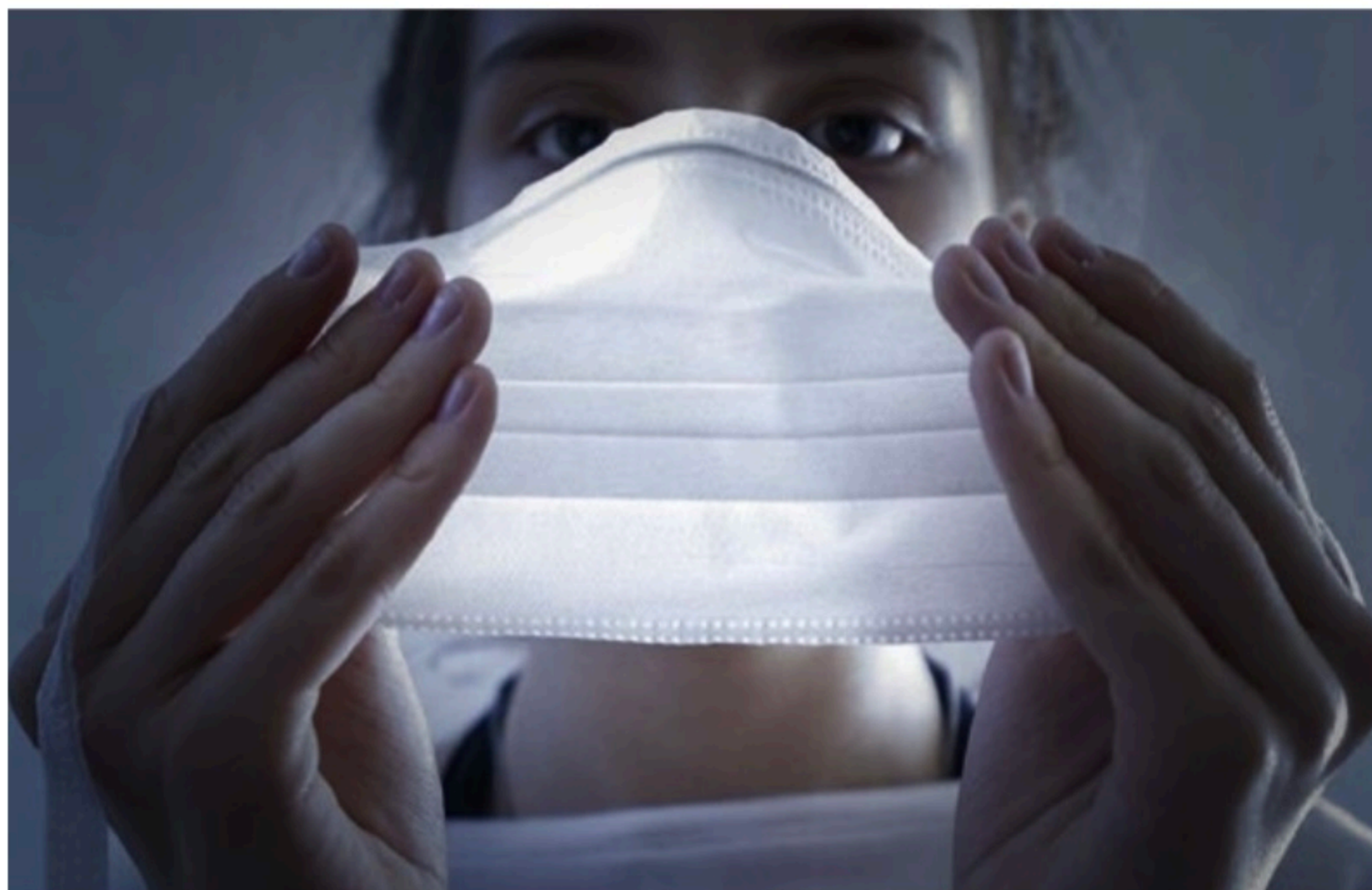
REFORÇO Governo do Estado avalia que imunização precisa avançar mais para que máscara possa deixar de ser um item necessário contra o contágio

Ao longo de dois anos de pandemia, as máscaras se mostraram uma medida preventiva eficaz e que podem ser usadas até mesmo quando acabar a emergência sanitária, nos momentos em que tivermos sintomas gripais ou quando não nos sentirmos seguros.