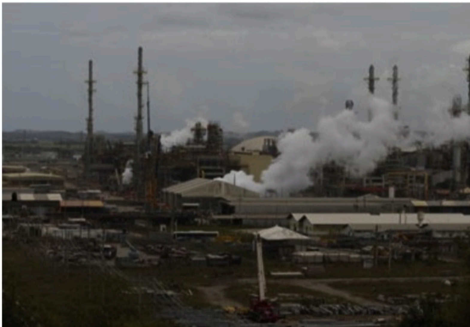
CRÍTICAS Abreu e Lima já tinha entrado no seu 7º ano de operação sem ter realizado manutenção