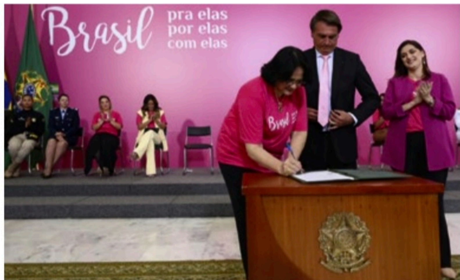
CLAUBER CLEBER CAETANO/FR

Em meio à guerra na Ucrânia, o presidente também