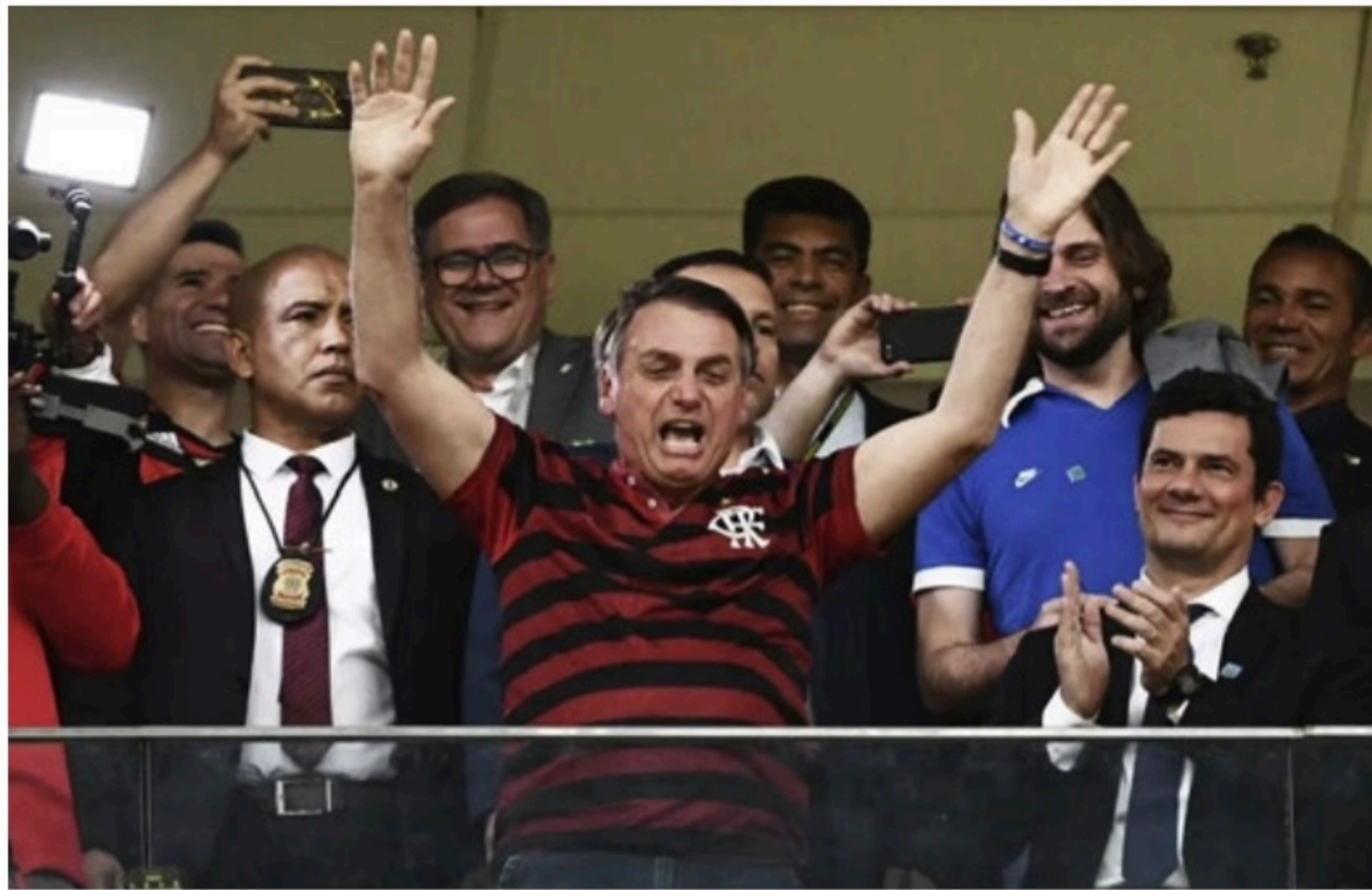
ALIADOS Jair Bolsonaro estaria se aproximou de Landim durante briga do Flamengo com a Tv Globo pelos direitos de transmissão dos jogos

O valor deverá cobrir honorários advocatícios de uma dis-