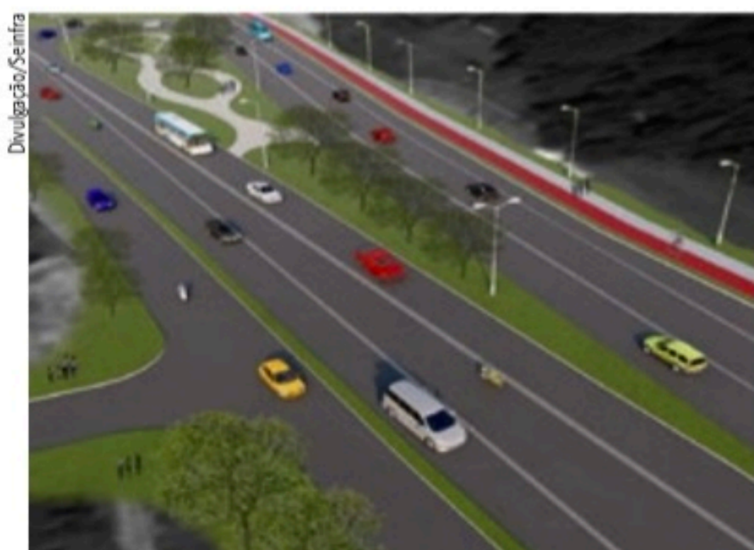
META Com conclusão, tempo de viagem nos 6,7 KMs reduzirá em 58%