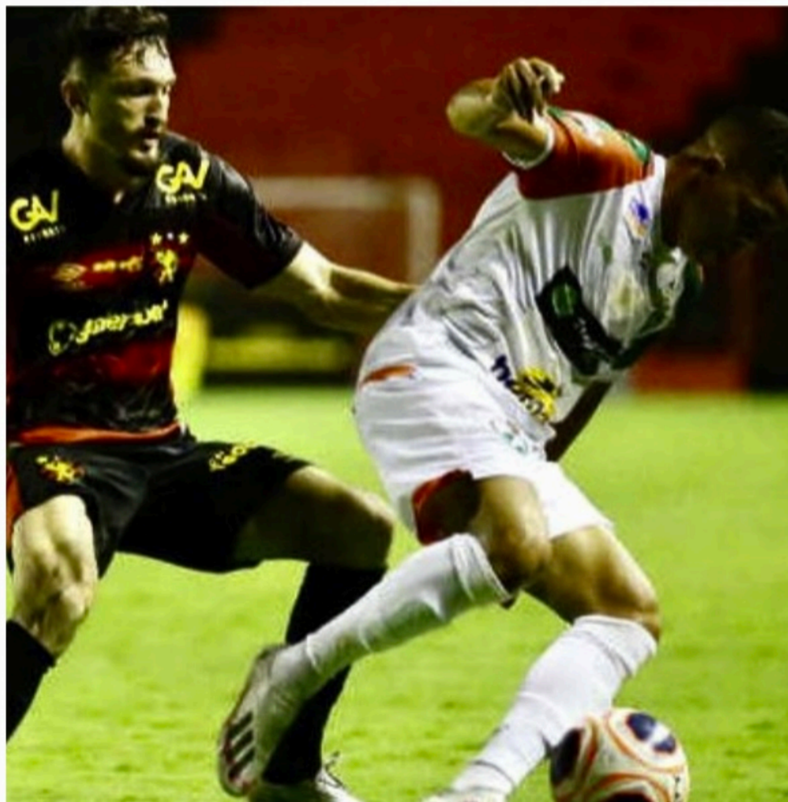
PONTOS Salgueiro e Sport estão separados por apenas um ponto na tabela, onde o Carcará tem vantagem

O próximo jogo do Sport acontece neste sábado contra o Náutico, às 16h, nos Aflitos. O Clássico dos Clássicos é válido pela quinta rodada do Pernambucano. O Salgueiro entra em campo uma hora mais cedo, diante do Vera Cruz, no Lacerdão, em Caruaru.