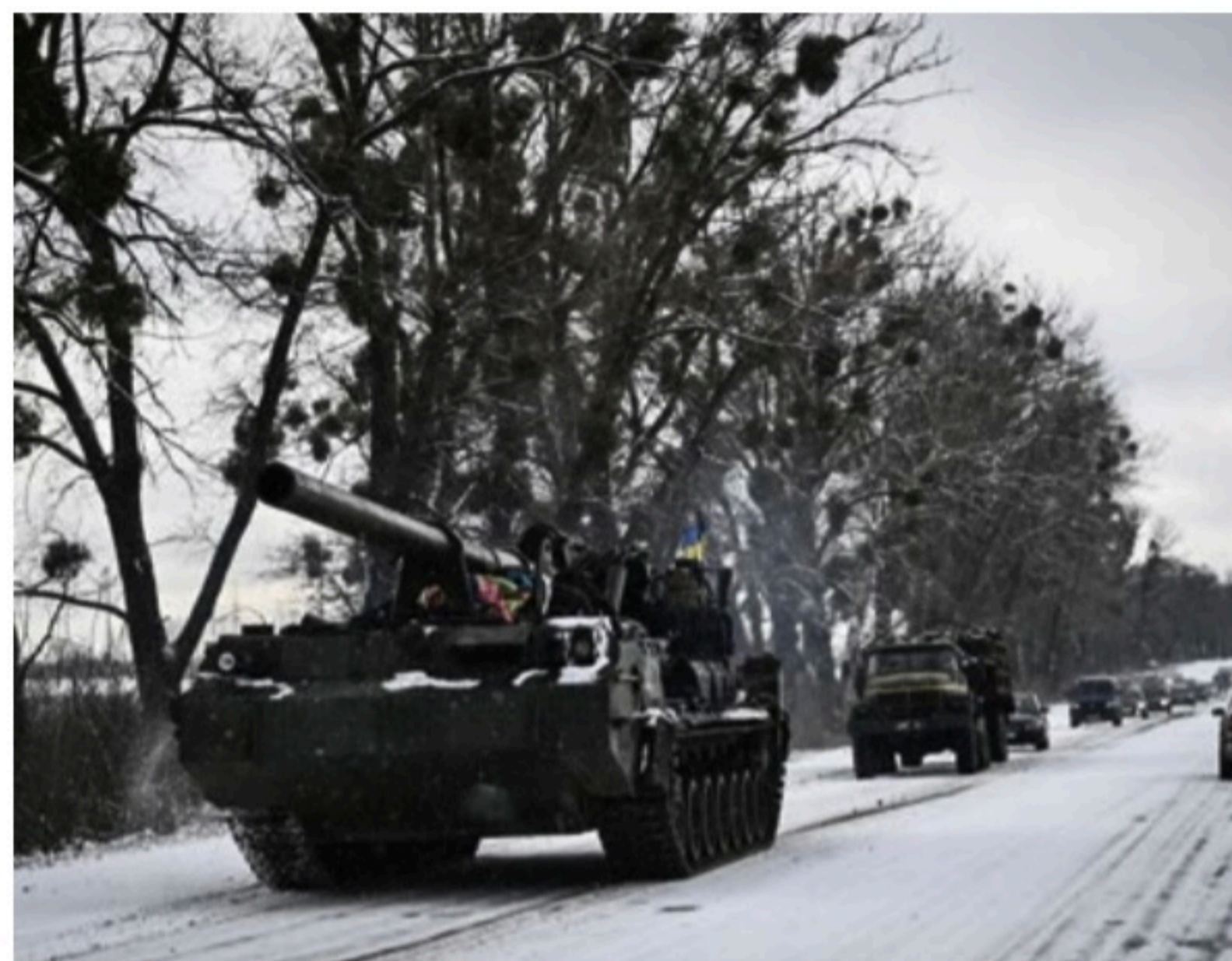
SUPORTE Putin já ameaçou países que prometeram ajudar ucranianos de serem vistos como inimigos

Chefes da inteligência americana dizem que Putin está "aborrecido", isolado e sente que não pode perder