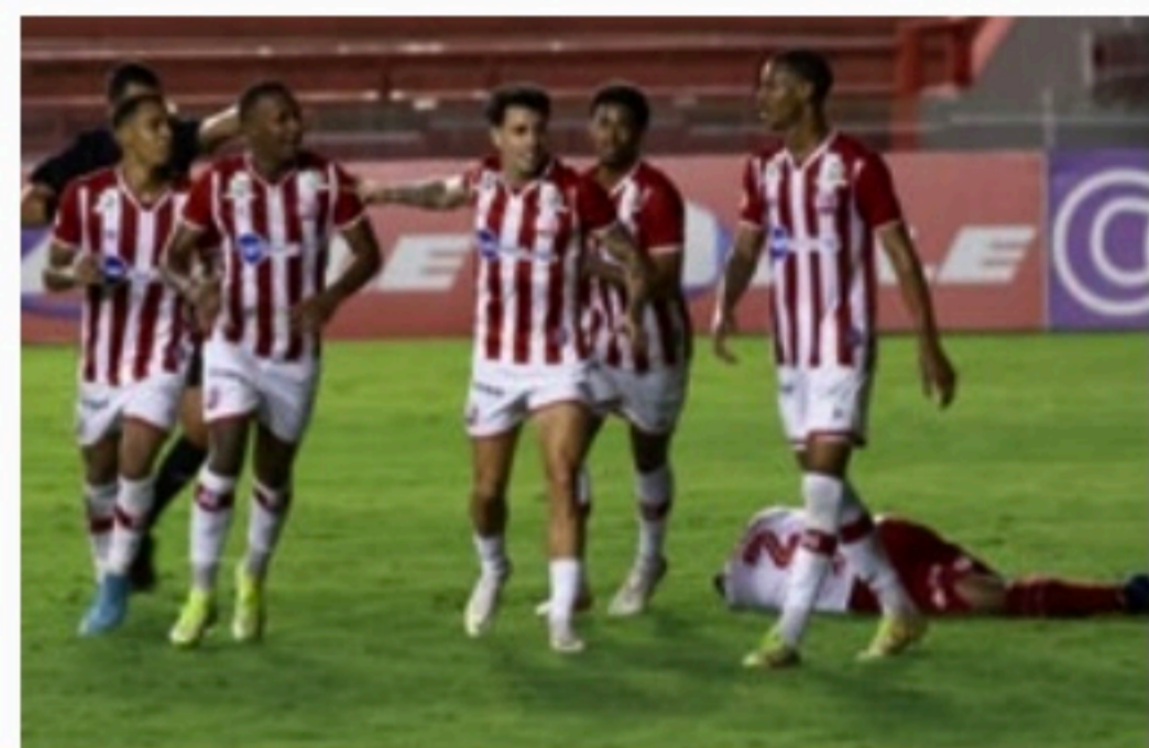
PERNAMBUCANO Náutico entra em campo, nos Aflitos, na noite de hoje