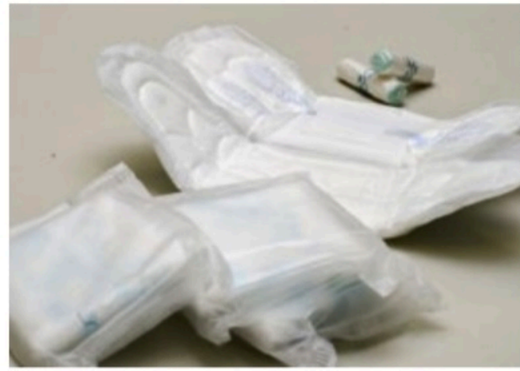
INVESTIMENTO R$ 130 milhões serão alocados para a distribuição do item