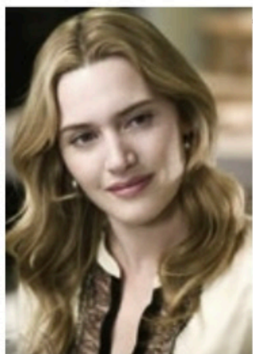
para toda a família.

(23h40) PEDRO COELHO 2: O FUGITIVO . De Will Gluck. Com David Oyelowo, Rose Byrne, Domhnall Gleeson. O travesso Peter Rabbit escapa para a grande cidade, onde encontra personagens sombrios e acaba criando o caos