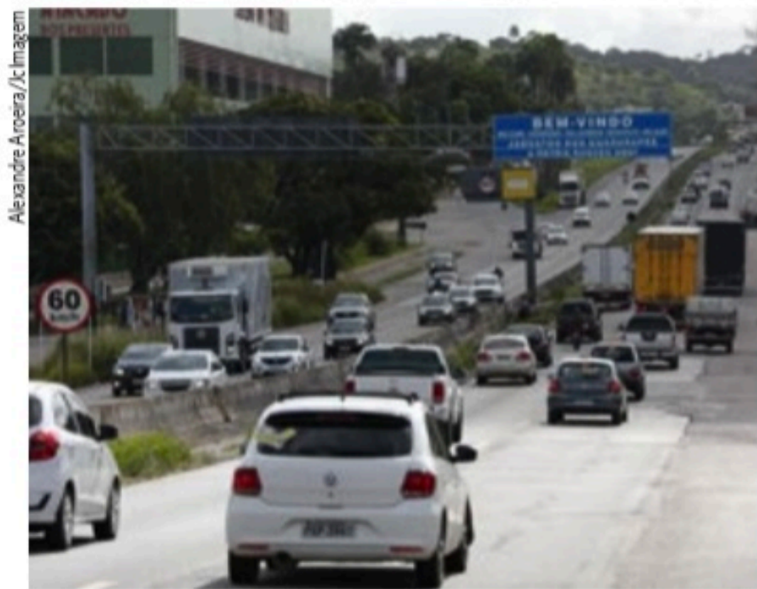
INTERDIÇÃO Durante trabalhos, trânsito terá desvios nos dois sentidos

A perspectiva do governo do Estado é que a adequação da capacidade viária do trecho rodoviário reduza o tempo de viagem nos 6,7 quilômetros em 58%, passando dos atuais 60 minutos para 25 minutos.