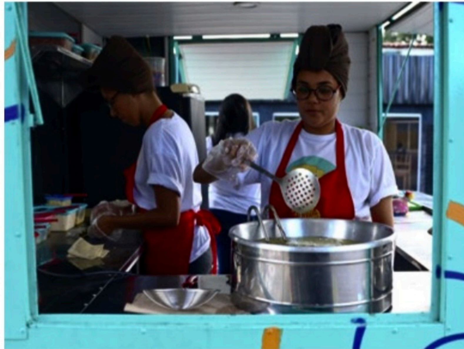
NEGÓCIO Governo ainda anunciou a criação do programa Brasil para Elas, voltado para mulheres empreendedoras

Já na linha de capital de giro Crédito Especial Empresa terá em março taxas a partir de 1,44% ao mês e prazo