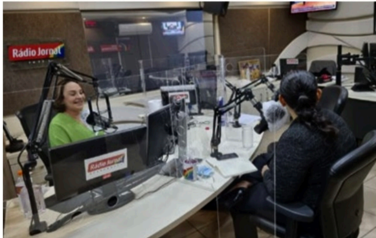
ESPECIAL Programa, que celebrou o Dia Internacional da Mulher, também discutiu o ativismo social

Juntas, elas conversaram sobre a busca da igualdade de direitos nos diversos setores da estrutura social e reconhecimento das próprias capacidades, além de segurança e respeito em todos os ambientes. Durante o debate, as convidadas ressaltaram a necessidade de se continuar a luta por conscientizar a sociedade e os entes