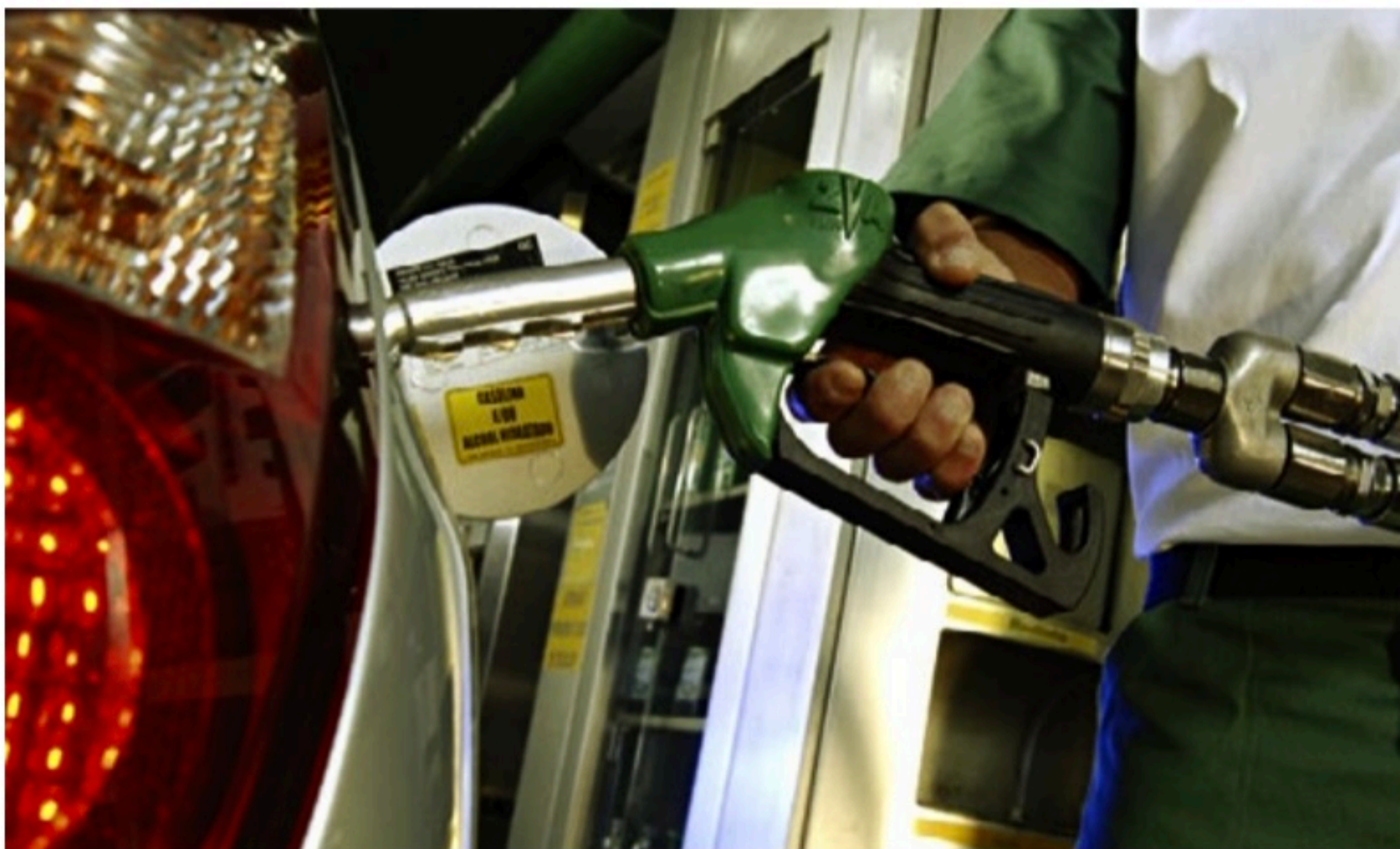
FOCO NO ETANOL Nova medida federal zera imposto de importação de itens como etanol e seis tipos de alimentos, mas efeitos podem ser negativos