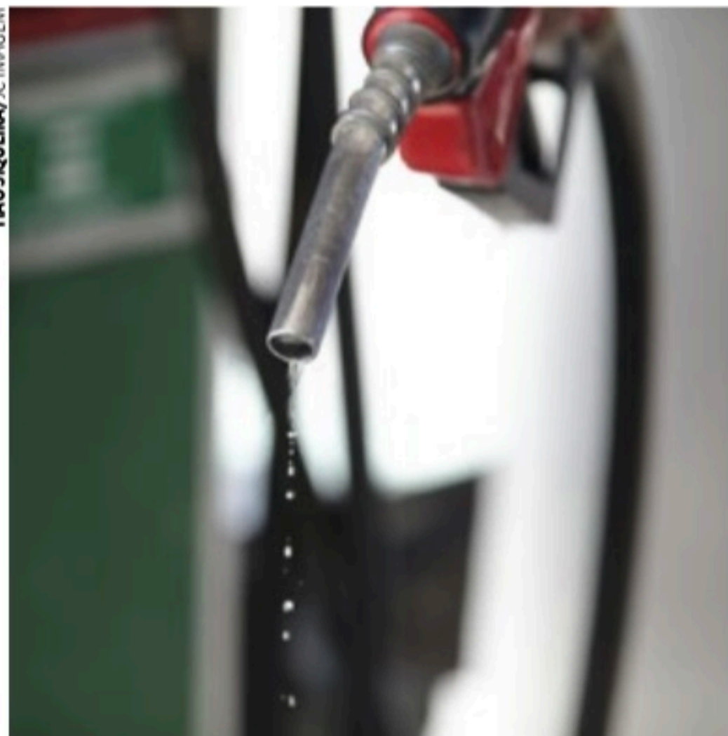
CONTA GOTAS Medidas diversas tentam controlar preços nas bombas

A fórmula será definida, amanhã, em uma reunião do Conselho Nacional de Política Fazendária (Confaz).