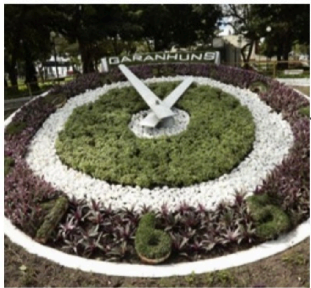
ALERTA Cidade havia conseguido reduzir números da violência em 2021

Após a ação policial, descobriram que o outro carro usado pelos criminosos era roubado e que o motorista também estava sendo feito de refém. Ele prestou depoimento e foi liberado.