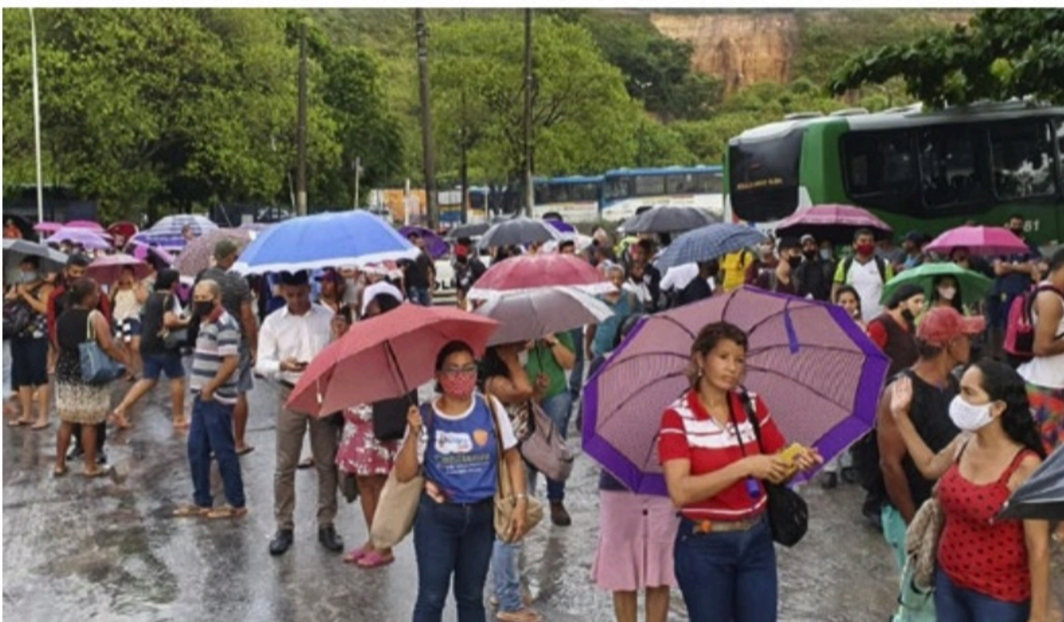
DOR DE CABEÇA Logo cedo, ônibus quebrou na entrada do Terminal Integrado da Macaxeira. Passageiros precisaram aguardar coletivos na rua