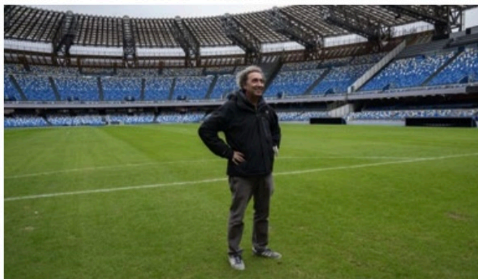
DIRETOR Paolo Sorrentino nas gravações do filme, que tem um quê autobiográfico e menciona Maradona

Arriscar-se em um tom mais pessoal também mexeu com a estética. Sorrentino é conhecido pelo estilo rebuscado, cheio de movimentos de câmera e cenários extravagantes. Com frequência, foi comparado a