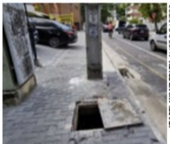
IZABEL WANDERLEY / VOZ DO LEITOR