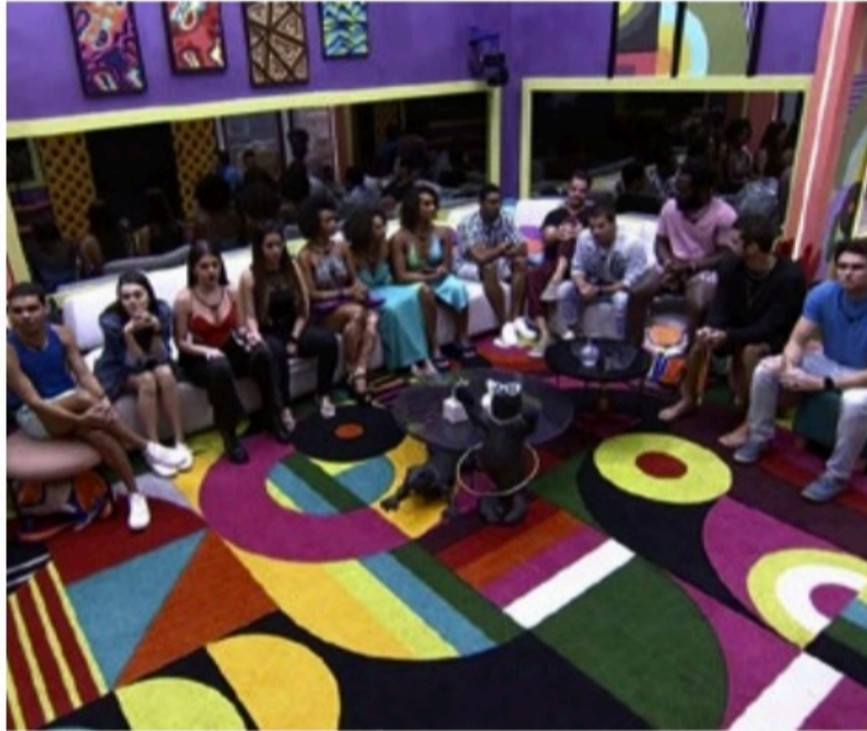
PARTICIPANTES Tanto famosos quanto anônimos querem mais do que o R$ 1,5 milhão