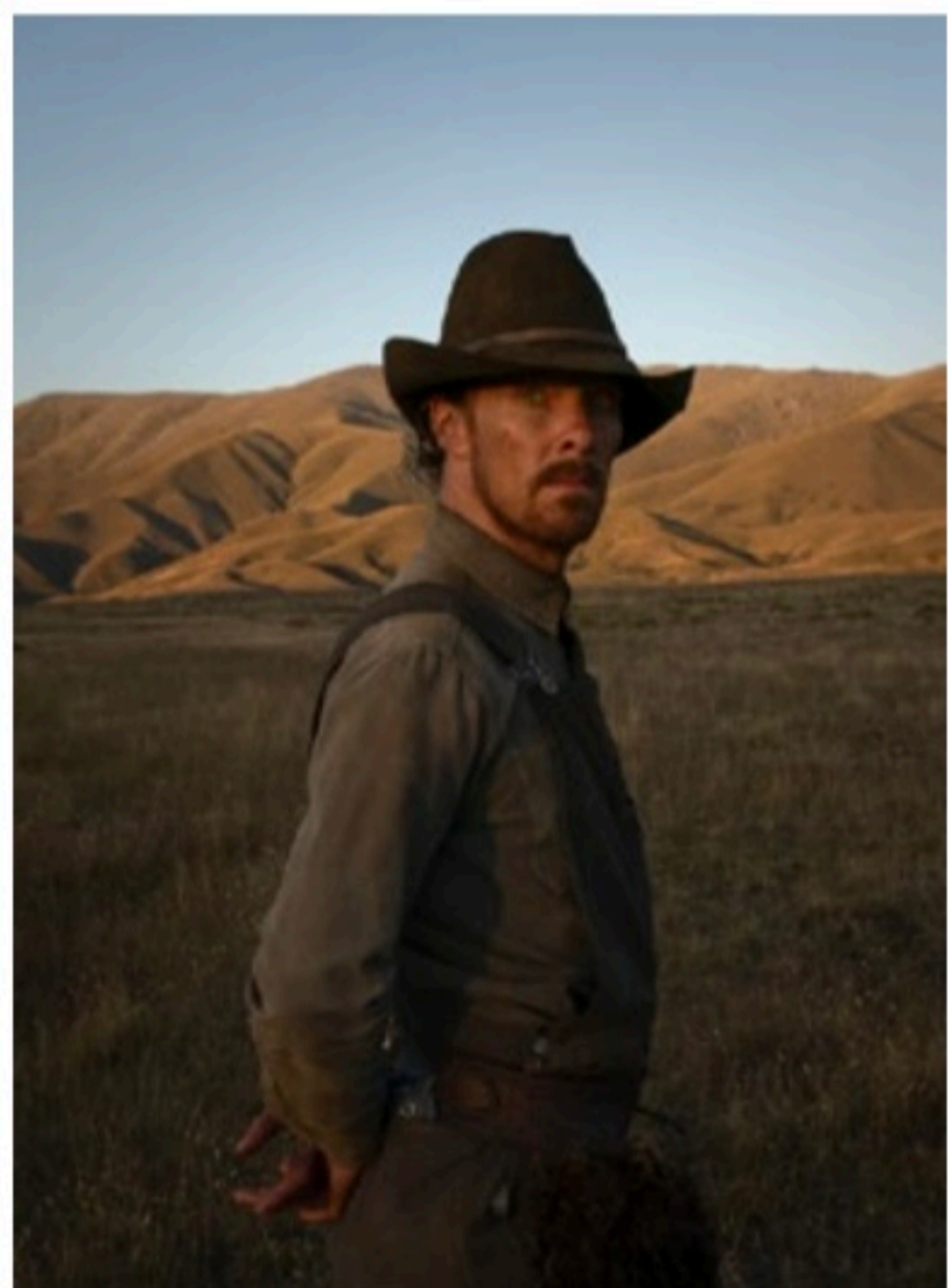
Benedict Cumberbatch em Ataque dos Cães

É como um menino também que ele encara a indicação para o Oscar e até a campanha. “Este trabalho é maravilhoso, porque é como uma brincadeira. Esse negócio de premiação também é uma brincadeira. Então brinquemos.”