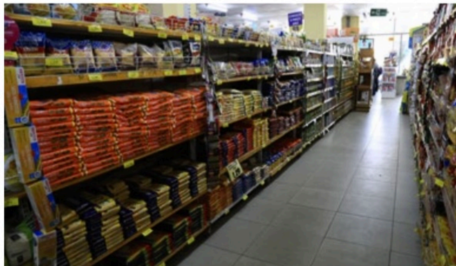
PRATELEIRAS Especialistas alertam que se houver impactos positivos, só devem surgir a médio ou longo prazo