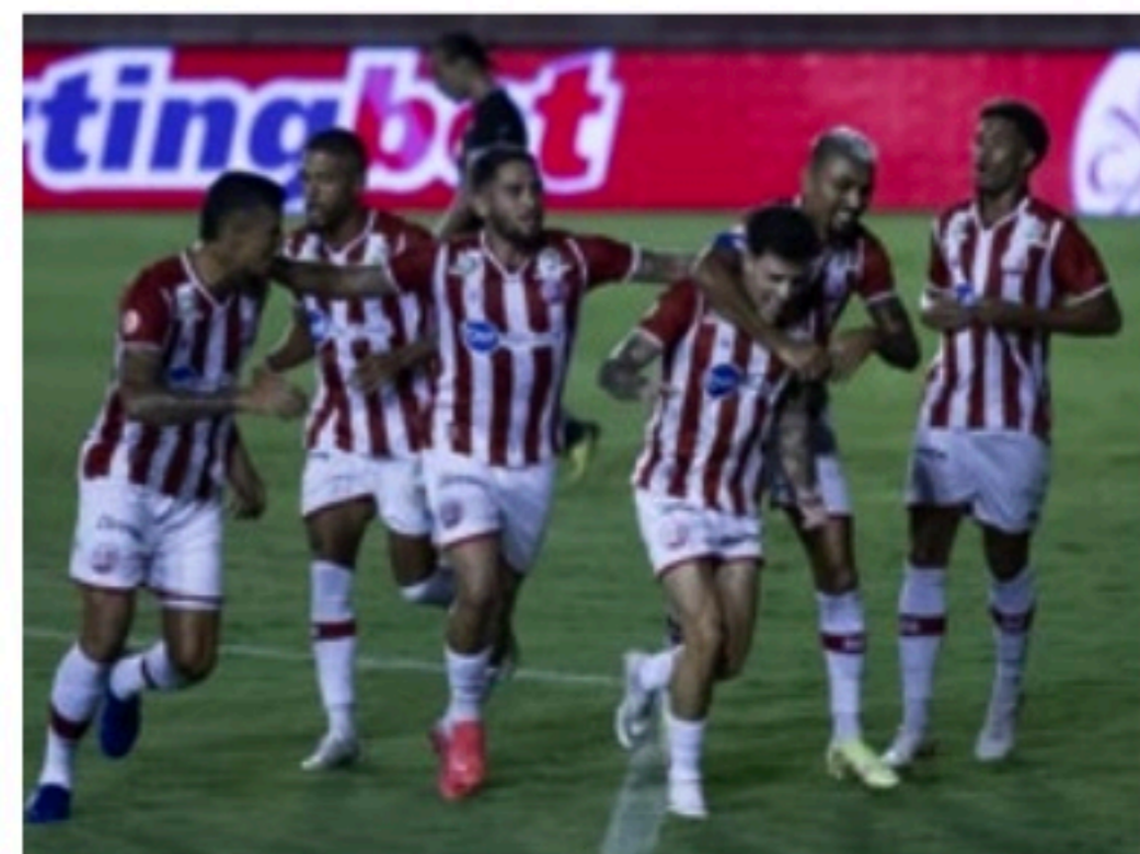
VITÓRIA Náutico já se classificou na Série C contra o mesmo Belo