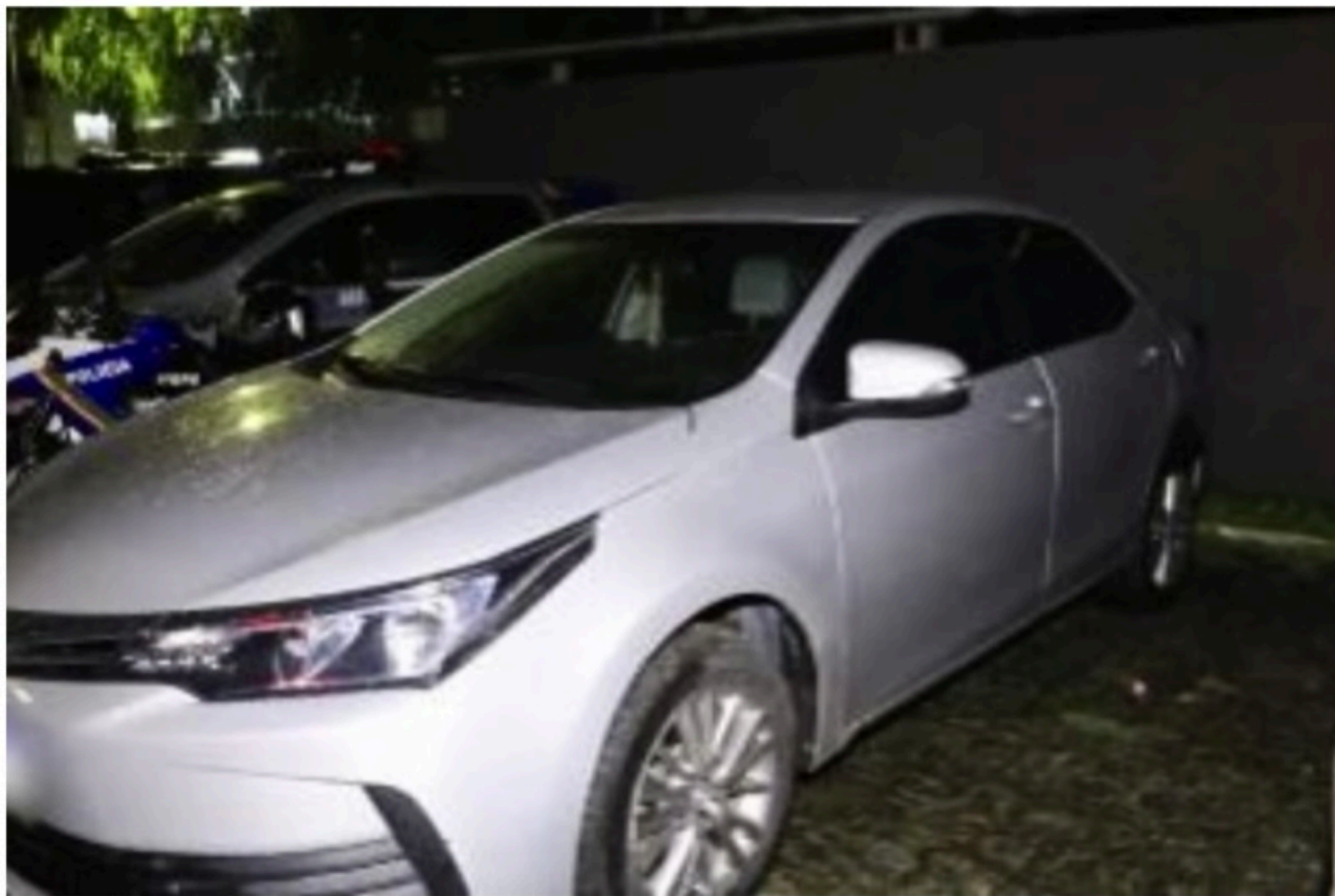
PERSEGUIÇÃO GPS indicou localização do carro da nutricionista de 32 anos. Polícia Militar conseguiu prender suspeitos e recuperar veículo

O efetivo do 6º Batalhão da PM conseguiu localizar o carro da vítima, por meio de dados do GPS, no bairro da Iputinga, na Zona Oeste do Recife. Na abordagem, os policiais identificaram o homem de 22 anos, que foi preso e levado para a sede do GOE, no Cordeiro.