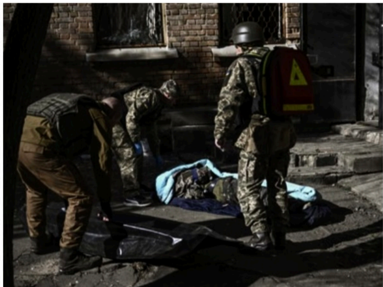
SOB ATAQUE Sem avanço em terra, russos têm intensificado bombardeios. EUA temem uso de armas químicas

Por outro lado, os Estados Unidos não viram evidências de nenhum envio de armas da China à Rússia, sua aliada, para usá-las na Ucrânia, disse ontem Jake Sullivan, conselheiro de Segurança Nacional do presidente Joe Biden.