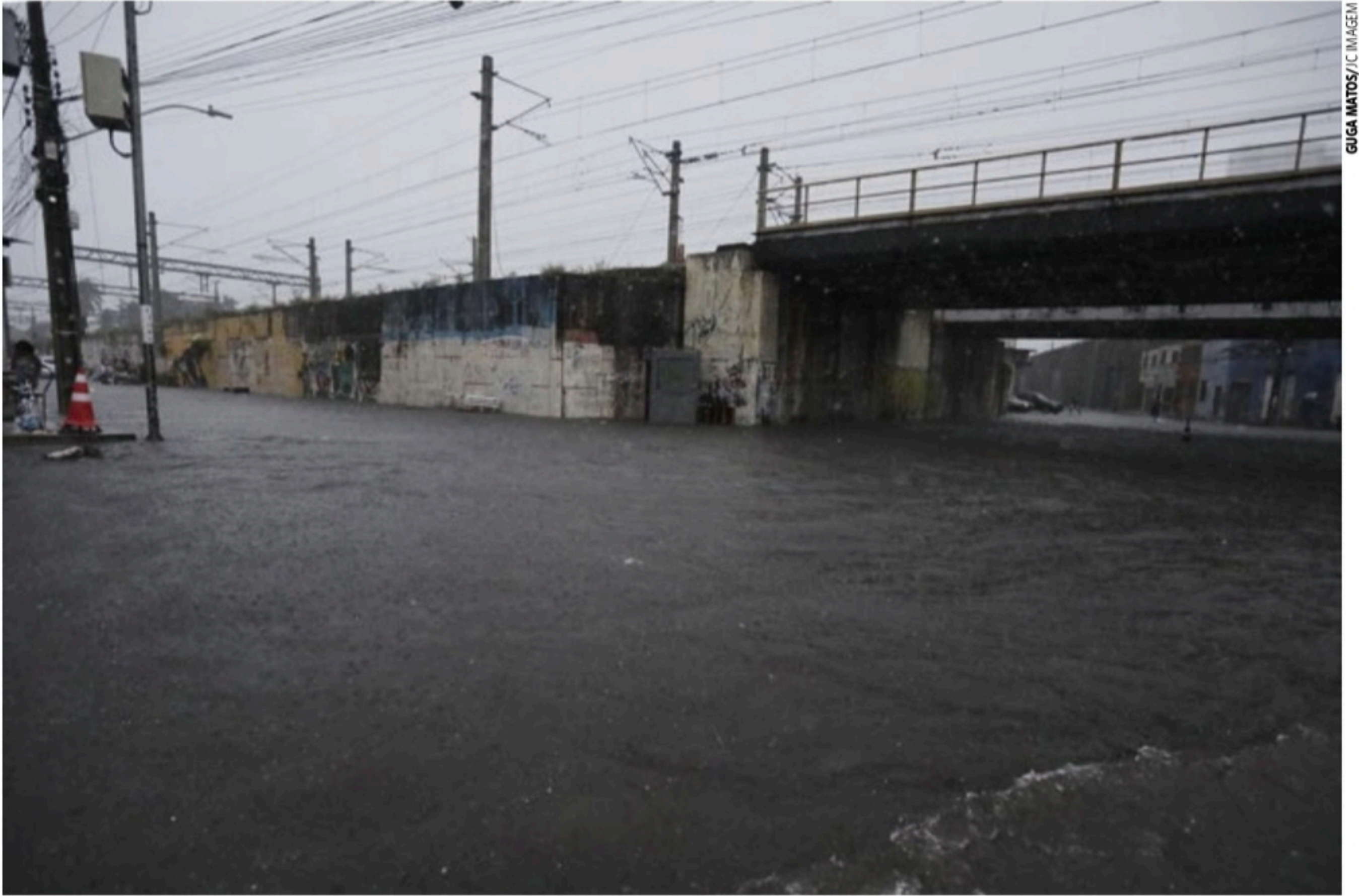
ALAGAMENTOS Várias ruas e avenidas do Recife ficaram completamente cheias de água durante o dia. Em trecho próximo à Av. Sul (foto), motoristas preferiram não se arriscar

A força da água derrubou o muro da Escola Municipal Octávio de Meira Lins, no Vasco da Gama, Zona Norte do Recife, atingindo o carro e duas motos. Não houve registro de feridos. Mesmo alegando não haver risco de desabamento, a Prefeitura do Recife optou demolir e reconstruir todo o muro por precaução. “Hoje (ontem) nossas equipes foram ao local e removeram os entulhos, limpando tudo”, afirmou o prefeito. Os proprietários dos veículos atingidos serão indenizados, segundo ele.