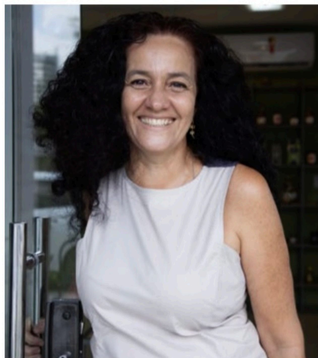
Casa Forte Silvia Sabadell comemora a inauguração da primeira loja física da Comadre Fulozinha

A obra conta a história de Mariana, uma jovem de 23 anos, estudante de história, cheia de traumas e com uma vontade imensa de resolver as coisas. Seu pai, que é maestro da OSRJ, é brutalmente assassinado no Rio de Janeiro da década de 1960.