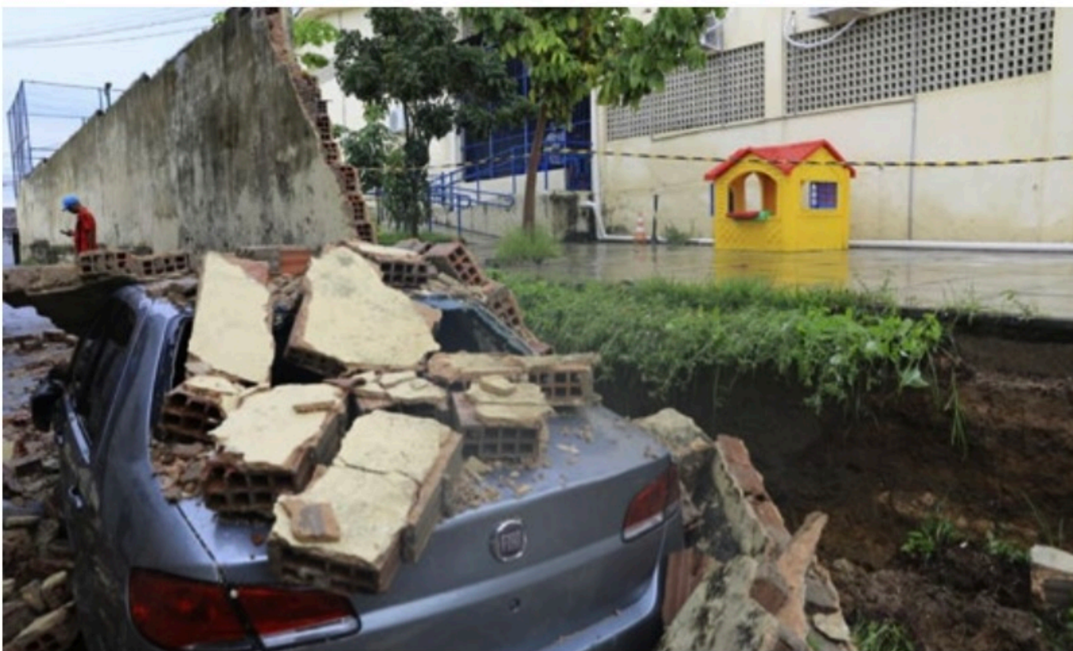
ZONA NORTE DO RECIFE Muro de escola municipal caiu, atingindo um carro e duas motos no bairro de Vasco da Gama. Não houve feridos