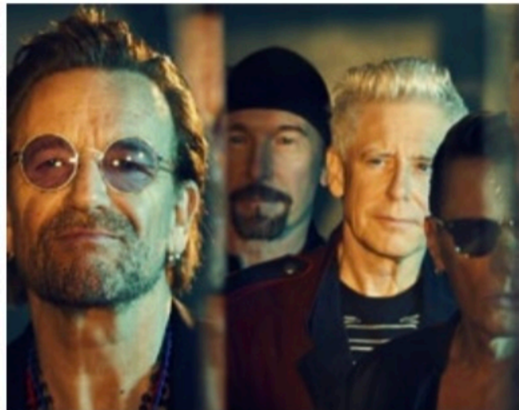
SÉRIE Bono Vox e U2 deverão ganhar produção na Netflix em breve

"Fiquei pensando em como seria a vida dentro desses lugares. Relacionamentos sociais, familiares e românticos se desenvolvendo dentro de um abrigo para o qual todos fugiram muito apressadamente", explicou Pina.