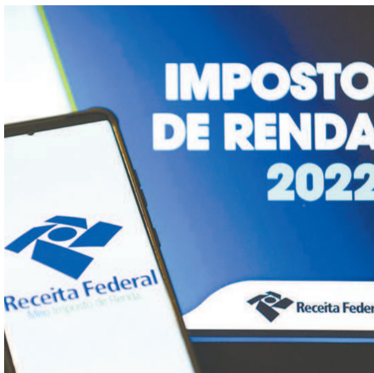
Restituição continuam com o mesmo calendário

dimento totalmente normalizados”, informou a Receita. Com a mudança, o contribuinte que paga o imposto e opta pelo desconto das parcelas no débito automático deve entregar a declaração até 10 de maio. Antes era 10 de abril. O saldo do imposto a ser pago, segundo normas da Receita, em até oito quotas mensais sucessivas, ficando a da última para dezembro se o contribuinte optar pelas oito. A instrução normativa determina que, em casos de Declaração Final de Espólio, o pagamento do imposto deve ocorrer até 31 de maio deste ano nas situações em que a decisão judicial da