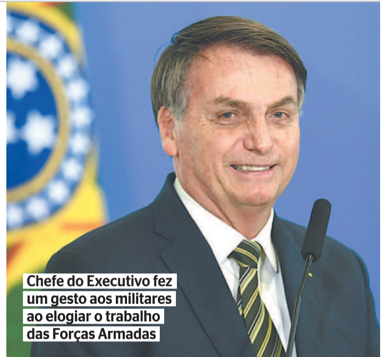
Chefe do Executivo fez um gesto aos militares ao elogiar o trabalho das Forças Armadas

Bolsonaro se autointituiu um “soldado do Brasil” e pregou sobre “marchar junto com os militares para o bem da nação”. “Mais do que nunca, como os senhores, eu sou um soldado do Brasil. E os soldados marcham juntos para o bem da nossa nação”.