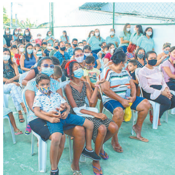
Pais e mães puderam acompanhar o retorno das crianças

A Casa do BEM, desde a sua inauguração há dois anos, oferece além do balé e acesso à internet gratuita para a comunidade, oficinas como: idiomas, informática, de corte e escova, artesanato, entre outros atendimento psicológico e social. Ainda faz parte do rol de programas oferecidos pela Assistência Social do Ipojuca, o Esporte em Tempo de Inclusão, com aulas de beach soccer, futsal e basquete em todos os distritos de Ipojuca. O programa da Escola de Surf na Onda do BEM, realizado em Maracáipe, também integra o atendimento.