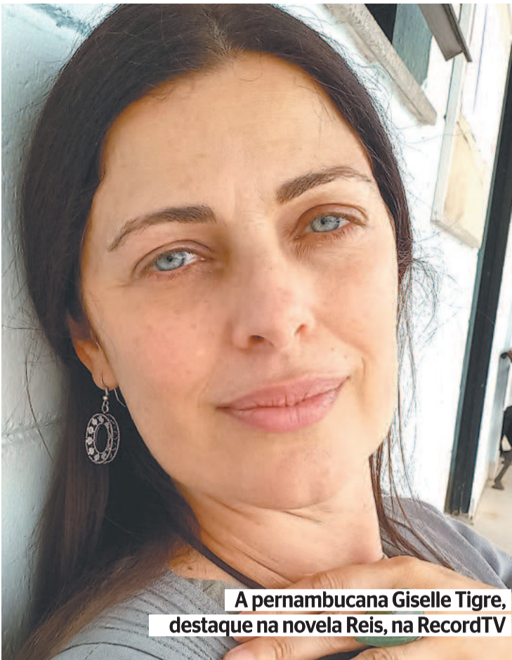
A pernambucana Giselle Tigre, destaque na novela Reis, na RecordTV