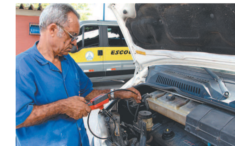
A resolução normatiza várias condições para o serviço

O Tribunal ressaltou que vem realizando trabalhos sobre o assunto para a melhoria da prestação do serviço no estado. “Exem-