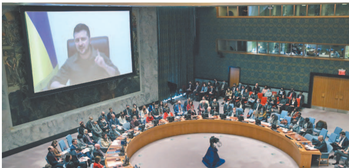
A sessão do Conselho de Segurança foi convocada para considerar as alegações ucranianas de assassinato em massa de civis na cidade de Bucha

Os Estados Unidos e a União Europeia (UE) preparam novas sanções para asfixiar a economia russa e forçar o presidente russo, Vladimir Putin, a encerrar a invasão. A nova bateria de sanções da UE incluirá limitações às importações de “petróleo e carvão” russos, anunciou o ministro das Relações Exteriores francês, Jean-Yves Le Drian. Separadamente, os EUA, em coordenação com a UE e o G7 de economias avançadas, proibirão a partir de hoje “qualquer novo inves-