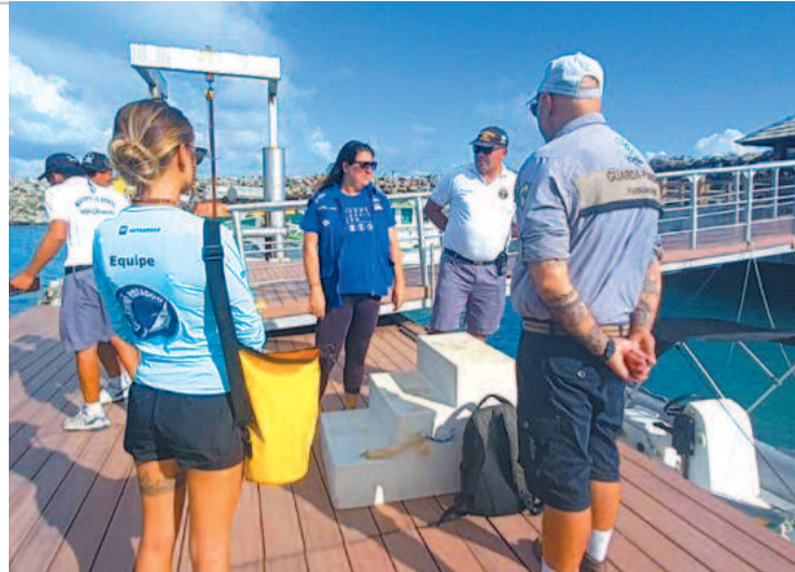
A vigilância acontece nas áreas do Parque Nacional