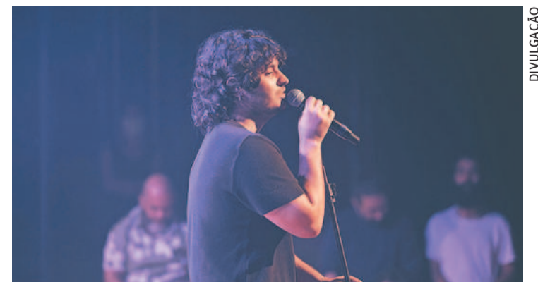
Cantor traz faixas do álbum homônimo lançado em 2021