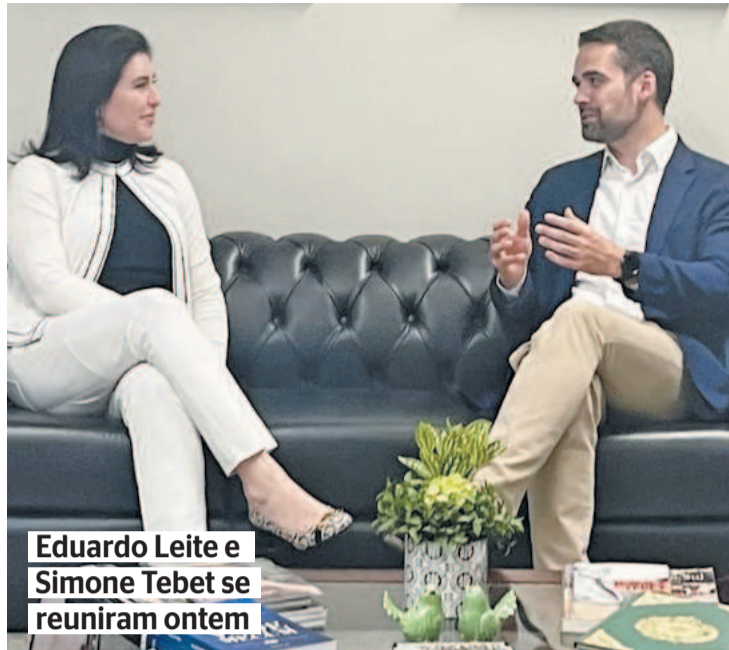
Eduardo Leite e Simone Tebet se reuniram ontem

Ainda ontem, após as recentes sinalizações de que o ex-governador do Rio Grande do Sul Eduardo Leite (PSDB-RS) poderia ser vice da chapa com a senadora e pré-candidata ao Planalto, Simone Tebet (MDB-MS), o tucano foi até o gabinete da parlamentar para alinhamento do projeto. Na chegada, Leite conversou com a imprensa, afirmando estar disposto a ponderar e debater o projeto, mas reiterou que não existe “terceira via”.