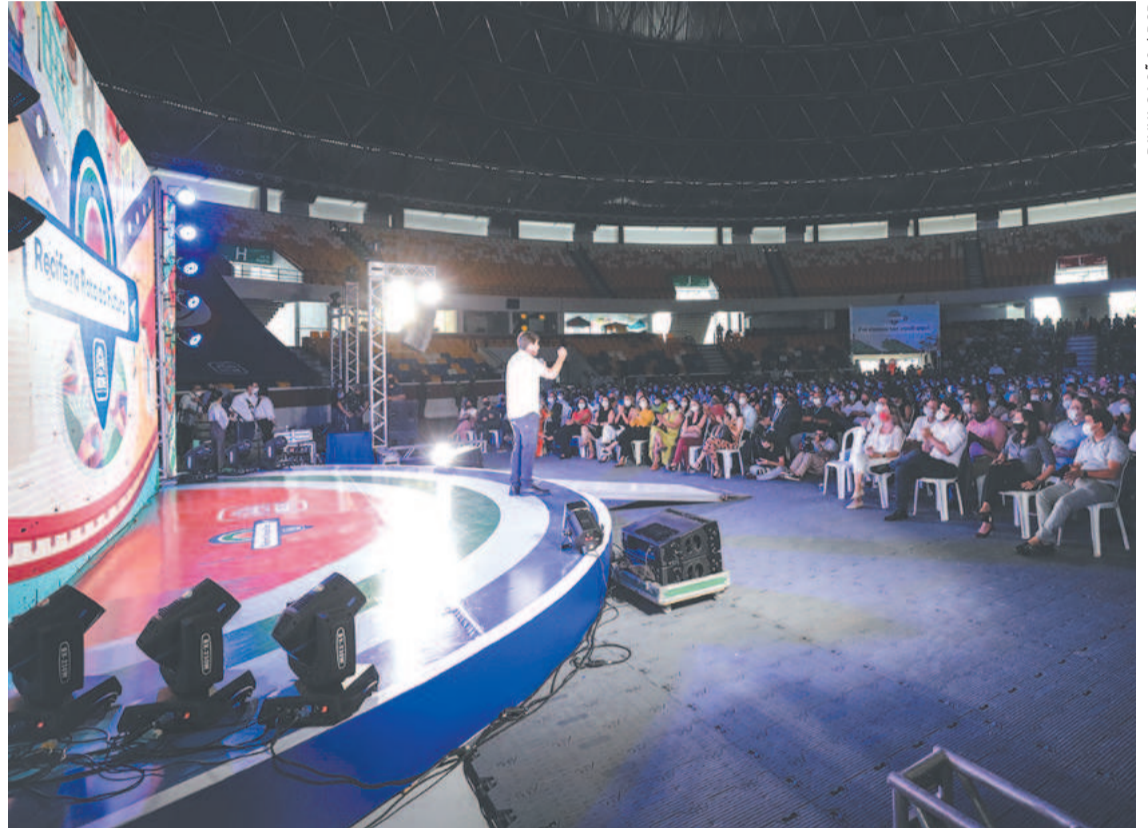
Plano teve a participação dos 34 órgãos do município, além de sugestões da população