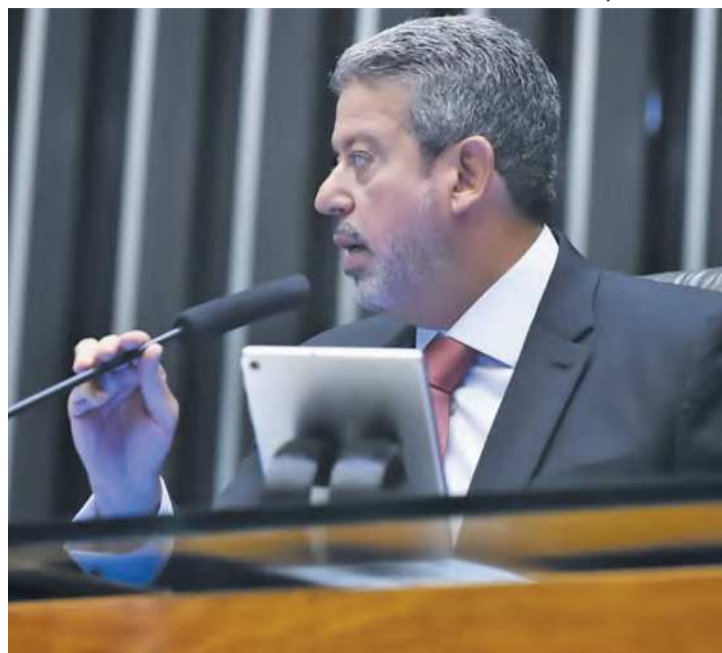
Repasses para Alagoas alcançam cerca de R$ 100 mi

Segundo um levantamento de dados no sistema Siga Brasil — do Senado Federal —, realizado pelo portal UOL, foram empenhados mais de R$ 40 milhões do FNDE ao estado de Alagoas, em prefeituras, empresas e fundações. Ao todo, foram mais de R$ 100 milhões em repasses de emendas ao estado de Lira. A maior parte desses recursos é do orçamento secreto, usado pe-