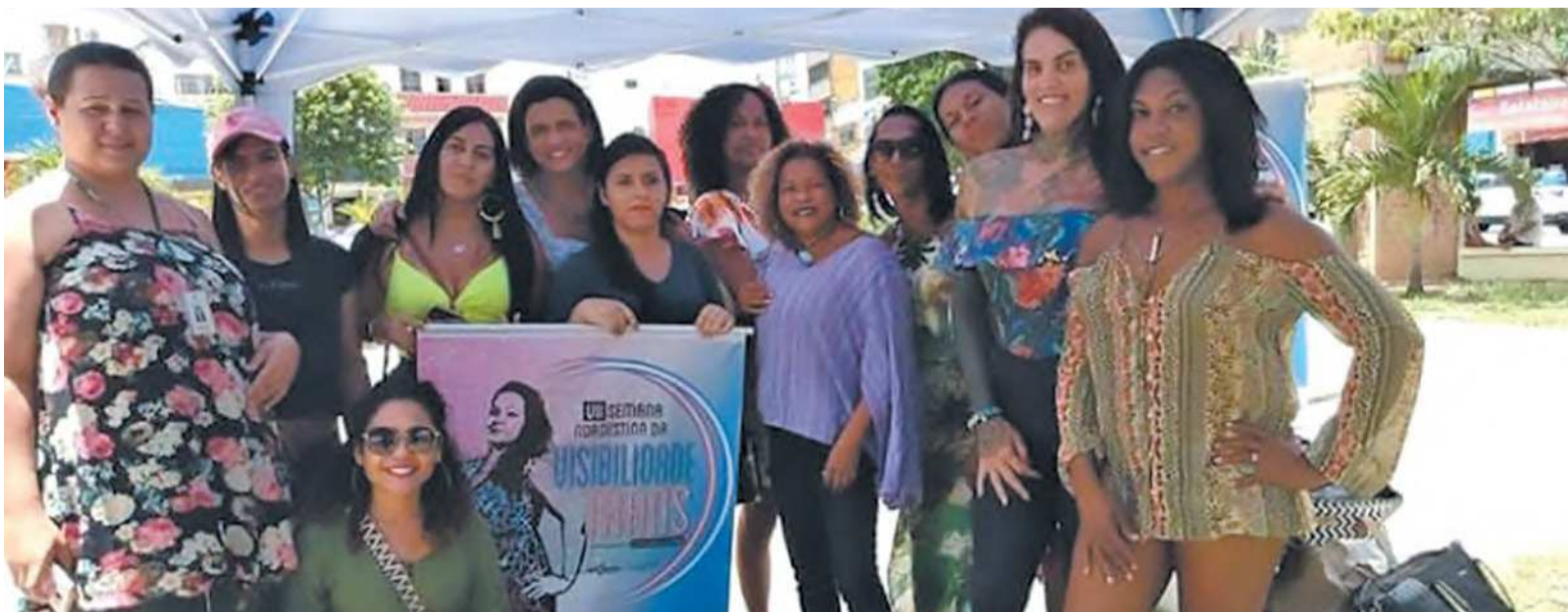
A Amotrans-PE auxilia a população trans existente no Recife, muitas vezes marginalizada, com cursos profissionalizantes