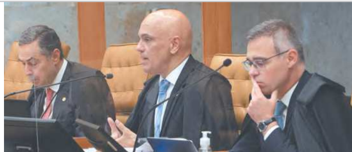
Apenas Nunes Marques divergiu do relator Alexandre de Moraes e recomendou a absolvição

A ministra Cármen Lúcia seguiu a mesma linha: “A liberdade de expressão não pode ser utilizada como instrumento de crime”, afirmou, durante seu voto. O que estamos