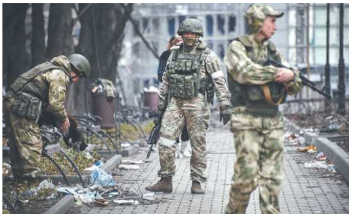
A cidade vem sofrendo ataques intensos dos russos