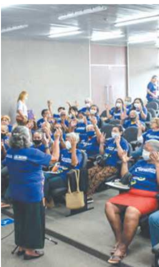
Há cerca de 70 grupos do tipo no Recife. Ideia é integrá-los ainda mais