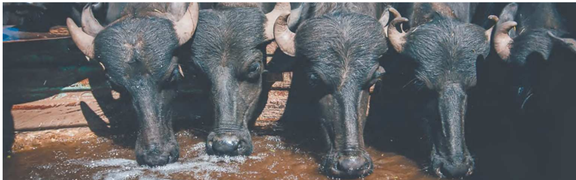
Com sede em São Paulo, a Amor e Respeito Animal (ARA) ajuda a cuidar das centenas de búfalos que eram maltratados em fazenda criadora do bovino