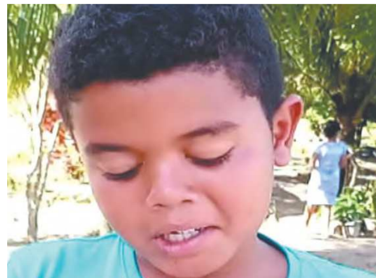
Criança foi morta por traficantes que queriam a terra