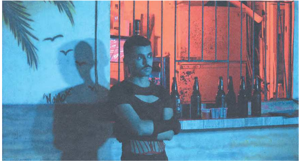
Além da música, Gomes atua com teatro e produção de clipes, curtas e artes visuais

Na infância, o artista recebeu várias influências dos músicos da família, que se reuniam na casa dos avós para encontros regados a muita cantoria popular. O single Drama junta essas referências da sua herança musical, com o protagonismo LGBTQI+ e a narrativa sobre lamentos, amores e desamores desse universo.