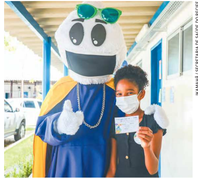
Personagem MC Gotinha já se tornou popular na cidade

Os profissionais que farão aplicação das vacinas passaram por treinamento e estão devidamente capacitados para realizar este serviço. As crianças poderão receber a vacina CoronaVac (somente aquelas a partir dos seis anos) ou a do fabricante Pfizer, que foi criada especificamente para o público infantil a partir dos cinco anos de idade. É importante destacar que a vacinação das crianças deve cumprir um intervalo de 15 dias (antes ou depois) entre as demais va-