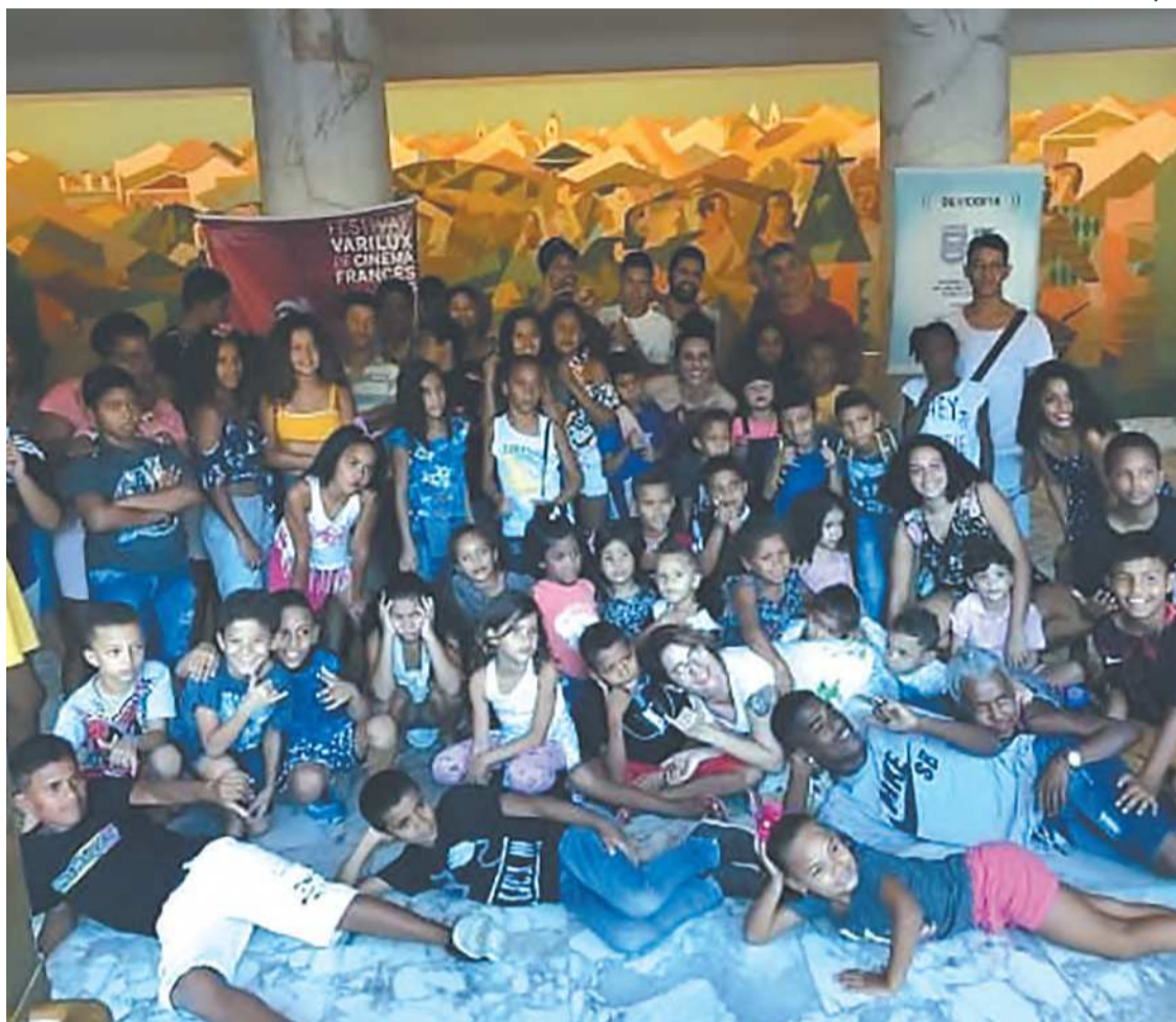
Avipa é uma ONG do bairro do Coque que beneficia mais de 500 famílias da comunidade