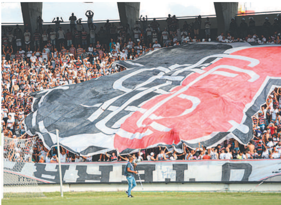
Teve torcedor que relatou só ter conseguido entrar no Arruda após o primeiro tempo

Mais à frente, ALN aponta que a diretoria está trabalhando para evitar que tais situações se repitam e se compro-