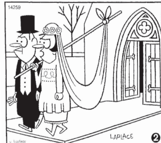
Resolução: 1. Galho seco da árvore. 2. Traço na ponta do véu (amarração no mastro). 3. Traço próximo ao véu. 4. Formato do rosto da noiva. 5. Pé esquerdo do noivo. 6. Ponta do mastro à frente do noivo. 7. Boca do noivo.