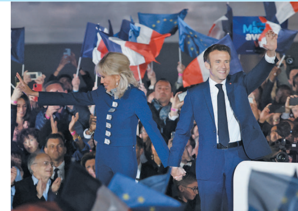
Presidente reeleito comemorou com a esposa e afirmou que vai governar para todos

As reações dos líderes europeus foram imediatas. “Podemos contar com a França por mais cin-