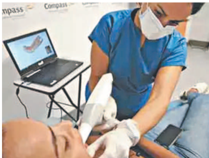
Particulares formaram grupo para estudar negócios

Caso das aulas práticas do curso de odontologia, que deixaram no passado papelada e velhos equipamentos. Fichas foram substituídas por prontuário eletrônico, e todo o acompanhamento dos pacientes se faz por meio digital. “Temos que dar a alunos e professores ferramentas para outro mercado de trabalho.”