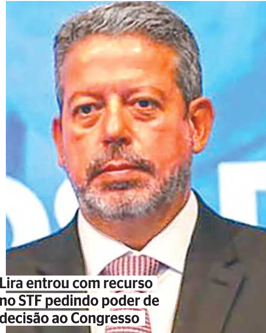
Lira entrou com recurso no STF pedindo poder de decisão ao Congresso