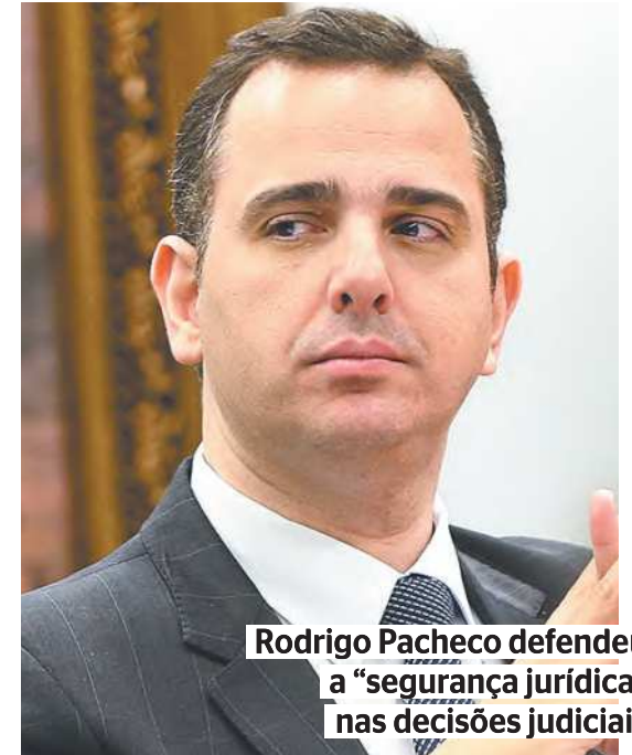
Rodrigo Pacheco defendeu a “segurança jurídica” nas decisões judiciais