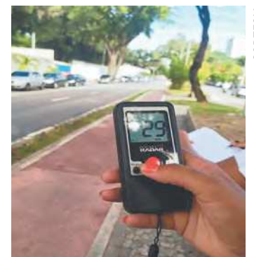
Pesquisadores monitoram os veículos na capital desde 2020

Para implantar políticas públicas cada vez mais baseadas em evidências, a Prefeitura do Recife iniciou, na última segunda-feira, a terceira rodada de pesquisas observacionais nas vias da cidade. O objetivo é registrar os excessos de velocidade em vias com diferentes estruturas para, a partir daí, implantar soluções que aumentem a segurança viária ao coibir o excesso de velocidade nas vias municipais. A iniciativa foi realizada por meio da Secretaria de Política Urbana e Licenciamento (Sepul) e da Autarquia de Trânsito e Transporte Urbano (CTTU), em parceria com a Iniciativa Bloomberg de Segurança Viária Global (BIRGS) e a Universidade Johns Hopkins. Na primeira rodada da pesquisa, em 2020, observou-se que o