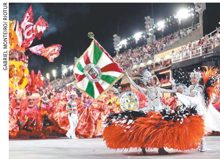
Com o enredo Fala, Majeté! Sete Chaves de Exu, a escola obteve 269,9 pontos na apuração

As demais posições ficaram com a Mangueira, em sétimo, com 268,2; a Mocidade, em oitavo, também com 268,2, mas atrás pelo critério de desempate; a Unidos da Tijuca, em nono, com 267,9; a Imperatriz Leopold