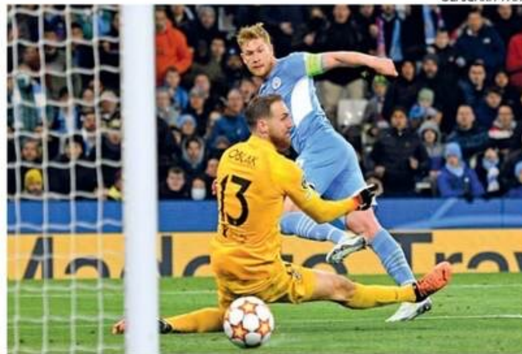
Kevin de Bruyne colocou o City em vantagem para o jogo de volta