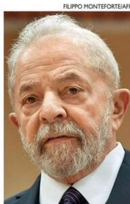
Após décadas em campos opostos, Lula (E) e Alckmin unirão forças

O ex-prefeito de São Paulo Fernando Haddad e o ex-governador de estado Marcio França (PSB) foram os principais articuladores da aliança Alckmin e Lula.