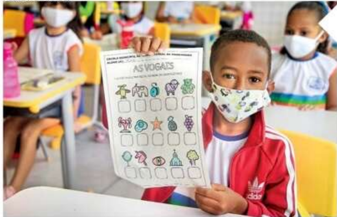
Escola municipal no bairro da Mangabeira, Zona Norte da Capital, foi inaugurada ontem para atender 700 estudantes do 1º ao 9º ano