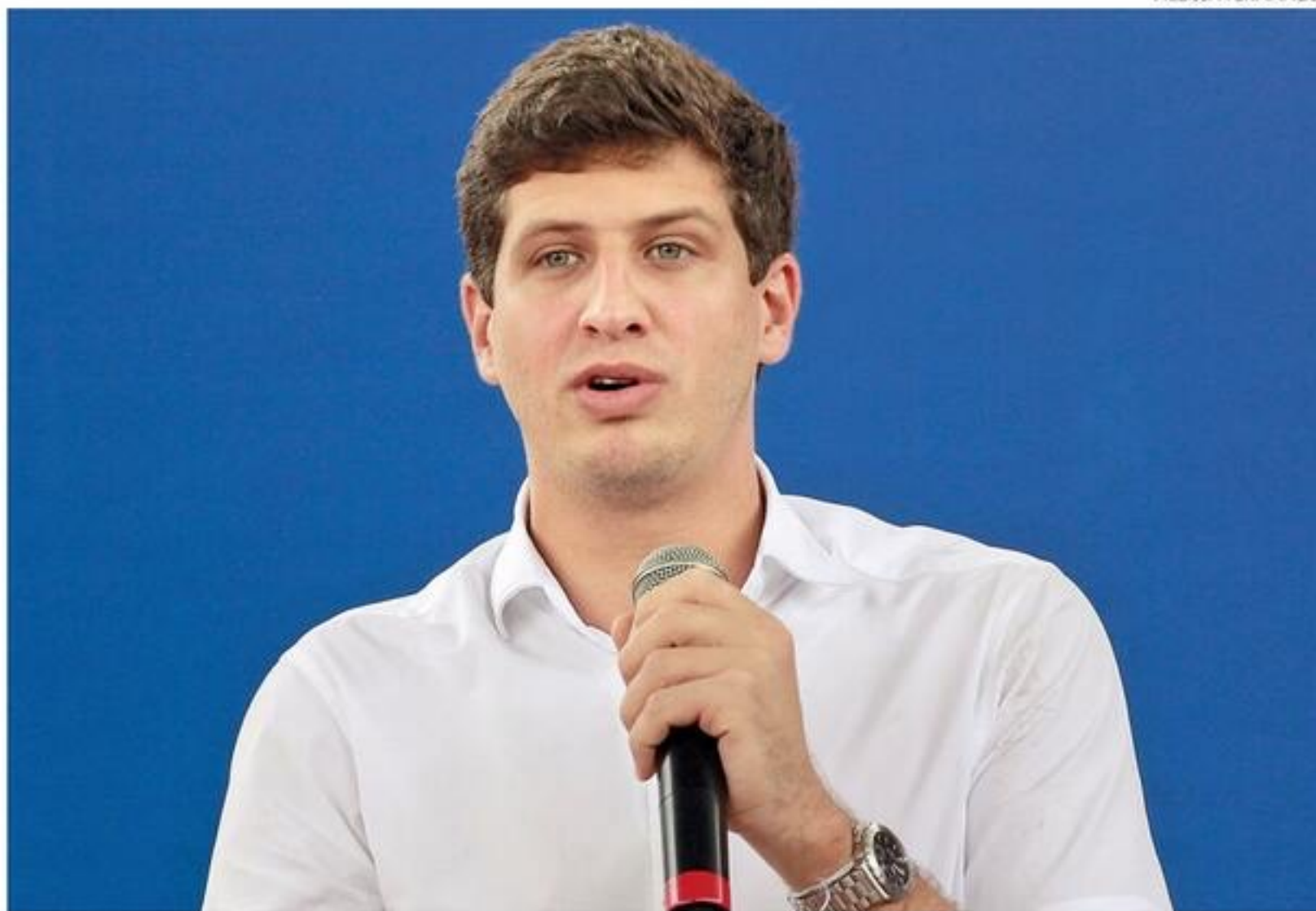
Prefeito João Campos fechou convênio que permitirá fazer obras de grande importância na Capital