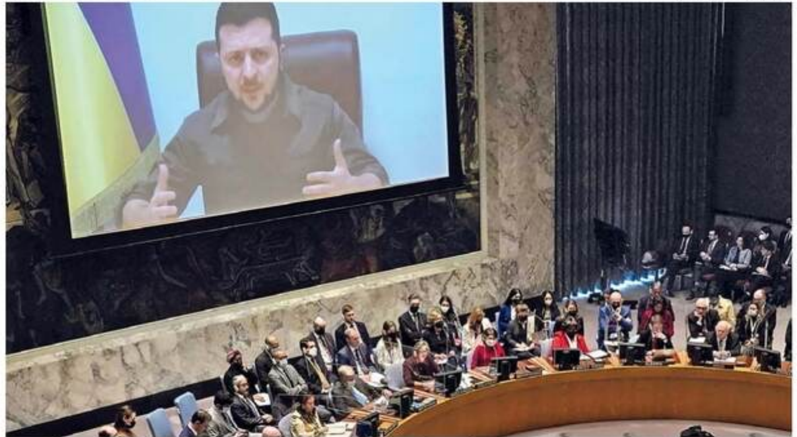
Em vídeo, presidente ucraniano defendeu reformas no Conselho para acabar com o direito a veto

Ele voltou a dizer que a versão russa para as mortes em Bucha, de que as ações teriam sido cometidas pelos próprios ucrania-