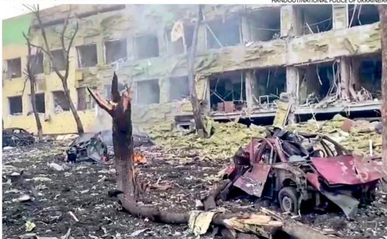
Mariupol está sob intenso ataque das forças russas há mais de 40 dias e já foi praticamente destruída

Na frente diplomática, o chefe de Governo da Áustria, Karl Nehammer, afirmou estar "pessimista" após uma reunião nesta segunda-feira com o presidente russo, Vladimir Putin, a primeira de um líder europeu em Moscou desde o início da invasão da Ucrânia, em 24 de fevereiro. "Não há necessidade para iludir-se. O presidente Putin entrou plenamente na lógica da guerra e agirá de acordo", explicou Nehammer. "Do lado russo, eles não estão muito interessados em um encontro direto" com o presidente ucraniano, Volodymyr Zelensky, acrescentou o líder do governo austríaco.