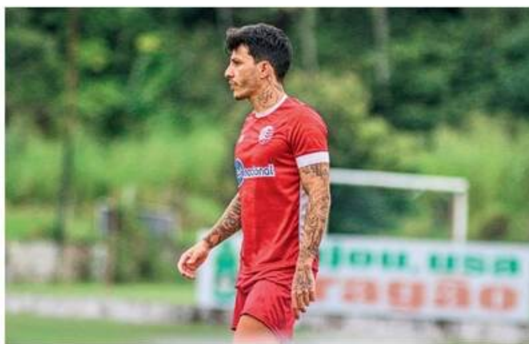
Jogador estendeu seu vínculo com o Náutico em setembro passado

No ano passado, no mês de setembro, o atleta estendeu o seu vínculo com o Timbu para o ano de 2024. Foi destaque do clube na disputa da Série B em 2021, assumin-