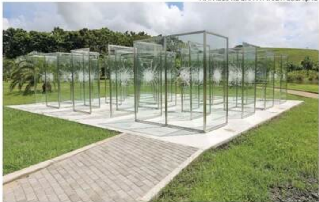
Labirinto de vidro e a exposição da violência urbana escancarada

“Paisagem”, de Regina Silveira, e “Um Campo da Fome”, de Matheus Rocha Pitta, passaram a integrar o rol de obras a céu aberto do Parque Artístico-Botânico da Usina de Arte, conhecido equipamento cultura em Água Preta, na Mata Sul do estado de Pernambuco.