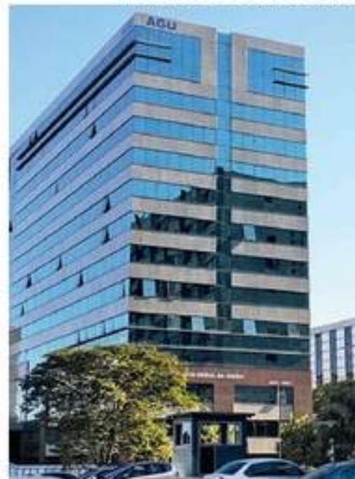
A AGU quer a extinção do processo sem julgamento de mérito.

presidente e o ex-ministro por abuso de poder econômico e político. Para o partido, a administração dos recursos do MEC "vem sendo aparelhada" em prol do projeto de reeleição de Bolsonaro, além de se