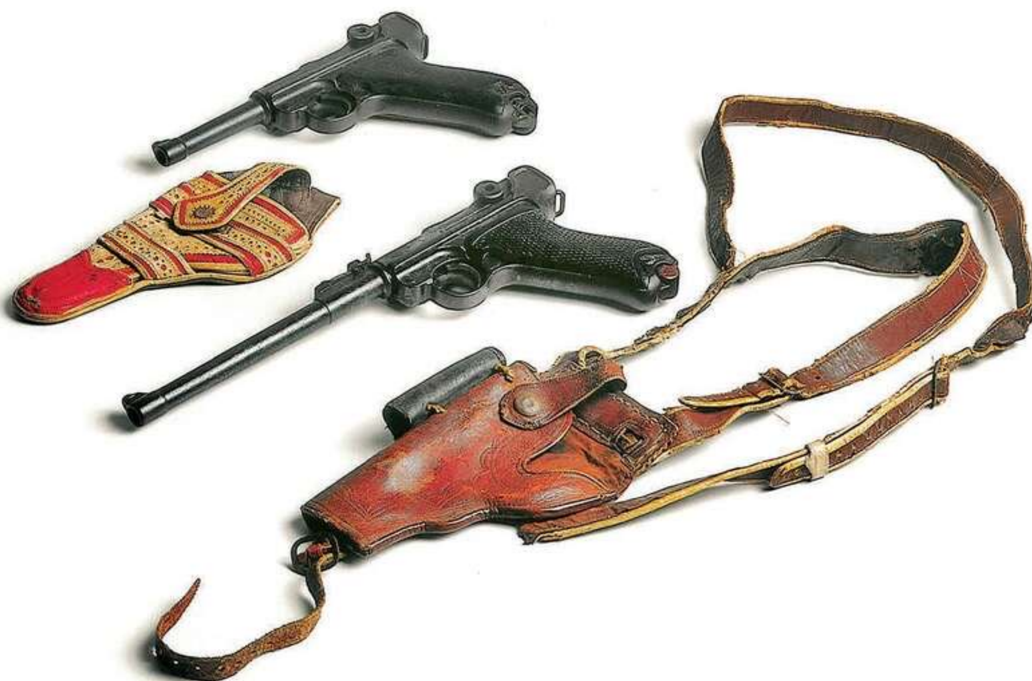
O traje do cangaceiro é um dos exemplos demonstrativos do comportamento arcaico brasileiro

Por ter um estilo tão único, o contexto sertanejo pode (e deve) abraçar inúmeras produções artísticas. “Eu tenho desenvolvido a tese de que as correrias do cangaço no Brasil estão fadadas a ocupar o papel que os romances de cavalaria ocuparam na Europa durante três séculos. Aquela dose de épico, na prosa ou na dramaturgia, que pode servir de inspiração”, defende Frederico, que também atua como consultor da Globoplay, em uma série com estreia em 2023.