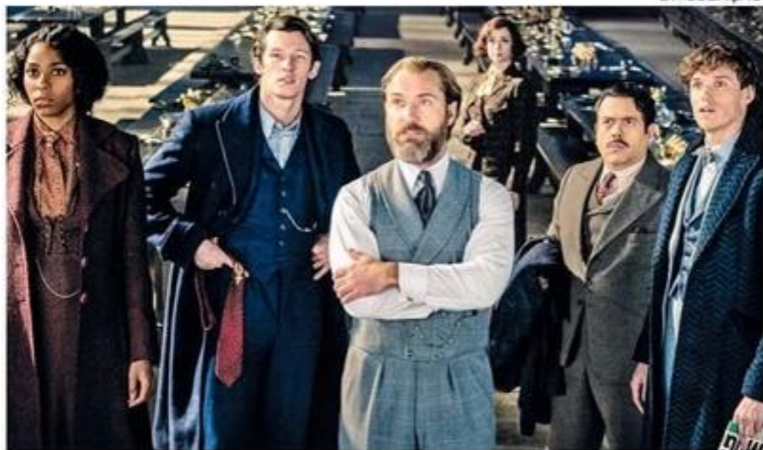
Jude Law interpreta Alvo Dumbledore, que dá nome ao longa