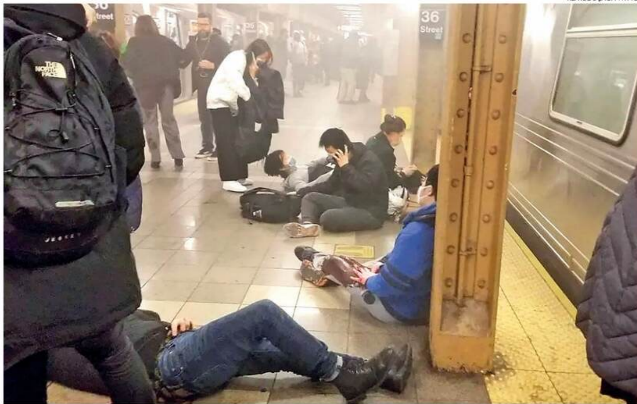
O ataque gerou uma enorme operação de caça comandada pela Polícia de NY. Imagens de um possível envolvido foram divulgadas à noite