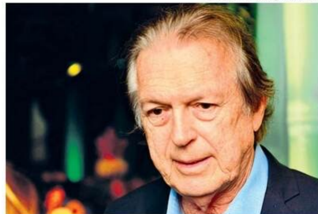
Parlamentares esperam que indicação seja ratificada pela direção da sigla

No PSDB, o nome colocado é o do ex-governador João Dória, que venceu as prévias partidárias, mas ainda enfrenta resistência internas, enquanto o MDB aposta na senadora Simone Tebet (MS). A ideia dos dirigentes é de que a escolha recaia sobre um desses indicados, consi-