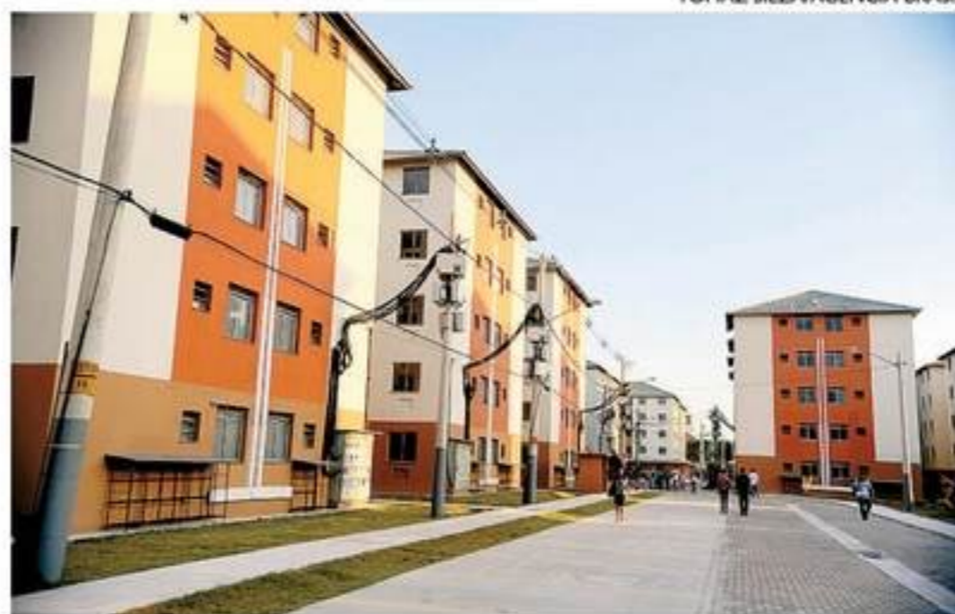
As mudanças na liberação do FGTS começam a valer dia 2 de maio

Tradicionalmente, o trabalhador com financiamento imobiliário pode usar o saldo nas contas do FGTS em seu nome para quitar totalmente ou amortizar (reduzir o valor principal) a dívida da casa própria. Se o trabalhador tiver nas