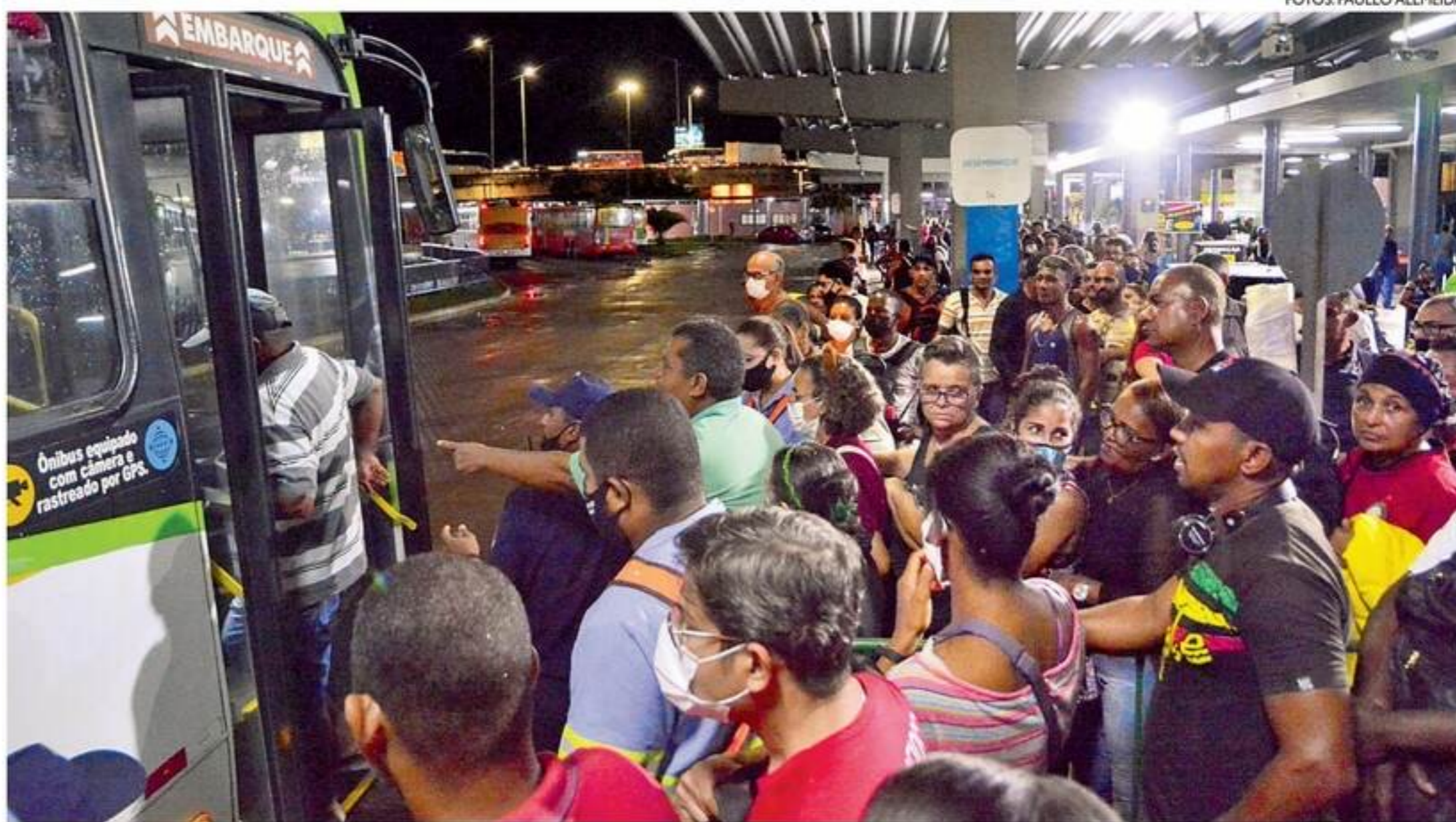
Sem trem, passageiros passaram perrengue na ida para o trabalho e na volta para casa na Região Metropolitana do Recife

Com a interrupção do sistema, muitas pessoas que utilizam a linha relataram dificuldades em voltar