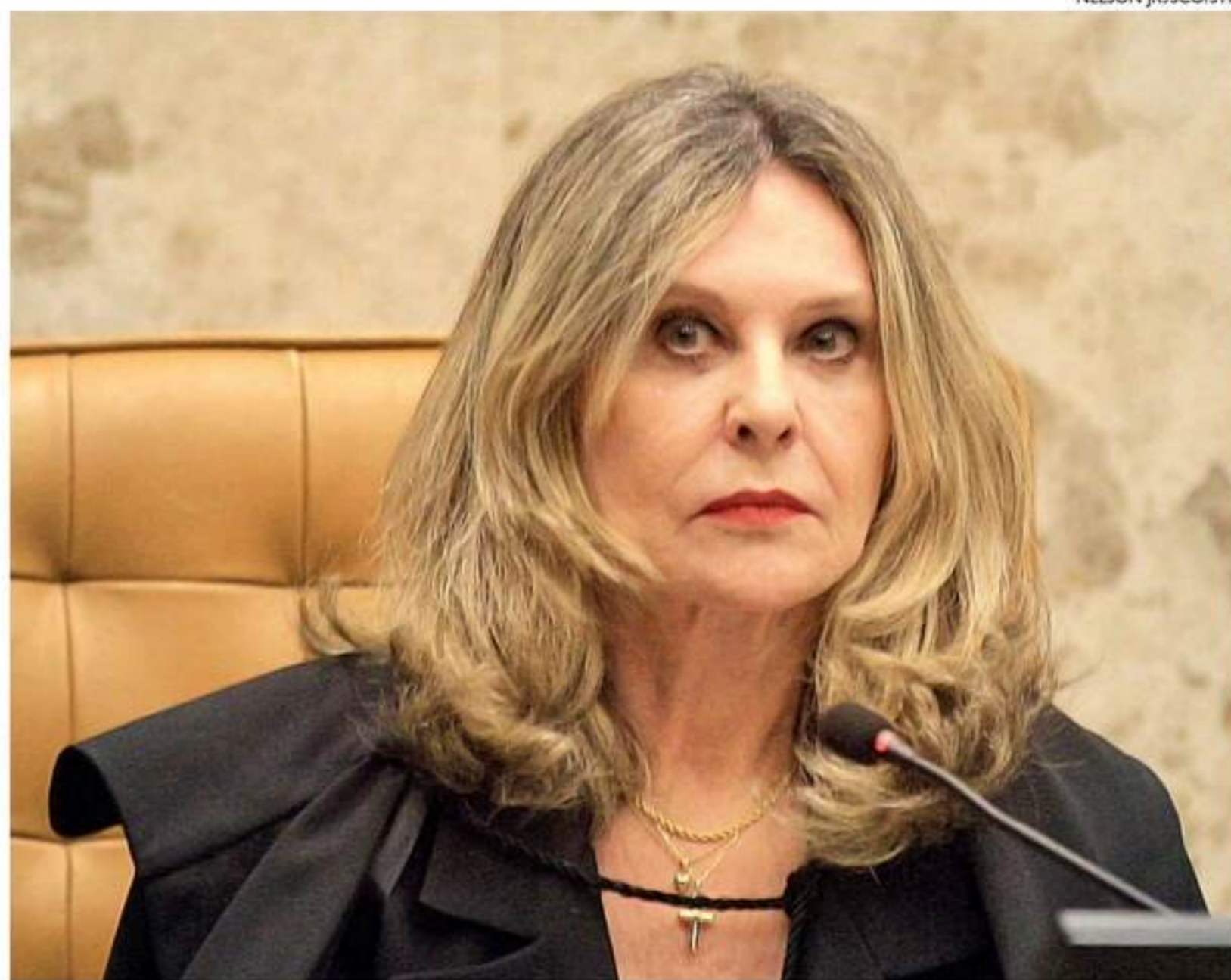
Vice-procuradora não segurou o riso ao relatar frases ditas por deputado contra ministros do STF

A coluna de Edmar Lyra é publicada de segunda a sábado.