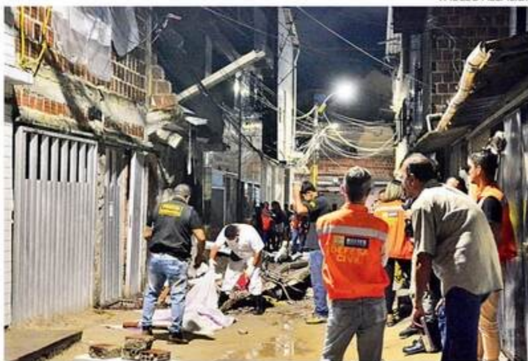
Caso aconteceu na rua Catuira, na Zona Norte do Recife

Um homem de 46 anos morreu ontem após ser atingido por uma marquise de concreto que cedeu de um imóvel. O caso aconteceu na rua Catuira, no bairro da Torre, Zona Norte do Recife. Segundo informações do Samu, o acidente aconteceu por volta das 17h.