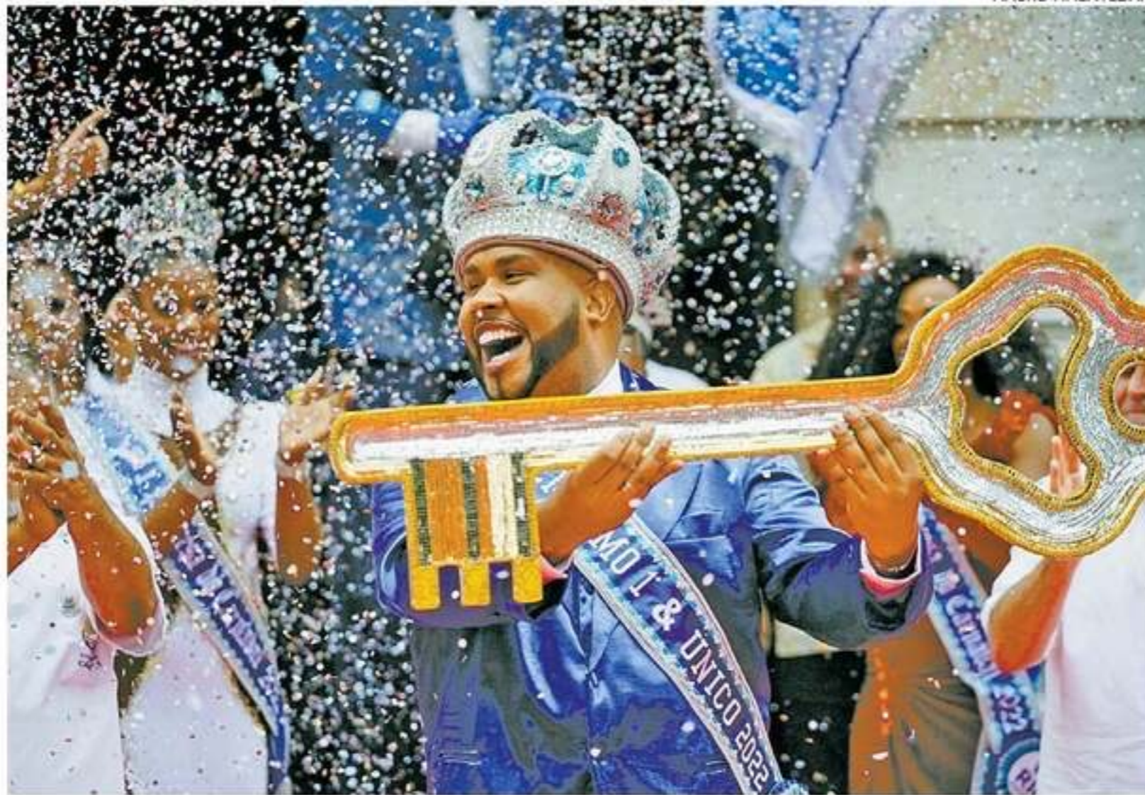
Símbolo do período carnavalesco, Rei Momo segura as chaves da cidade em cerimônia de abertura da festa

Na Sapucaí, começaram ontem os desfiles das escolas da Série Ouro, ou grupo de acesso, a partir das 21h. Na Intendente Magalhães, se apresentam os blocos de enredo. Os