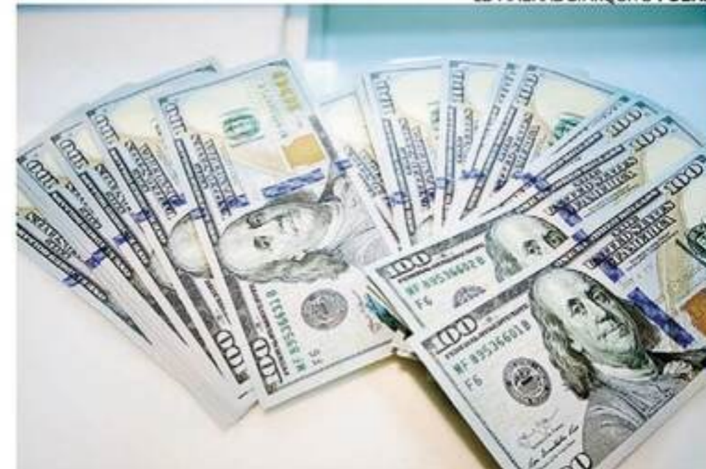
Os juros altos no Brasil ajudaram a baixar a moeda americana