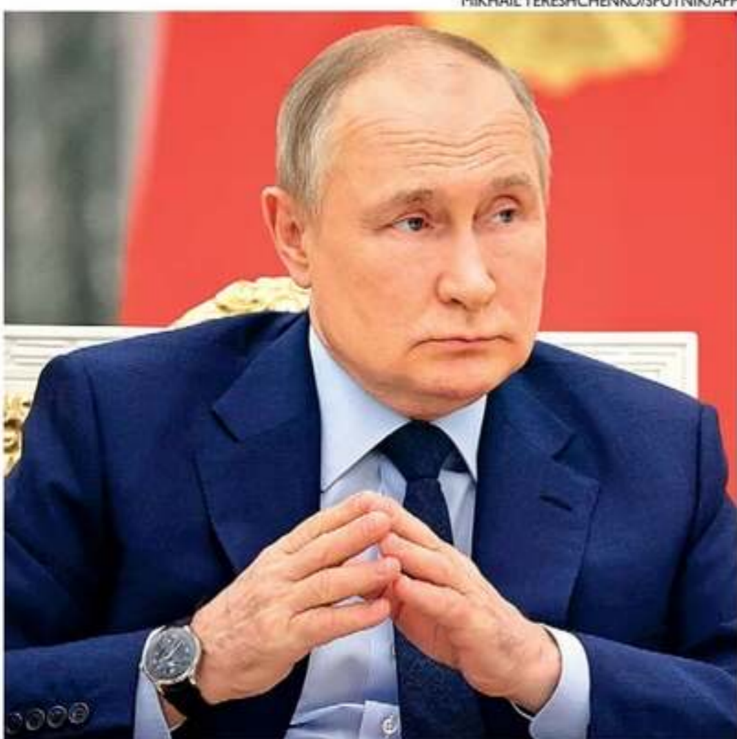
Russo disse que arma pode derrotar “todos sistemas antiaéreos modernos”

O Pentágono declarou, no entanto, que o teste realizado pela Rússia não é considerado uma ameaça pelos Estados Unidos e seus aliados. Moscou “notificou devidamente” a Washington sobre o teste em virtude das obrigações impostas pelo tratado nuclear, por isso “não foi uma surpresa”, afirmou seu porta-voz John Kirby.