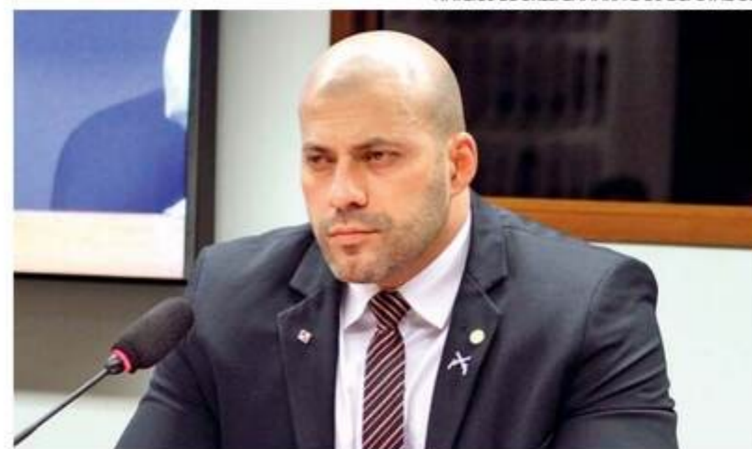
Foram nove votos contra 2 pela prisão do deputado bolsonarista

O ministro Nunes Marques votou pela absolvição do deputado, ressaltando que não ficou caracterizado o crime de ameaça. Segundo ele, as falas não passaram de "bravatas". Embora tenha votado pela condenação, André Mendonça se manifestou a favor da prisão por dois anos e quatro meses em regime aberto. Os dois foram indicados no ano passado pelo presidente