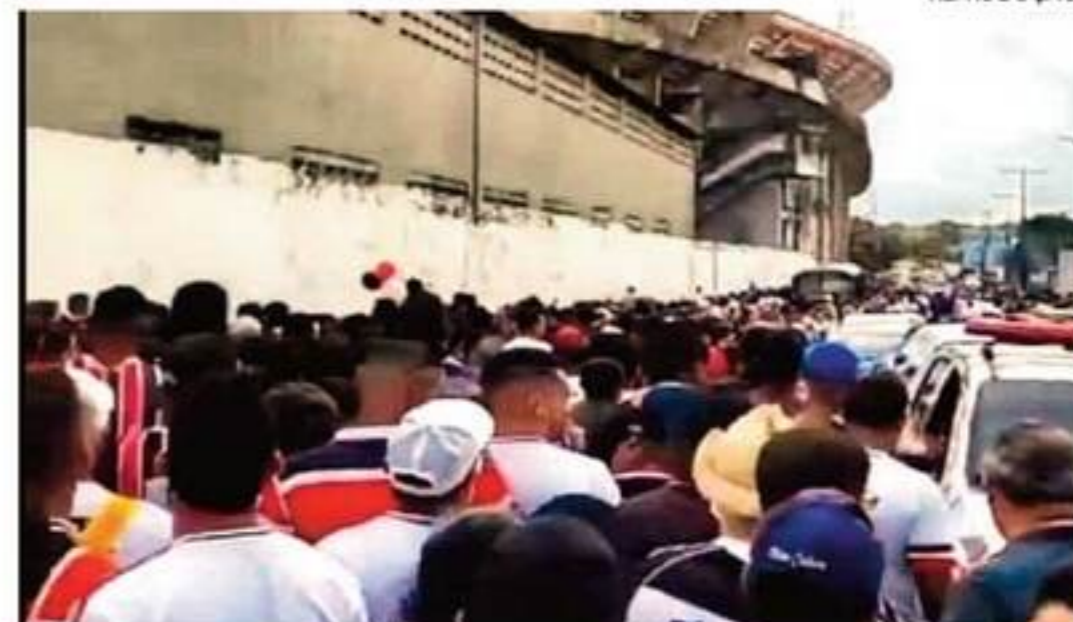
Torcedor enfrentou muitas dificuldades para entrar no Arruda