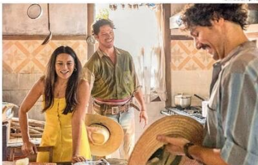
Remake é exibido de segunda a sábado, na faixa das 21h, na TV Globo

Pode-se dizer que "Um Lugar ao Sol" deixou números preocupantes na faixa nobre da Globo. A obra de Lícia Manzo, apesar da inegável qualidade do texto e do elenco irretocável, terminou registrando média geral de apenas 22,3 pontos de audiência. Mas esse índice tão baixo já foi apagado pela sucessora "Pantanal". O remake, que entrou em sua segunda fase recentemente, vem conquistando quase sempre algo acima de 27 e 28 pontos por capítulo, ou seja, por volta de 25% a mais que a antecessora. Nem mesmo a re-