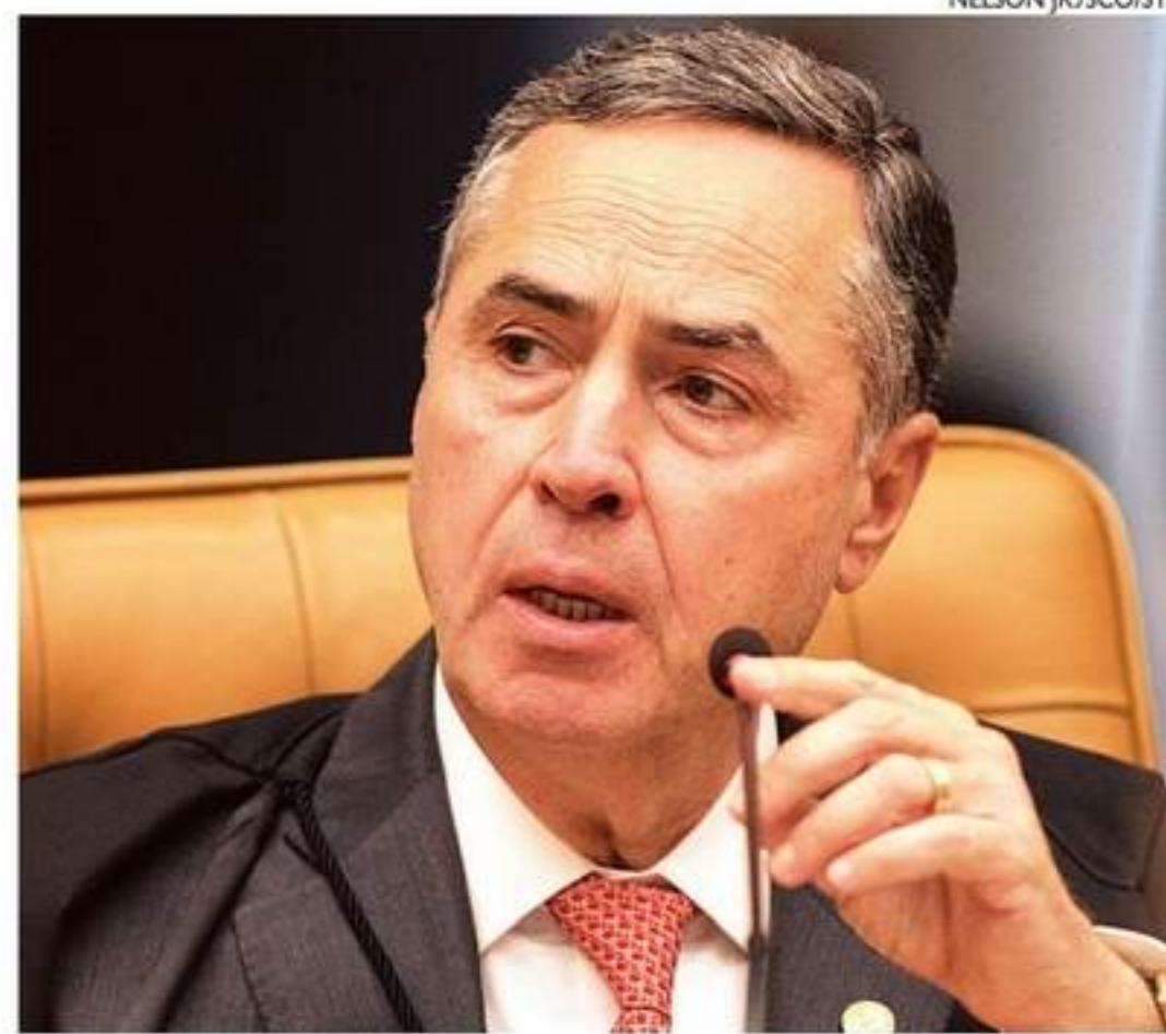
Barroso insinua orientação para “atacar” e “desacreditar” processo eleitoral

Segundo Barroso, existe uma tentativa de levar as Forças Armadas ao “varejo da política”. Para ele, é importante que os comandantes militares evitem isso. No ano passado, em meio à pressão do presidente Jair Bolsonaro, o Tribunal Superior Eleitoral convidou representantes das três Forças para participarem do processo de fiscalização das urnas. “Ataques totalmente infundados e fraudulentos ao processo eleitoral. Desde 1996 não tem nenhum episódio de fraude. Eleições totalmente limpas, seguras. E agora se vai pretender usar as Forças Armadas para atacar. Gentilmente convidadas para par-