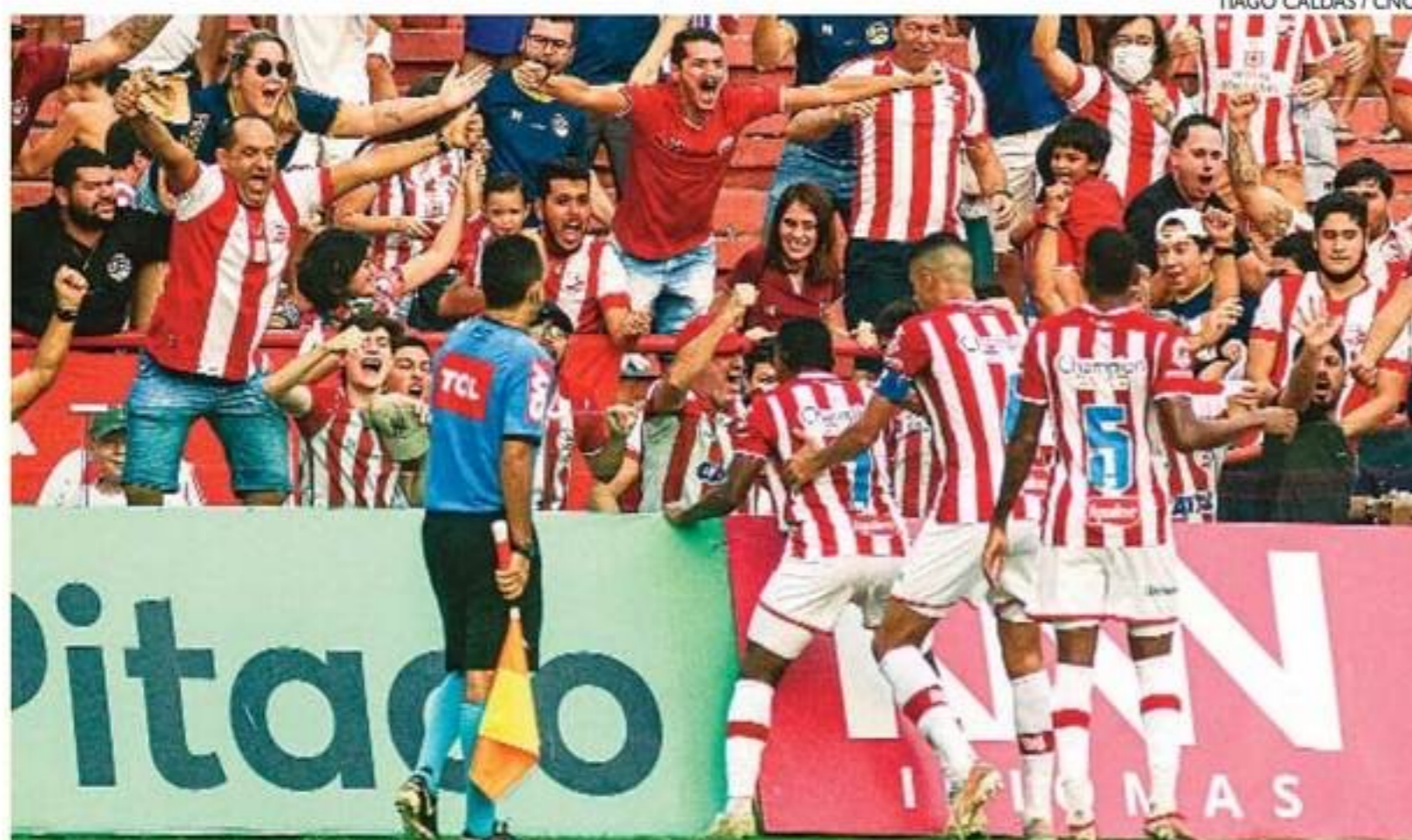
Com a vitória, alvirrubros deixam a lanterna da competição e conseguem amenizar pressão interna

LOTECA Concurso 987 Jogo 1 Palmeiras 3x0 Corinthians (coluna 1) || Jogo 2 Ponte Preta 1x0 CRB (coluna 1) || Jogo 3 Athletico/PR 1x0 Flamengo (coluna 1) || Jogo 4 RB Bragantino 1x1 São Paulo (coluna do meio) || Jogo 5 Sampaio Corrêa 3x1 Brusque (coluna 1) || Jogo 6 Fluminense 0x1 Internacional (coluna 2) || Jogo 7 Ituano 3x1 Vila Nova/GO (coluna 1) || Jogo 8 Tombense 1x1 Cruzeiro (coluna do meio) || Jogo 9 Atlético/MG 2x2 Coritiba (coluna do meio) || Jogo 10 Lazio 1x2 Milan (coluna 2) || Jogo 11 Náutico 2x0 Operário/PR (coluna 1) || Jogo 12 Santos 3x0 América/MG (coluna 1) || Jogo 13 Juventude 0x1 Cuiabá (coluna 2) || Jogo 14 Atlético/GO 1x1 Botafogo/RJ (coluna do meio)