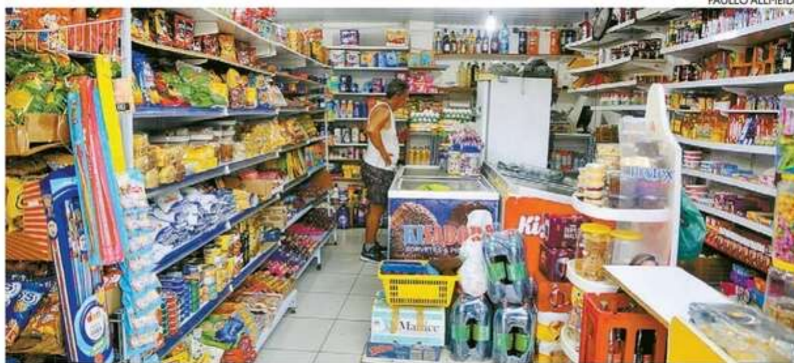
Interessados em investir no setor devem buscar cursos e consultoria

Acesse o portal do Sebrae pelo endereço www.sebrae.com.br ou ligue 0800 570 0800.