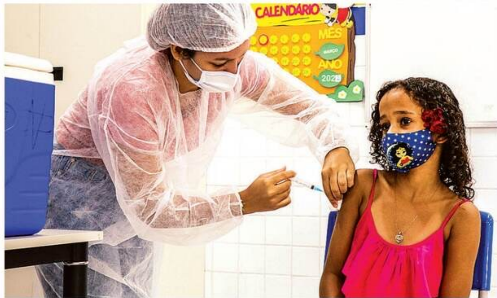
IKAMAHÁ / SECRETARIA DE SAÚDE DO RECIFE

Ampliação dos pontos de vacinação para o público infantil inclui Unidades Básicas Tradicionais e Policlínicas