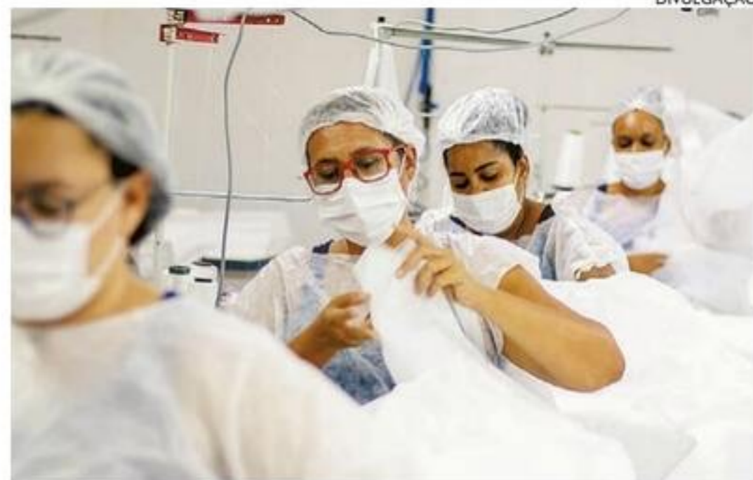
Mulheres que são mães solteiras e de baixa renda são beneficiárias

Ainda é possível se inscrever para a ampliação do Projeto Re Costurando o Futuro. Mesmo o curso já tendo começado, as inscrições estão sendo aproveitadas para gerar um banco de dados e, assim, preencher vagas de acordo com a demanda. As pessoas interessadas podem realizar a inscrição pelo link disponível na bio do perfil do Instagram @institutotravessia. A capacitação é gratuita.