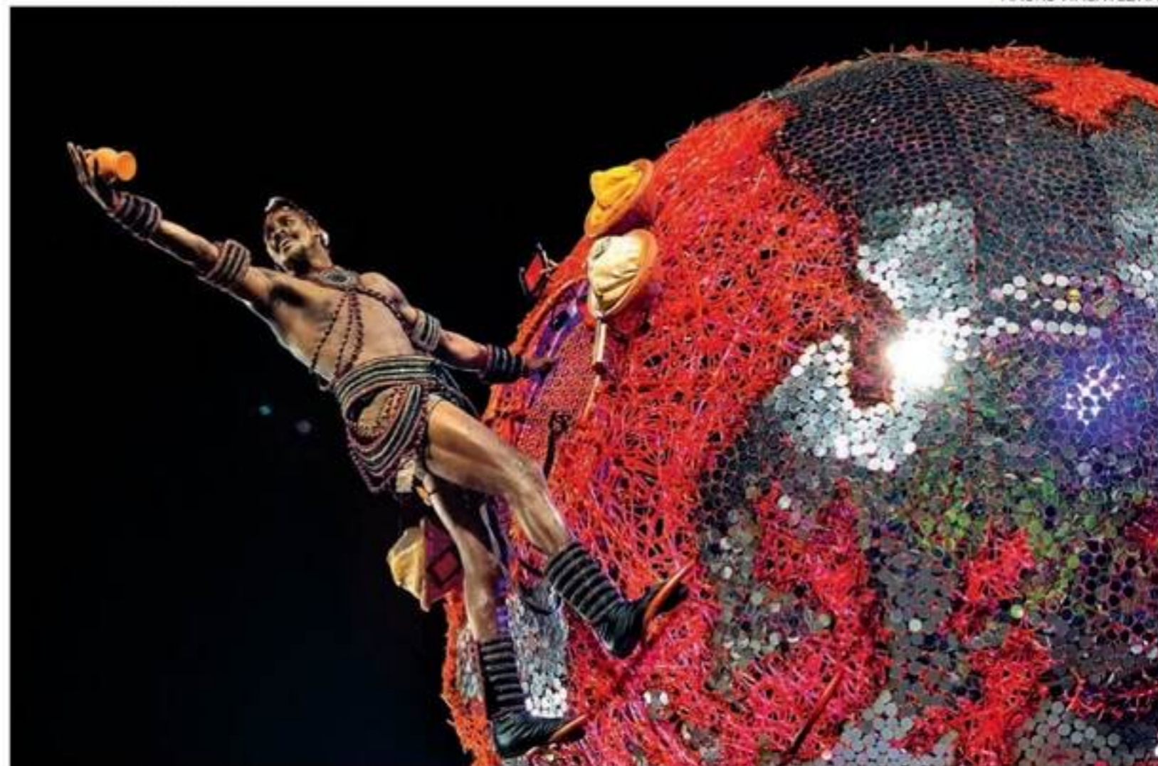
Com o enredo "Fala, Majeté! Sete chaves de Exu", agremiação pregou o fim da intolerância religiosa na Sapucaá

Após o vice-campeonato, tendo empatado em pontos com a campeã Viradouro em 2020, desfilou com o enredo "Fala, Majeté! Sete chaves de Exu", em que também conquistou o Estandarte de