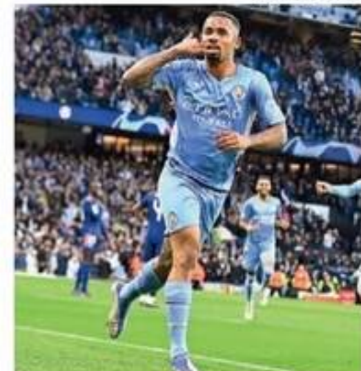
Gabriel Jesus deixou sua marca na vitória do Manchester City