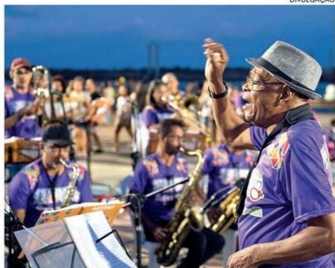
Apresentação será gratuita, em Olinda, com muito frevo, choro e salsa

A Orquestra Arruando começou sua atuação 2013, com a realização de dois shows na Praça do Marco Zero do Recife. Desde o início, seu objetivo é apresentar o mais autêntico frevo fora do período de Carnaval, por entender o gênero como a mais autêntica manifestação artística e cultural do Brasil. Por vê-lo como a afirmação da identidade irredenta desse ativo e forte povo pernambucano.