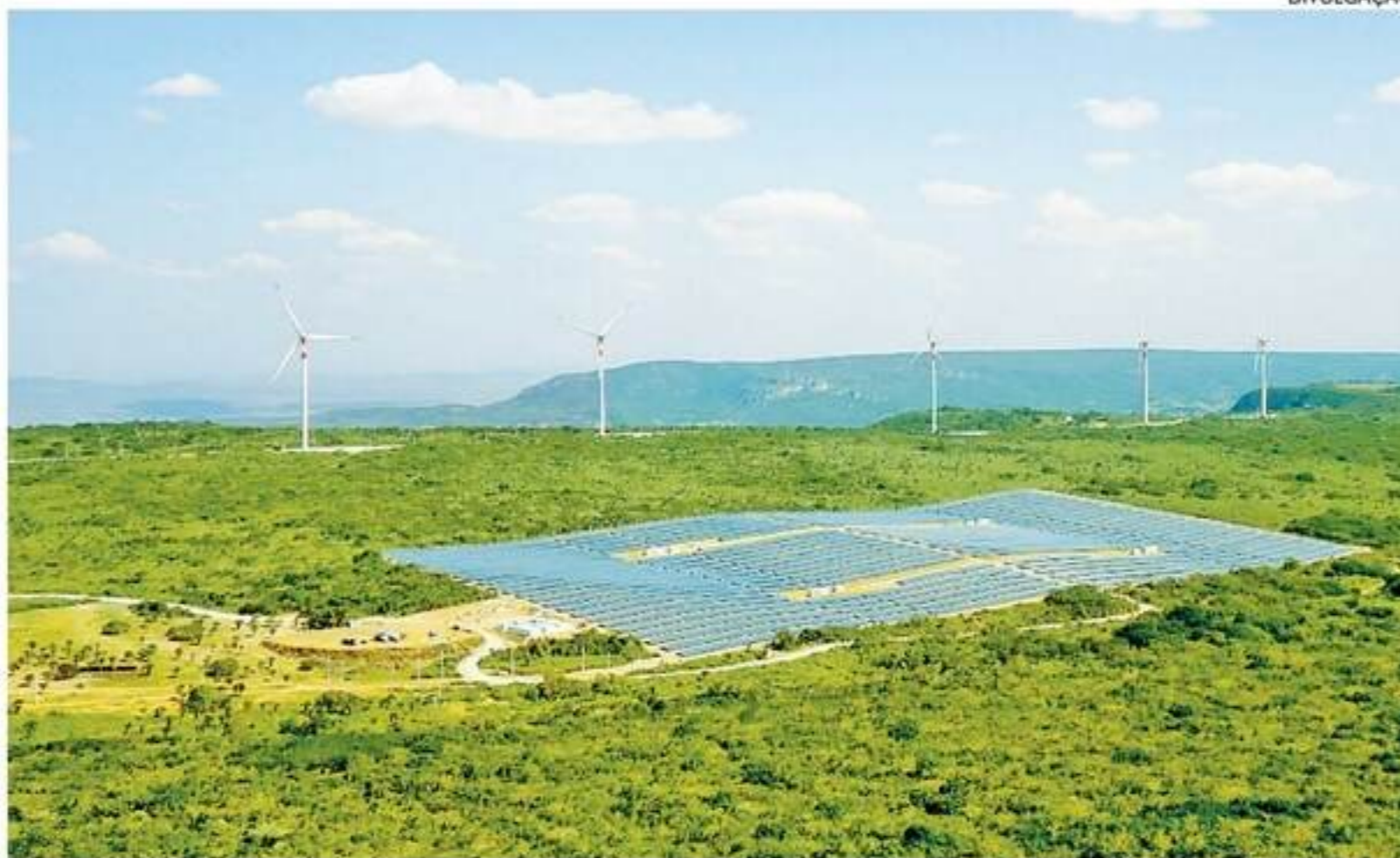
Os aerogeradores do Fontes II podem gerar mais de 421 GWh de energia renovável e limpa por ano