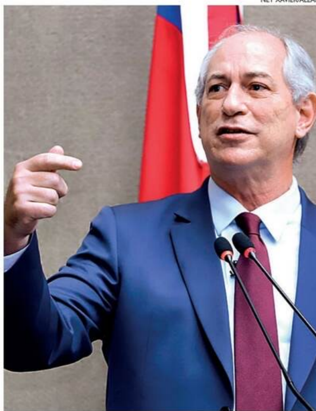
Ciro: o "sim" para o encontro existe, pois quer apresentar ideias

Em entrevista à Rádio Bandeirantes, ontem, o pré-candidato à Presidência da República pelo PDT, ex-ministro Ciro Gomes, revelou que recebeu um convite do presidente nacional do União Brasil, deputado federal Luciano Bivar (PE), para participar de um encontro com a cúpula da terceira via, formada também pelo PSDB, MDB e Cidadania.