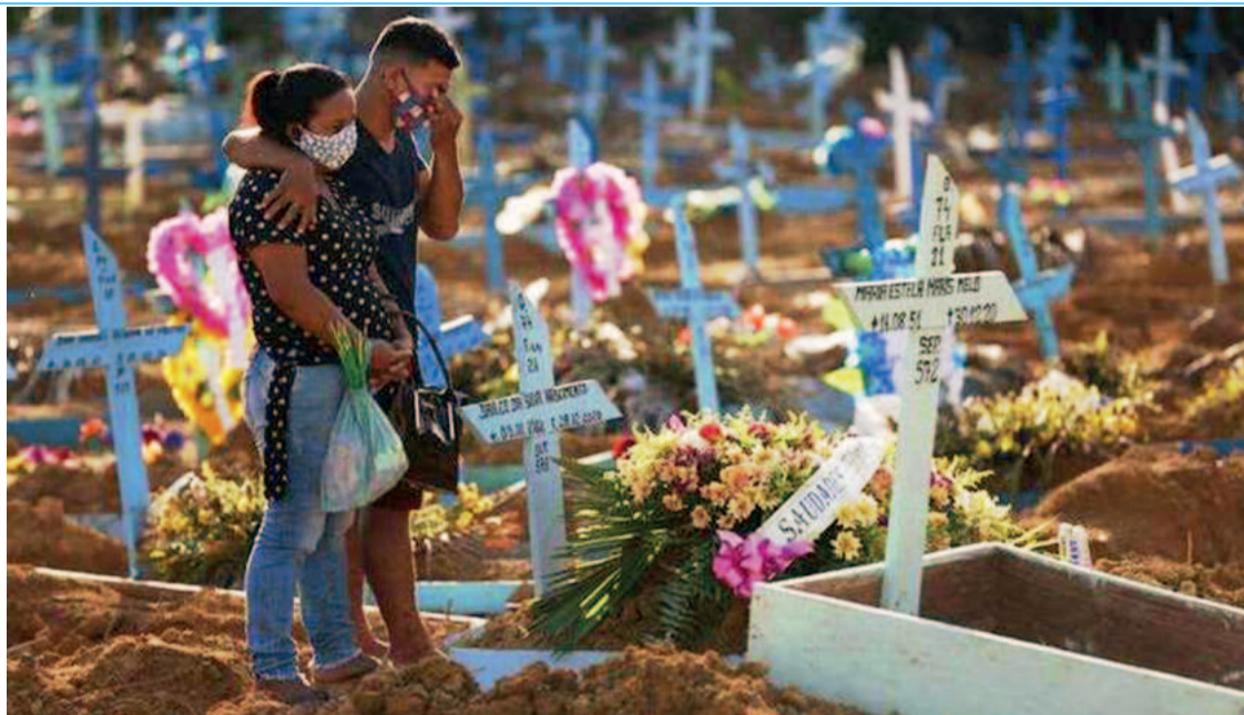
Em dados absolutos, número divulgado pela OMS em relação ao Brasil foi de 681 mil

É por isso que alguns países tiveram índice negativo de mortes em excesso - como a China (taxa de mortalidade por 100 mil habitantes de -2), Nova Zelândia (taxa de -3) e Japão (-8). (Correio Braziliense)