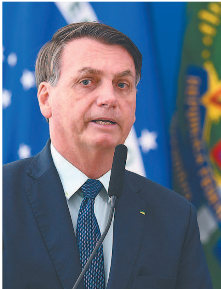
Presidente voltou ao Nordeste para entregar obra

As denúncias levaram à queda do ex-ministro da pasta Milton Ribeiro. Aliados do presidente teriam comentado ser ruim para a campanha de reeleição do presidente manter o pastor evangélico no cargo. O ex-ministro do Turismo Marcelo Álvaro, contudo, continuou no car-