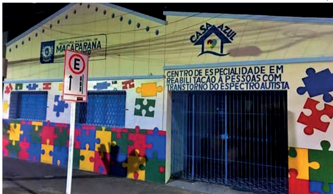
Centro tem recebido alta demanda de cidades vizinhas e não tem dado conta da procura

Atendimento a crianças com espectro autista (TEA) tem sido um exemplo. Assembleia quer expandir o modelo