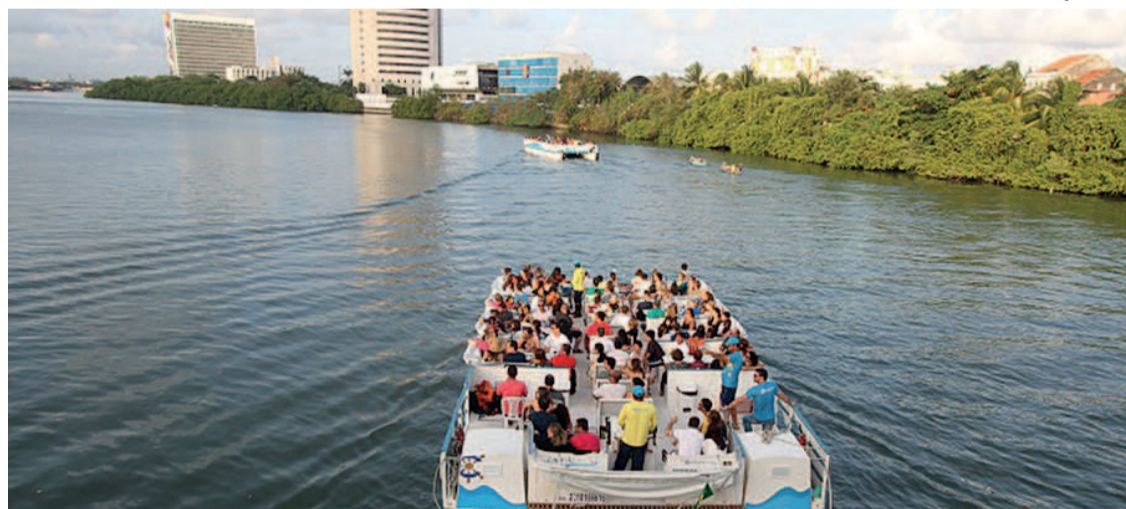
Programação faz parte do projeto Olha!Recife. Vagas são limitadas e já estão abertas

Domingo (8) tem também opção de passeio de bicicleta com o tema Recife Mãe. O roteiro será dedicado aos atrativos e monumentos que homenageiam gran-