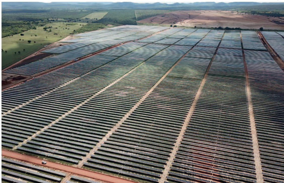
Pernambuco tem o maior parque solar da América Latina, em São José do Belmonte

Segundo a Kroma, a energia gerada pelo parque será suficiente para abastecer o equivalente à toda população do Sertão do Pajeú, região que reúne 20 municípios e cerca 400 mil habitantes. Entre os municípios, Serra Talhada, Afogados da Ingazeira, Sertânia e São José do Belmonte,