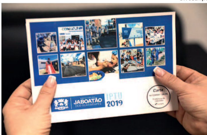
O Refis do município vai até 31 de agosto deste ano

ficia quem tem débitos até o dia 31 de agosto de 2022, tendo os mesmos descontos. No caso do ITBI, o pagamento pode ser feito em dez vezes, sem abatimentos.