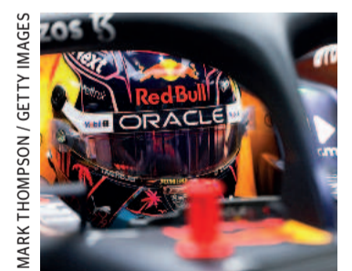
Verstappen busca o bicampeonato mundial

Com 86 pontos contra 59 do holandês, Leclerc continuará na liderança do Mundial de pilotos mesmo que não complete a corrida em Miami, mas sabe que qualquer erro na disputa pelo título pode custar caro.