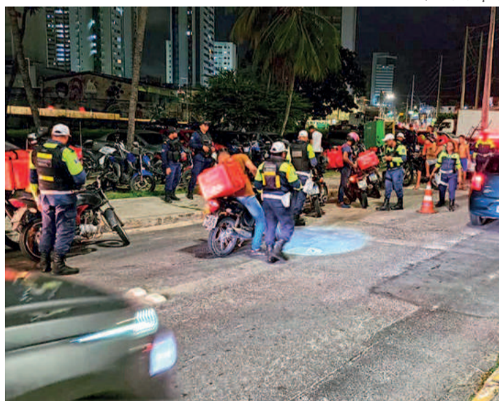
Primeira Operação Scanner foi na última quarta-feira

A operação contou com policiais militares do 19º BPM, BP-Tran, BPRp, CIPCães, CIPMoto, além de efetivos de forças amigas participantes, como o Grupamento Tático Aéreo (GTA), da Secretaria de Defesa Social, Operação Lei Seca e CTTU. A coordenação ficou com o comando do 19º BPM, responsável pela área beneficiada de ontem. A ação recebeu o nome Operação Scanner, e faz parte da Diretoria Integrada Metropolitana (DIM).