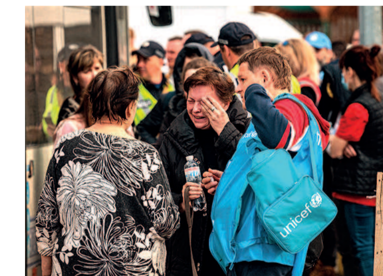
Rússia havia prometido cessar-fogo diurno de três dias