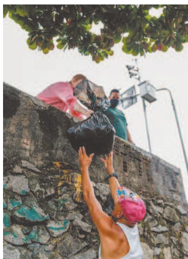
Muitos levam pessoalmente suas doações aos moradores

A Prefeitura do Recife, por sua vez, tem feito ações voltadas para a saúde dos moradores, como atendimento médico, aplicação de vacinas, aferição de pressão e higiene bucal. A gestão municipal também atua na confecção de documentos.