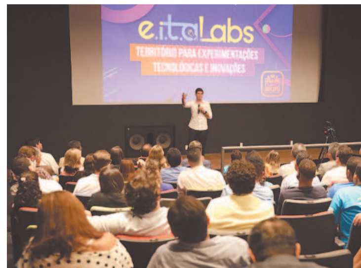
João Campos: edital do EITA Labs permite inovações