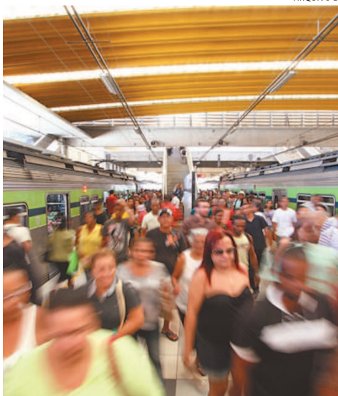
Apesar da decisão, metrô não vai parar imediatamente

A decretação do estado de greve não significa paradas imediatas no transporte. Ape-