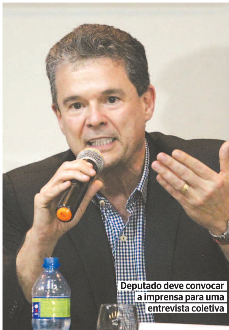
Deputado deve convocar a imprensa para uma entrevista coletiva