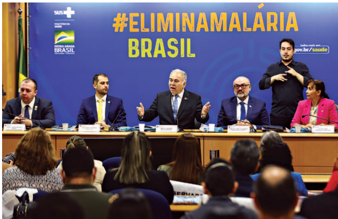
Ministério da Saúde fez um investimento de R$ 21 milhões para prevenção e controle

Uma alta porcentagem de transmissão da malária, 99,9% de acordo com o ministério, se concentra na região amazônica