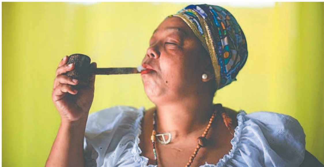
Minuto na Jurema surge como forma de reafirmação da memória afro-indígena