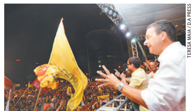
TERESA MAIA / D.A. PRESS