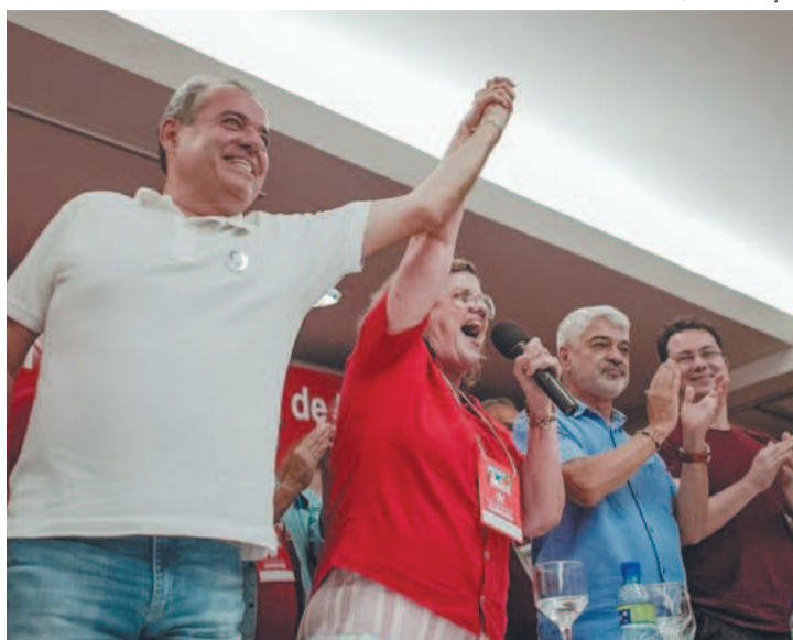
Congresso petista reuniu lideranças da Frente Popular