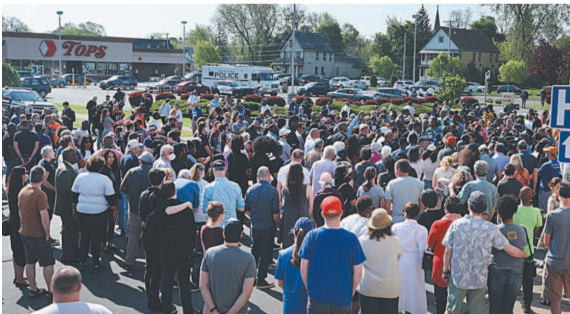
Os moradores se reuniram na parte externa do supermercado para fazer uma vigília

O incidente trouxe à tona lembranças de alguns dos piores ataques racistas na história recente do país, como o assassinato de nove fiéis em uma igreja da comunidade negra na Carolina do Sul por um jovem branco em 2015. (AFP)