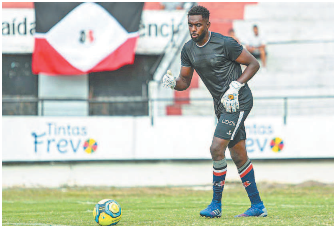
RAFAEL MELO/SANTA CRUZ

O cenário, inclusive, é ainda mais preocupante se o desempenho defensivo de todas as 64 equipes participantes da Quarta Divisão do Brasileiro for colocado na balança. Nesse recorte, o Santa Cruz figura na 12ª posição, dividindo o posto com outras sete equipes. Seguindo a fila, além de ASA e CSE, Humaitá, Juventude Samas e Aimoré somam oito gols levados, enquanto Sousa (9), Tuna