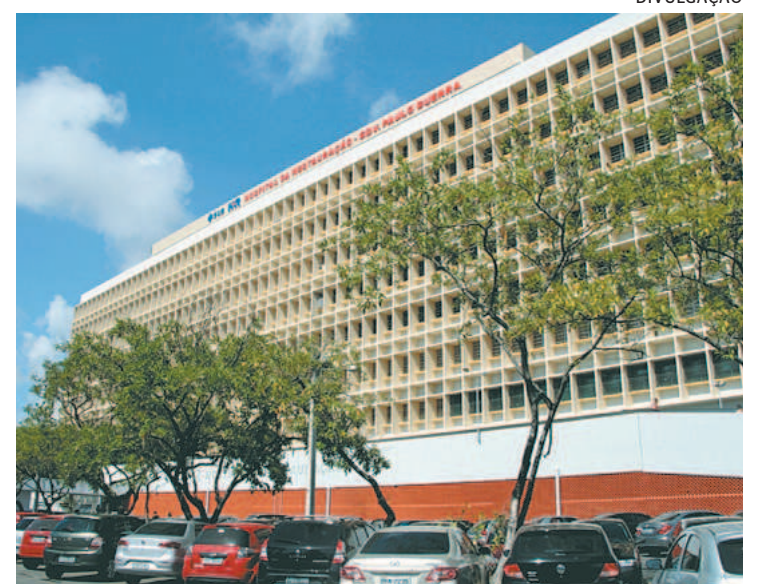
No dia 2, parte do forro do teto desabou sobre pacientes

reforma da estrutura interna e externa da unidade, noticiado na audiência do dia 12 de maio. Uma inspeção foi realizada, no dia 4 de maio, no setor de trauma da unidade de saúde, pela promotora de Justiça Eleonora Marise Silva Rodrigues e as equipes de médicos e de engenheiros do MPPE. No dia 12 de maio, foi realizada uma audiência com o objetivo de apurar a grave situação de superlotação das unidades da rede estadual de saúde, em especial o Hospital da Restauração, bem como as providências adotadas pela Secretaria Estadual de Saúde (SES-PE) para abertura de leitos de retaguarda em número