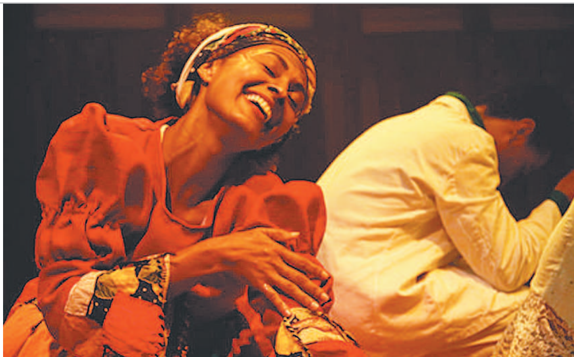
A premiada peça Cordel do amor sem fim marcará a reabertura do local, sábado, às 20h