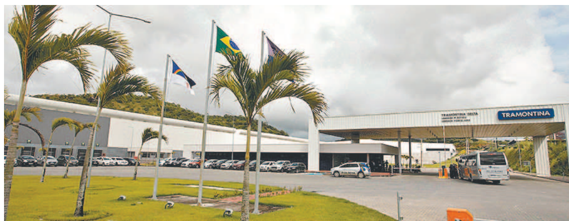
Linha de produção da fábrica é voltada para os mercados brasileiro e internacional

Unidade aberta em Moreno, na RMR, recebeu aporte de cerca de R$ 400 milhões e tem capacidade para produzir 46 mil peças diárias, entre pratos e xícaras