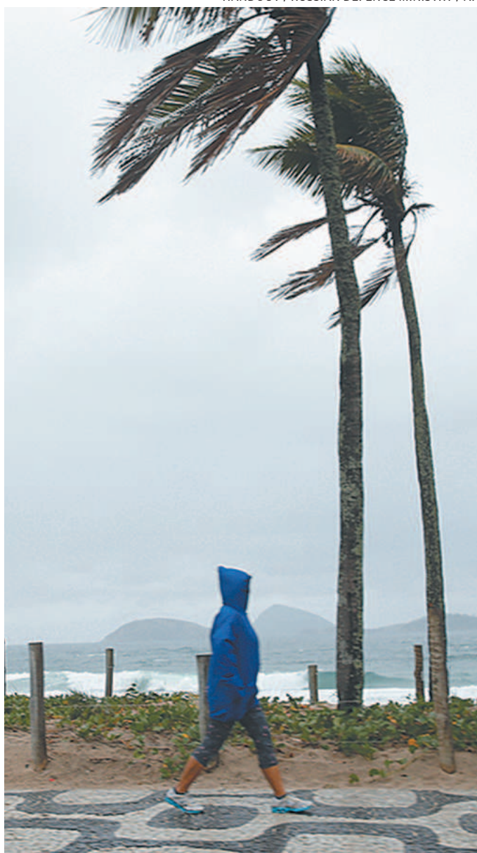
Tempestade pode se deslocar para a Região Sudeste no fim de semana, mas com menos força

“Estas condições persistem, pelo menos, até o final de semana quando volta a ter condições de geada no Sul do país. Segue a condição de neve até a próxima quarta (hoje) nas serras Gaúcha e Catarinense e sul do Paraná”, completou. O In-