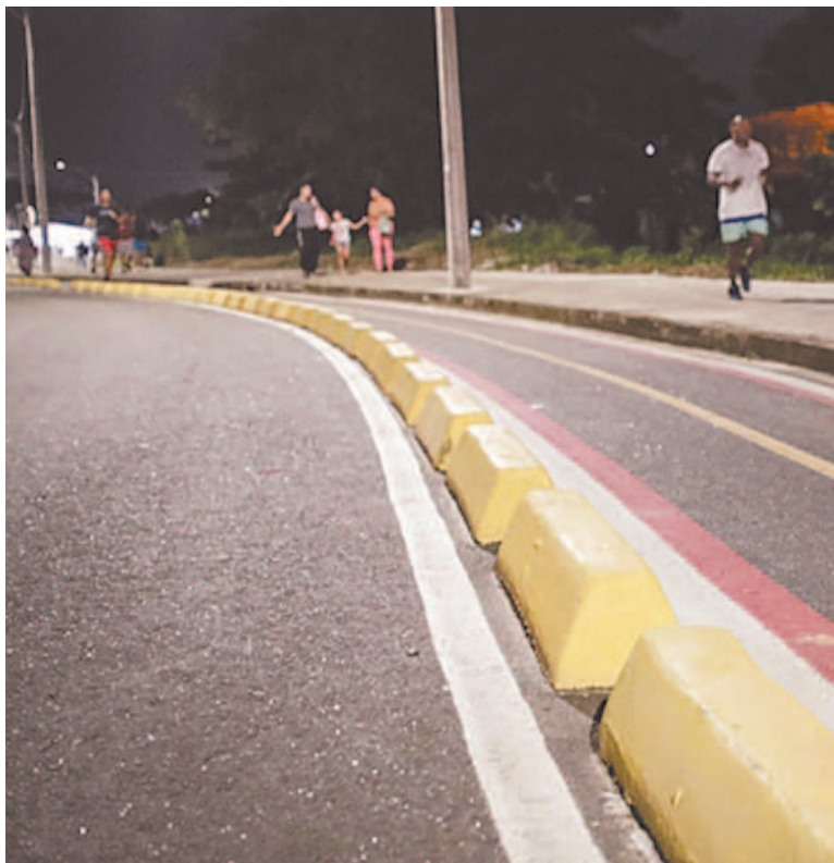
Lote 3 liga o bairro do Arruda à BR-101 e custou R$ 18 milhões