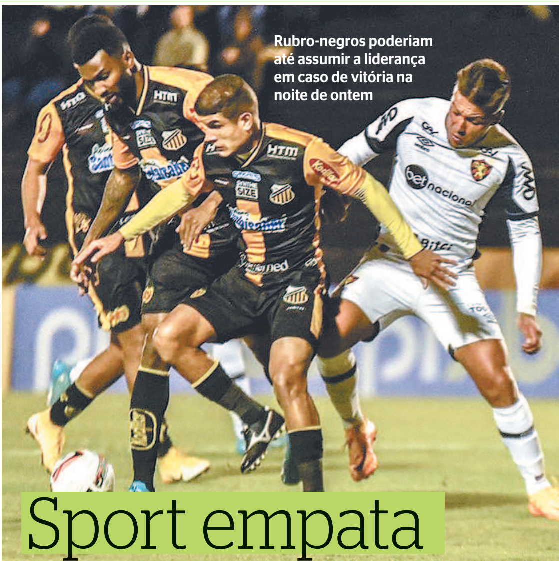
Rubro-negros poderiam até assumir a liderança em caso de vitória na noite de ontem