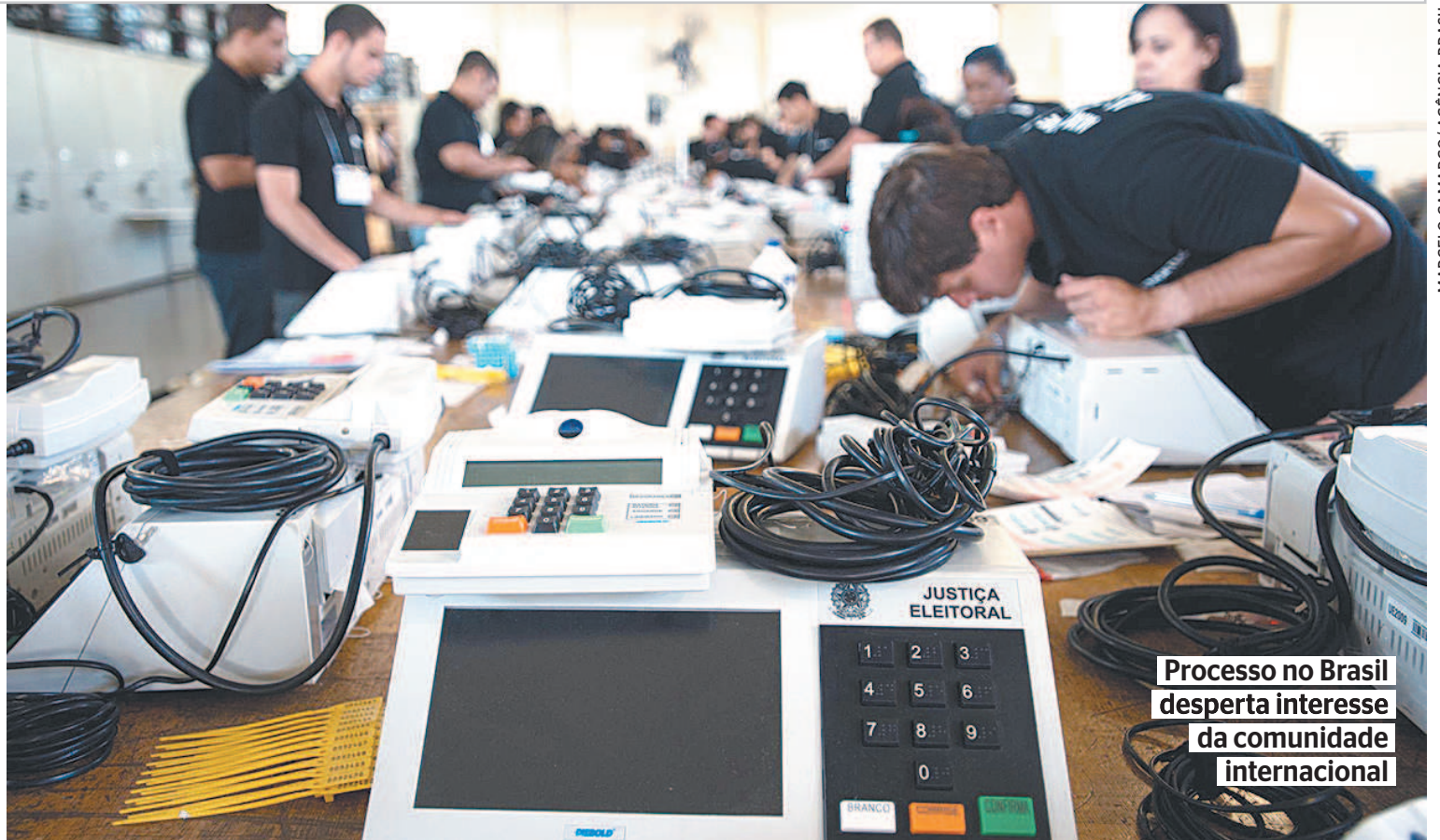
Processo no Brasil desperta interesse da comunidade internacional

Entre os órgãos que foram convidados para observar o pleito no Brasil deste ano estão a OEA e o Parlamento do Mercosul