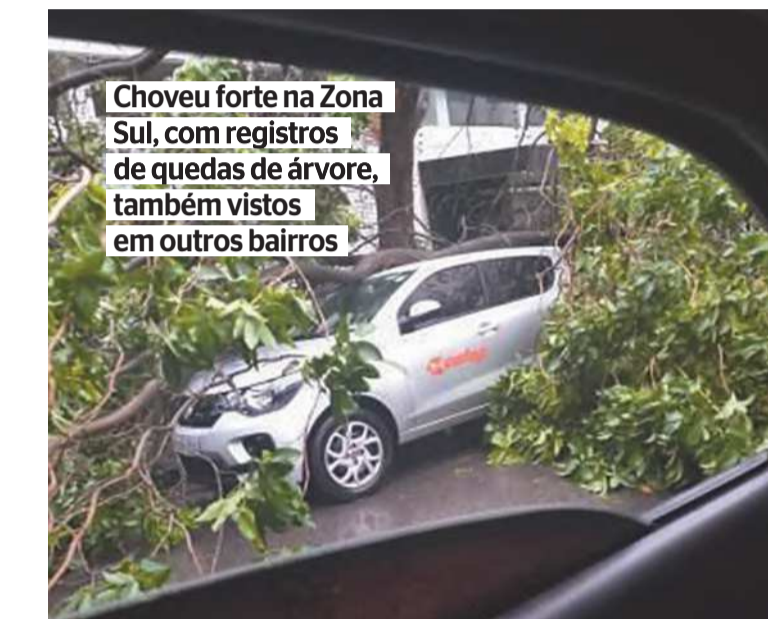
REPRODUÇÃO DO WHATSAPP

Na Zona Norte, houve inundações em casas em áreas baixas. Muitas ruas e avenidas ficaram alagadas. No Vasco da Gama, o muro de uma escola caiu. Também houve registros de queda de árvores.