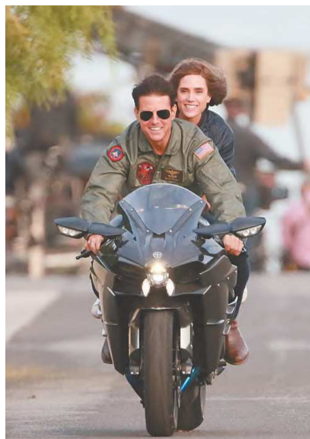
Tom Cruise e Jennifer Connelly: par romântico

Num projeto que parece ter como fim o equilíbrio da reverência às origens com a injeção de vitalidade tecnológica, é coerente que o novo Top Gun - para toda primazia técnica - seja um blockbuster de apelos clássicos e uma ode nostálgica a esse ideal à moda antiga de hombridade.