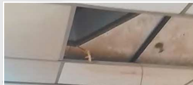
REPRODUÇÃO DO WHATSAPP

A Secretaria de Saúde do Estado informou na semana passada que deve lançar em breve o edital de licitação para reforma do Hospital da Restauração, que é a maior unidade de saúde do estado. As obras nas redes elétrica e hidráulica custarão R$ 9,1 milhões.