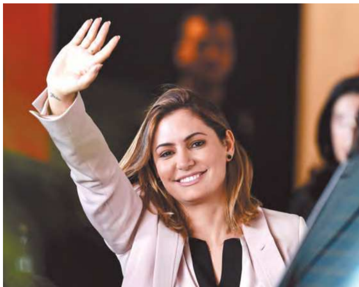
Primeira-dama deve aparecer na propaganda eleitoral