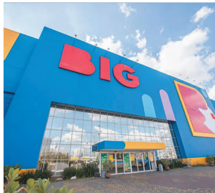
Estabelecimentos do Big foram vendidos por R$ 7,5 bi

A compra do Big, por cerca de R$ 7,5 bilhões, foi anunciada pelo Carrefour em março do ano passado. O negócio inclui as 387 lojas de autosserviço do grupo, 15 postos de combustíveis e 11 centros de distribuições das bandeiras Todo Dia e Bompreço, presentes em cidades pernambucanas, e Nacional. O Carrefour fechou o primeiro trimestre deste ano com 779 pontos de venda. Destes, 252 possuem a bandeira do Atacadão, a maior rede de atacarejos do país.