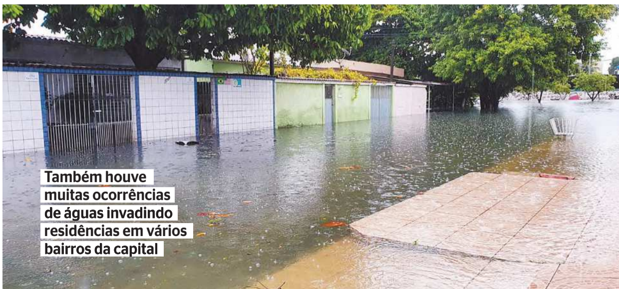
REPRODUÇÃO DO WHATSAPP

Ontem, toda a Região Metropolitana do Recife não teve aulas, em movimentos que se iniciaram, de manhã bem cedo, no ensino público e chegaram às universidades. Hoje, as aulas devem voltar ao Recife, mas permanecem suspensas (pelo menos nas escolas públicas) em Olinda, Cabo e Ipojuca. A Universidade de Pernambuco (UPE) e a Universidade Católica terão aulas online nesta quinta-feira.