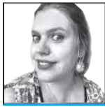
Carolina Ferraz *