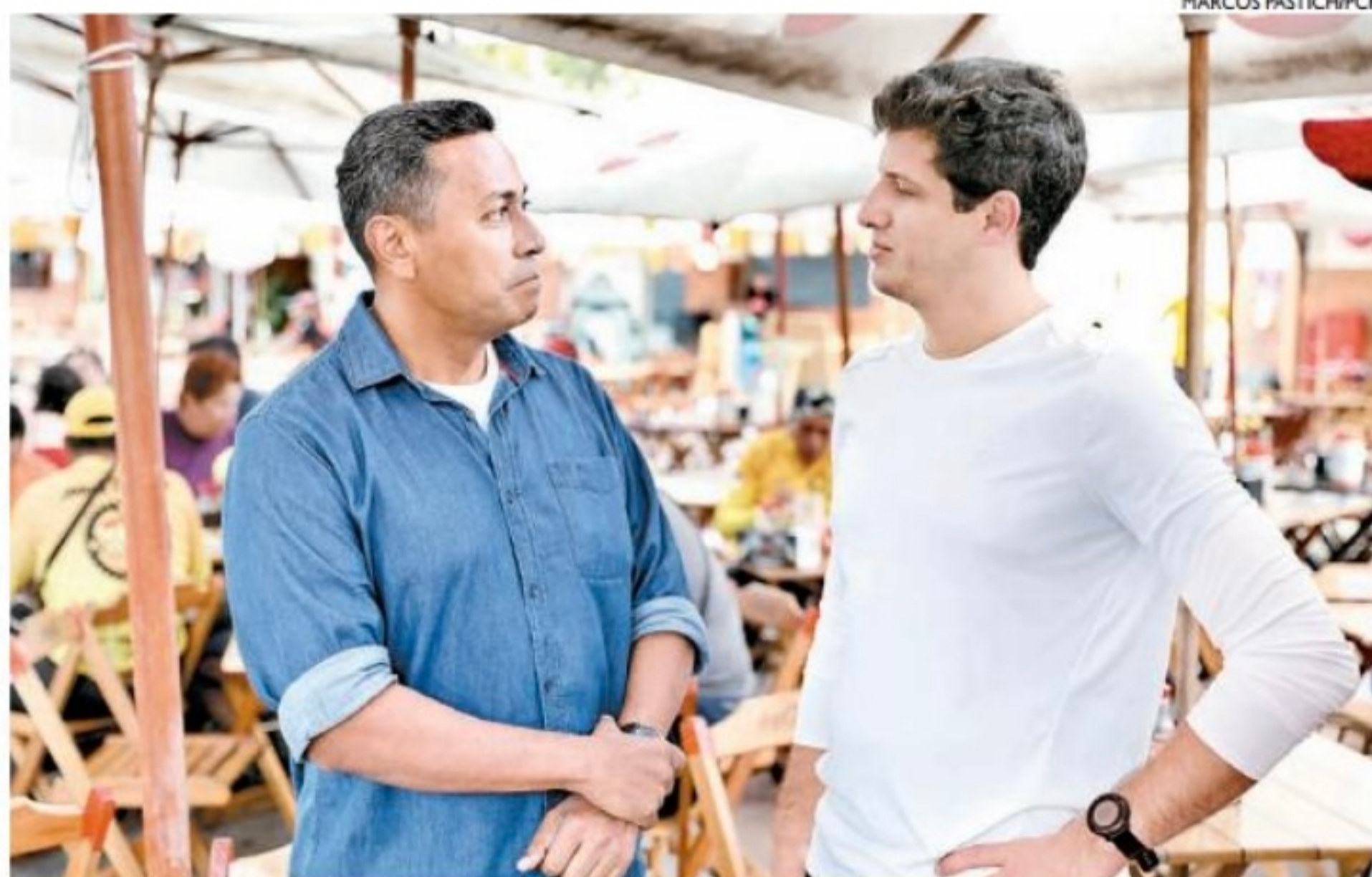
O prefeito João Campos foi ao Mercado da Boa Vista para divulgar as medidas com foco no trabalho

A coluna de Carlos Britto é publicada de segunda a sexta.