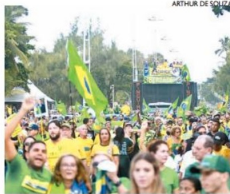
Em Boa Viagem, manifestantes fizeram críticas ao ex-presidente Lula e a instituições como o STF

A coluna de Edmar Lyra é publicada de segunda a sábado.