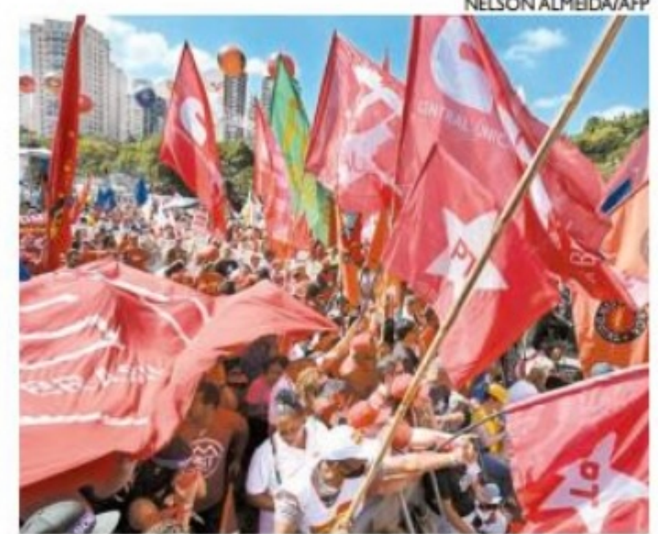
Centrais sindicais, estudantes e partidos de oposição protestaram contra Bolsonaro

Principais cidades do País registraram manifestações de apoio ao presidente Jair Bolsonaro e ao ex-presidente Lula, numa prévia da disputa eleitoral