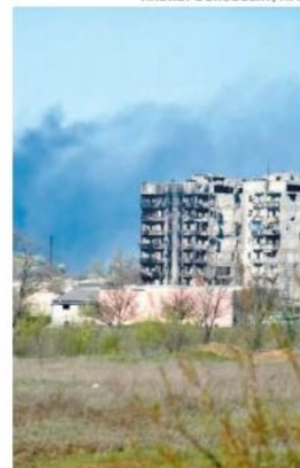
Condições do lugar são “brutais”

Azovstal. O primeiro grupo de quase 100 civis já está a caminho de uma área controlada. Amanhã nos reuniremos com eles em Zaporizhzhia”, escreveu Zelensky no Twitter. O ministério russo da Defesa afirmou que 80 civis deixaram a área e foram levados para os territórios controlados por Moscou.