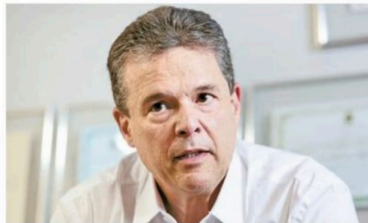
André convocou coletiva para hoje. Ele deve anunciar seu futuro político

Um aliado do Palácio demonstrou sua insatisfação com a possibilidade de André não ser o sena-