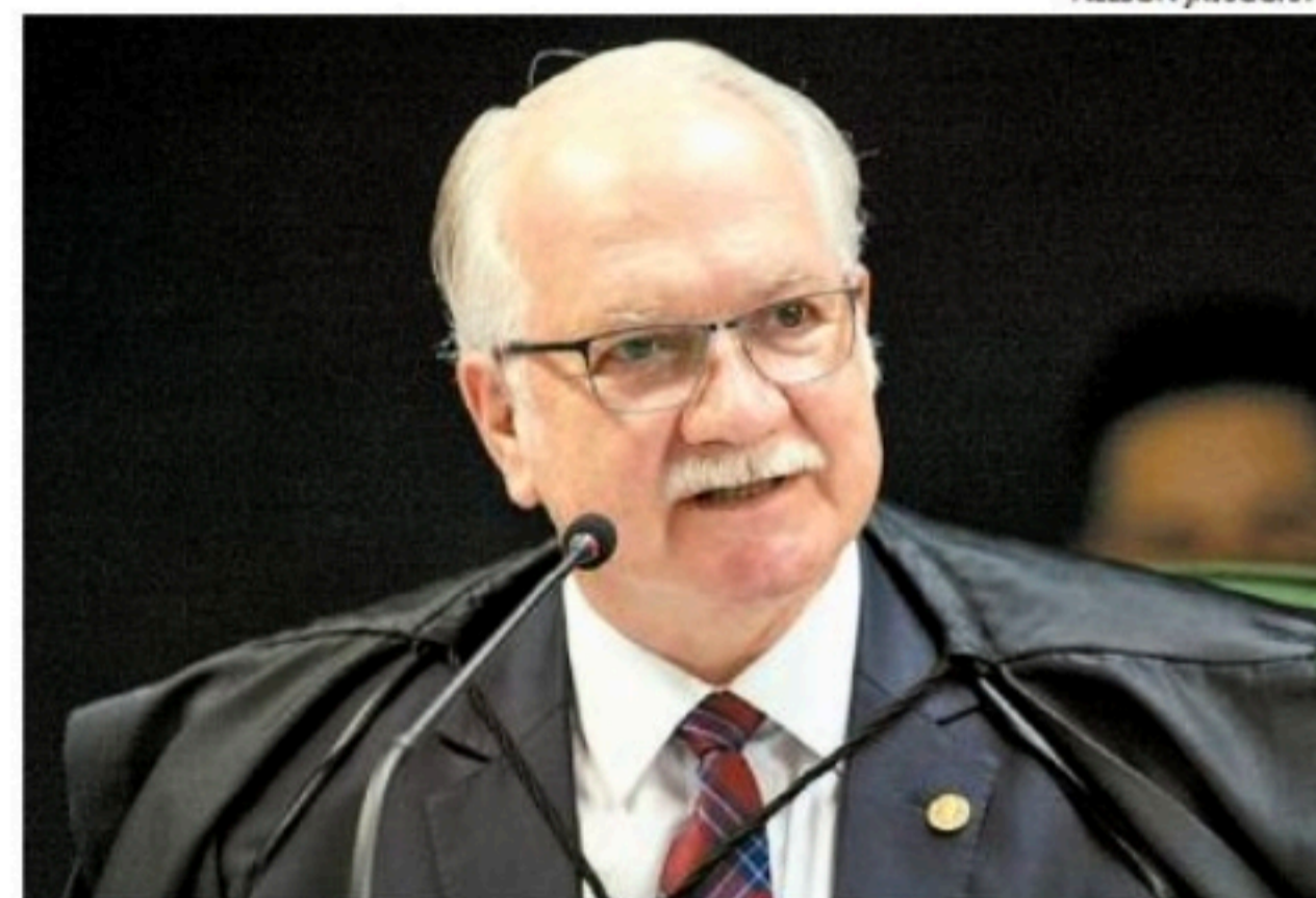
Edson Fachin: "Não há paz sem tolerância e sem respeito mútuo"

"O nosso êxito e credibilidade têm raiz na crença que compartilhamos de que a democracia é inegociável, de que a Justiça Eleitoral é um patrimônio imaterial da sociedade brasileira e de que ata-