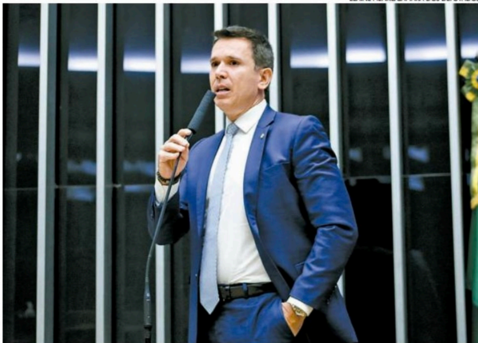
Felipe Carreras: "Achamos que era fundamental ter uma atualização da Lei do Esporte"

C riada em 1998, no intuito de estabelecer normas para diversos assuntos referentes à condução do esporte brasileiro, a Lei Geral dos Esportes (Lei nº 9.615) deve passar por modernização em breve. O texto do deputado federal Felipe Carreras (PSB) traz inovações, após meses ouvindo a comunidade esportiva nacional, enquanto presidente da Comissão do Esporte da Câmara até a reta final de abril.