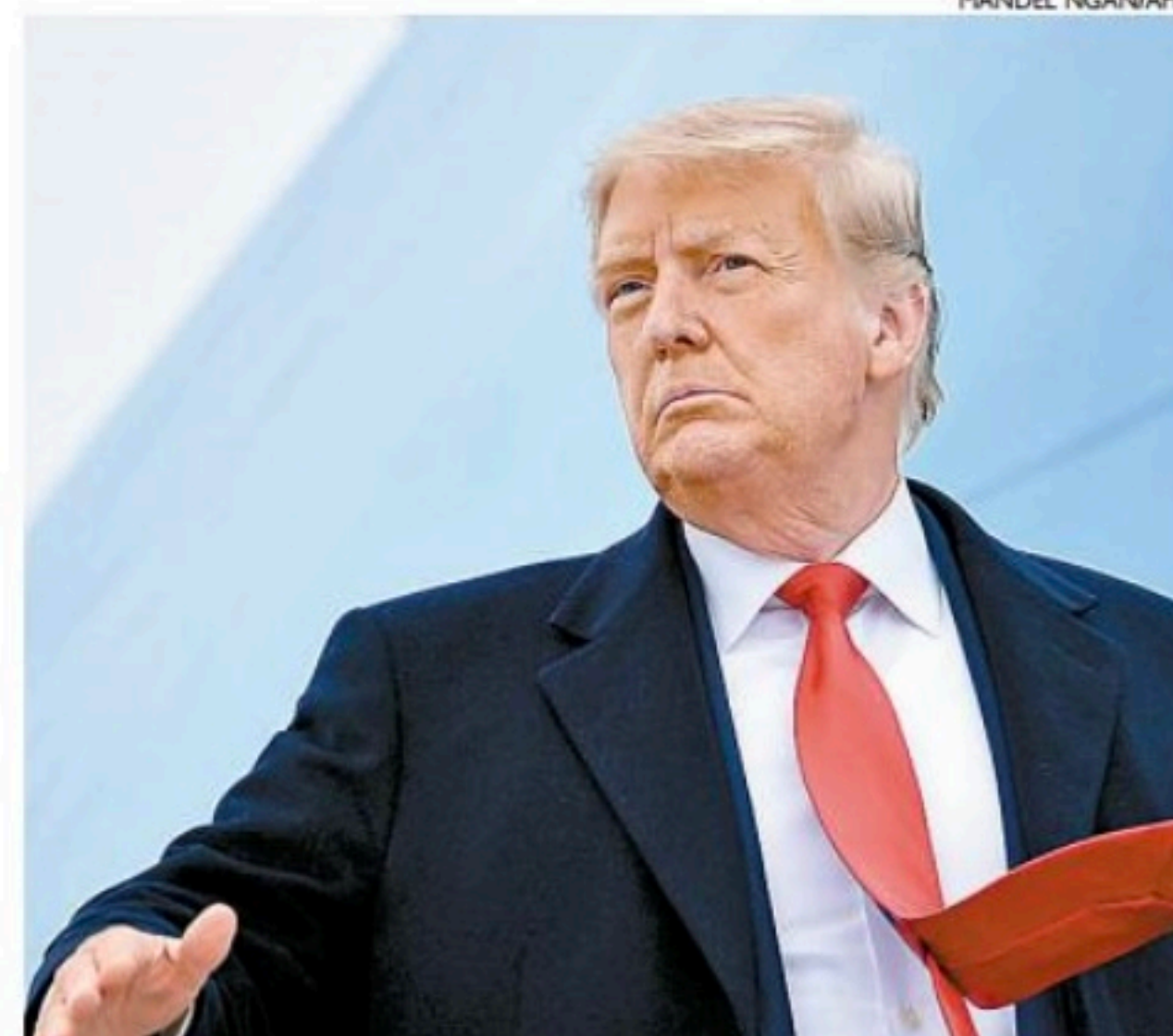
"Apenas atirem neles", teria dito Trump às forças de segurança

Ao lado de ordens como "quebrem as cabeças deles" e apresentações de vídeos de repressão policial, Trump teria dito, segundo Bender, a frase "apenas atirem neles", confirmada por Esper.