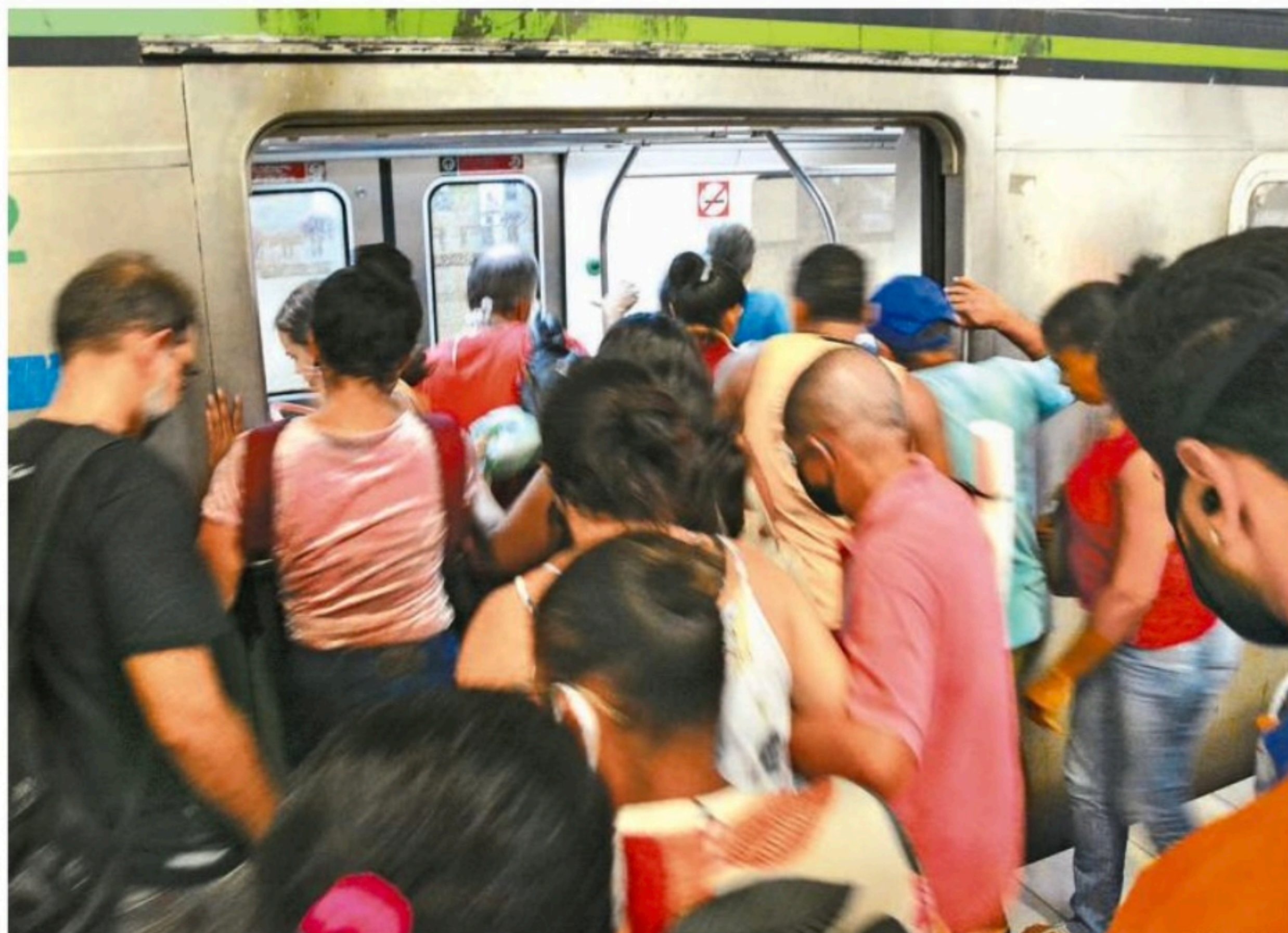
Passageiros reclamam da qualidade do serviço e da superlotação dos vagões nos horários de pico