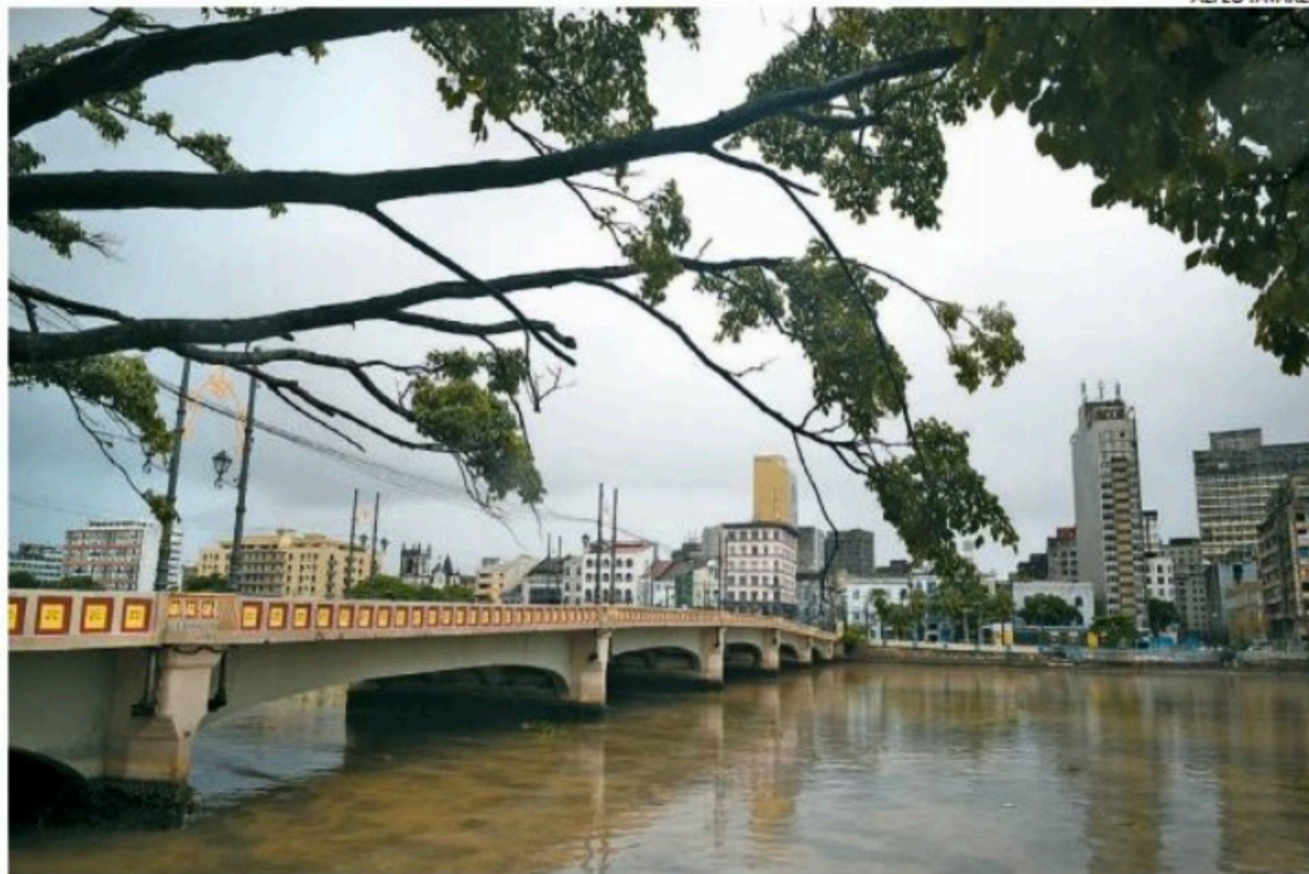
Para a Região Metropolitana do Recife, termômetros podem chegar a 26°C de máxima no domingo

Com a chegada do inverno e com as temperaturas diminuindo, doenças respiratórias podem aparecer com mais frequência, principalmente entre as crianças. De acordo com dados da Secretaria de Planejamento e Gestão do Estado, até o último domingo, 65 crianças aguardavam um leito de UTI em Pernambuco. Segundo a Secretaria Es-