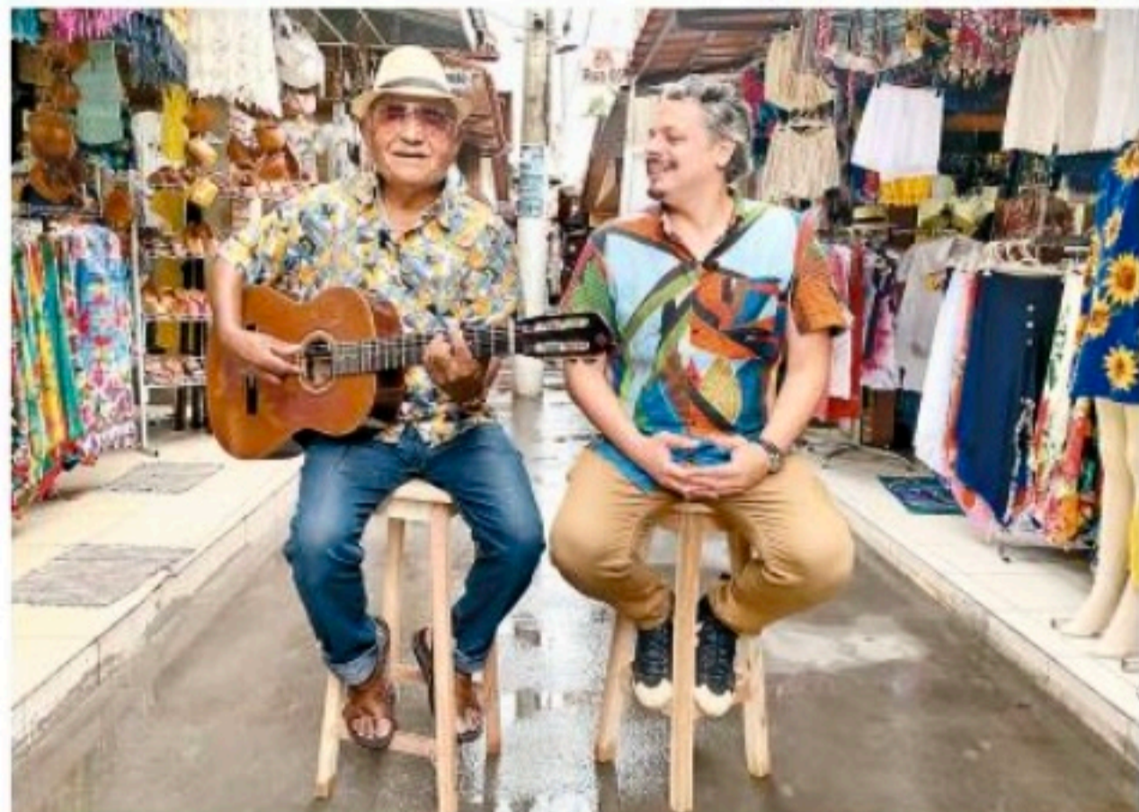
A sabedoria dos mestres da cultura popular é registrada em vídeo

H á 18 anos, o grupo recifense Fim de Feira, vencedor do Premio da Musica Brasileira 2009 na categoria Melhor Grupo Regional, se dedica aos ritmos nordestinos e, para marcar a trajetória de quase duas décadas, os músicos da FF lançaram no Youtube o documentário "Nós e Nossos Mestres".