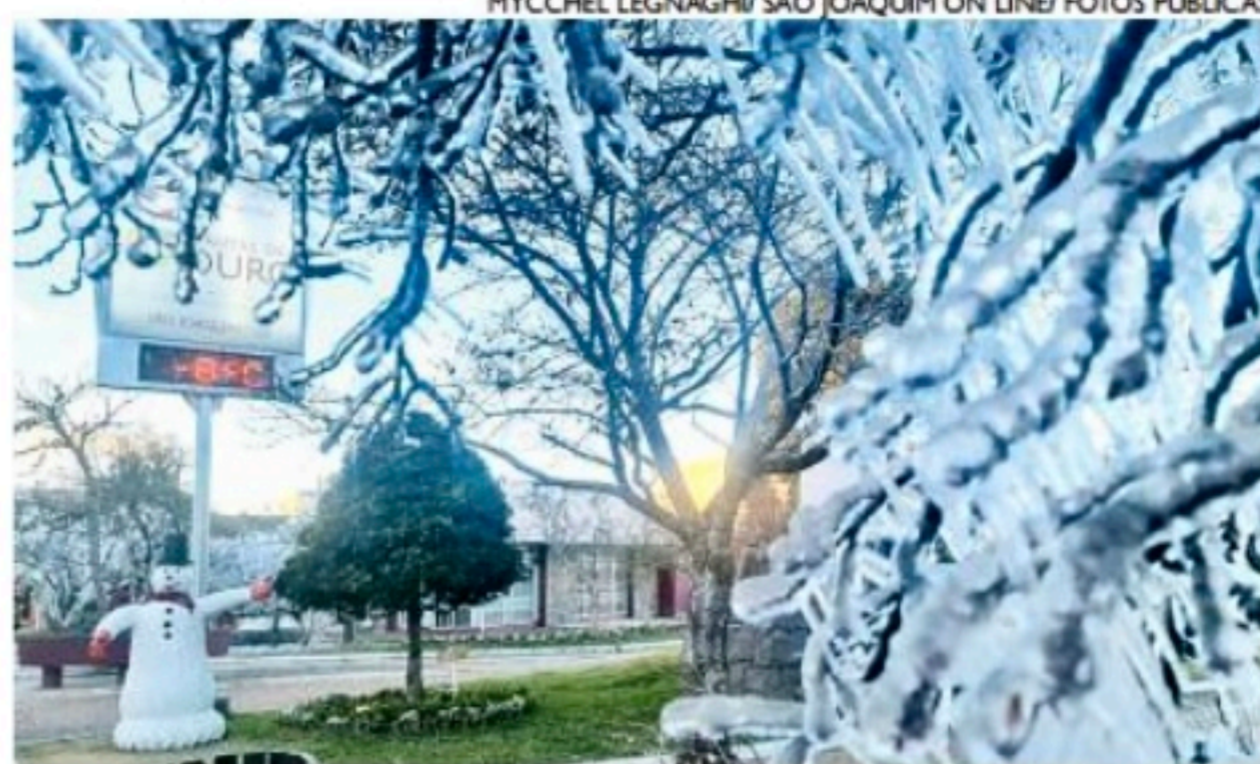
Frente fria está provocando geadas e pode nevar no Sul do País

Na internet, a Marinha mantém atualizados os alertas de mau tempo. Informações meteorológicas podem ser visualizadas também por meio do aplicativo Boletim ao Mar, disponível para download para