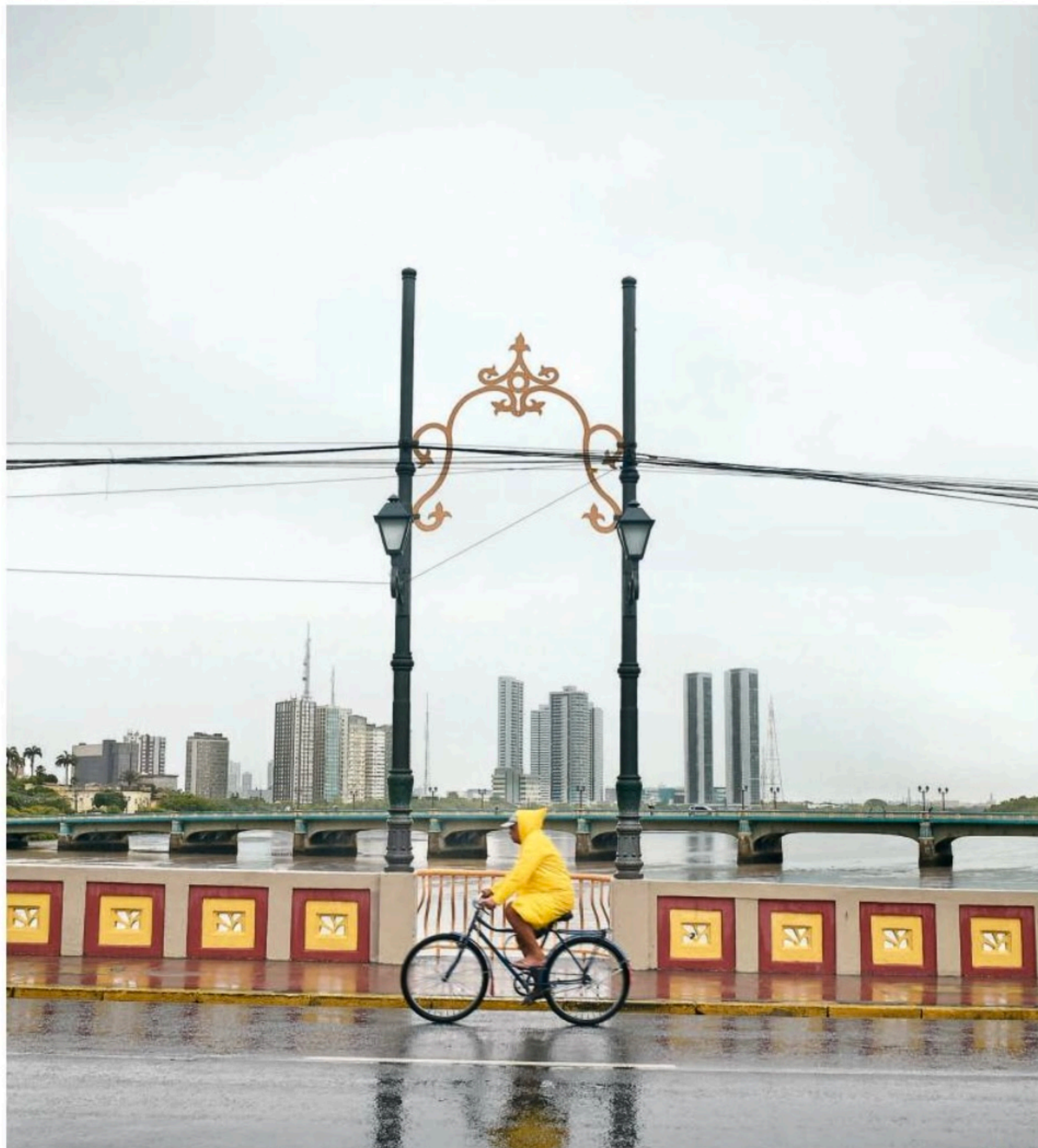
Agência Pernambucana de Águas e Clima (Apac) prevê frio na RMR e Interior