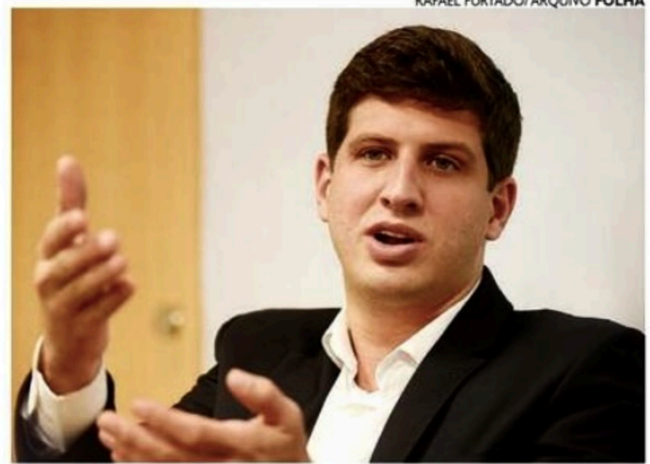
João diz que trabalhará na construção de um caminho para o Brasil

Contudo, a composição de cargos na Mesa tem como critério a representação das bancadas par-