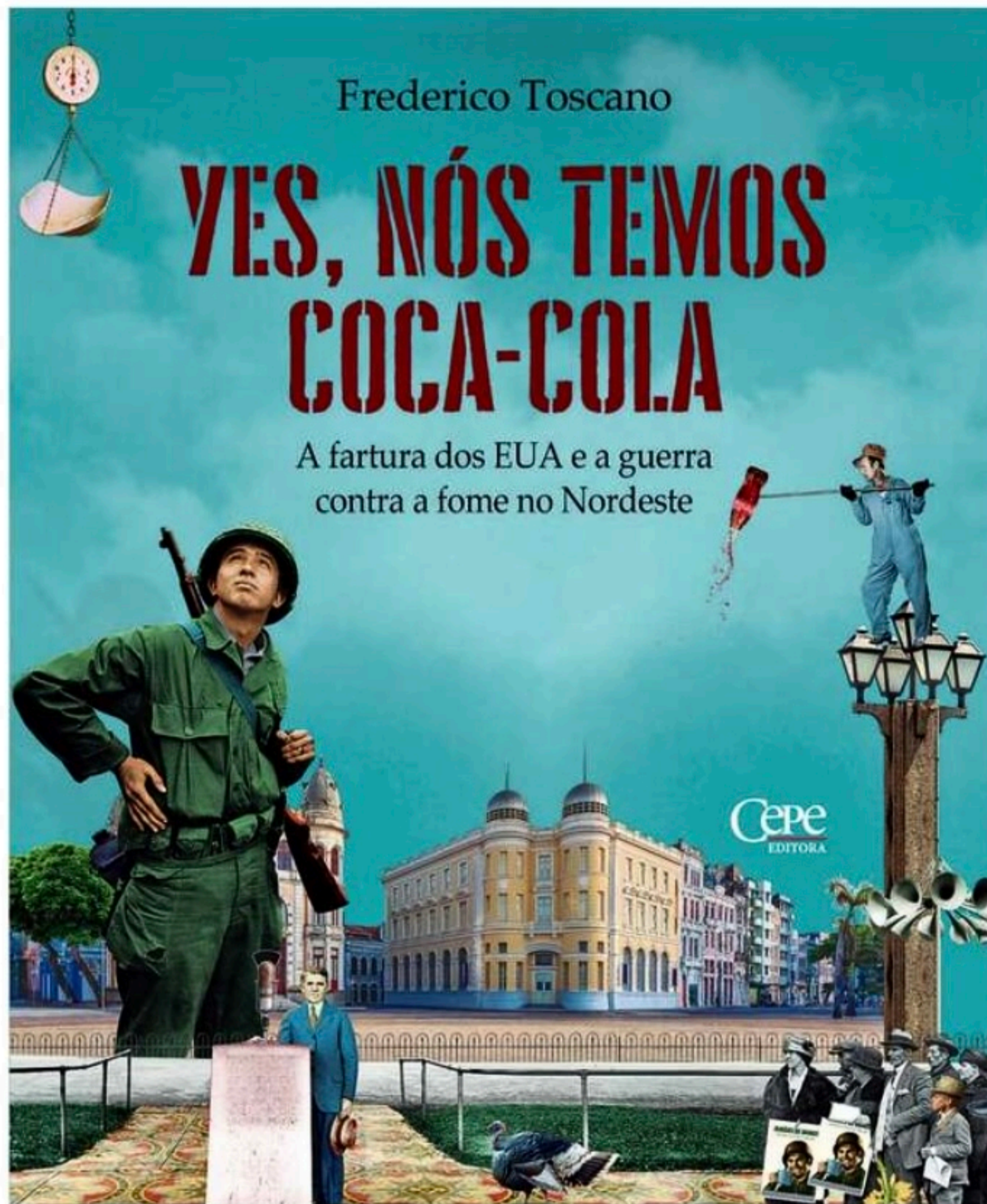
Obra revela os novos hábitos à mesa trazidos pelos norte-americanos a Pernambuco