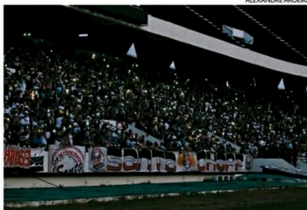
Queda de energia teria sido provocada por queima de fusíveis

O apagão no Arruda teria sido causado pela queima de fusíveis em uma das subestações do estádio, sendo necessário esperar a subestação esfriar antes de ligar a