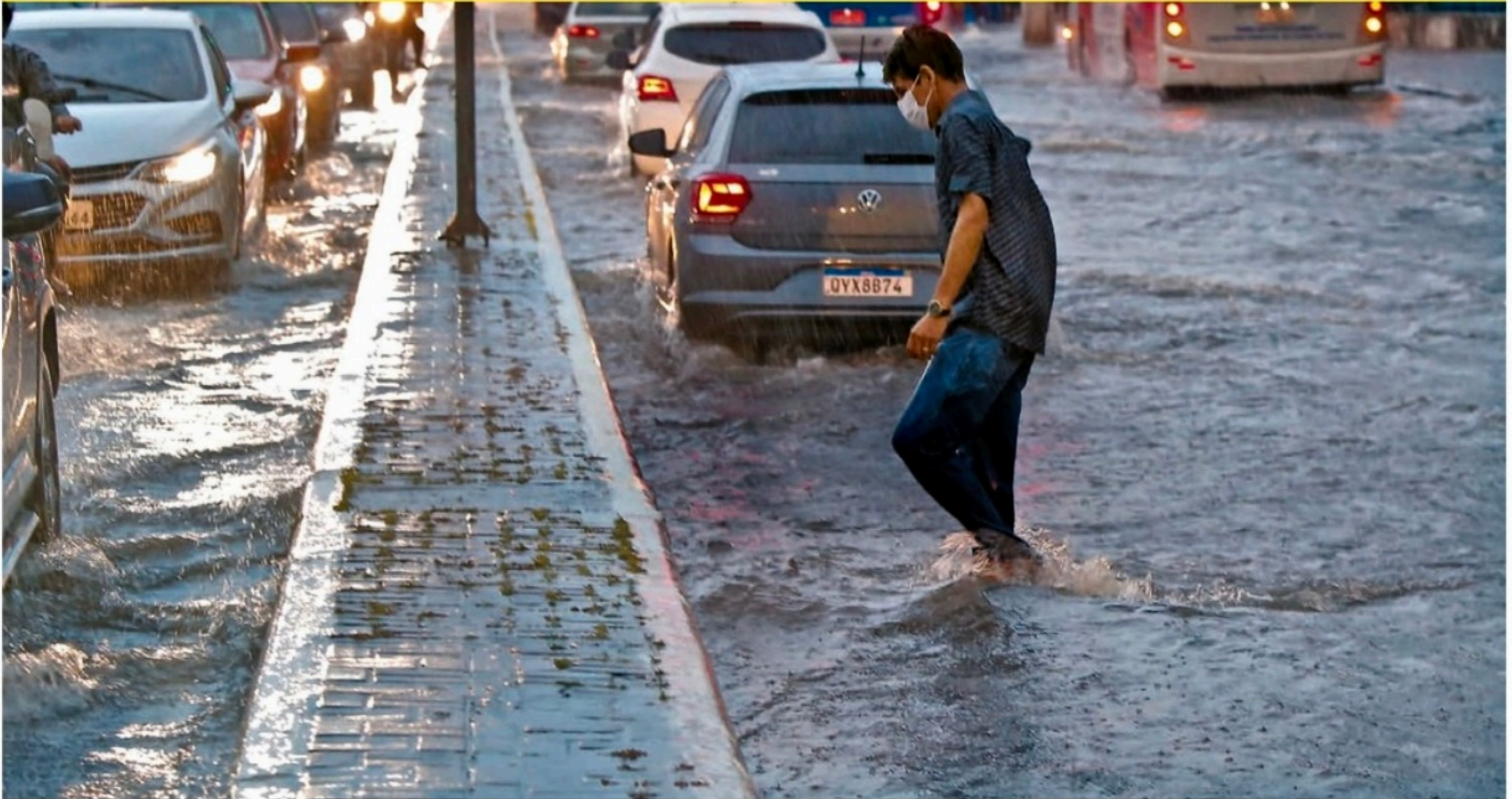
Trecho da avenida Norte, próximo ao cruzamento com a Cruz Cabugá, ficou completamente alagado. Sufoco para pedestres e motoristas

Recife, terça-feira, 24 de maio de 2022 Ano XXV n° 121