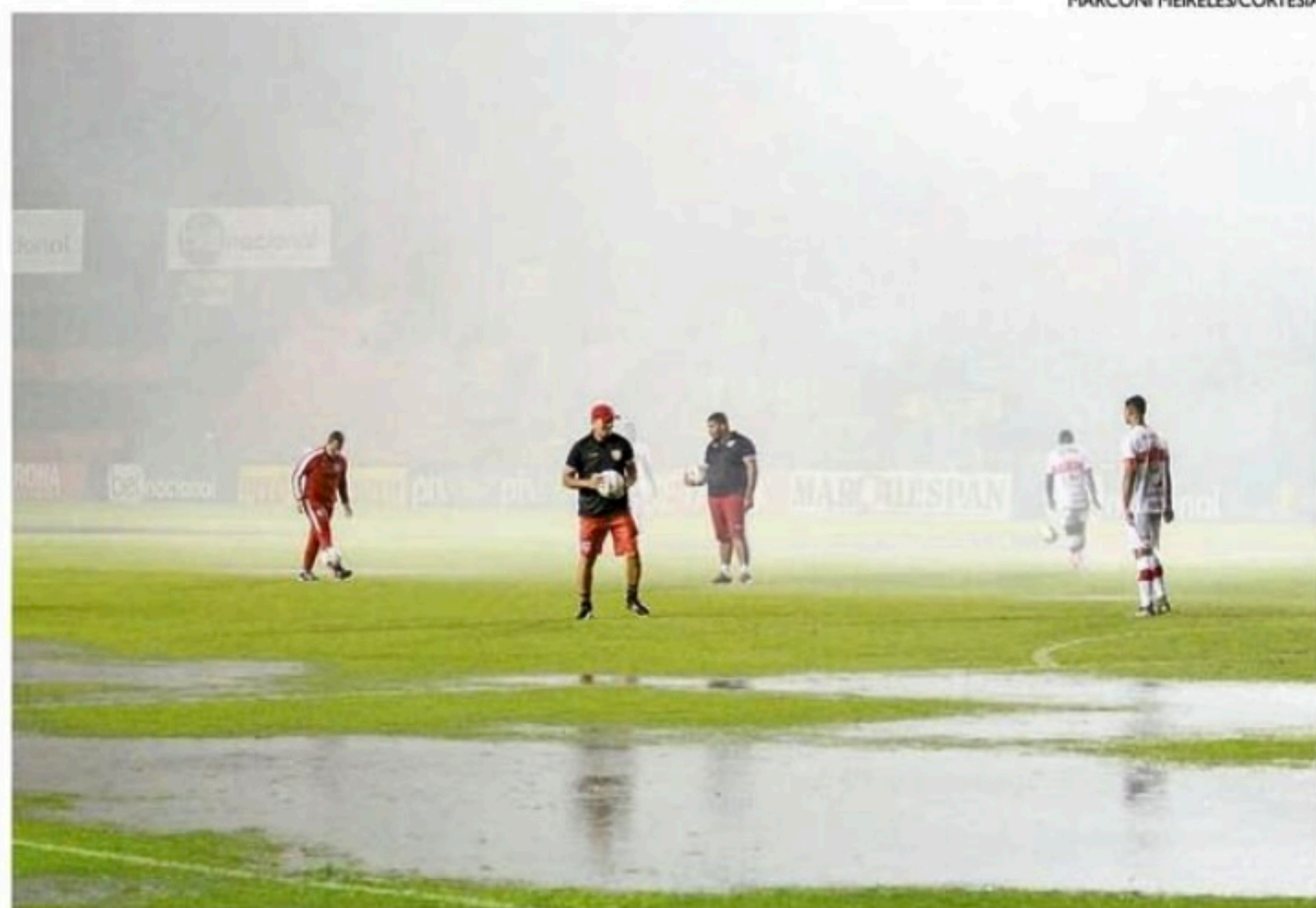
Além do gramado, área das sociais e do estádio ficou alagada. Cabine do VAR também foi danificada

Desde o final da tarde, começaram a circular imagens, nas redes sociais, do gramado da Ilha do Retiro alagado, devido a quantidade de chuva que castigou a capital pernambucana. O Sport chegou a acionar quatro bombas extras de dre-