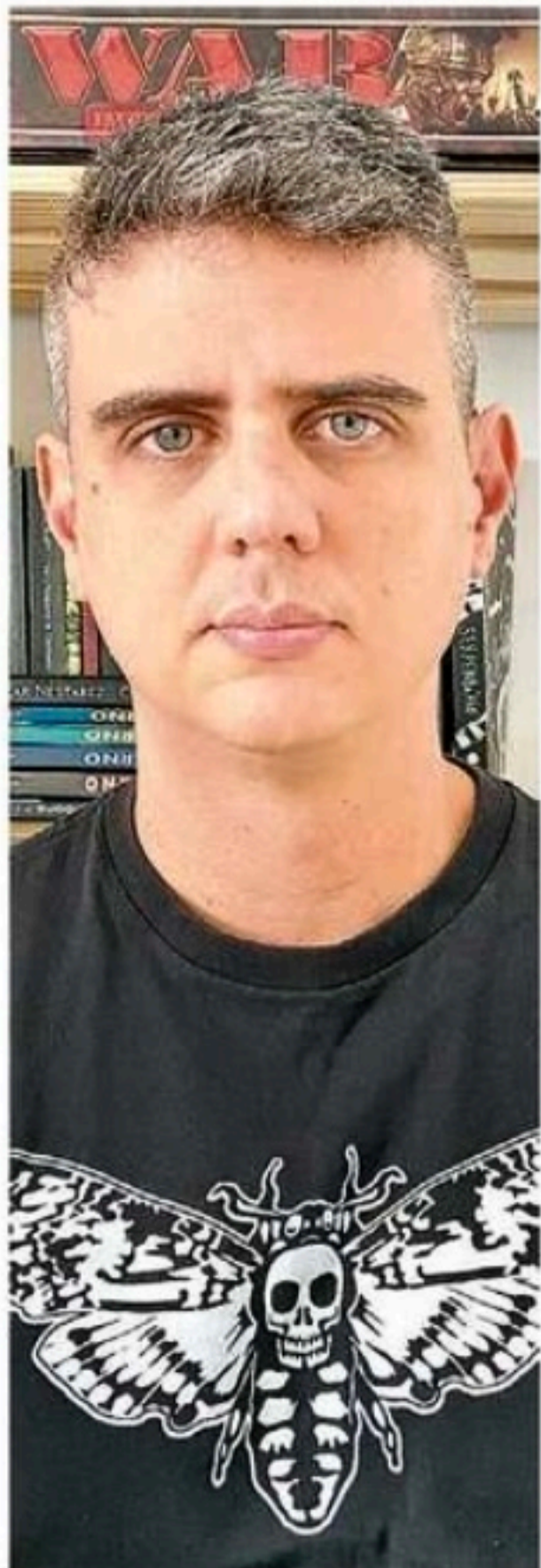
Historiador teceu narrativa a partir da cultura e da gastronomia