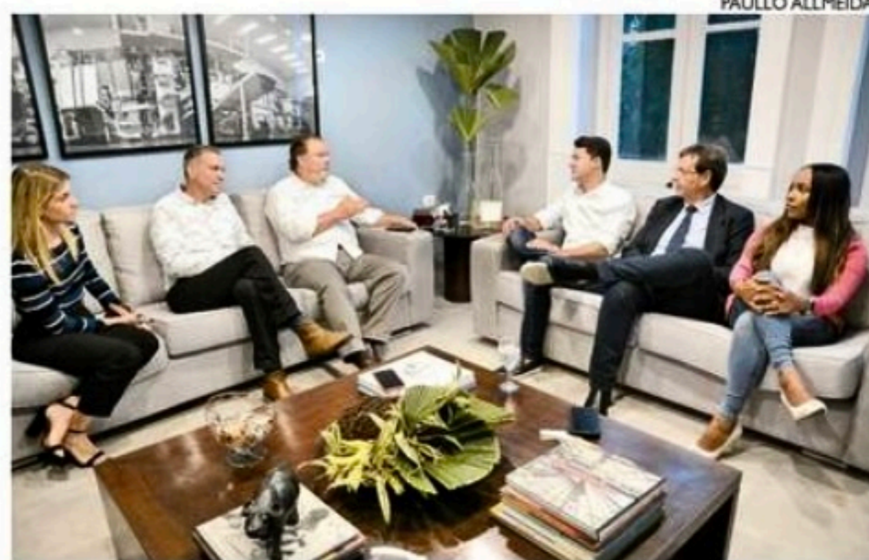
Pré-candidatos apresentaram suas propostas para Pernambuco