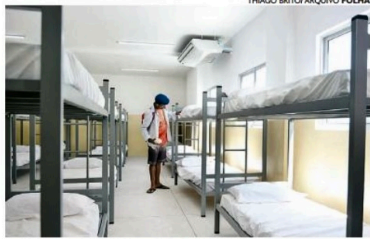
Quartos são equipados com beliches para acomodar mais pessoas