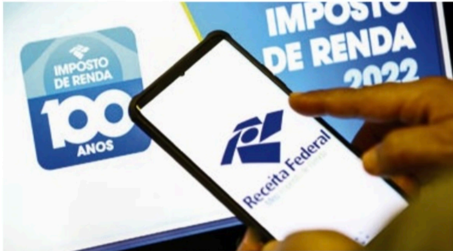
OPÇÃO Após esta terça-feira, contribuinte em débito com a Receita deve fazer o pagamento por meio do DARF

O débito com o IRPF também pode ser parcelado em até oito vezes, desde que cada parcela não seja inferior a R$ 50. Neste caso, na segunda parcela será cobrado o juro de 1% sobre o valor da primeira parcela. Da terceira mensalidade em diante, ocorre a incidência de 1% de juro mais a variação mensal da taxa Selic acumulada a partir do mês de maio até o mês anterior ao de vencimento da quota