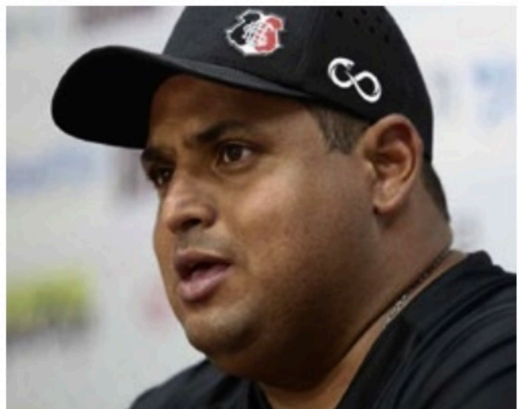
FORA Leston foi demitido após expor bastidores e cobrar mudanças

“Os jogadores e funcionários se revoltaram bastante após os acontecimentos da semana passada e já estavam prontos para expor da forma que fizeram. O Leston também se posicionou e eu como executivo não poderia deixar eles sozinho nessa. Talvez isso não tenha sido bem compreendido pelo presidente. Respeitamos a decisão dele”, complementou o ex-executivo coral.