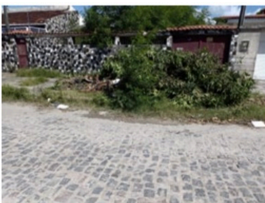
EDSON BARRETO DE SOUZA / VOZ DO LEITOR