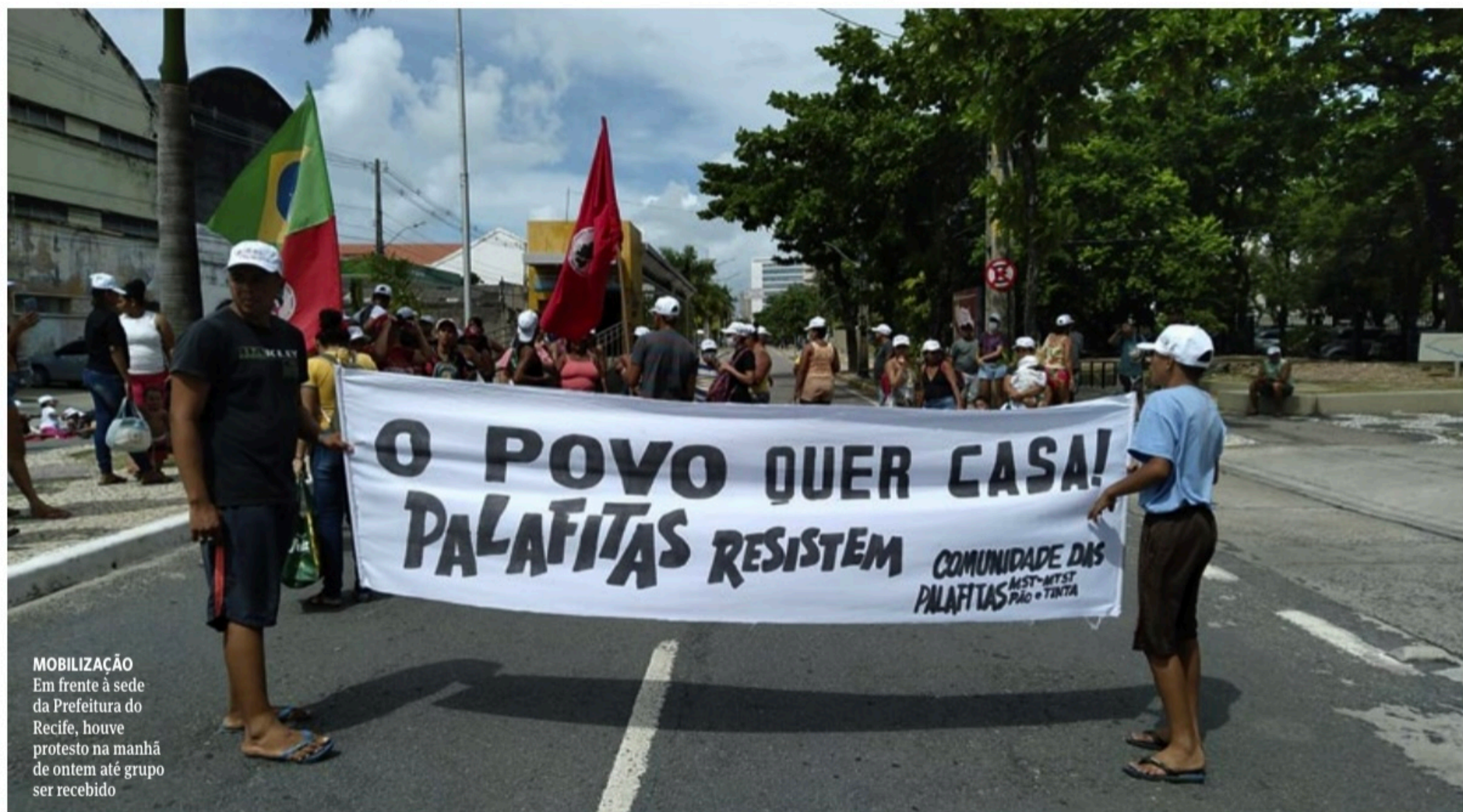
MOBILIZAÇÃO Em frente à sede da Prefeitura do Recife, houve protesto na manhã de ontem até grupo ser recebido

INCÊNDIO Comissão de moradores que perderam seus lares no Pina foi recebida na prefeitura. Houve promessa de auxílios e cestas básicas