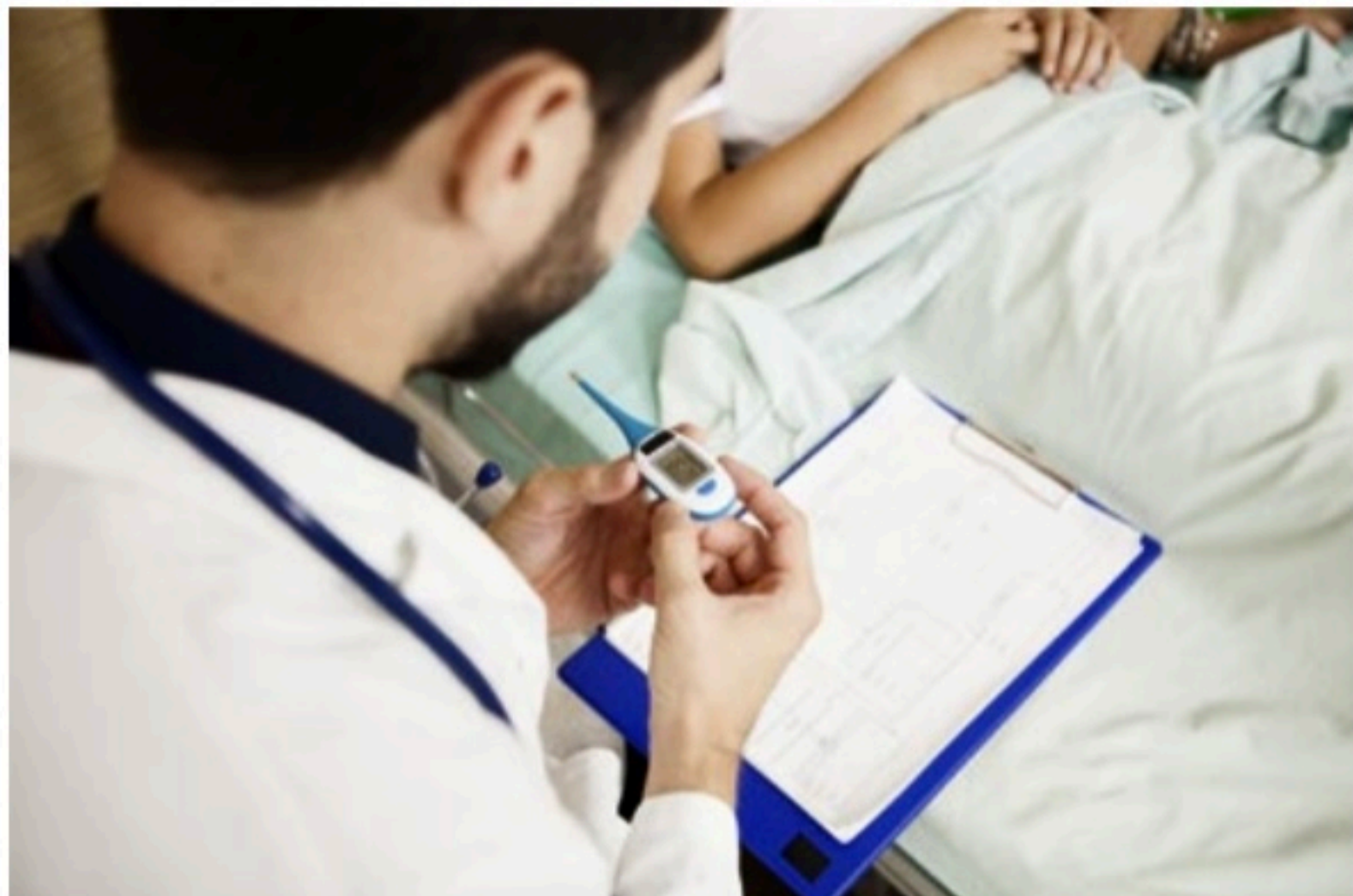
SINTOMAS Doentes apresentam dor abdominal, diarreia, vômitos e aumento de níveis de enzimas hepáticas

Os sintomas são em sua maioria gastrointestinais e incluem dor abdominal, diarreia, vômitos e aumento dos níveis de enzimas hepáticas, além de icterícia (pele e/ou olhos com cor amarelada) e ausência de febre.