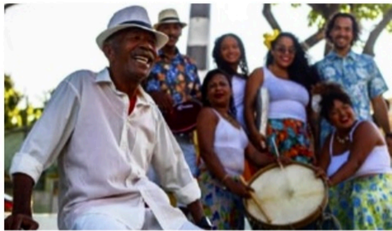
CARREIRA Mestre coquista do Amaro Branco iniciou a trajetória aos 45 anos e está com 71