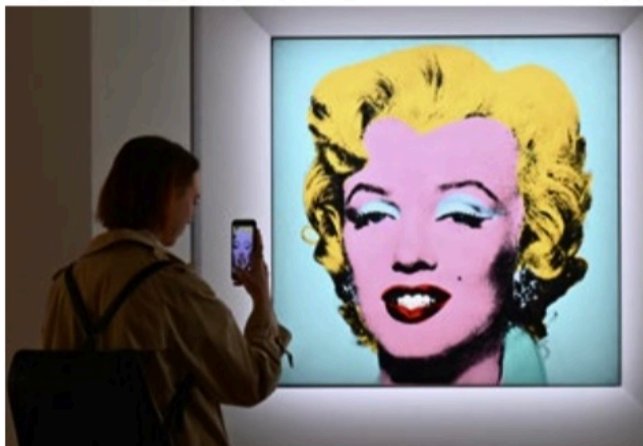
LEILÃO Shot Sage Blue Marilyn tem cacife para se tornar a obra mais cara do século 20

A icônica obra de 1x1 metro faz parte de uma série de retratos que o maior expoente da pop art fez de Marilyn Monroe após sua morte, em 1962.