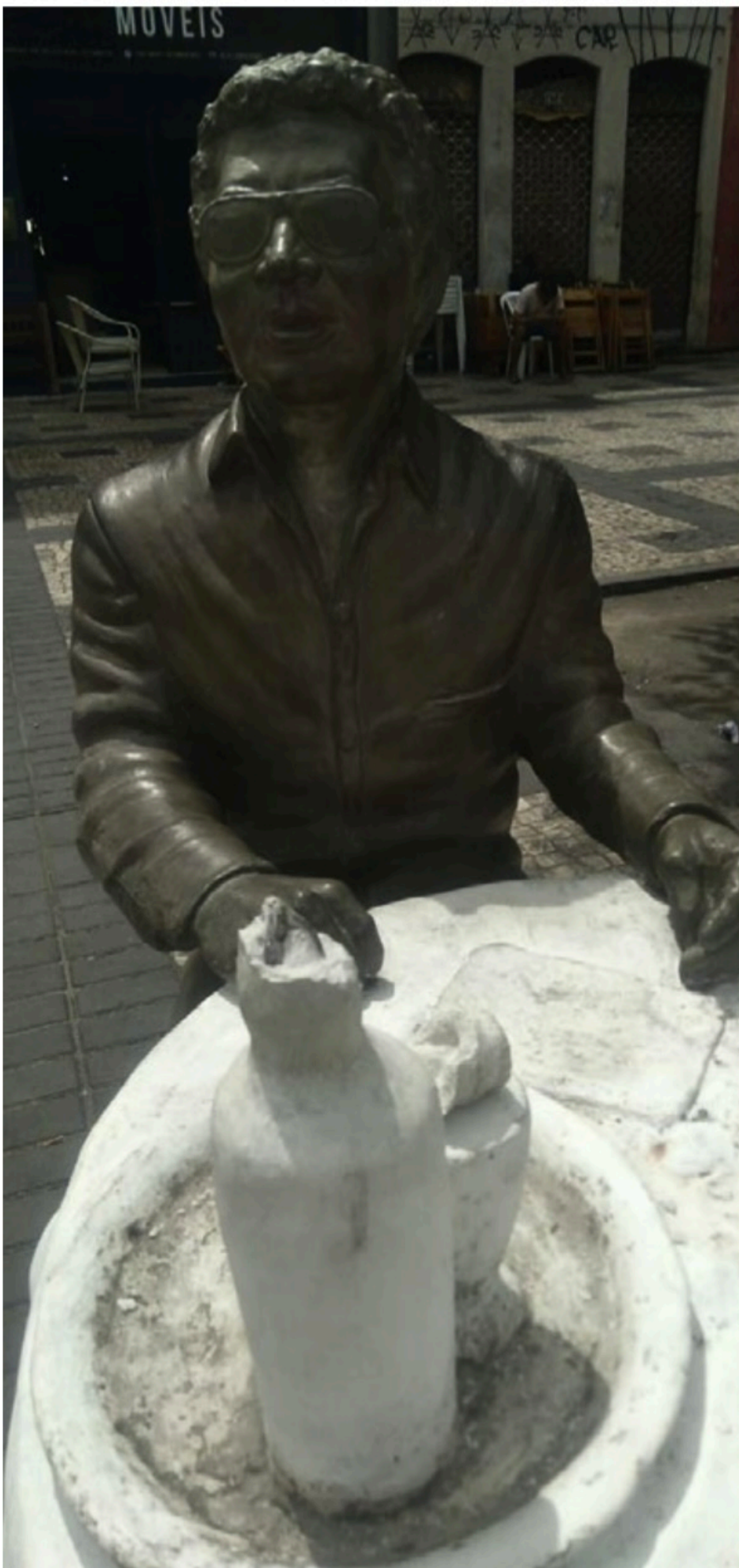
GENIVAL PAPANAZZI / VOZ DO LEITOR