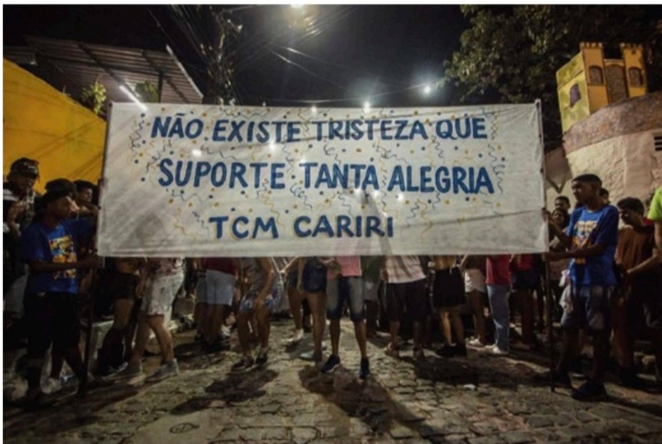
SÍMBOLO Faixa levada no cortejo que o Cariri Olindense fez no último sábado foi registrada e compartilhada como síntese da retomada da folia

Com a diminuição das restrições da pandemia e o retorno gradual desses ícones do Carnaval, a expectativa é de que cada vez mais blocos voltem às ruas nas próximas semanas e meses.