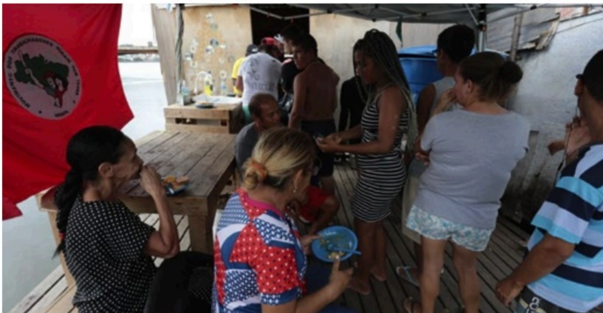
SOLIDARIEDADE Famílias do Beco do Sururu seguem recebendo doações de alimentos, roupas e outros itens básicos para sobreviver

Após três, finalmente policiais foram ao local para começar as investigações sobre a causa do incêndio. Uma perícia também foi realizada. A Delegacia de Boa Viagem está conduzindo o caso. Em nota, a Polícia Civil voltou a afirmar que só dará informações ao final das investigações.