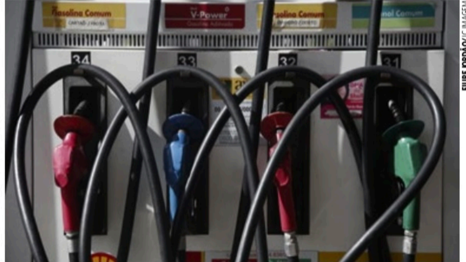
AUMENTO Na refinaria, o valor do diesel passa de R$ 4,51 para R$ 4,91 por litro, mas não se sabe impacto na bomba

Segundo a Petrobras, o diesel não sofria aumento há cerca de 60 dias, desde 11 de março. Mas, como a petroleira segue as regras do mercado internacional, ainda há uma defasagem média de -17% no preço do diesel, pela paridade internacional, segundo a Associação Brasileira dos Importadores de Combustíveis (Abicom).