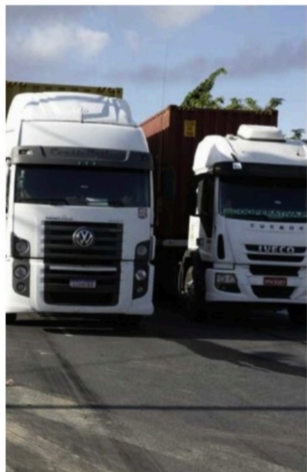
REPRODUÇÃO / VOZ DO LEITOR