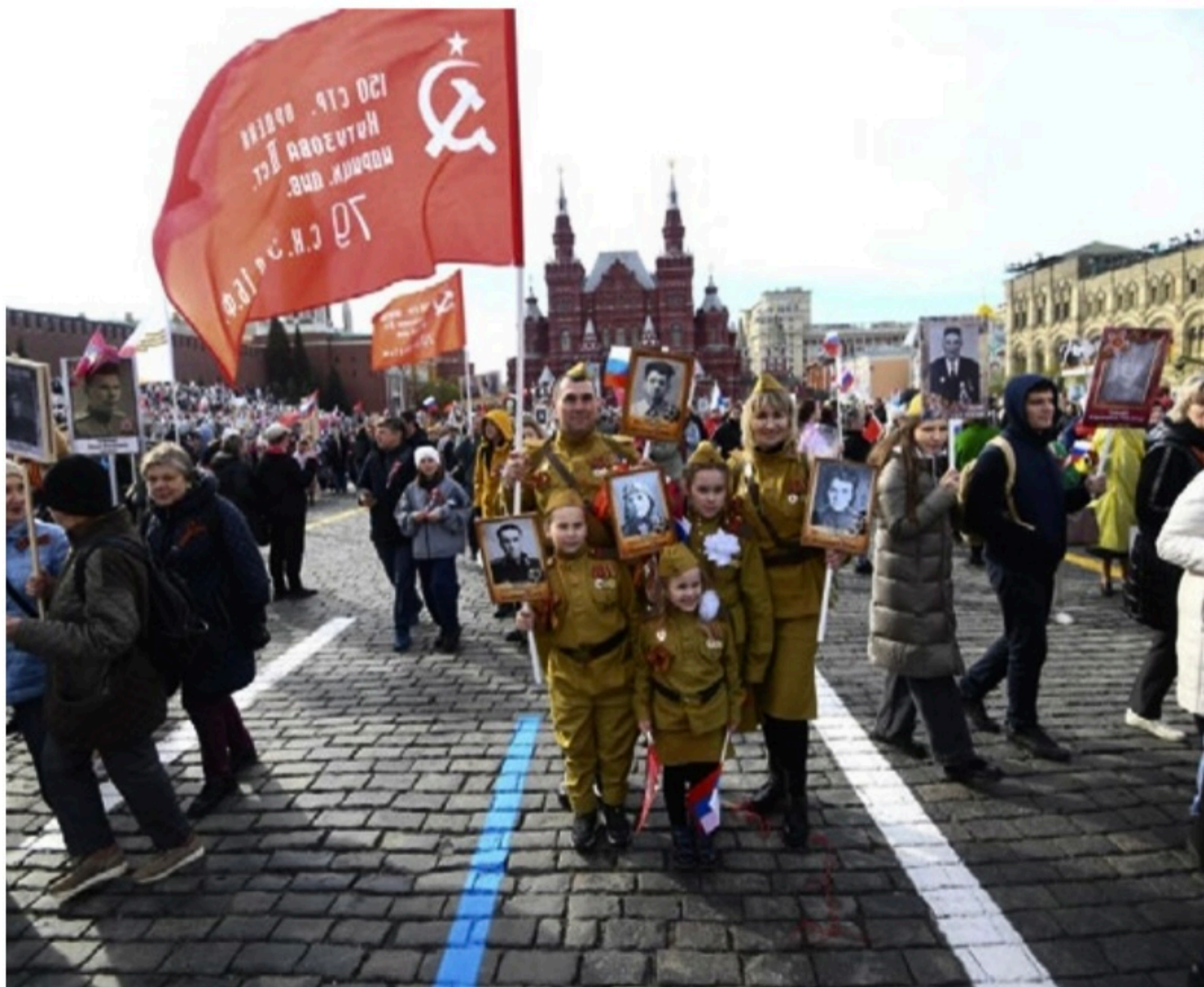
RÚSSIA Parada na Praça Vermelha de Moscou celebra a vitória contra os nazistas na Segunda Guerra Mundial; na Ucrânia, celebração foi discreta

Desde a chegada ao poder de Vladimir Putin em 2000, o tradicional desfile de 9 de maio celebra tanto a vitória