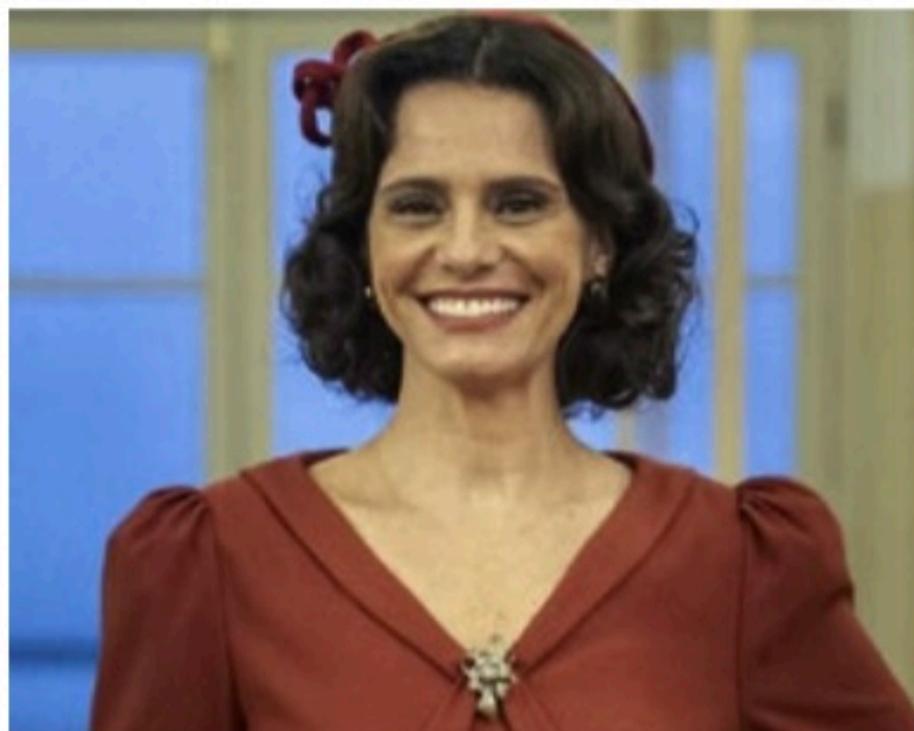
VIOLETA Apesar do drama que vive, personagem tem toque cômico

Em uma sociedade dos anos 1940, período em que a novela é ambientada, Violeta mostra um posicionamento bastante atual em relação aos direitos das mu-