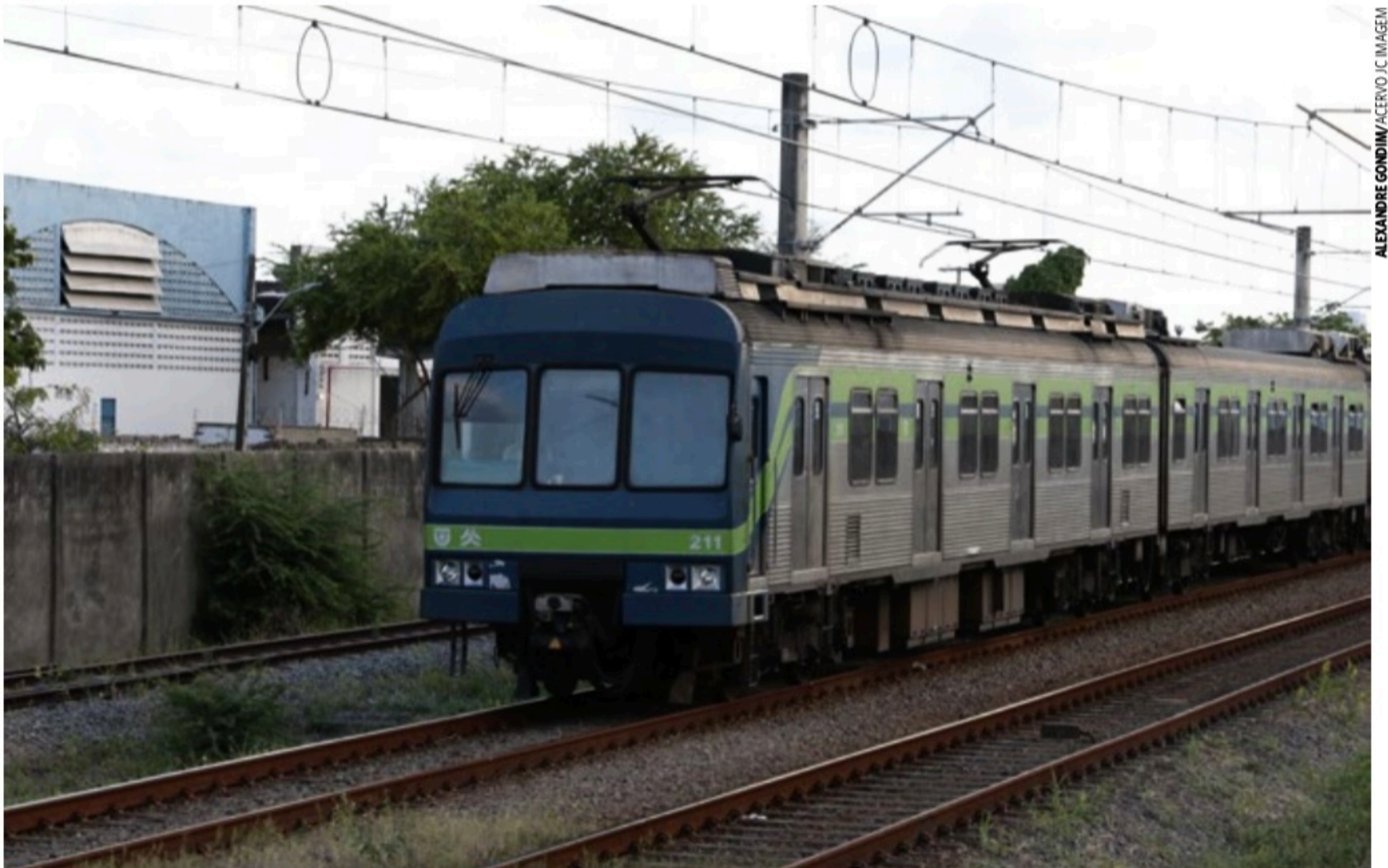
HISTÓRICO Sistema metroviário pernambucano tem mais de 37 anos de funcionamento, porém, mesmo com estudos, permanece apenas com duas linhas: Centro e Sul

O segundo trecho que estaria sendo pensado é o prolongamento da Linha Diesel - atualmente operada por VLTs (Veículo Leve sobre Trilhos) - até o Complexo Industrial Portuário de Suape. Na verdade, conectaria o centro do Cabo de Santo Agostinho a Suape. Teria 12 km, cinco novas estações, e uma operação prevista para ser feita com cinco trens e 12 minutos de intervalo. Custos superficiais, também calculados entre 2018 e 2019, apontavam o valor de