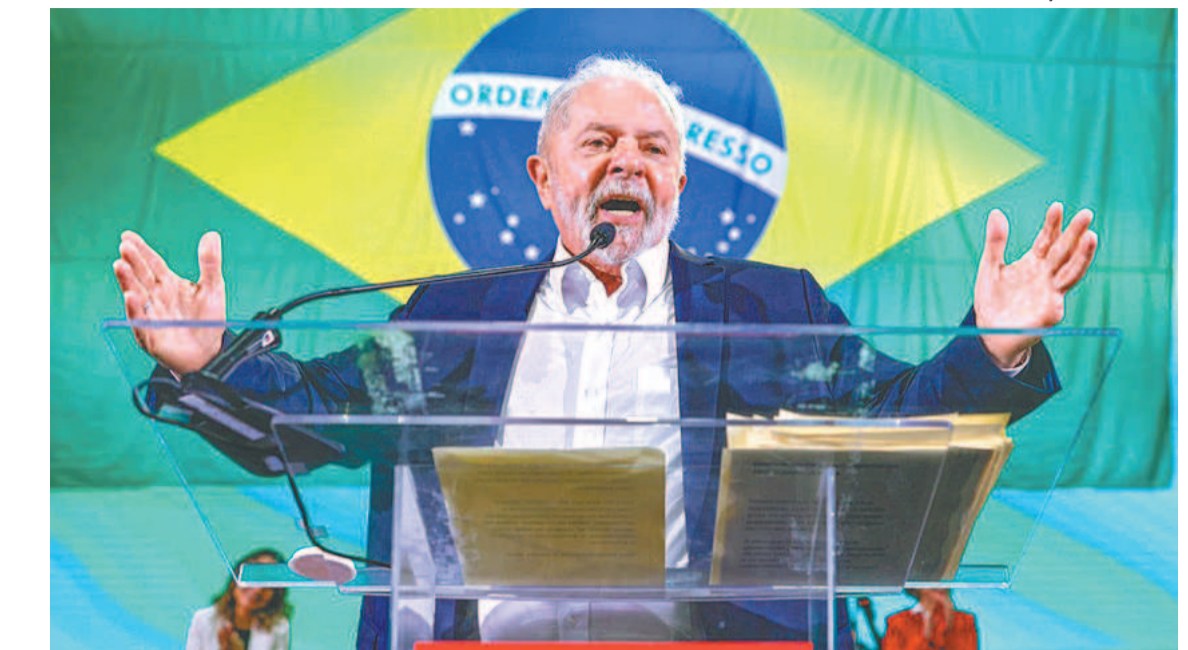
Petista foi duramente criticado pelo PSDB em nota oficial divulgada ontem pela sigla

Segundo o ex-presidente, a transição do governo de FHC para o seu, em 2002, foi “a mais civilizada que esse país conheceu”, e lamentou a hostilidade atual na política. “O que aconteceu nesse país em tão pouco