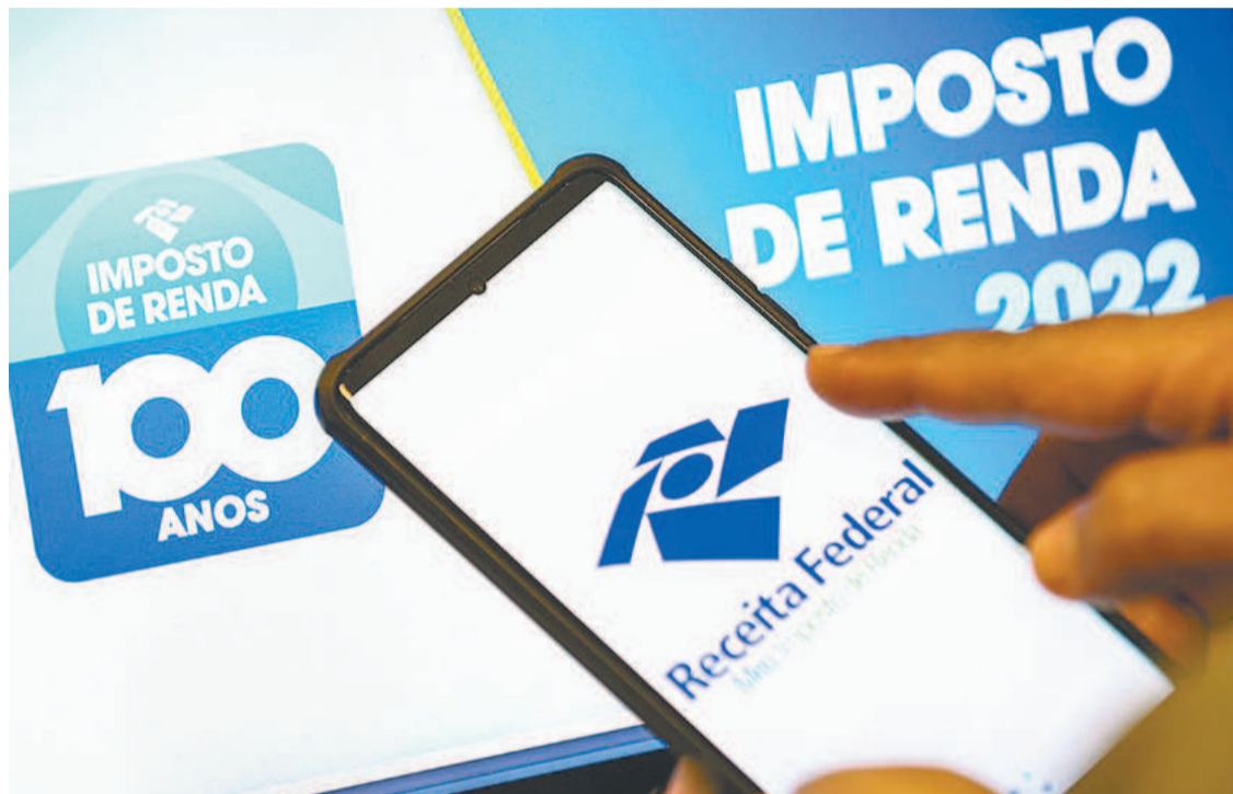
Tabela do IRPF deveria isentar ganhos mensais de R$ 4.465,00, segundo a Unafisco

Desde ontem, os contribuintes que estavam obrigados e não entregaram a declaração estão sujeitos à multa. O valor a ser pago é de 1% ao mês sobre o imposto de renda devido, limita-