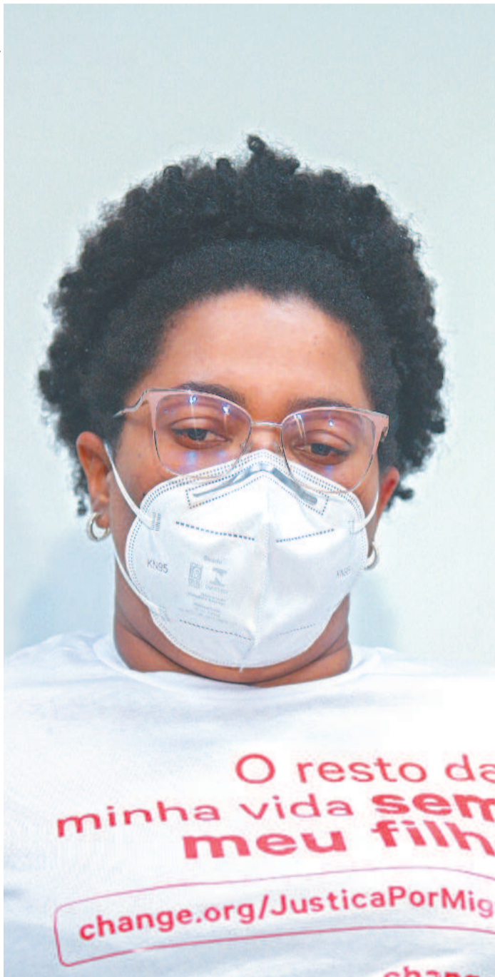
Mãe de menino morto participará de protesto hoje