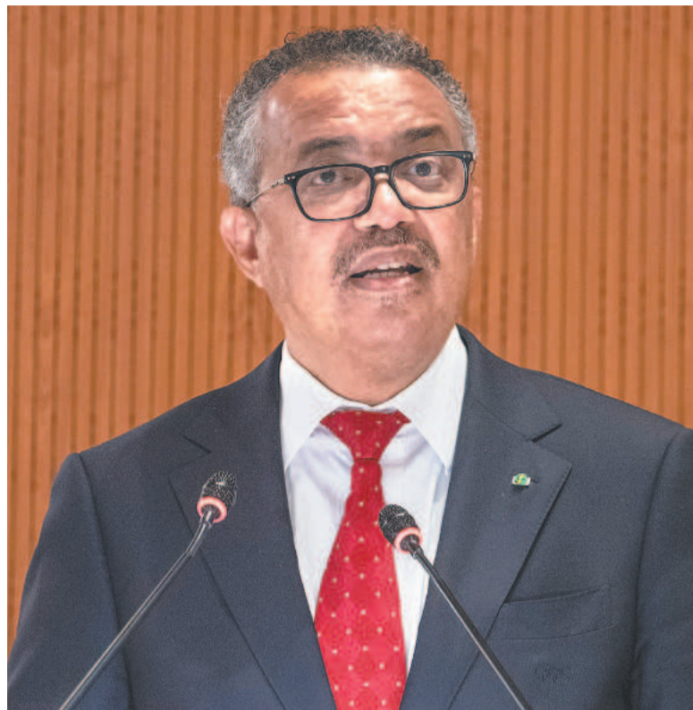
Tedros Adhanom pediu que os países afetados aumentem a vigilância e rastreiem os casos