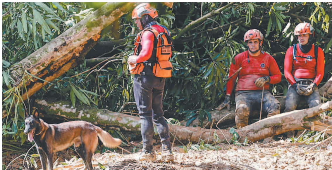
Trabalhos continuam no Curado IV, onde um morto foi encontrado ontem pelas equipes

Contagem deu salto ontem, não só pelo resgate de desaparecidos, mas pela confirmação do IML de mortes ocorridas em unidades de saúde, após temporais