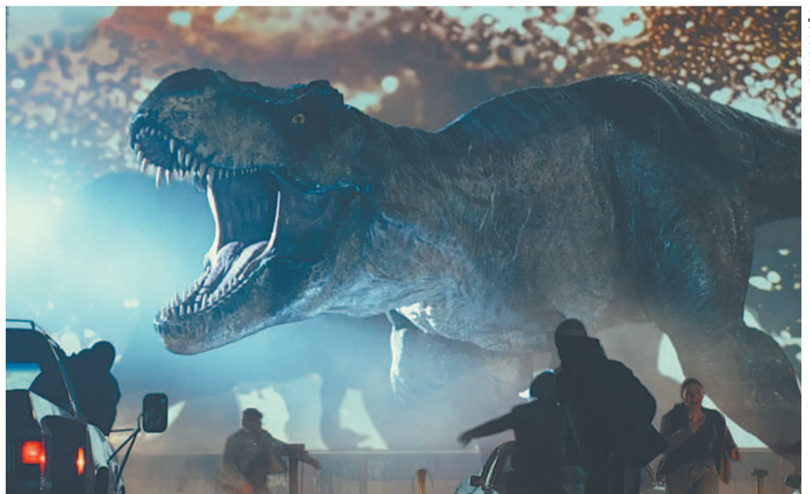
Em Jurassic World: Domínio, sobram aparições dos astros e barulho das explosões

Filme tem o apelo cada vez mais no hiper-realismo das imagens cristalinas e na agressividade do som da sala IMax no cinema