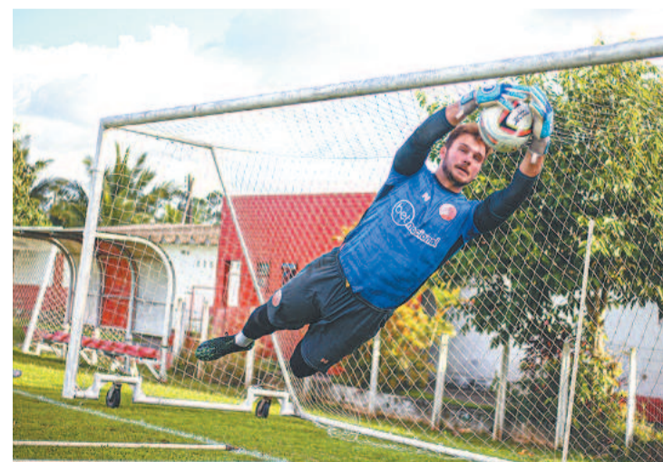
Empresário disse que o goleiro fica até o fim da Série B