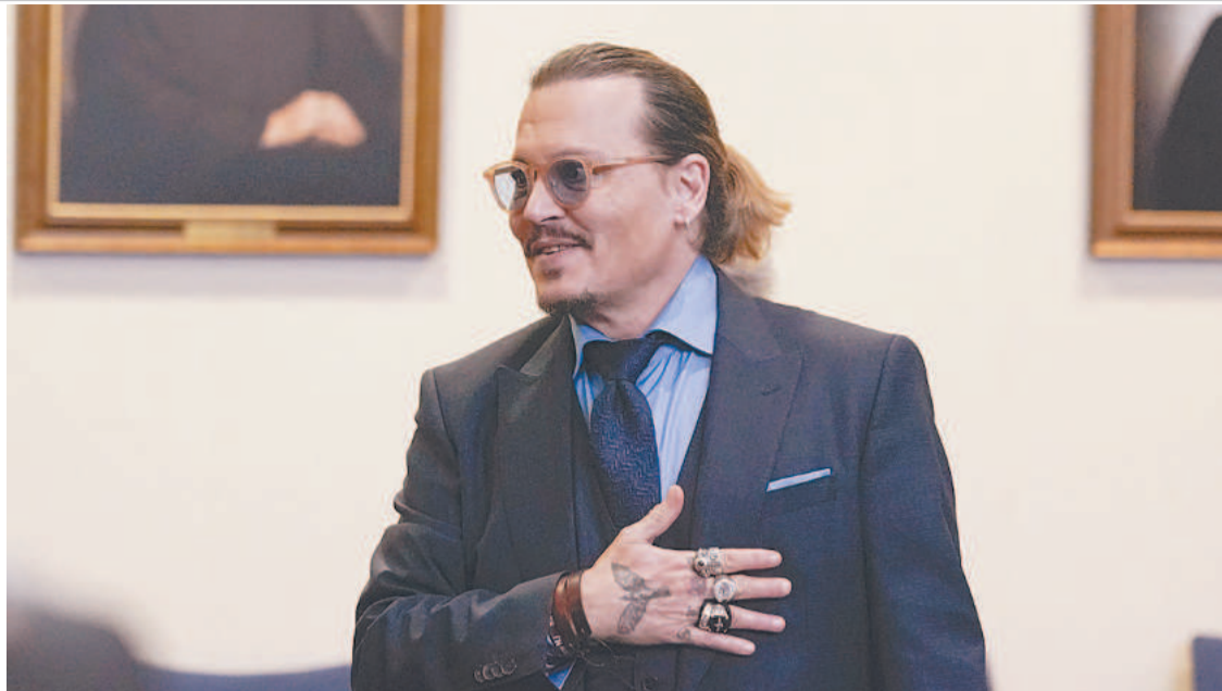
“O júri me devolveu a vida. Estou comovido”, declarou o astro de Piratas do Caribe

O processo por difamação, que incluiu acusações polêmicas de agressão sexual e violência doméstica, se arrastou por longo período. Segundo o veredito, Heard difamou o ex em artigo publicado pelo The Washington Post em 2018, no qual ela se descreveu como uma “figura pública que representa o abuso doméstico”. Mas o júri também deu razão ao processo apresentado pela atriz, no qual Heard afirmava ter sido di-