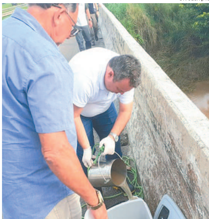
O caso aconteceu no mês passado, no Litoral Norte

“Estamos com a investigação da causa da mortandade dos caranguejos em andamento. Levantar uma causa sem os resultados das análises não é possível. O caso é acompanhado pela equipe da APA de Santa Cruz”, disse a diretora.