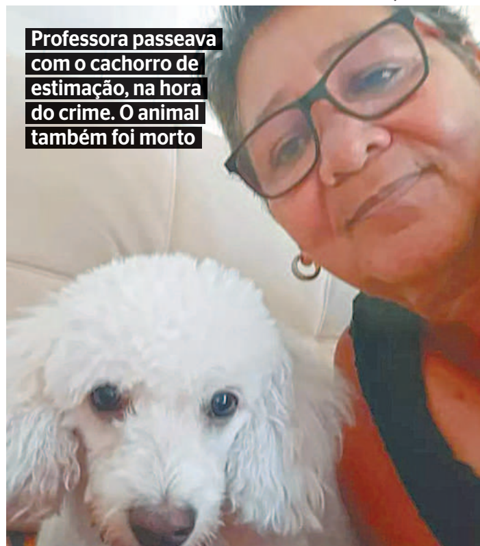
Professora passeava com o cachorro de estimação, na hora do crime. O animal também foi morto

não filmou a dinâmica, e depois retornaram.” disse. Segundo o Delegado, o menor estava sendo encaminhado à Unidade de Atendimento Inicial (UNiai) da Fundação de Atendimento Socioeducativo (Funase), onde faria a apresentação ao Juiz da Infância e Juventude de plantão, devendo responder pelo ato infracional de homicídio qualificado e também pela morte do animal.