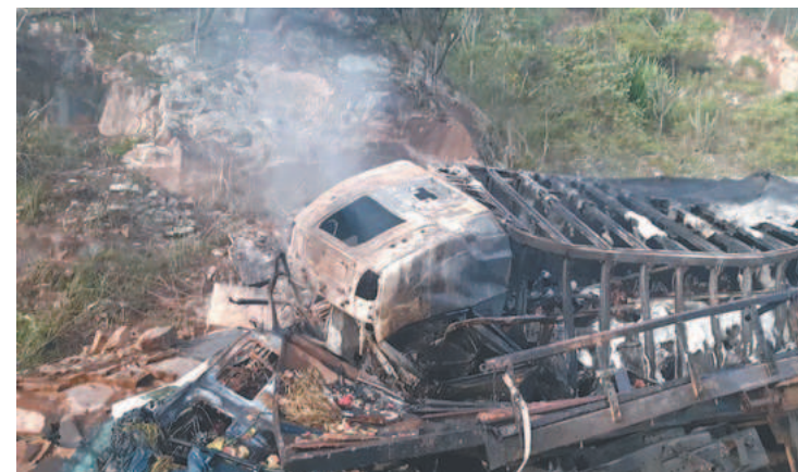
Veículos pegaram fogo na BR-232; um motorista morreu

O Corpo de Bombeiros informou que foi acionado por volta das 2h15 e enviou duas viaturas para apagar as chamas. Segundo a corporação, um homem envolvido no acidente estava com uma das pernas fraturadas e visivelmente desorientado, sendo então conduzido pelo Samu.