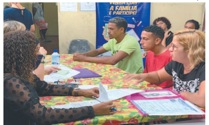
Decreto isentou pagamento para qualquer via da Identidade