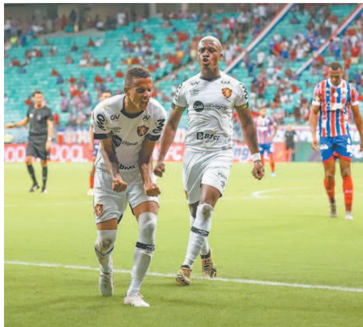
Último jogo teve vitória do Sport por 3 a 2, em Salvador

Agora, a garotada terá que vencer por quatro gols de diferença ou marcar três para levar a decisão para as cobranças de pênaltis na próxima sexta-feira (10), às 19h, na Arena Barueri.