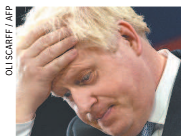
Primeiro-ministro conseguiu 211 votos

Segundo uma pesquisa relâmpago realizada pela YouGov com 506 membros do Partido Conservador, 42% queriam a destituição de Johnson e 53%