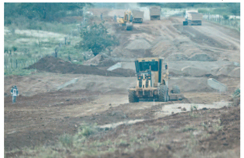
Em Terra Nova, uma das obras é a pavimentação da PE-499

cializado de Assistência Social (Cras). Na mesma área, liberou recursos para pagamento do Benefício Eventual e instalação de uma cozinha comunitária. Finalizando a visita a Terra Nova, o