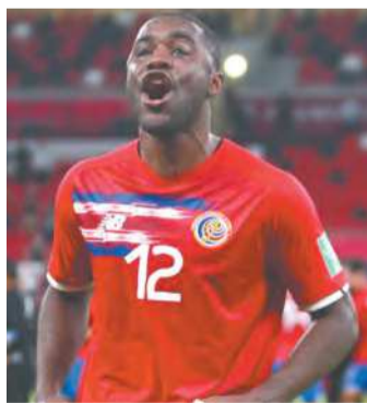
Costa Rica venceu a Nova Zelândia por 1 a 0

po E da Copa do Mundo, ao lado Alemanha, Espanha e Japão. A estreia será contra os espanhóis, no dia 23 de novembro. (AFP)