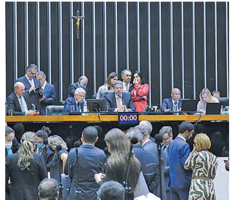
Parlamentares aprovaram projeto por unanimidade