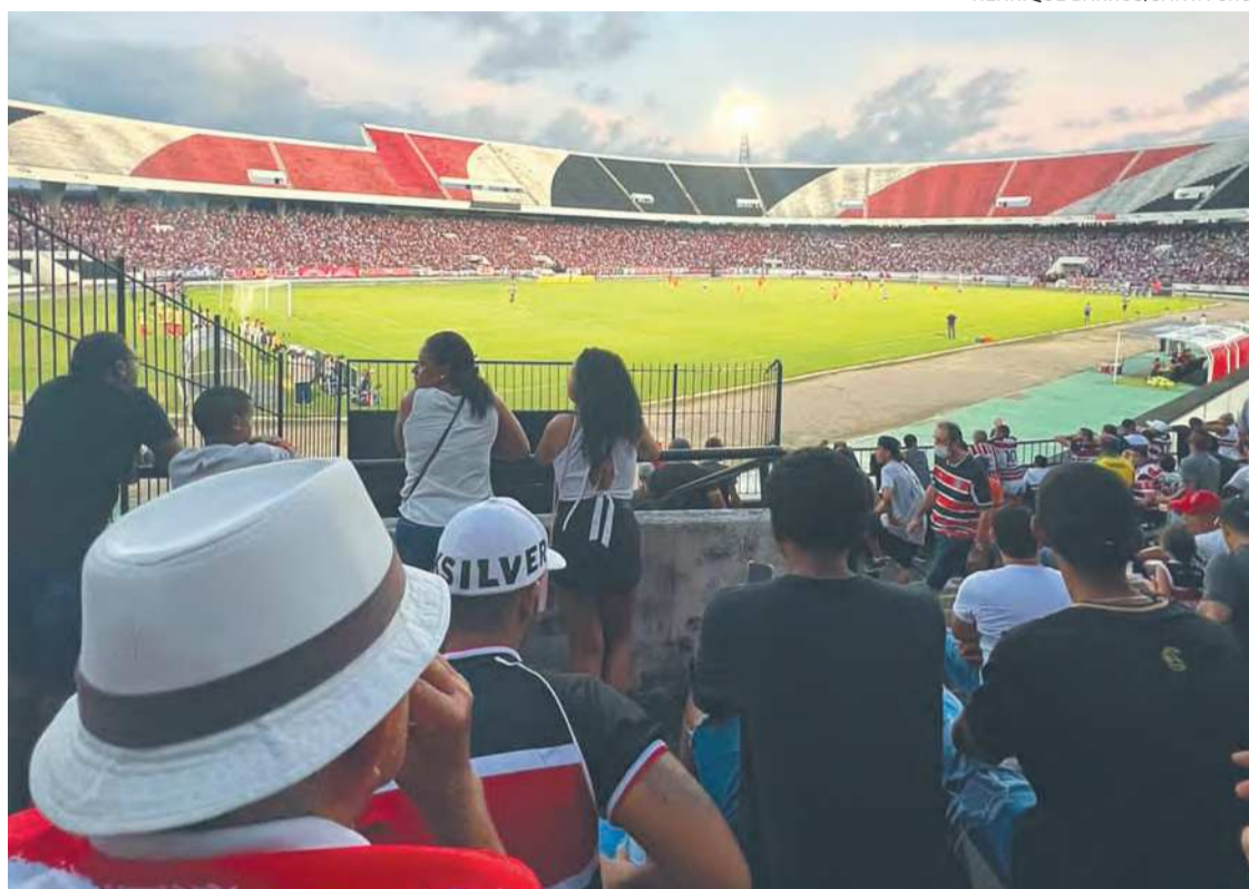
Tricolor tem a maior média de torcida entre todos os times da Série D do Brasileirão