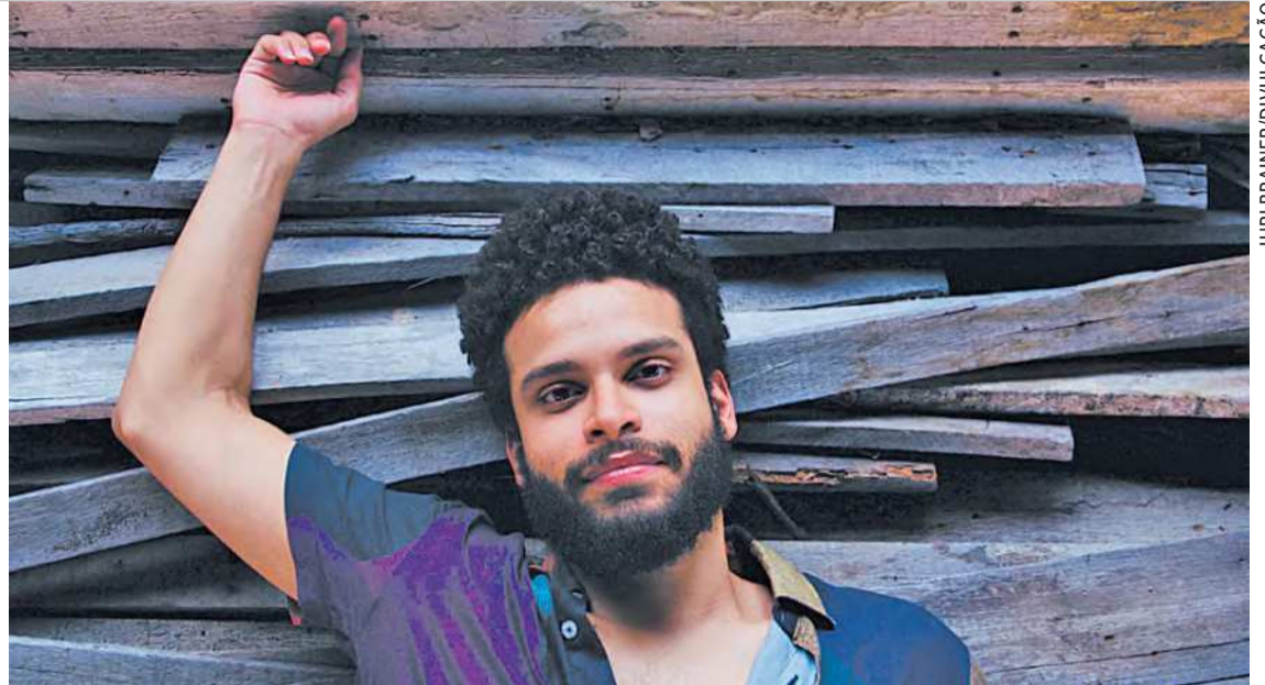
Show de amanhã é do disco Quanto mais eu vou, eu fico , lançado em setembro de 2019