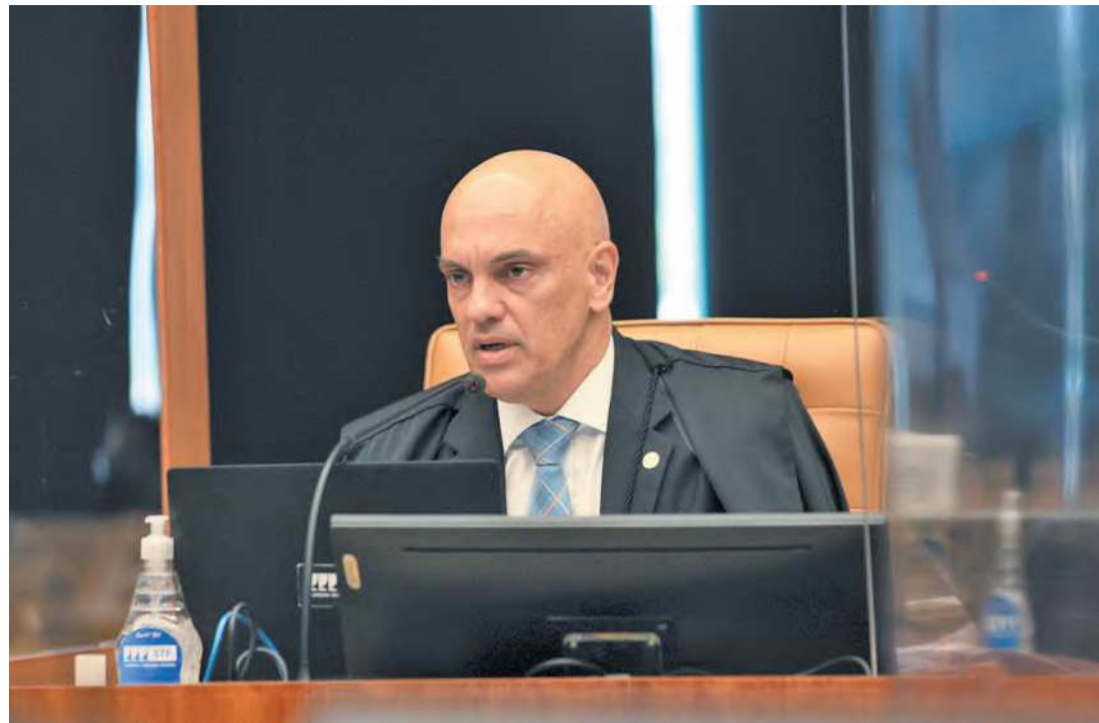
Moraes terá como missão evitar a disseminação de fake news durante a eleição

“A sucessão democrática no exercício dos cargos mais elevados da República, sem percalço com obediência às regras já conhecidas de todo e qualquer certame, seja no âmbito