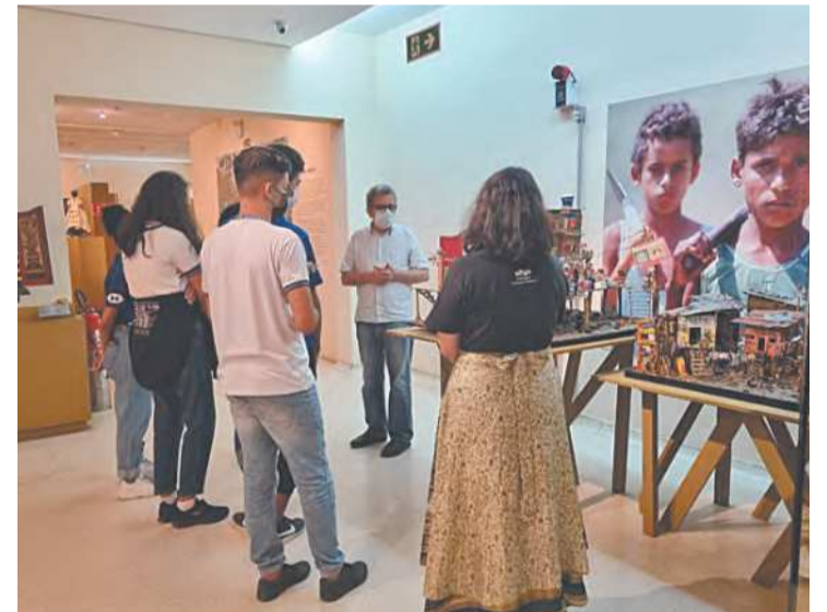
Mostra Revisitando Ariano contou com apoio do Muhne

buc (Fundaj), organizou um conjunto de ações com os representantes dos terceiros anos dos cursos de Administração e Redes de Computadores da escola.