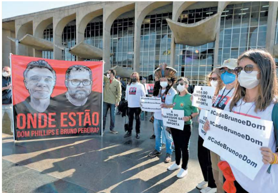
Funcionários da Funai protestaram em frente ao Ministério da Justiça contra os desaparecimentos

"Lamentamos profundamente que a embaixada tenha passado à família ontem informações que não se mostraram corretas", disse Arruda, de acordo com o The Guardian , jornal onde Don trabalhava como correspondente. (Da Redação, com Estado de Minas)