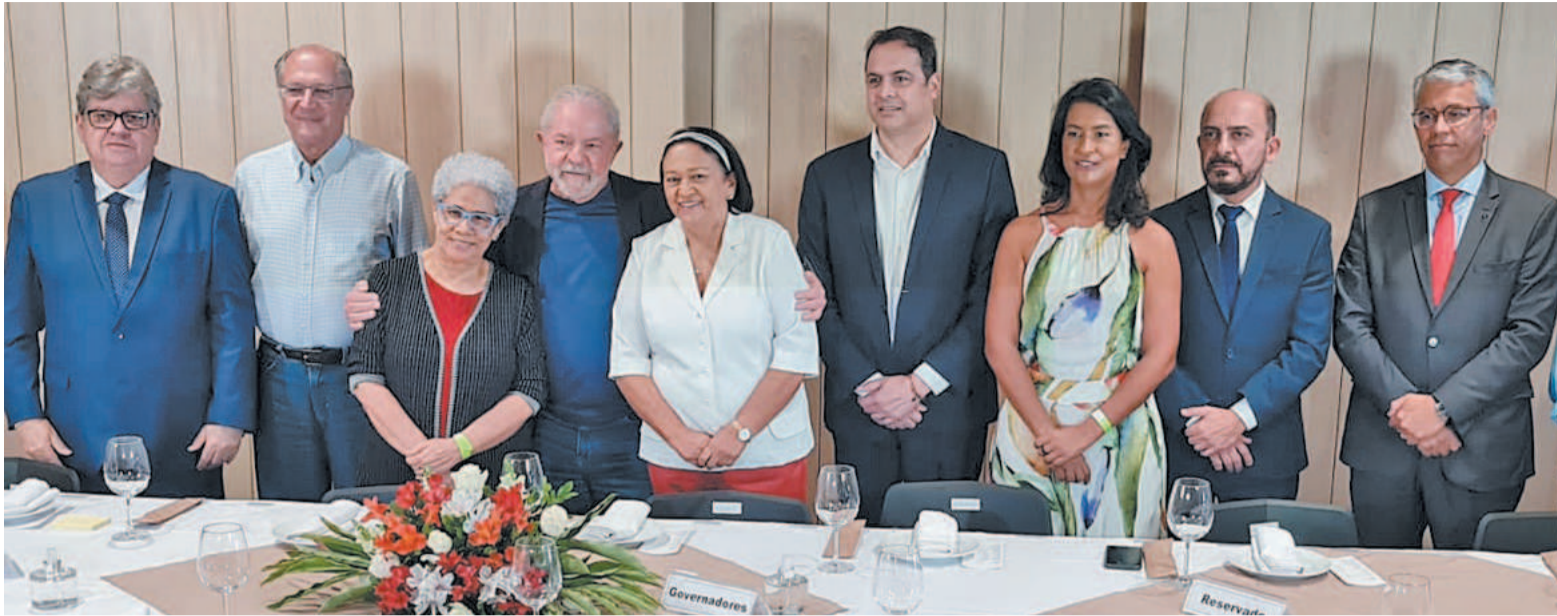
Encontro foi realizado pelo Consórcio Nordeste, presidido por Paulo Câmara, e teve presenças de Lula e Alckmin