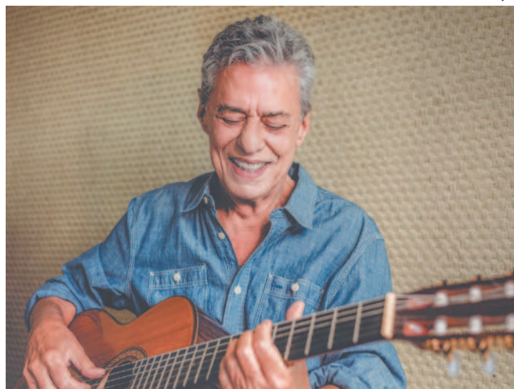
Cantor fala da busca de dias melhores e ambiente solar

Que tal um samba? surgiu depois de anos dedicados à literatura - que resultaram no romance Essa gente e no volume de contos Anos de chumbo . Chico voltou ao instrumento à procura de uma batida diferente e começou a recordar velhos sambas, como Blecaute , Que samba bom , Feitio de oração , entre outros. Fez, dessa forma, uma música