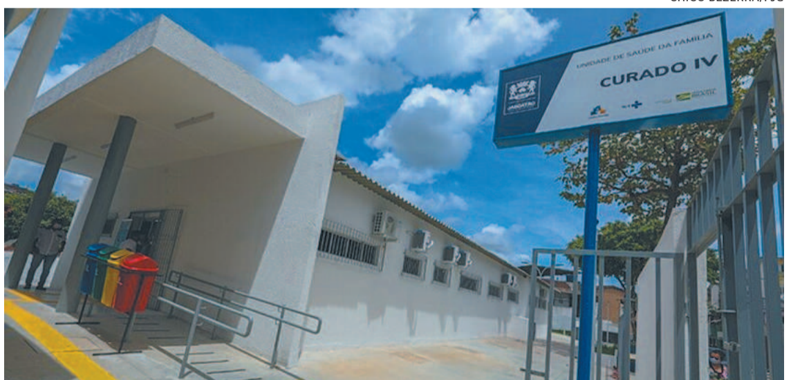
Contratados atuarão em policlinicas, Caps e laboratórios do município do Grande Recife

no Centro de Assistência Psicossocial 24h (Caps), no Centro de Assistência Psicossocial Álcool e Drogas (Caps AD) e nas unidades de saúde. A avaliação dos candidatos será feita pela Agência Brasileira de Desenvolvimento Econômico e Social dos Municípios.