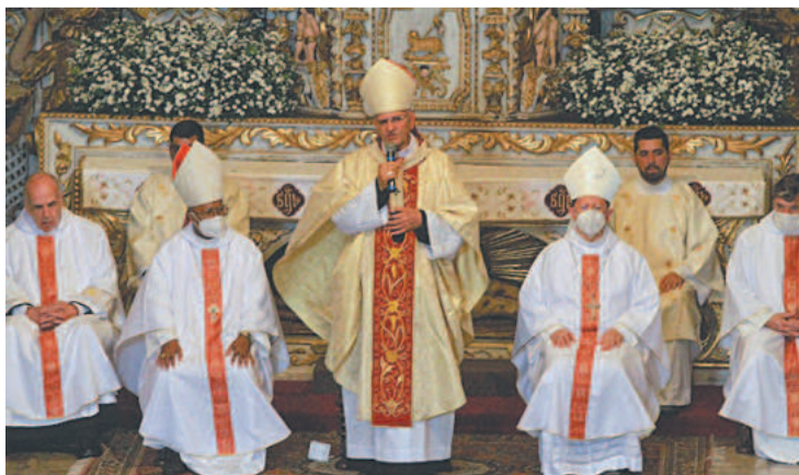
O arcebispo está se despedindo do cargo, aos 75 anos