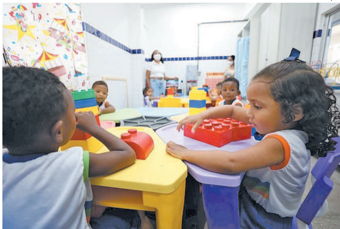
Salário-educação deve gerar R$ 15 bilhões para a educação básica pública neste ano

Os repasses do salário-educação para estados e municípios devem superar R$ 15 bilhões neste ano. Em março, por exemplo, o FNDE distribuiu R$ 1,36 bilhão para estados e municípios, sendo R$ 1,23 bilhão referente a fevereiro e R$ 130 milhões em valores residuais de