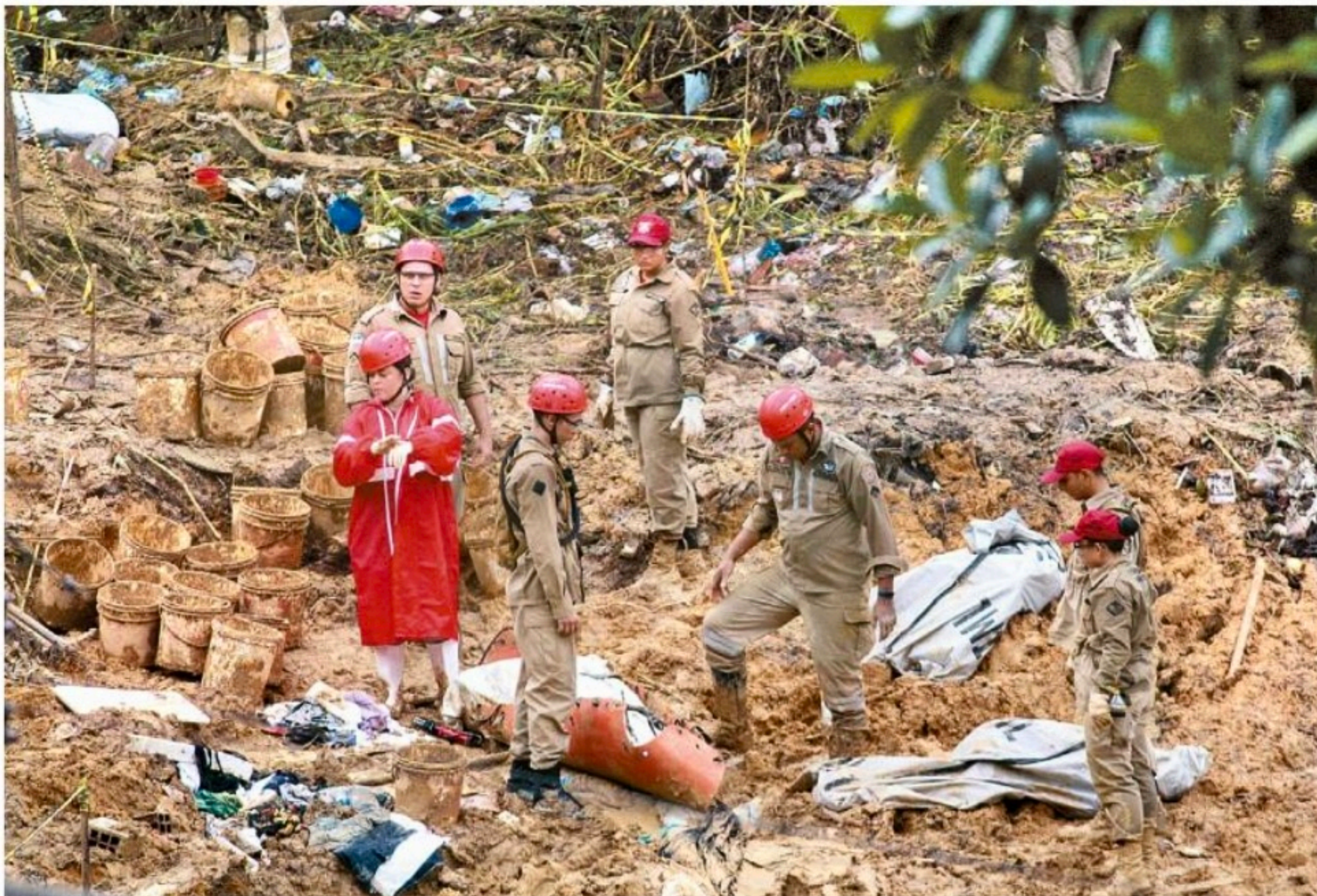
Vila dos Milagres, localizada no Barro, é um dos locais que concentrarão esforços das equipes de buscas