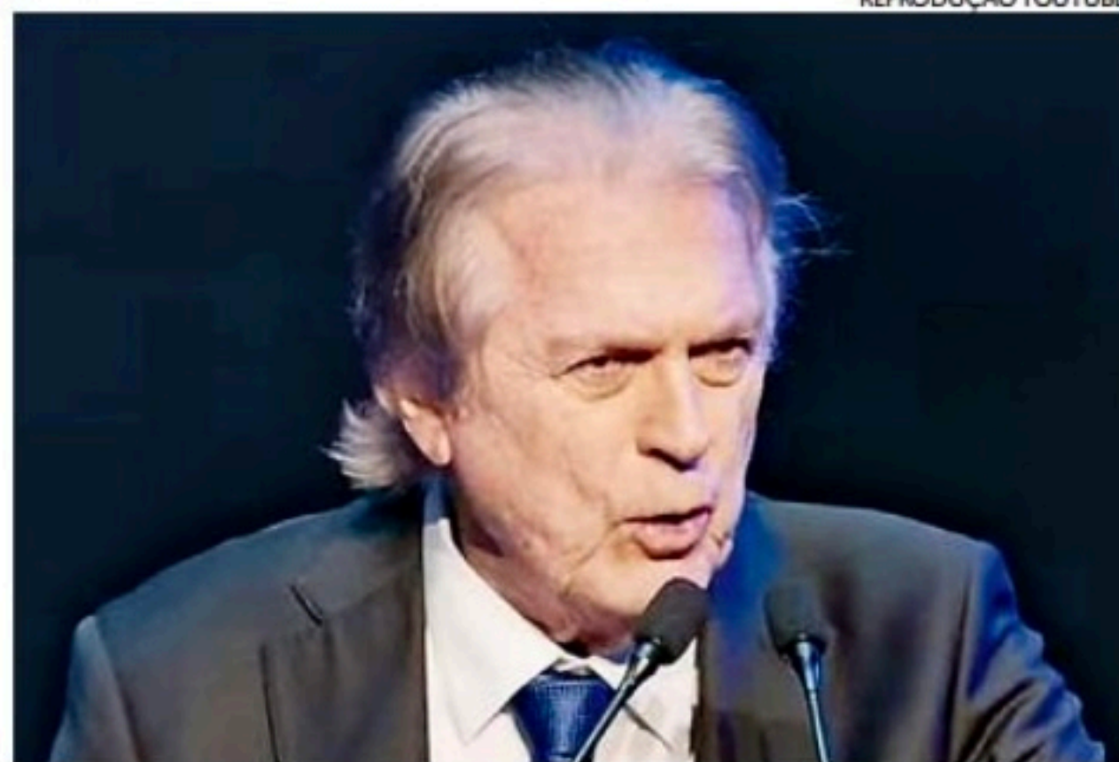
Bivar destacou sua proposta de criação do Imposto Único Federal