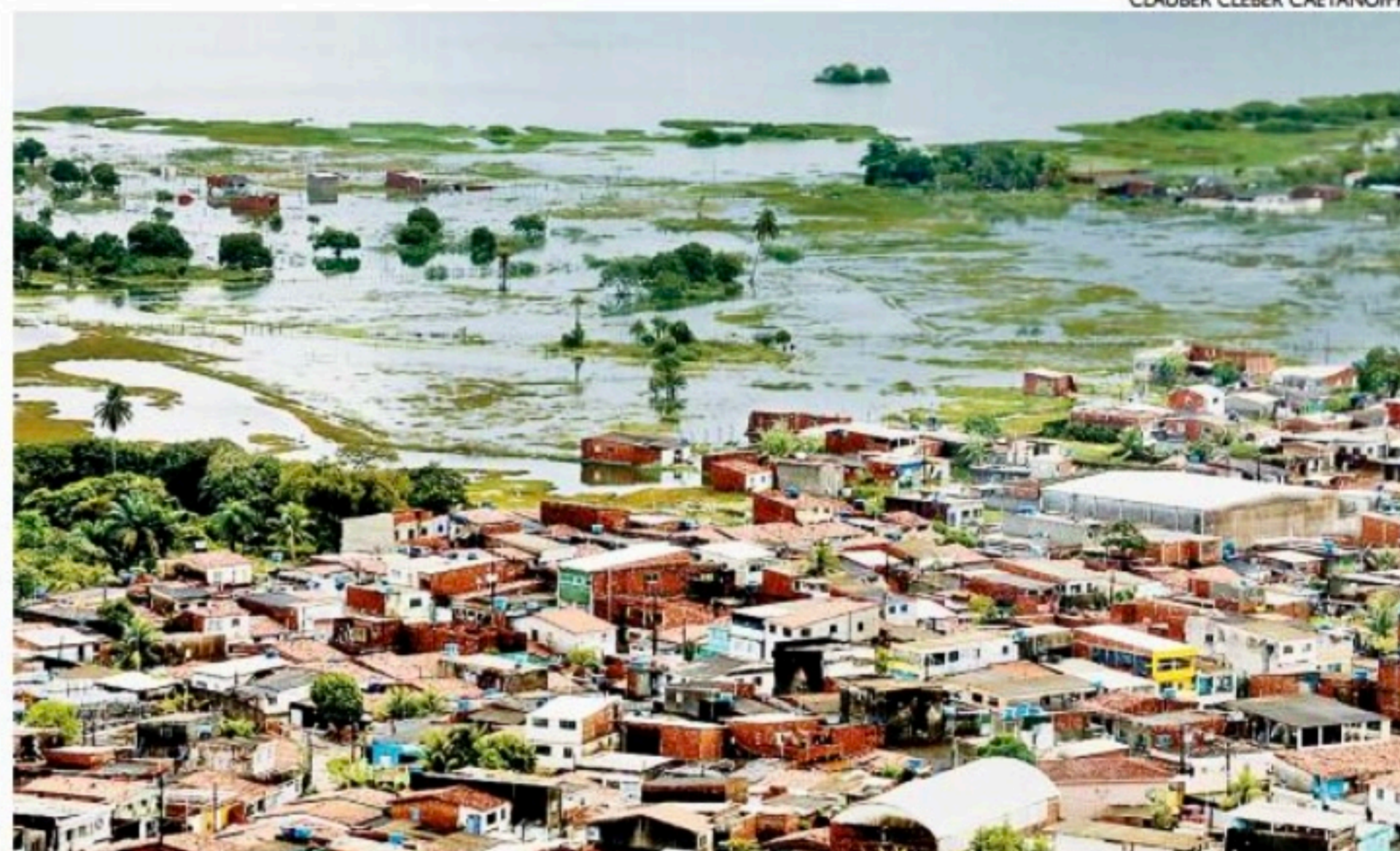
As fortes chuvas provocaram o avanço muito rápido dos rios, que estão com muita vegetação e areia

Um comunicado foi enviado pela Apac para a Codecipe, que é responsável por alertar os municípios. De acordo com a Central de Operações da Codecipe, avisos hidrológicos foram emitidos para os locais.