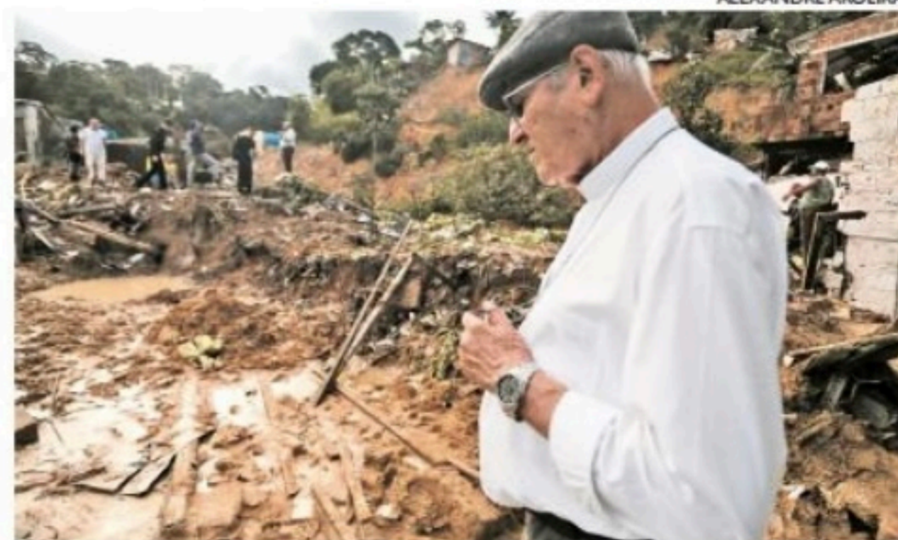
Arcebispo de Olinda e Recife visitou ontem o Jardim Monte Verde

Segundo Saburido, a cerimônia deve ser realizada na igreja de Santa Luzia, que fica perto de um dos locais mais afetados, em Monte Verde. “Vamos rezar com o povo de Deus”