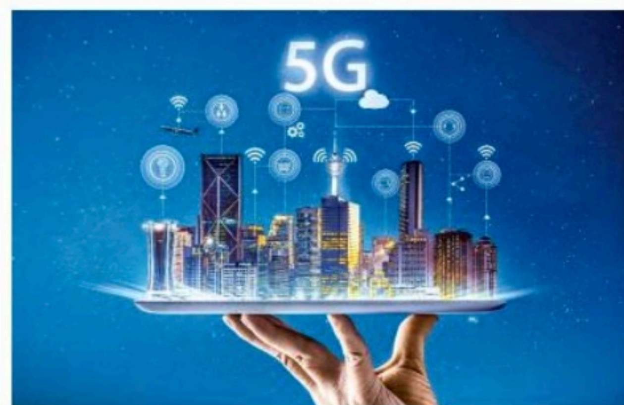
V.tal investiu também em estrutura para a implantação do 5G

"Economicamente é bastante interessante porque o empreendedor consegue iniciar suas vendas em pouco tempo, oferecendo um serviço de banda larga de qualidade", analisa o diretor. Segundo ele, 60% das conexões exis-