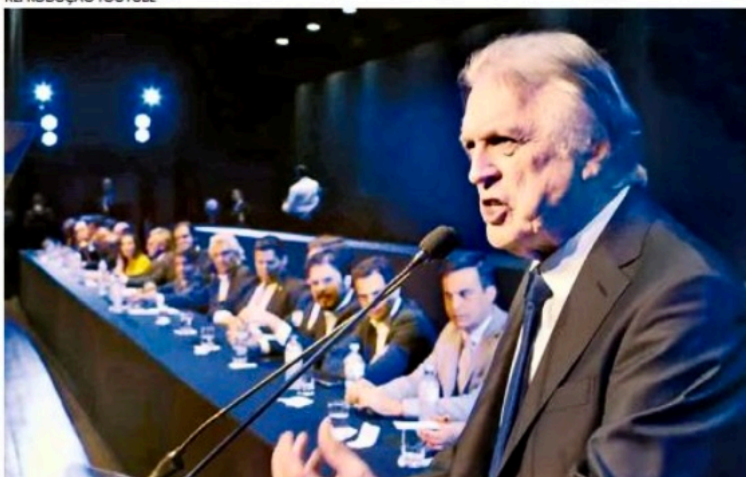
Bivar defendeu a implantação do imposto único em todo o País