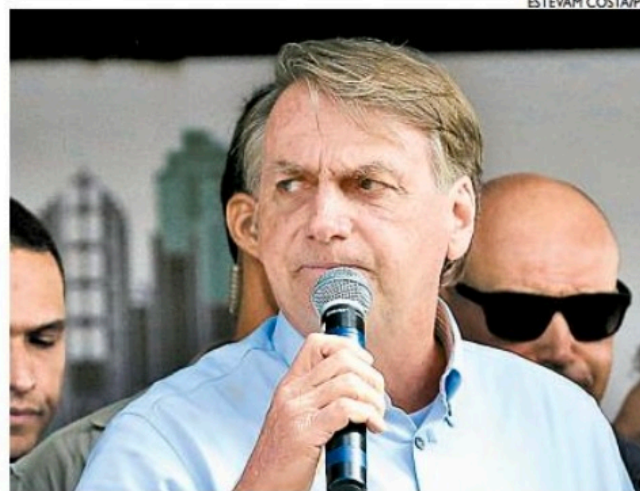
Presidente também defende debate com perguntas pré-acertadas

Questionado pelo apresentador acerca de sua opinião em relação a desistência de João Doria (PSDB) da disputa eleitoral, Bol-