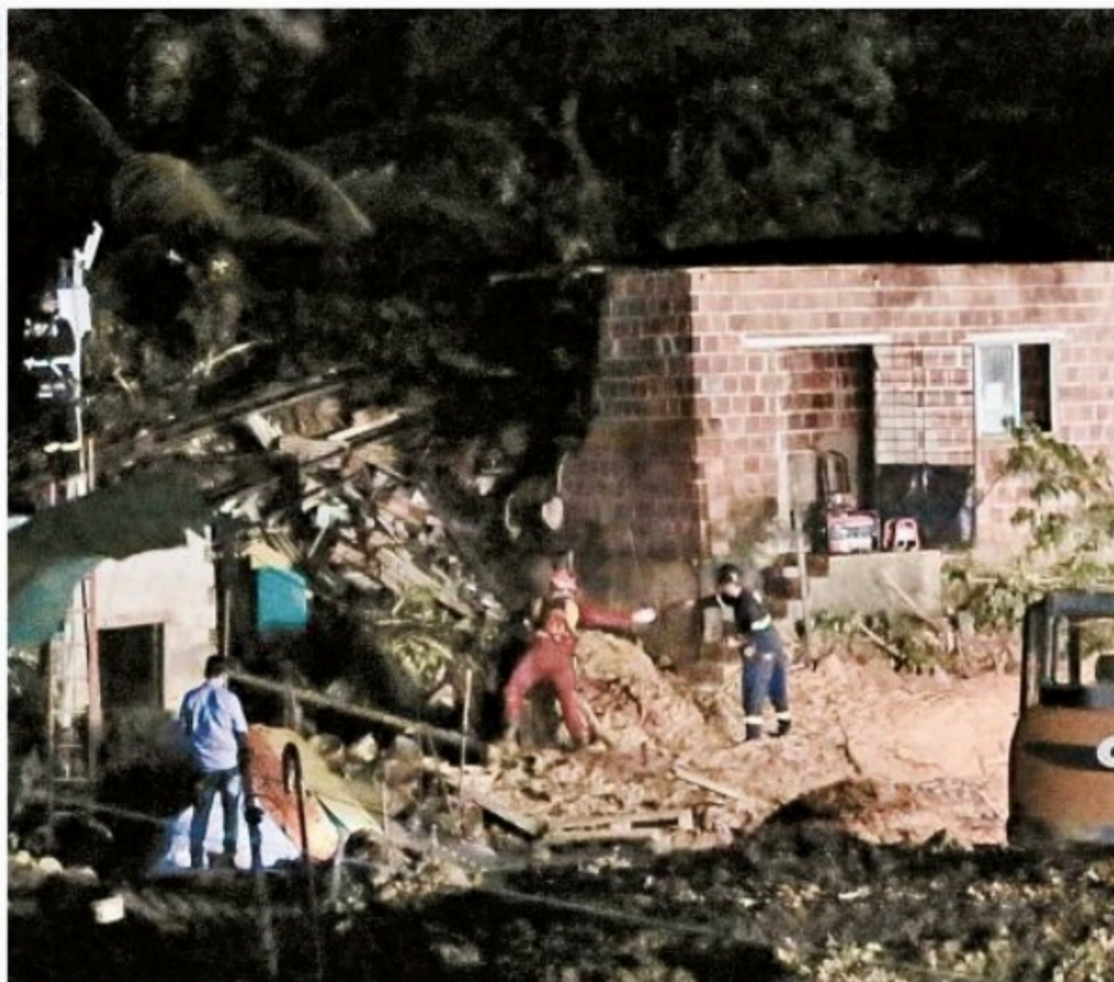
Vila Milagres, localizada no Recife, é área onde ainda concentra desaparecidos. No lugar, vários já perderam a vida após deslizamentos