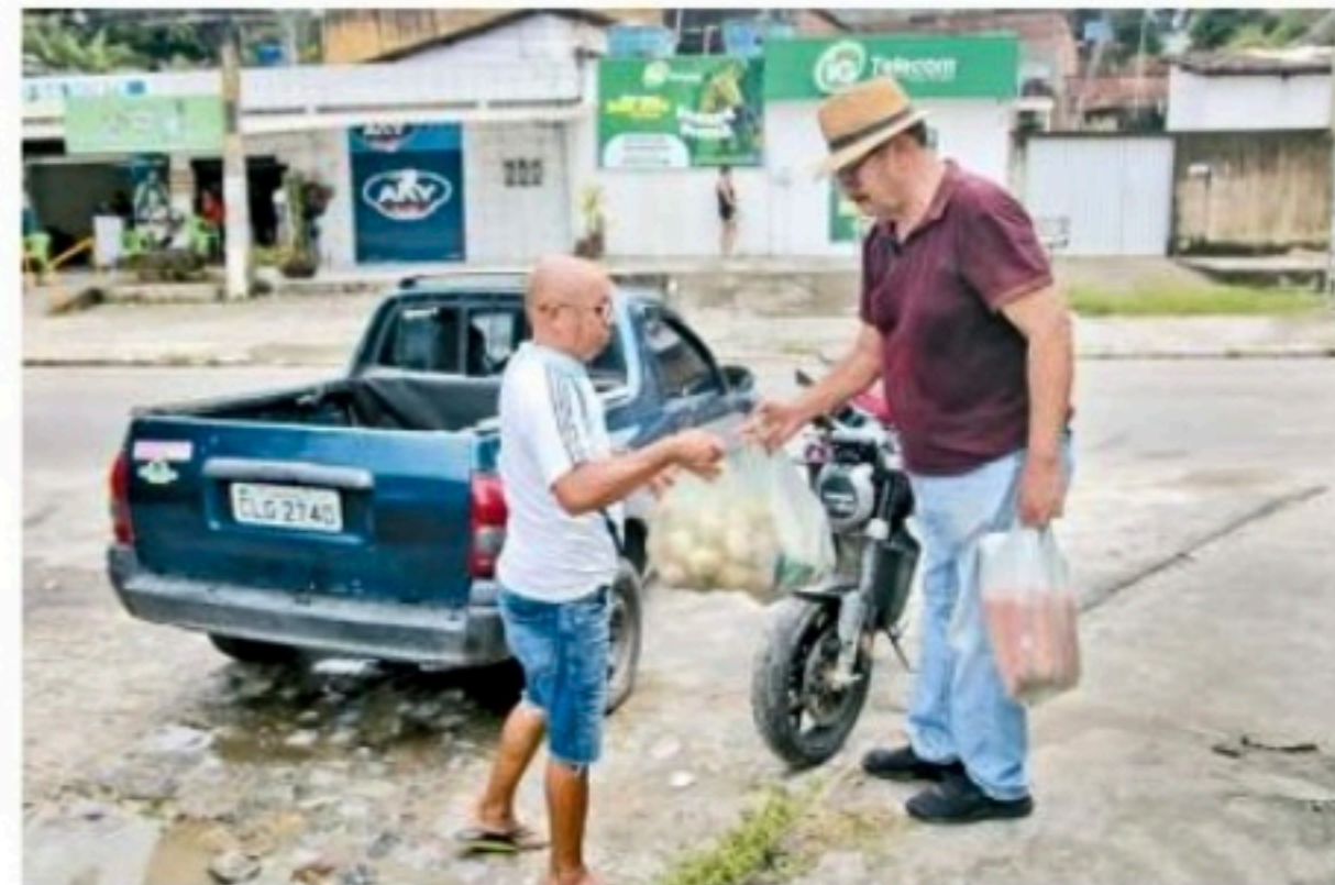
Diversos grupos se juntaram para auxiliar vítimas das chuvas