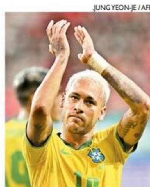
Neymar marcou duas vezes, de pênalti, no triunfo brasileiro

O próximo compromisso do Brasil será contra o Japão, na segunda-feira, às 7h20, no Estádio Nacional de Tóquio. A Copa do Mundo começa no dia 21 de novembro. A Seleção está no Grupo G, ao lado de Sérvia, Suíça e Camarões.