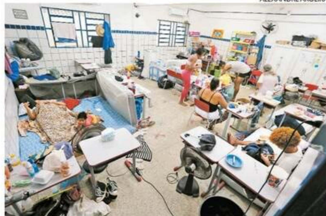
Escola Municipal Diná de Oliveira acolhe cerca de 600 pessoas

abrigos e pontos de apoio, sendo 17 deles escolas e creches do município. Nestes locais há 1.526 pessoas acolhidas e, nas unidades, a Prefeitura oferece suporte para dormida, alimentação, doação de roupas, mantimentos e kits de enxoval, além de assistência social, médica e acolhimento mental. Além disso são oferecidas consultas, aplicação de vacinas, distribuição de receitas e medicamentos, retirada de documentos, recreação infantil e atendimento veterinário.