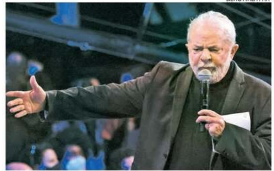
Presidenciável falou em "milicianos" e governante com "um lado obscuro"

"Esse tipo de FakeNews que pode afetar as eleições será coibido? O pré-candidato Lula será preso ou terá futuramente será cassado, na remotíssima hipóte-