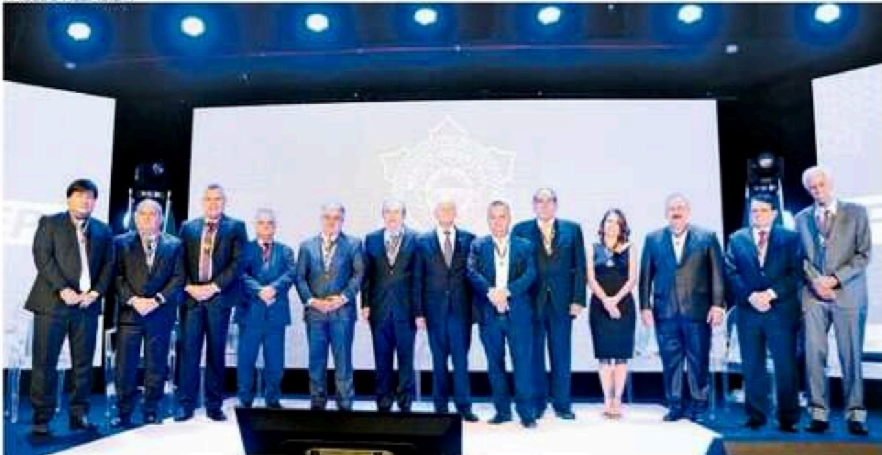
Industriais com foco no meio ambiente e na tecnologia foram homenageados