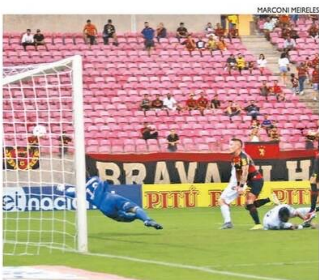
Triunfo na Arena fez Rubro-negro voltar à vice-liderança da Série B

LOTERIAS QUINA 5869 51 56 62 69 74 || LOTO FÁCIL 2537 02 04 05 06 07 09 10 12 14 16 18 19 22 23 24 || TIMEMANIA 1791 03 07 24 28 34 49 58 Time do Coração Sampaio Corrêa/MA DIA DE SORTE 612 04 06 10 16 21 25 29 Mês da sorte: Dezembro DUPLA SENA 2374 1º sorteio: 03 12 15 16 22 30 2º sorteio: 05 08 29 30 33 36 ||