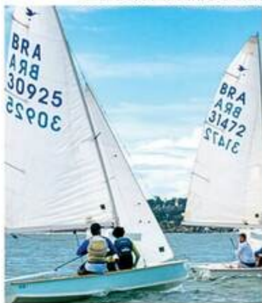
Velejadores se reunirão para a doação de cestas básicas