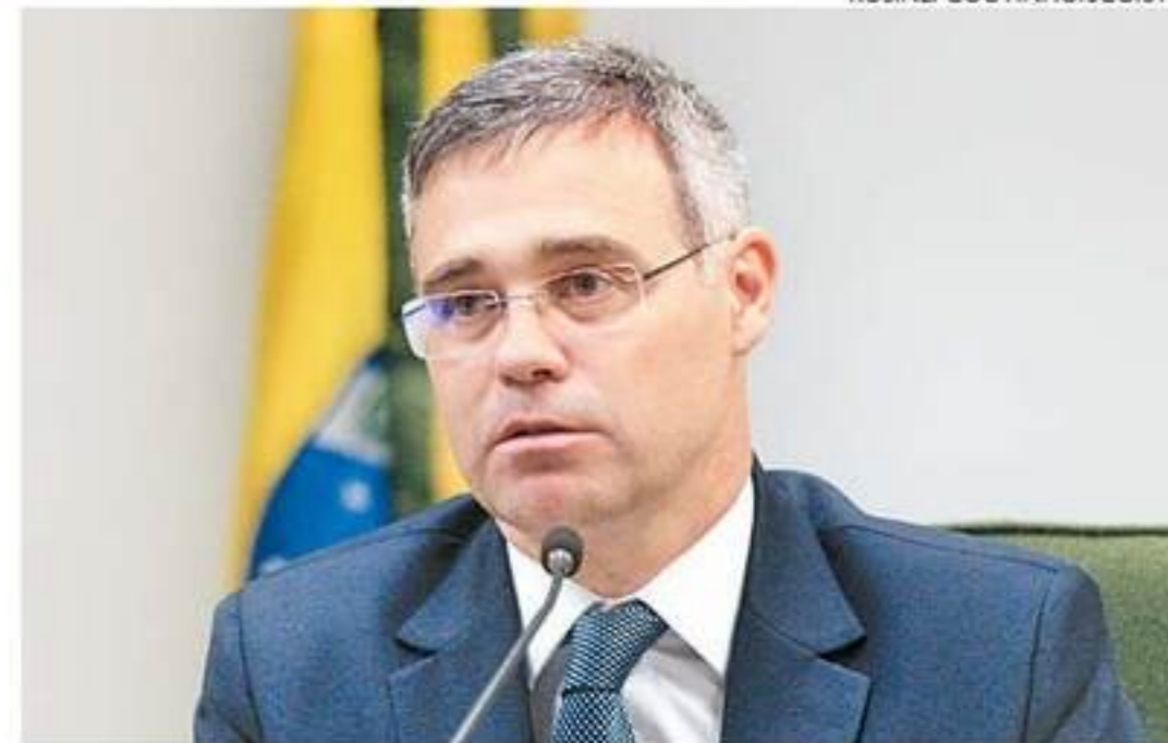
Magistrado decidiu levar ao plenário do Supremo julgamento da ação

O ministro do STF, André Mendonça, resolveu dar um prazo de 10 dias para que o Palácio do Planalto se manifeste sobre o sigilo imposto pelo Governo às visitas dos pastores denunciados por corrupção envolvendo o Ministério da Educação. Indicado pelo presidente Jair Bolsonaro por, entre outros motivos, se enquadrar no perfil de "terrivelmente evangélico", Mendonça também decidiu levar o processo envolvendo o sigilo para o plenário do Supremo.