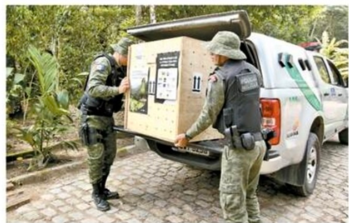
Os papagaios foram trazidos com a ajuda de policiais militares

■ Papagaios ameaçados de extinção resgatados de cativeiros são levados para recuperação no centro de educação ambiental da Usina Utinga