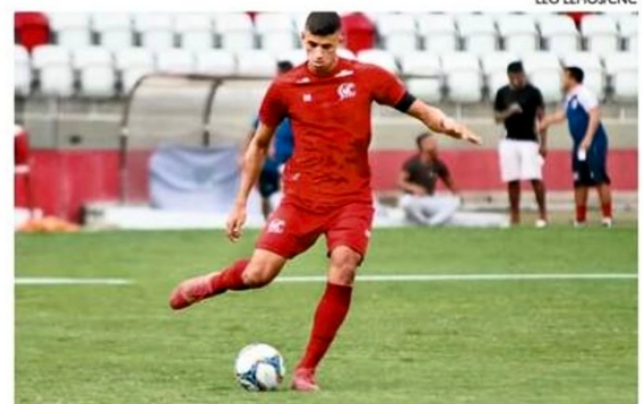
Zagueiro acertou com o Atlético/GO e deve viajar segunda-feira

A punição prevista no Código Brasileiro de Justiça Desportiva (CBJD) por "dar causa ao atraso do início da realização de partida, pro-