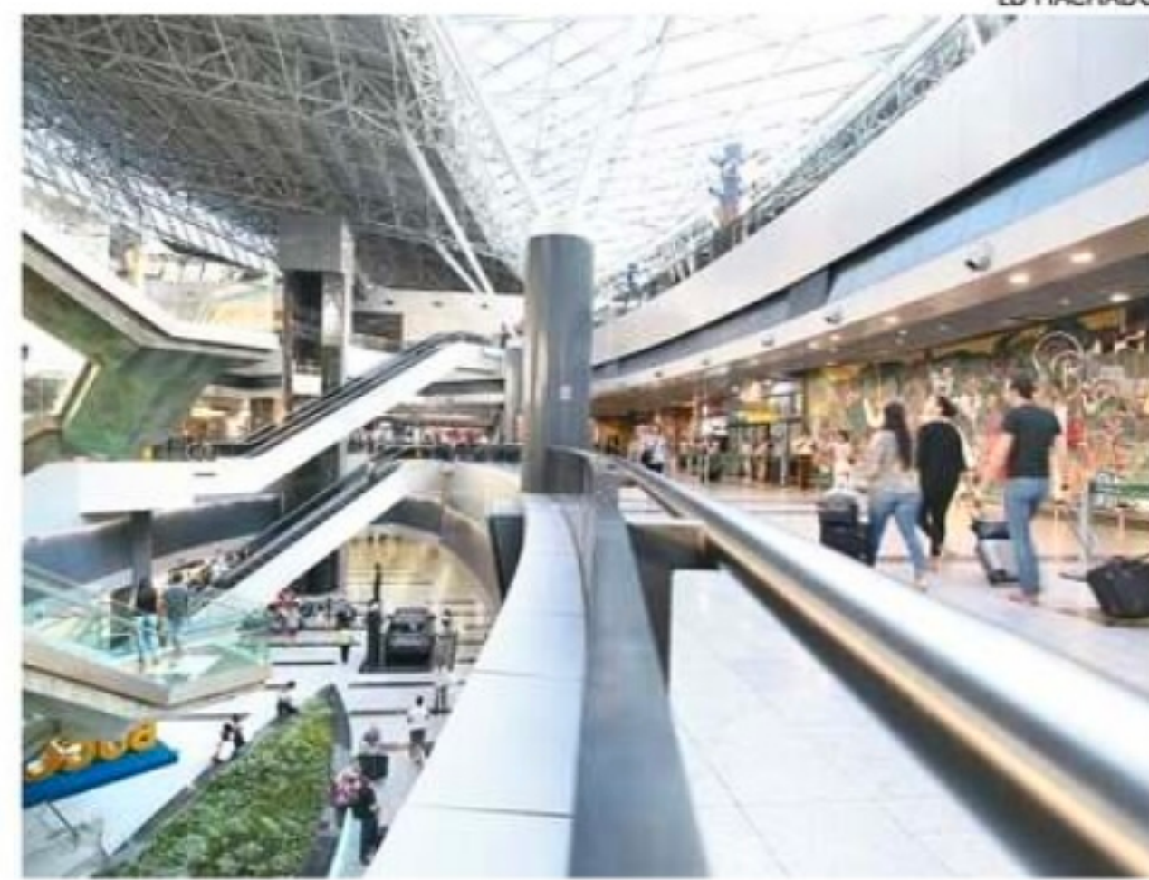
Mudanças ocorrerão devido a obras estruturais no aeroporto

No piso superior, com acesso pela rampa, os carros particulares e os táxis comuns deverão fazer o embarque e desembarque de passageiros próximos das portas B3 e B4. O entorno da porta B5 continua destinada à parada dos veículos por aplicativo.