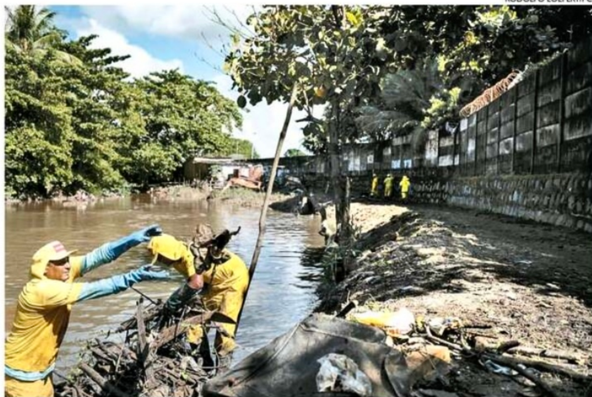
Prefeitura do Recife e Governo do Estado intensificaram a limpeza dos rios e canais no período de chuvas

“Foram mobilizados novamente esses serviços de limpeza de canais e agora com foco em alguns trechos de rios que são importantes para o escoamento da água, como trecho do rio Beberibe, e trecho do rio Tejipió. Desde o início dessa limpeza, já foram retiradas cerca de 350 toneladas de resíduos dessas localidades e espera-se que o número aumente, porque tem uma quantidade de resíduo muito grande para ser retirado”, destacou.