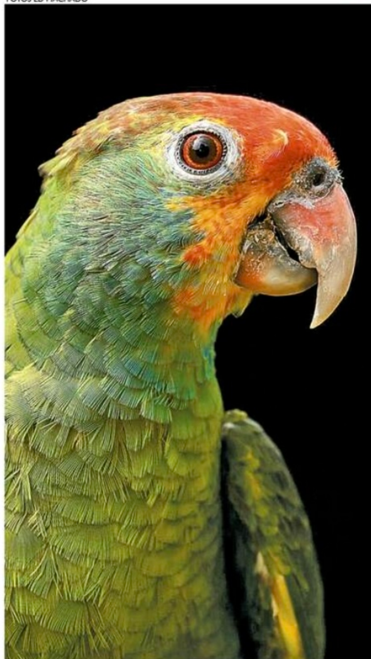
Papagaio-chauá se tornou raro devido às ações predatórias ambientais