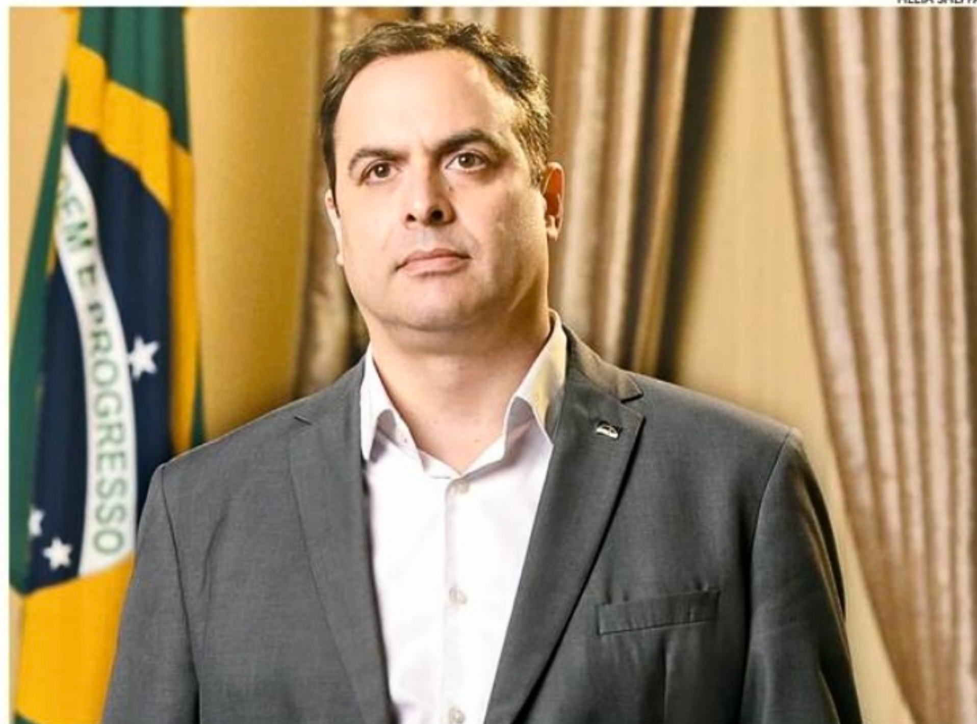
Governador Paulo Câmara agradeceu celeridade da Assembleia Legislativa em aprovar projetos de lei

cimento, disse que o Legislativo ajudou a fortalecer o compromisso com famílias e municípios. Para evitar que governadores e prefeitos vivam recorrendo a projetos em caráter de urgência todas as vezes em que chove, o deputado propõe que a bancada federal comece a pensar em projetos que destinem verba fixa para habitação, como acontece com educação e saúde.