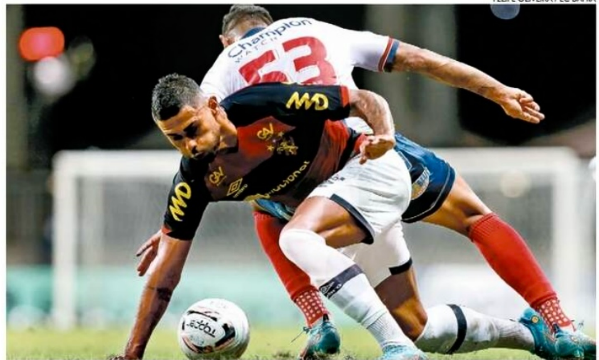
Partida teve ritmo intenso, com boas chances perdidas pelo Sport, principalmente na primeira etapa

números dos últimos encontros com o Bahia ao seu favor. Foram oito vitórias rubro-negras nas últimas dez vezes que ambos duelaram.